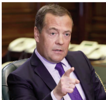
El expresidente ruso Dmitri Medvédev.

El expresidente ruso también criticó directamente a Trump, señalando