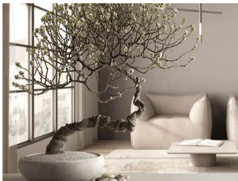
Reorganizar los muebles dentro del hogar es una estrategia efectiva para renovar espacios sin necesidad de adquirir nuevos elementos.

El primer paso para aplicar el Feng Shui es eliminar el exceso de objetos y mantener un espacio limpio. Según esta filosofía, la acumulación de cosas