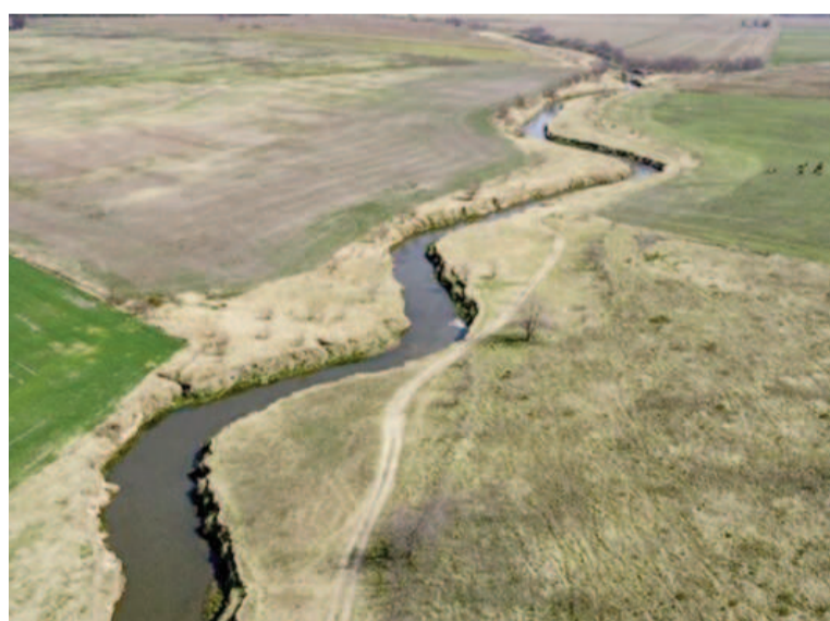
La obra de la represa de regulación del Arroyo Pergamino.

A finales de 2024, en la 17ª sesión del Concejo Deliberante de Pergamino, Silvia Viera, concejal del bloque Unión por la Patria, reveló que los recursos destinados para la construcción de la represa, obtenidos mediante un crédito internacional del Banco Interamericano de Desarrollo (BID), fueron utilizados por el gobernador Axel Kicillof en otras obras en diferentes distritos de la provincia de Buenos Aires. Meses antes, hace un año,