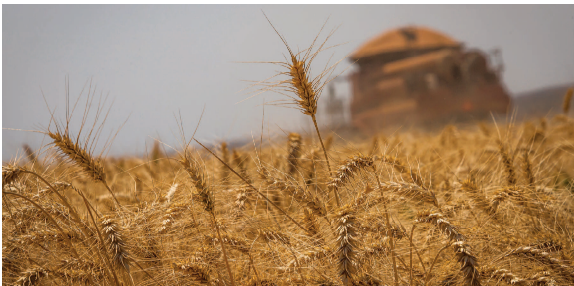
El trigo avanza de forma dispar en la región núcleo; en San Nicolás persisten dificultades por suelos saturados, aunque las reservas hídricas son buenas.

Ante la imposibilidad de avanzar con los ciclos largos -cuya fecha ideal de siembra venció hacia el 20 de junio-, muchos productores están evaluando cambiar a variedades de ciclo más corto. Sin embargo, con-