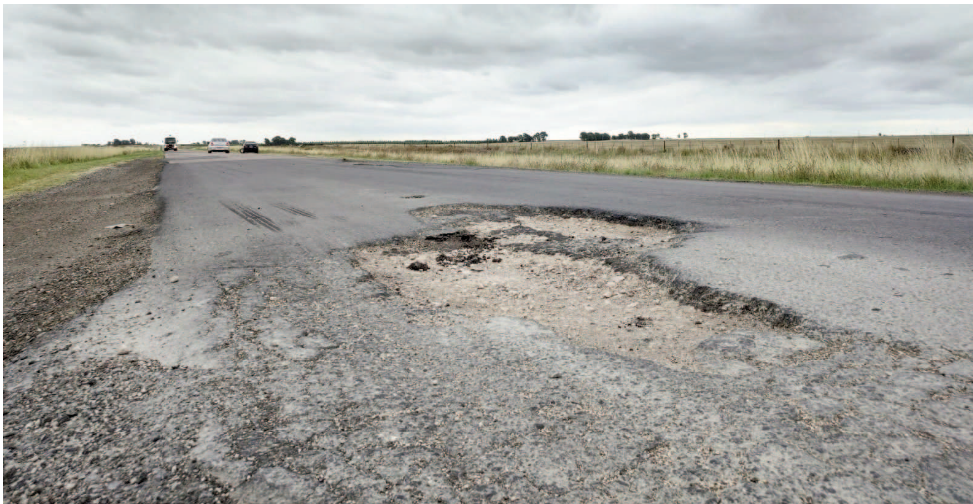
Se multiplicaron las quejas por el mal estado de la Ruta 3, en provincia de Buenos Aires.

De la redacción de EL NORTE redaccion@diarioelnorte.com.ar