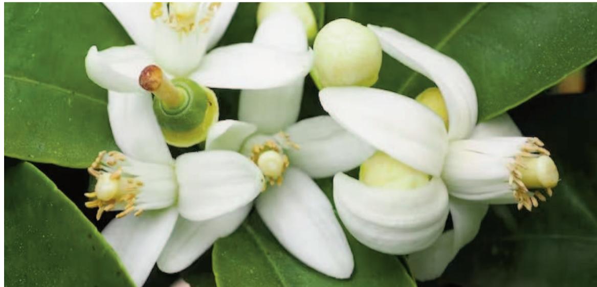
La flor de azahar tiene múltiples propiedades que se pueden aprovechar

El jardinero, leal a su compromiso con la realeza, se negó. Sin embargo, su hija aceptó el soborno