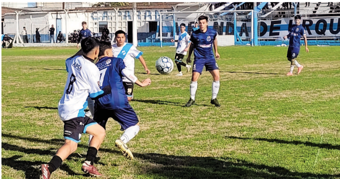
Somisa cosechó una victoria festejada y chocará ante Regatas.