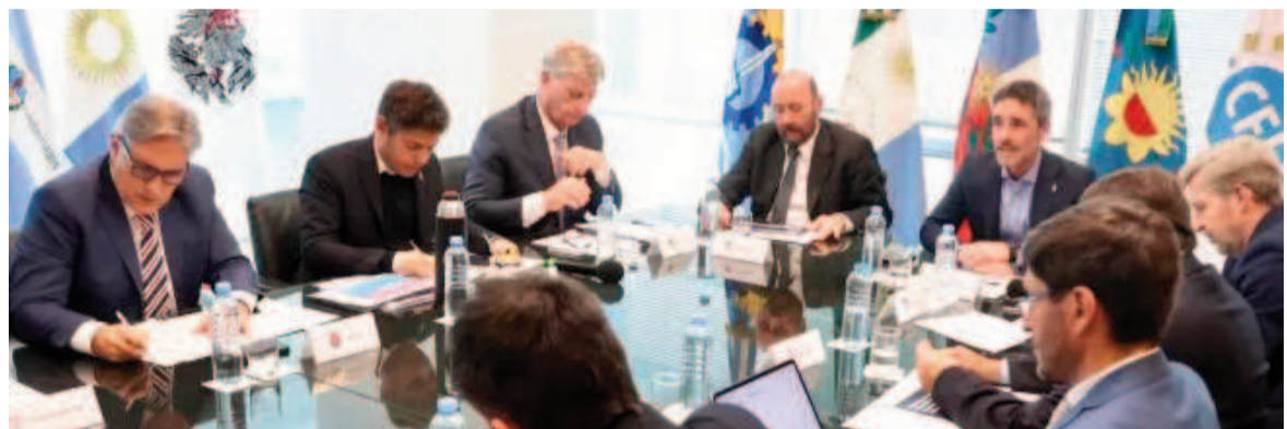
Los gobernadores se reúnen en el CFI.

En la ocasión, los jefes provinciales plantearon una serie de inquietudes transversales. Concretamente, pusieron sobre la mesa la necesidad de que el