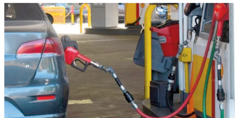
En julio volvería a aumentar el combustible.

Respecto a la relación con los precios internacionales, aclaró que el valor del crudo Brent, uno de los factores clave, viene subiendo. "Pasó de 63 a 77 dólares, aunque hace un año estaba en 84, por lo tanto el aumento no es tan significativo si se mira a largo plazo", señaló.