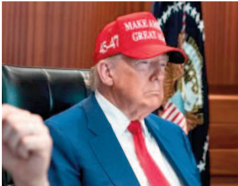
Trump sigue la operación de ataque contra Irán.

El presidente de Estados Unidos Donald Trump abogó ayer domingo por un “cambio de régimen” en Irán para que el país “vuelva a ser grande” en un mensaje en redes sociales. “No es políticamente correcto usar el término Cambio de Régimen, pero si el actual régimen iraní no puede hacer que Irán vuelva a ser grande, ¿por qué no habría un cambio de régimen?”, ha reflexionado el presidente. Trump ha terminado la publicación con el acrónimo en inglés MIGA (Make Irán Great Again, que en español sería: Hagamos Grande a Irán de Nuevo). Los comentarios de Trump han contrastado con los del vicepresidente J.D. Vance y el jefe del Pentágono Pete Hegseth apenas cuatro horas antes. Ambos han pedido a Irán volver a la mesa de negociaciones y abandonar sus ambiciones nucleares.