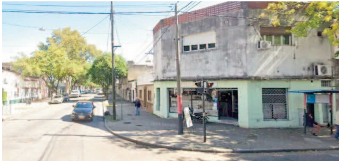
Entre Ríos y Uruguay, donde murió el operario.

El encargado de la obra fue quien aportó los datos de la víctima a las autoridades. El conductor del vehículo fue imputado por homicidio culposo y quedó a disposición de la Justicia.