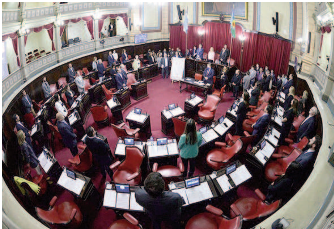
Mañana el Senado tendrá actividad.

La situación de la cobertura de prensa de la sesión no está totalmente aclarada. Es imprescindible