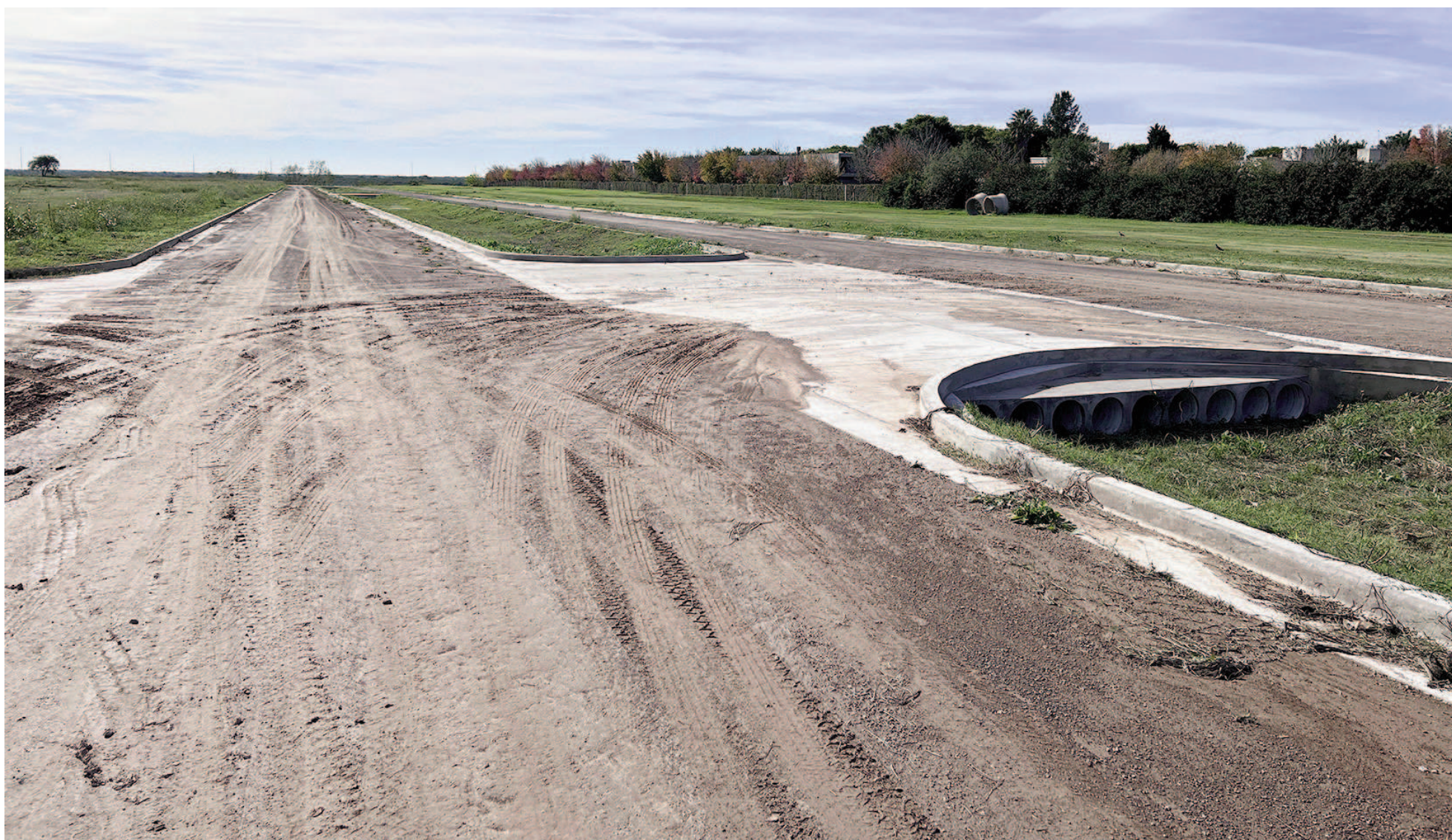
Los trabajos sobre el zanjón Paraguay contemplan el entubamiento de una extensión de más de 450 metros.

La traza del desagüe se extiende por 450 metros entre los barrios Costa Juncal y Automóvil Club y está diseñado para desagotar un importante caudal de agua para brindar alivio hídrico a la zona. La Municipalidad se apronta para la ejecución de la segunda etapa de la obra. Una vez concluidos los trabajos bajo tierra, hay proyectada una amplia avenida que dará un nuevo acceso a Costanera Alta y el Eco Parque.