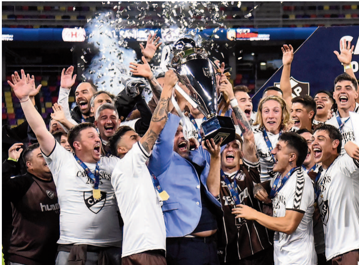
El Calamar impuso su juego en la final y festejó.