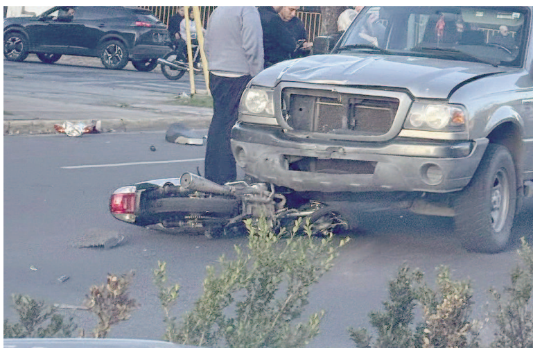
Otro motociclista perdió la vida en la ciudad.

El conductor del rodado menor resultó gravemente herido y fue trasladado de urgencia al Hospital San Felipe, donde fue intervenido quirúrgicamente. A pesar de los incansables esfuerzos del personal médico, el joven perdió la vida horas más tarde. Una vecina de la zona dialogó, en exclusivo, con EL NORTE y comentó lo siguiente: "Los (conductores)