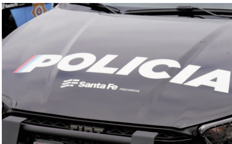
La policía investiga un crimen en Granadero Baigorria.

Un hombre de 49 años fue asesinado el sábado a la noche de un disparo en la cabeza en la zona de calle 21 de Septiembre al 700, de Granadero Baigorria. La víctima fue hallada tendida en la vía pública y sin signos vitales al momento del arribo de los servicios de emergencia. El crimen ocurrió alrededor de las 20.30 de este sábado. Personal del Sistema Integrado de Emergencias Sanitarias (SIES) confirmó el deceso en el lugar, constatando una herida de arma de fuego en el cráneo. La investigación quedó a cargo de la fiscal de Homicidios Dolosos, Georgina Pairola. Horas más tarde, personal de la Po-