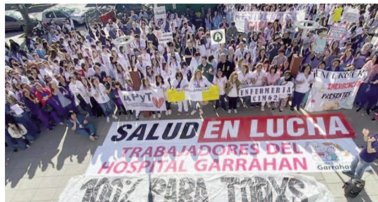
Reclamo salarial en el Hospital Garrahan.

Y aclara el texto: “Este proceso no se limita al Garrahan: en todos los hos-