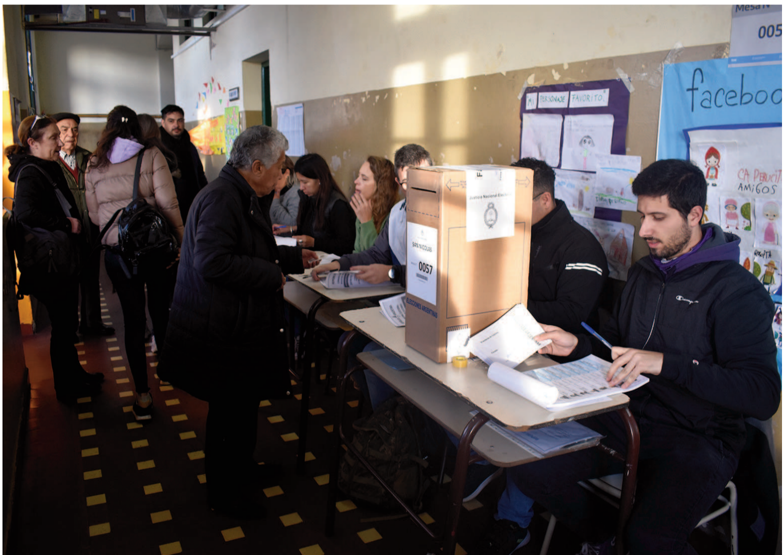
En las más recientes elecciones legislativas, la participación del electorado nicoleño fue del 74,18%: el nivel más bajo de los últimos 25 años.

En la provincia de Buenos Aires las legislativas estarán este año – por primera vez en la historia – separadas de las nacionales. Serán el domingo 7 de septiembre. Ese día los bonaerenses elegirán diputados y senadores nacionales y, además, en cada municipio se votarán concejales y consejeros escolares. El legítimo e incluso obligado interrogante que se plantea tiene que ver con la posibilidad cierta de que esa apatía ciudadana también se traslade al suelo bonaerense, a cada uno de sus 135 distritos. Y, entre ellos, a San Nicolás.