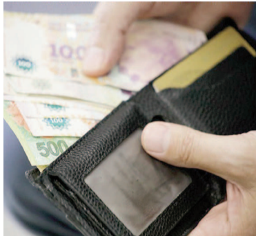
El sueldo pretendido promedio fue de $1.503.863 en marzo.

En cuanto a los sectores, Marketing y Comunicación lideró el incremento acumulado del salario requerido en el segmento junior, con una suba del 21,37%. Le siguieron Producción, Abastecimiento y Lo-