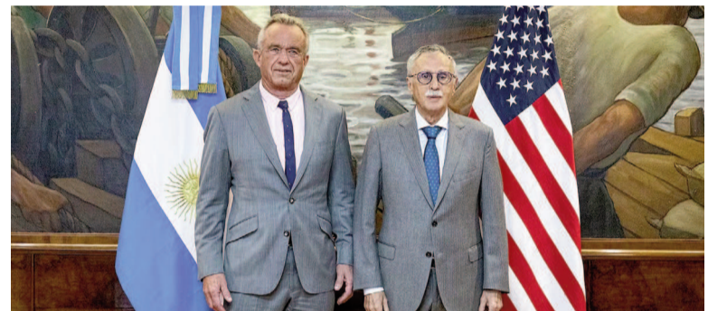
Robert Kennedy Jr. y Mario Lugones.

Le dio un puntaje del 35%, que está por debajo del promedio de América Latina (42%) y de las 10 economías líderes (91%). Destacó además una alta tasa de piratería, deficiencias en la protección de derechos de autor, estándares de patentabilidad desalineados y falta