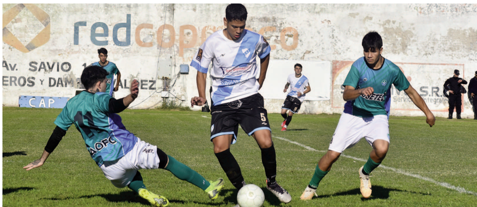
Paraná no pudo con Argentino, pero se mantuvo como único escolta. EL NORTE

Regatas terminará el Apertura como el mejor de todos. Ayer