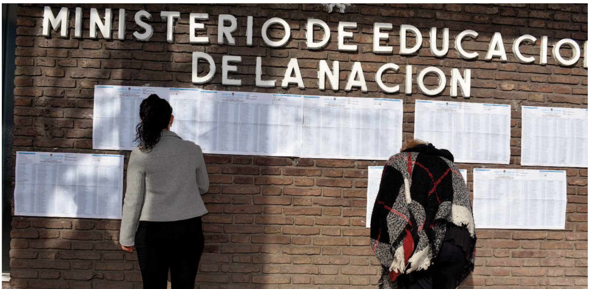
La Justicia Federal definió para San Nicolás un padrón de 129.321 electores nativos, a los que deberán sumarse aquellos extranjeros residentes con derecho a voto.

La Justicia y la Junta Electoral depuran por estas horas el padrón para las venideras elecciones legislativas en la provincia de Buenos Aires. De acuerdo al número oficial que se maneja actualmente, San Nicolás tendrá 129.321 electores nativos. Sumados los extranjeros, los votantes convocados para elegir concejales y consejeros escolares serían algo más de 131.000. El número representa un crecimiento del 1,21% respecto del padrón de la última elección, celebrada dos años atrás. Y del 44% en comparación con los 90.900 electores registrados 30 años atrás, en los comicios de 1995.