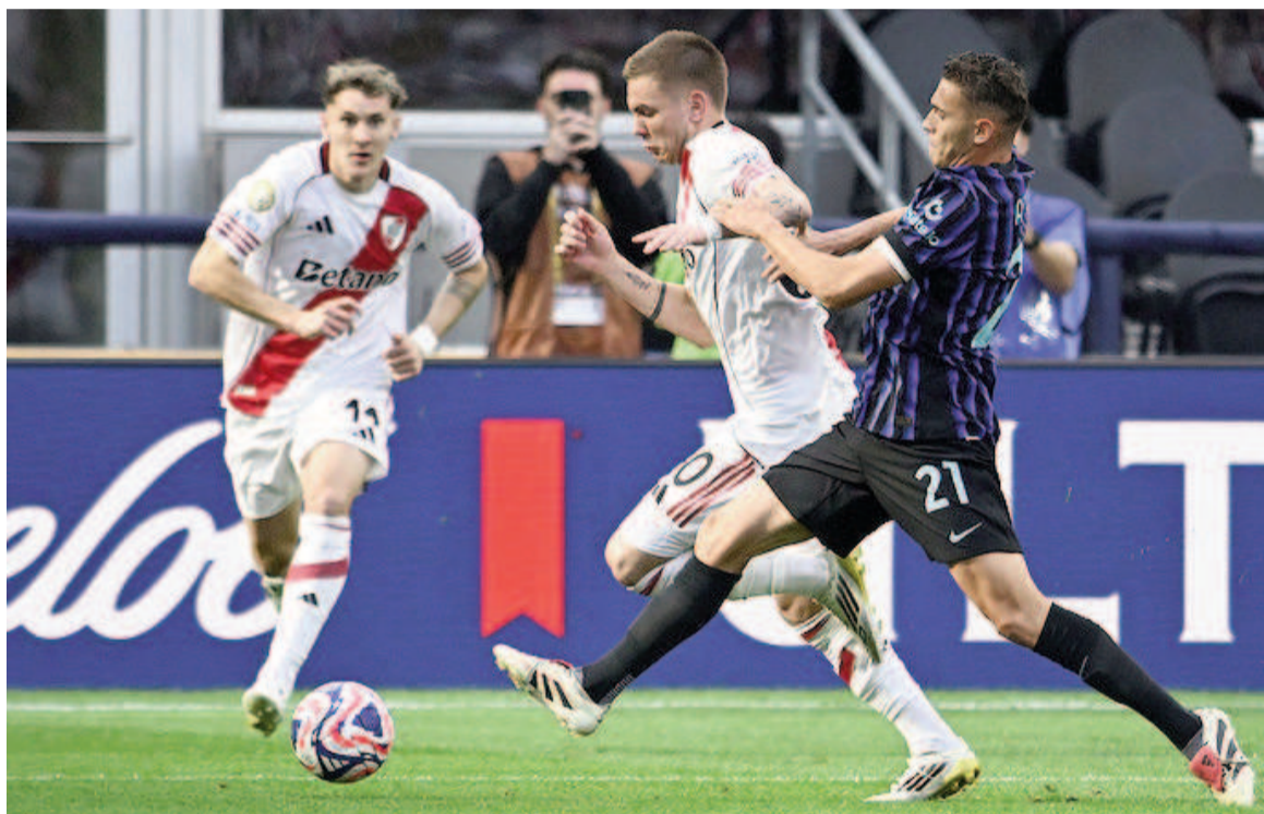
El Millonario cayó sin atenuantes ante el conjunto lombardo.

El equipo de Gallardo cayó por 2 a 0 ante el conjunto italiano y se despidió del certamen. Volvió a carecer de peso ofensivo, y apenas tuvo una opción clara para convertir. Los defensores Martínez Quarta y Montiel fueron expulsados.