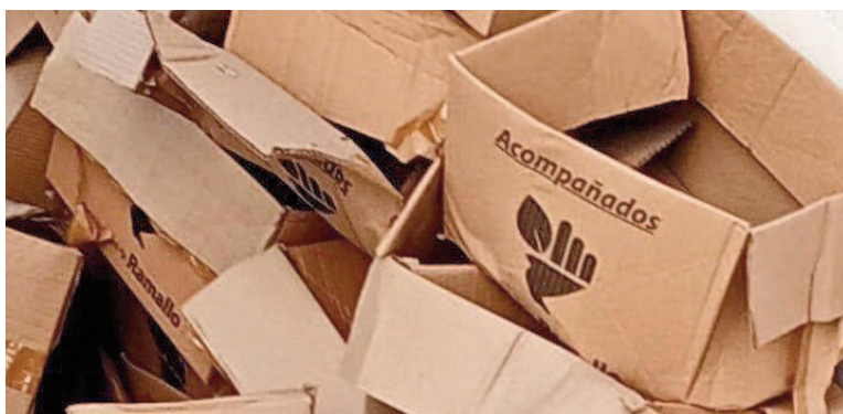
Las cajas están tiradas afuera de la Oficina de Desarrollo de la Comunidad.