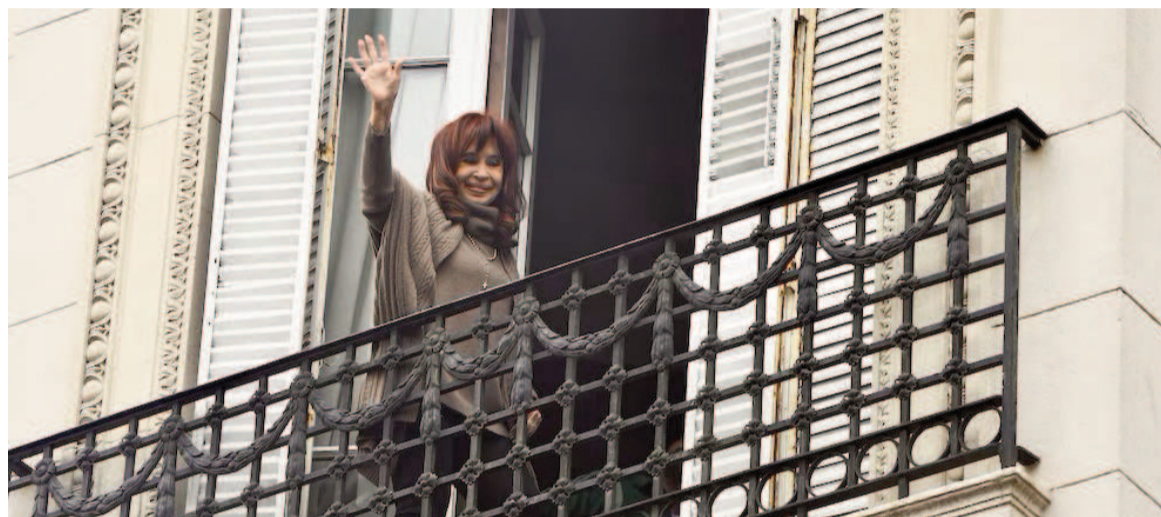
La exmandataria cumplirá una pena de seis años en su propiedad del barrio de Monserrat.