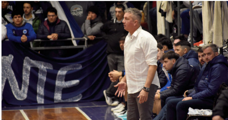
El DT somisero hizo un balance de la Liga que pasó y ya piensa en lo que viene.