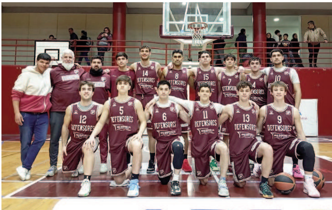
Defensores viene de eliminar a Sacachispas y hoy visitará a Somisa.