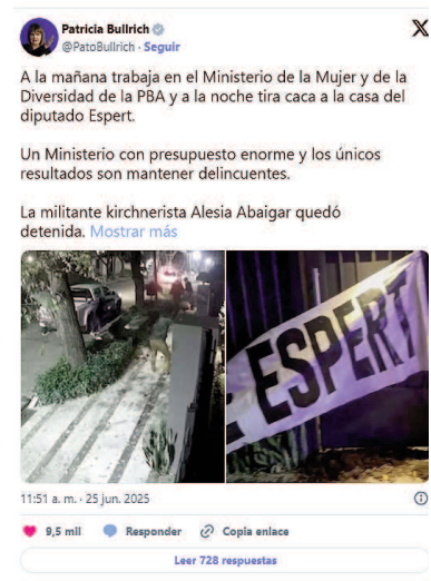
El posteo en X de Patricia Bullrich

Bullrich compartió imágenes del "escrache" ocurrido el lunes 16 de este mes en el domicilio de Espert en San