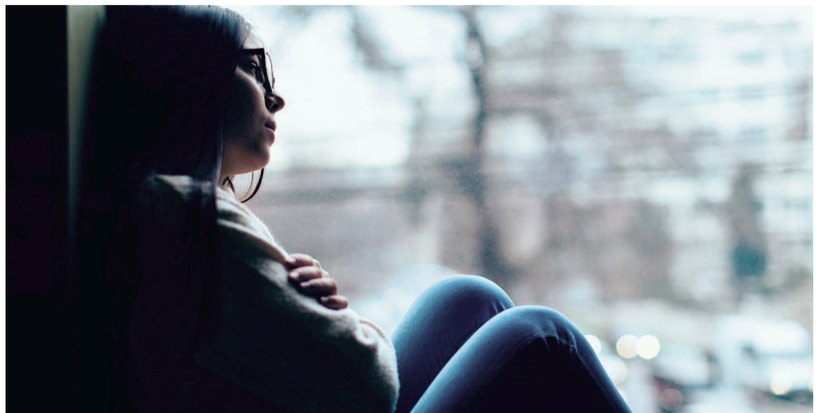
El trastorno afectivo estacional es una forma de depresión vinculada a la reducción de luz natural en ciertas épocas del año.

De acuerdo a NIMH, la exposición solar incide en la producción de serotonina, una sustancia clave para el estado de ánimo. En invierno, la reducción de luz natural puede alterar