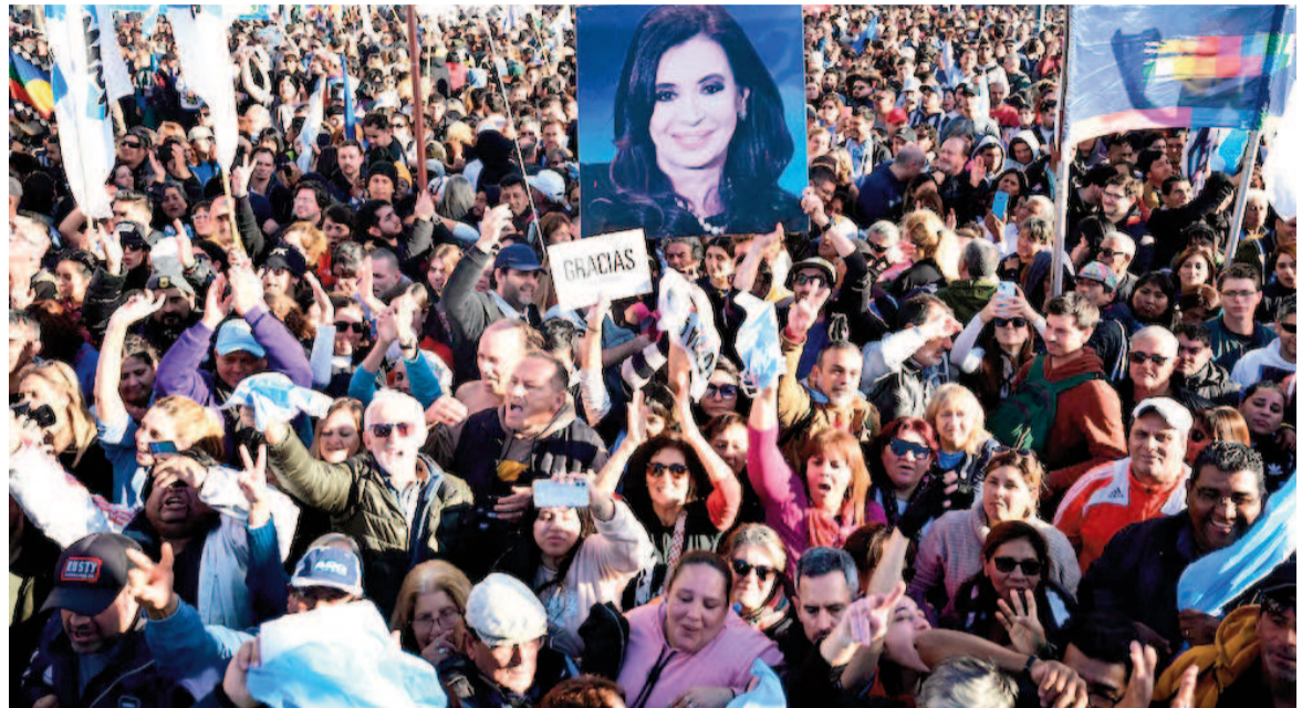
La expresidenta grabó un mensaje que fue reproducido para la multitud que se juntó en la Plaza de Mayo.

“Vamos a volver con más sabiduría, unidad y fuerza, y desde donde me toque estar, desde la trinchera que sea, voy a seguir haciendo todo lo que esté a mi alcance para estar ahí con ustedes. Porque tenemos algo que ellos jamás van a tener ni van a poder comprar por más plata que tengan: pueblo, memoria, historia