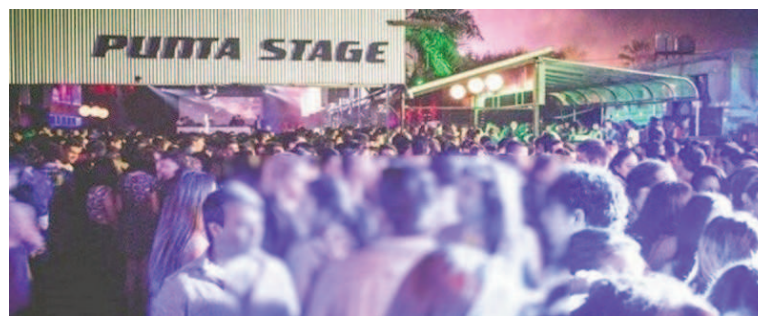
El boliche, centro de la tragedia.