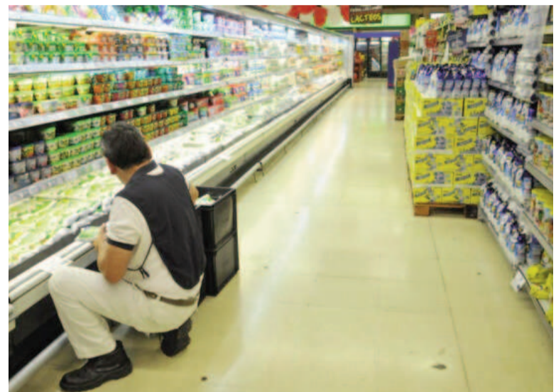
Las ventas en supermercados, según el Indec, aumentaron.

el personal ocupado en supermercados fue de 98.906 personas, con una leve baja interanual del 0,4%. El salario bruto promedio fue de $ 3.386.700 para el personal jerárquico y de $ 1.297.739 para cajeros, administrativos y reposidores.