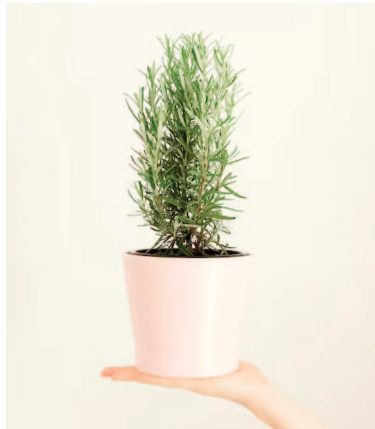
El romero tiene propiedades antioxidantes y antiinflamatorias.

La mejor forma de aprovechar los aspectos positivos del romero