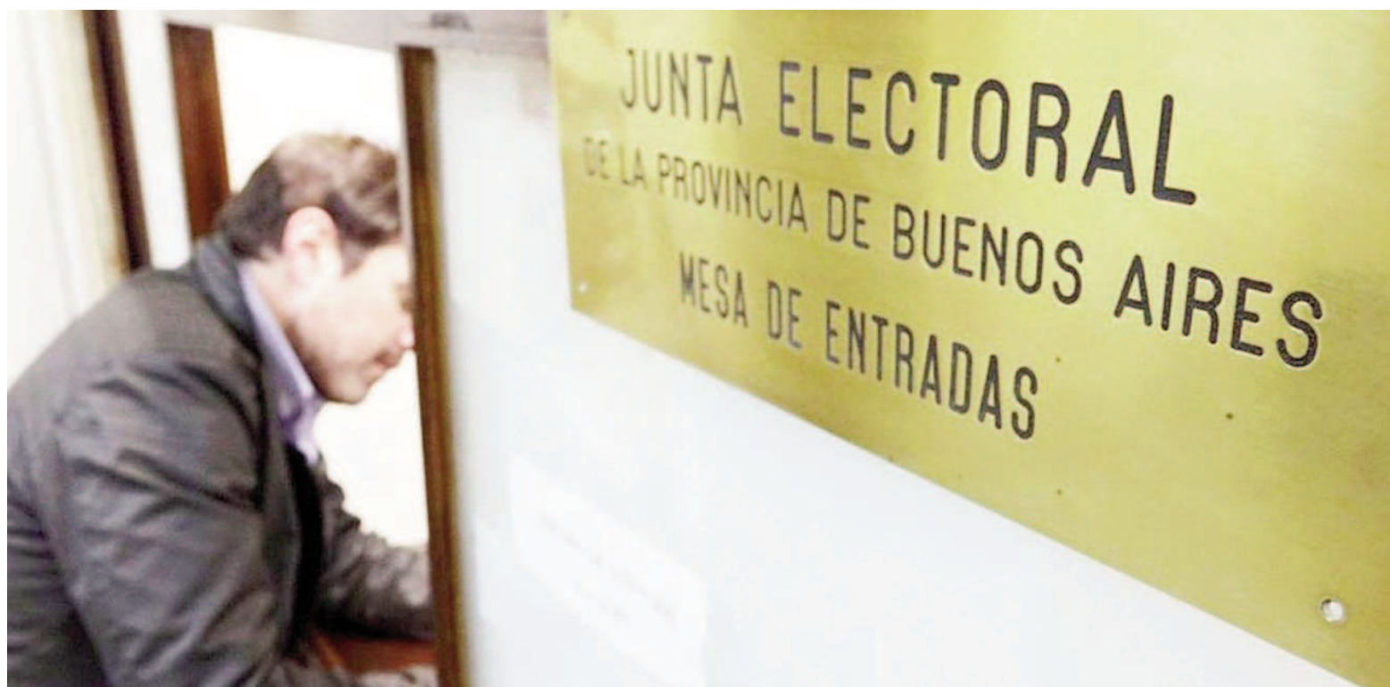
Antes de la medianoche del 19 de julio, todas las listas de candidatos deberán ser presentadas ante la Junta Electoral bonaerense: hoy falta un mes.

Los primeros no zanján las diferencias entre esos dos polos que son Axel Kicillof y Cristina Fernández de Kirchner. Y aunque la reacción fue unánime en el rechazo a la condena a la ex Presidenta de la Nación, eso