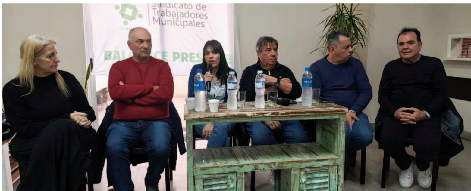
Municipales bonaerenses en alerta por salarios de indigencia.

La pérdida del poder adquisitivo se profundiza con la inflación acumulada del 43,5% interanual y un 13,3% en lo que va del año, pese a la leve desaceleración mensual. "Los salarios continúan