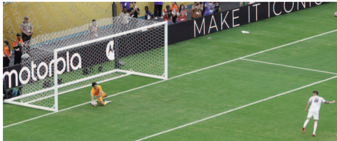
El marroquí Bono le ataja el penal del triunfo al uruguayo Valverde.

El Merengue, que tuvo a Xabi Alonso como DT, igualó 1 a 1 ante el equipo de Arabia Saudita en su debut. El uruguayo Valverde falló un penal en la agonía del partido.