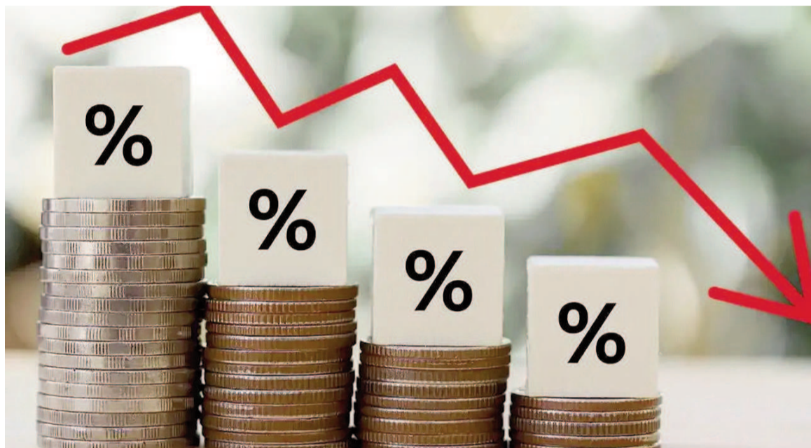
Indec anunciaría una baja importante de la inflación de mayo.

El Relevamiento de Expectativas de Mercado (REM), que elabora el Banco