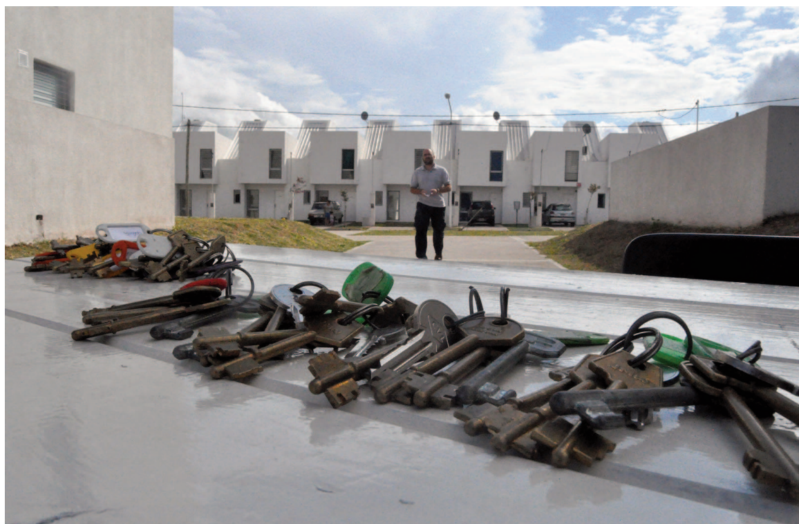
Construidas desde 2012 y entregadas a partir de fines de 2016, las casas de Ayres del Sur se vendieron con créditos a 20 y 30 años.

En los considerandos de la medida, se refieren a informes de la Sindicatura General de la Nación (SIGEN) que detectaron “demoras en la entrega de viviendas, falta de condiciones de habitabilidad en unidades adjudicadas, desac-