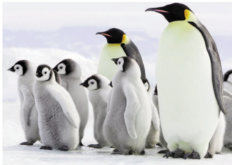
El estudio satelital revela una caída del 22% en la población de pingüinos emperador en la Antártida.

en monitoreo de fauna antártica desde el espacio en el BAS. Este hallazgo, que surge de la revisión de datos entre 2009 y 2024, sitúa la pérdida de ejemplares en un 22% en las colonias estudiadas, una cifra que supera ampliamente las proyecciones anteriores y plantea dudas sobre la capacidad de los modelos actuales para anticipar el futuro de la especie. El área analizada comprende la península Antártica, el mar de Weddell y el mar de Bellingshausen, lo que representa aproximadamente el 30% de la población mundial de pingüinos emperador. Aunque este universo no abarca la totalidad del hábitat de la especie, los expertos consideran que las colonias seleccionadas son representativas del resto del continente. El uso de tecnología satelital ha permitido a los investigadores estimar el número de ejemplares en regiones remotas y de difícil acceso, lo que proporciona una visión actualizada y relativamente precisa del estado de la población. El método satelital, aunque no permite observar cada individuo con exactitud, se ha consolidado como la herramienta más confiable para el monitoreo de especies en el entorno antártico. El descenso del 22% en la población de pingüinos emperador en solo 15 años contrasta con el 9,5% registrado entre 2009 y 2018 en estudios previos que abarcaban todo el continente. Esta ace-