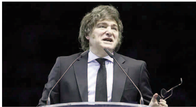
Frente a los bloqueos, la oposición va por el juicio político contra Milei.