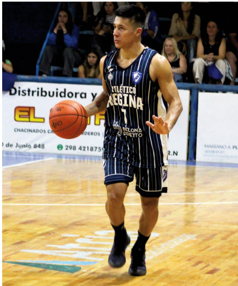
Leal es el base y el principal goleador de Regina.

En la fase regular el Albo tuvo un desempeño con altibajos, con seis