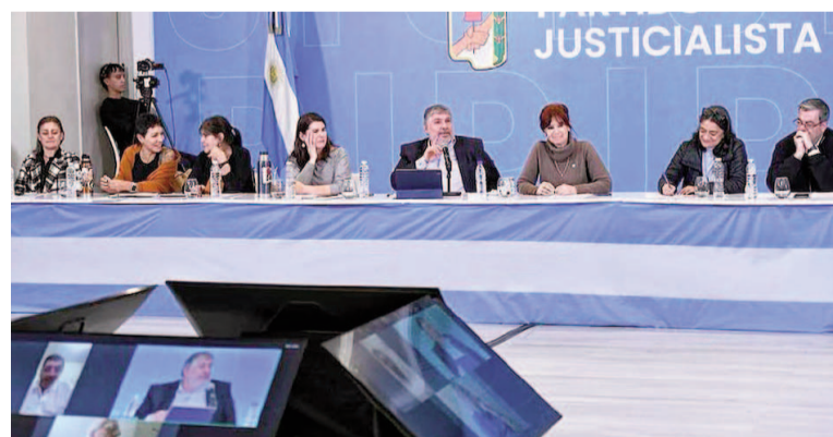
Cristina Kirchner durante uno de los últimos encuentros en la sede del PJ Nacional.