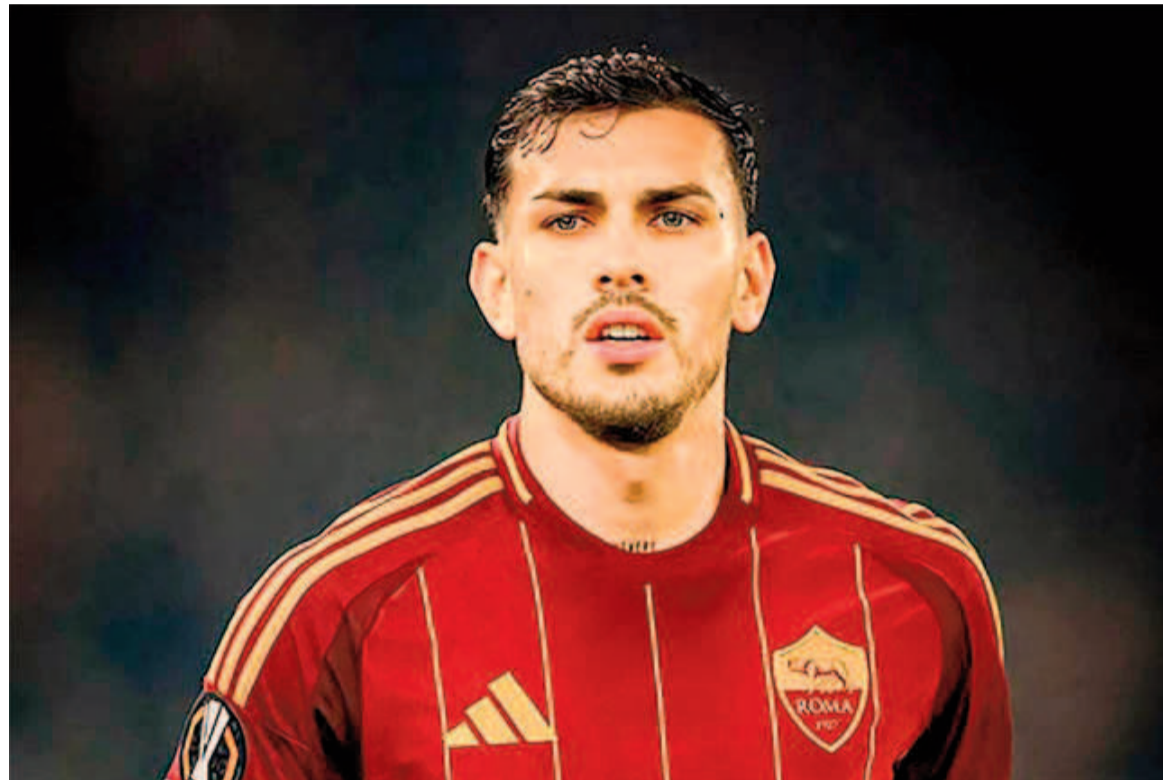
Leandro Paredes y su posible llegada a Boca. WEB

El mediocampista de la Roma, que jugó el martes ante la Selección colombiana, habló sobre su posible regreso al club de La Ribera.