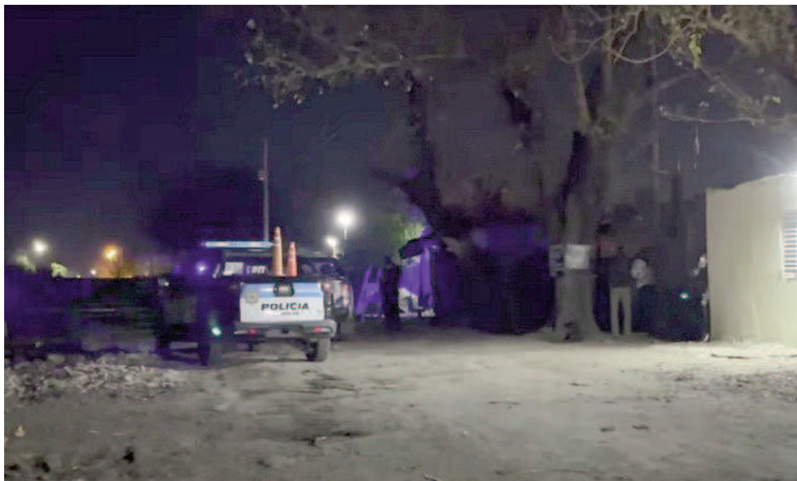
La policía en el crimen de barrio Godoy ayer a la noche.

La pequeña fue trasladada de inmediato para atención médica con algunos golpes producto de la caída, aunque no heridas de arma de fuego.