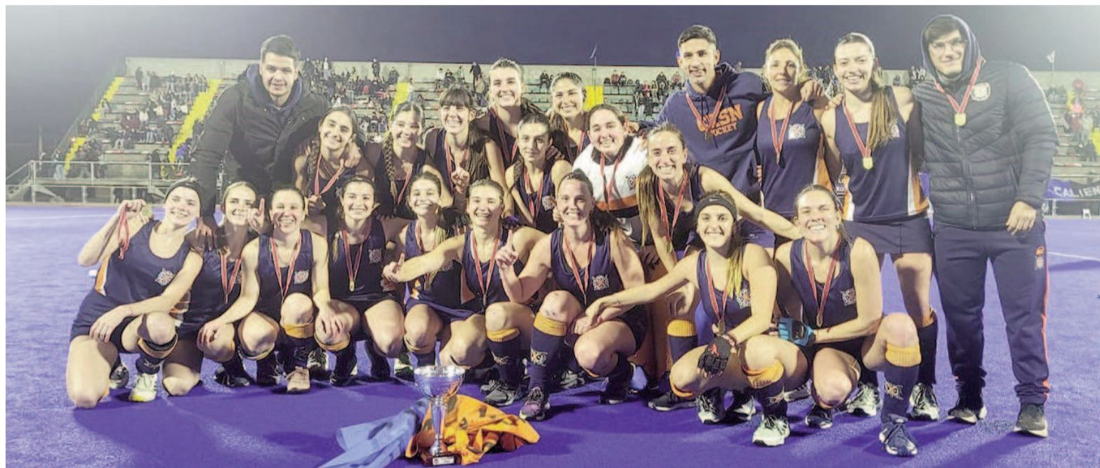
Regatas ganó el campeonato de punta a punta. Mercedo ascenso. EL NORTE

En un clásico nicoleño histórico disputado en el Estadio Mundialista de Rosario, las náuticas vencieron por 2 a 1 a las somiseras y se consagraron campeonas del Torneo Apertura de la Línea B del hockey del Litoral. El equipo de La Ribera jugará el Clausura en la máxima categoría, lugar que había perdido el año pasado y que logró recuperar tras una gran campaña.