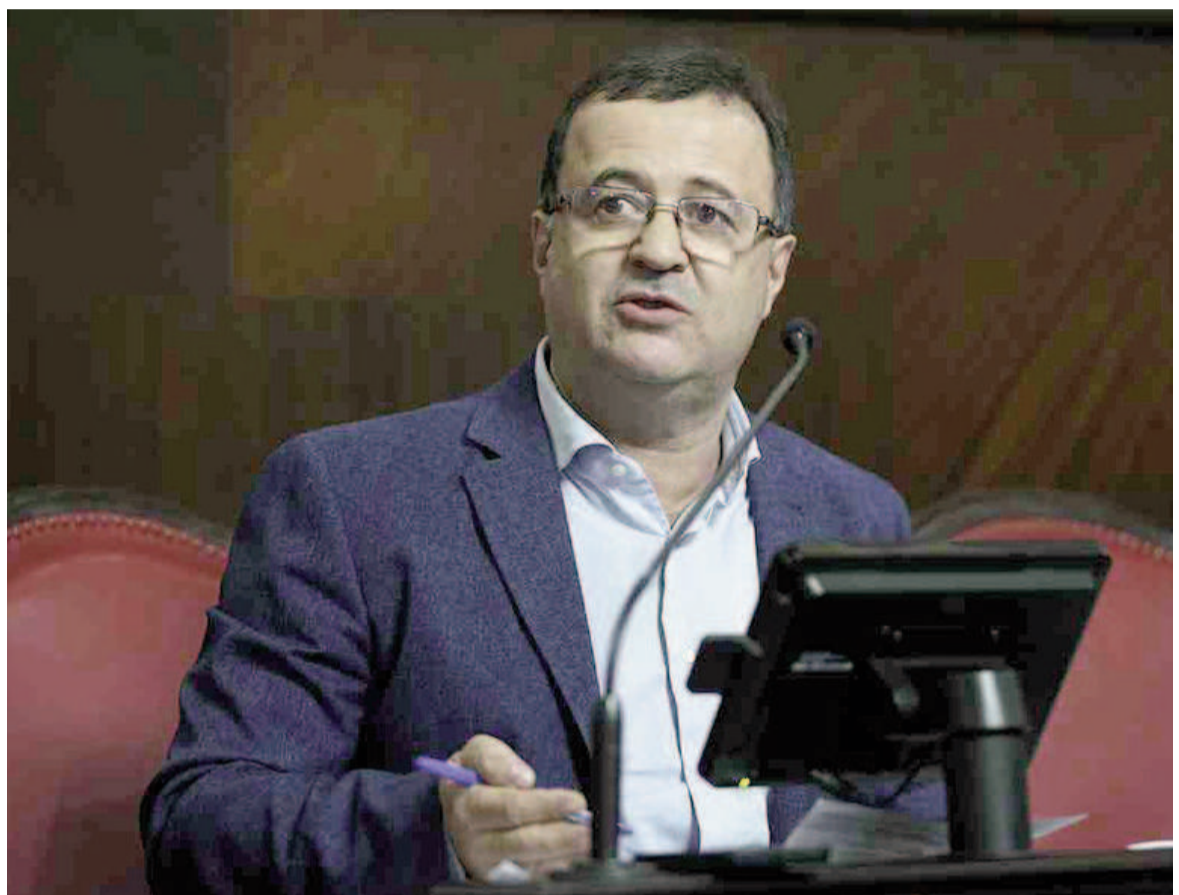
El senador Marcelo Daletto.

También se registró una leve mejora en el impuesto Automotor, que recaudó 0,18 billones de pesos y pasó de representar el 3,8% en 2024 al 4,4% en 2025. Sin embargo,