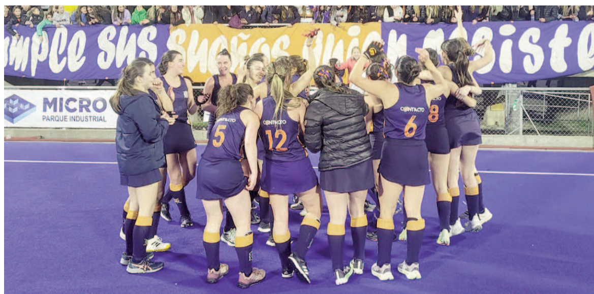
Cientos de nicoleños acompañaron a ambos equipos en la definición. EL NORTE

Fue un sábado con dos títulos para las regatenses, que también festejaron en Sub 16. En cancha de Duendes, las nicoleñas vencieron 1 a 0 a Jockey B y se adueñaron del Apertura. En Sub 19, Somisa protagonizó la definición frente a Universitario B en cancha de GER, y fue triunfo para las rosarinas por 3 a 2.