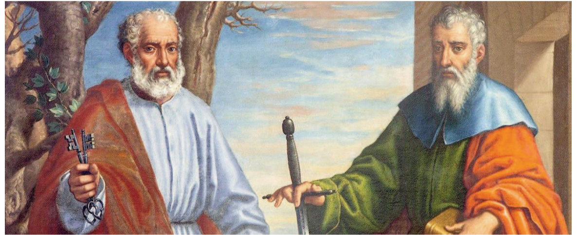
San Pedro y San Pablo.

Evangelio de Nuestro Señor Jesucristo según san Mateo (16,13-19)