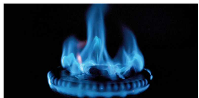
Analizan eliminar subsidios al gas.