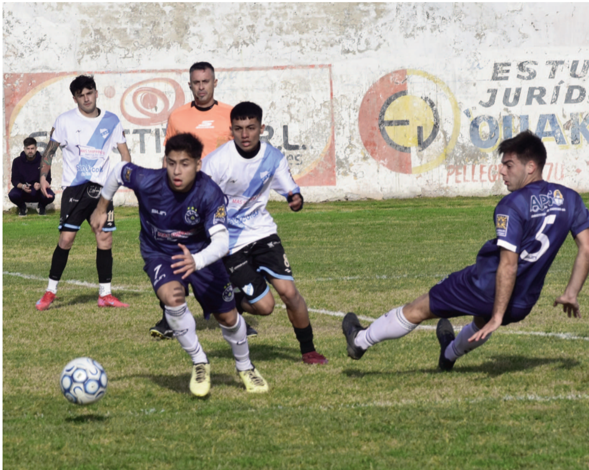
Somisa tendrá una difícil prueba jugando en el barrio.