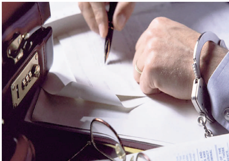
Tres empresarios fueron procesados por lavado de activos.

La maniobra consistió en la compra de divisas en el mercado oficial en violación a las normas