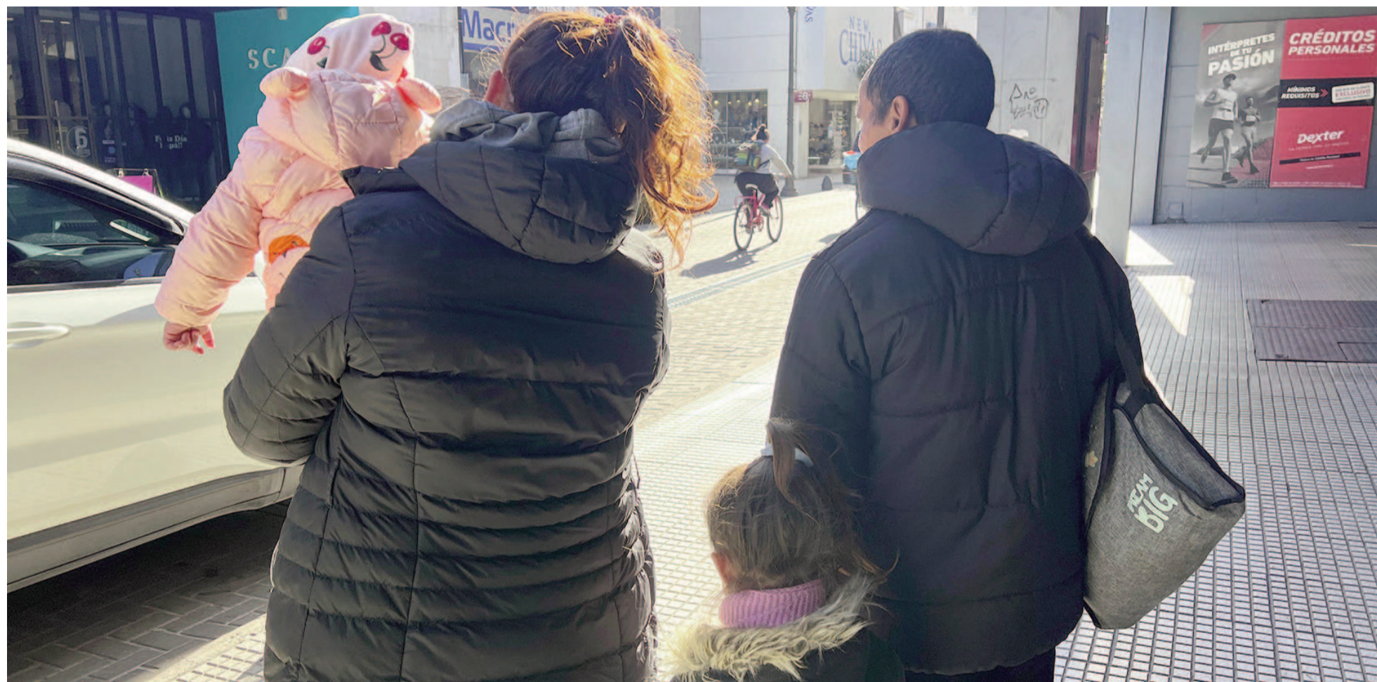
A la hora de renovar el guardarropa para este invierno, los precios suelen ser una preocupación ya que no todos los bolsillos pueden hacer frente a los valores actuales. EL NORTE

En una recorrida por locales céntricos, EL NORTE realizó un relevamiento de precios de las principales prendas de abrigo solicitadas por los consumidores en esta temporada, que buscan sobre todo hacer coincidir calidad y bajo costo en un mismo producto. Muchos comerciantes exhiben en sus vidrieras distintas promociones en efectivo de prendas seleccionadas a fin de incentivar las ventas.