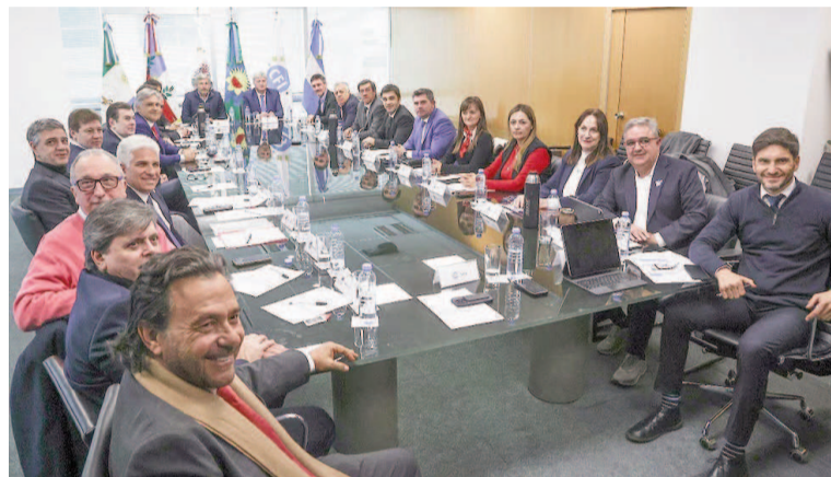
Los gobernadores reunidos en el CFI.

Ninguno de ellos salió a hablar en público sobre el tema. Pero en