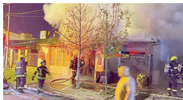
Arduo trabajo de bomberos.

Las causas del incendio aún no están confirmadas. Personal de Bomberos y peritos especializados trabajan en el lugar para determinar el origen del fuego, sin descartar ninguna hipótesis por el momento.