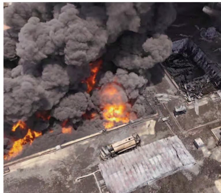
EE.UU. entró en la guerra entre Israel e Irán.

El presidente Donald Trump detalló que los objetivos alcanzados incluyen las plantas de Fordow, Natanz e Isfahan.