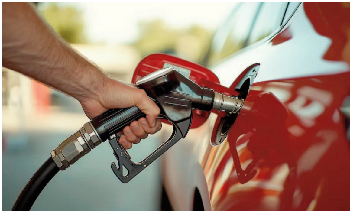
Las empresas comenzaron a subir sus combustibles ante el alza del crudo.

A su vez, resta por verse que efecto tendrán sobre las cotizaciones internacionales de las distintas variedades de crudo los ataques de EE.UU. a tres instalaciones nucleares iraníes que informó ayer, luego de realizadas, el presidente norteamericano, Donald Trump.