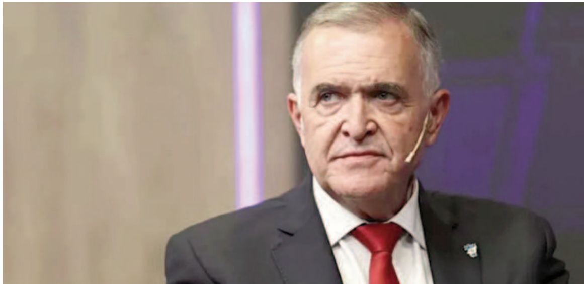
El gobernador de Tucumán, Osvaldo Jaldo.

“Vamos a llevar casos concretos de actividades productivas, industriales y comerciales que se van cerrando, que van dejando a gente sin trabajo o adelantando vacaciones”, dijo y adelantó que viajará el domingo por la noche. “Vamos a hablar no solo del Estado provincial, sino también de la actividad privada. Al paso que vamos va a haber un costo social muy importante en la República Argentina si el Gobierno nacional no reacciona en tiempo y en forma”, aseveró. En esa línea, remarcó que “la Nación tiene que tener un diálogo más profundo con las provincias y lo dice alguien que ha sido calificado como un gobernador dialoguista desde el primer momento”. Sin embargo, aseguró: “Ahora, yo puedo ser dia-