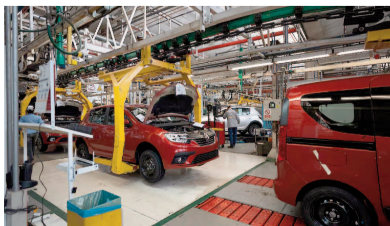
La industria automotriz incrementó 5,2% su demanda eléctrica entre enero y mayo.

En contraste con estos avances, cinco sectores registraron caídas en su consumo eléctrico. La más pronunciada se dio en la gran siderurgia, con un retroceso del 6,6%, al pasar de 278 a 259 MW. Este dato refleja la desaceleración que