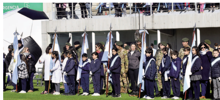
Dan su promesa alumnos de cuarto año de nivel primario.

Los alumnos, abanderados, escoltas y docentes que acompañen deberán presentarse a las 10:30 en el Estadio por el ingreso de Av. Rucci, donde personal del municipio les dará la ubicación correspondiente. Los padres, autori-