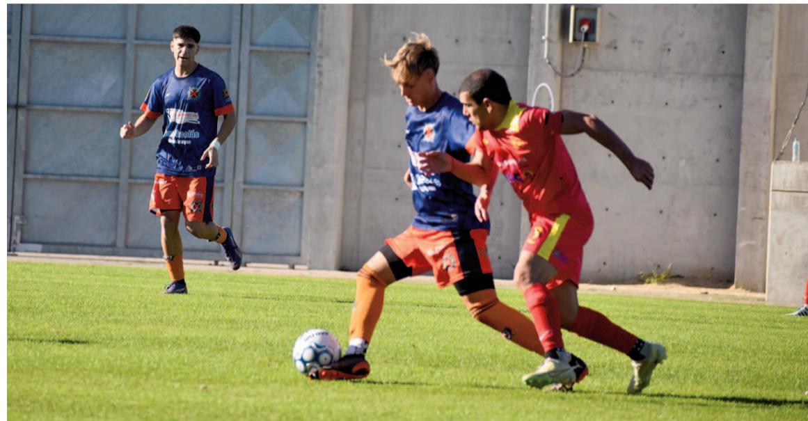
Regatas tendrá un duro escollo ante Doce. EL NORTE

Hoy desde las 15.00 se disputarán tres partidos revancha de cuartos de final: Regatas vs. 12 de Octubre, San Martín vs. La Emilia y Paraná vs. Somisa.