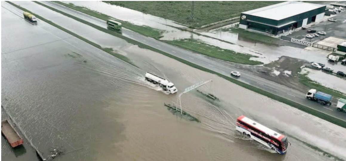
En el norte bonaerense cayeron más de 400mm en 24 horas y varias rutas están intransitables.

Los alumnos y cuatro docentes fueron sorprendidos por el temporal cerca de Carmen de Areco. Los trasladaron a un club de Campana.