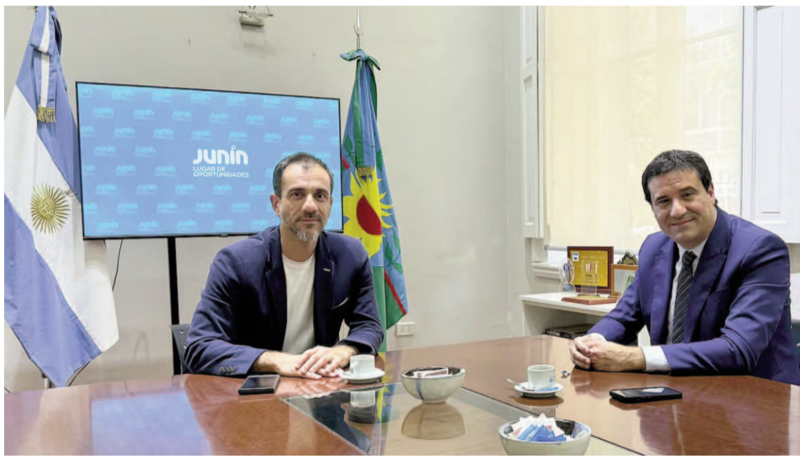
Abad, se reunió con el intendente de Junín.

“El gobierno de la provincia no va más y hay que empezar a trabajar ahora para realmente poder presentar una propuesta en las próxi-