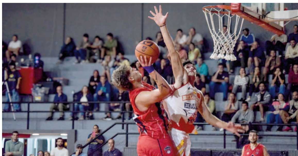
Belgrano perdió en Tandil 76 a 60 con Independiente en la fase regular.

Belgrano volverá a verse las caras con Independiente de Tandil, al que enfrentó en dos oportunidades en su zona. En el primer duelo, los tandilenses ganaron como locales por 76 a 60, mientras que en el segundo en