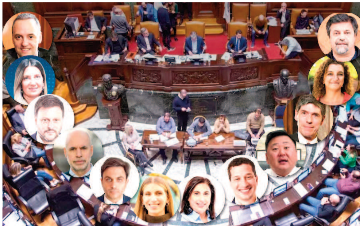
Hoy domingo la Ciudad de Buenos Aires votará en elecciones la renovación de la mitad de la Legislatura porteña.

Una amplia gama de candidatos que estarán habilitados para ser