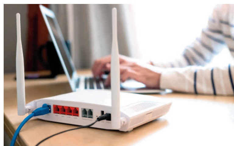
Los datos fueron relevados por el Indec en su reporte de «Acceso y uso de tecnologías de la información y la comunicación».

El uso de teléfonos celulares se extiende, en tanto, al 89,1% de la población definida por la encuesta. Y el informe revela que, en el caso de las computadoras, sólo el 37,7% de los habitantes de San Nicolás y Villa Constitución a partir de los 4 años de edad, las usan. No es una circunstancia exclusiva del aglomerado: a nivel nacional el uso de computadoras también se da en el 37,1% de la población.