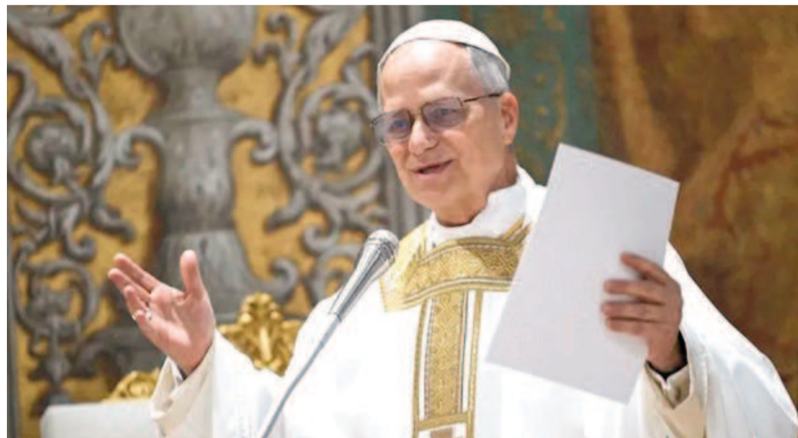
Papa León XIV.

En el ritual de hoy domingo, que contará con la presencia de cerca de 150 delegaciones internacionales y miles de fieles, destacarán la fusión de cultos tradicionales y reformas modernas