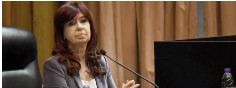
Cristina Fernández expectante a la Ficha Limpia provincial.