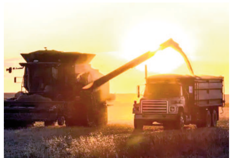
Hasta el 30 de junio, el agro tiene tarifas reducidas para sus exportaciones.

Por otro lado, habrá una caída del 7,6% en la producción del maíz, que llega a las 33,5 millones