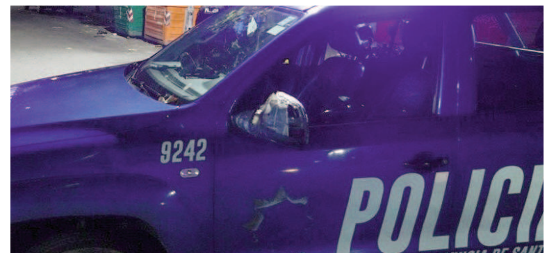
Un hombre fue asesinado en zona sur.

El hecho ocurrió ayer sábado alrededor de las 17 en Sarmiento al 3300, barrio España y Hospitales, a donde efectivos policiales llegaron a partir de llamados de vecinos que advirtieron sobre la presencia del cuerpo de la víctima.