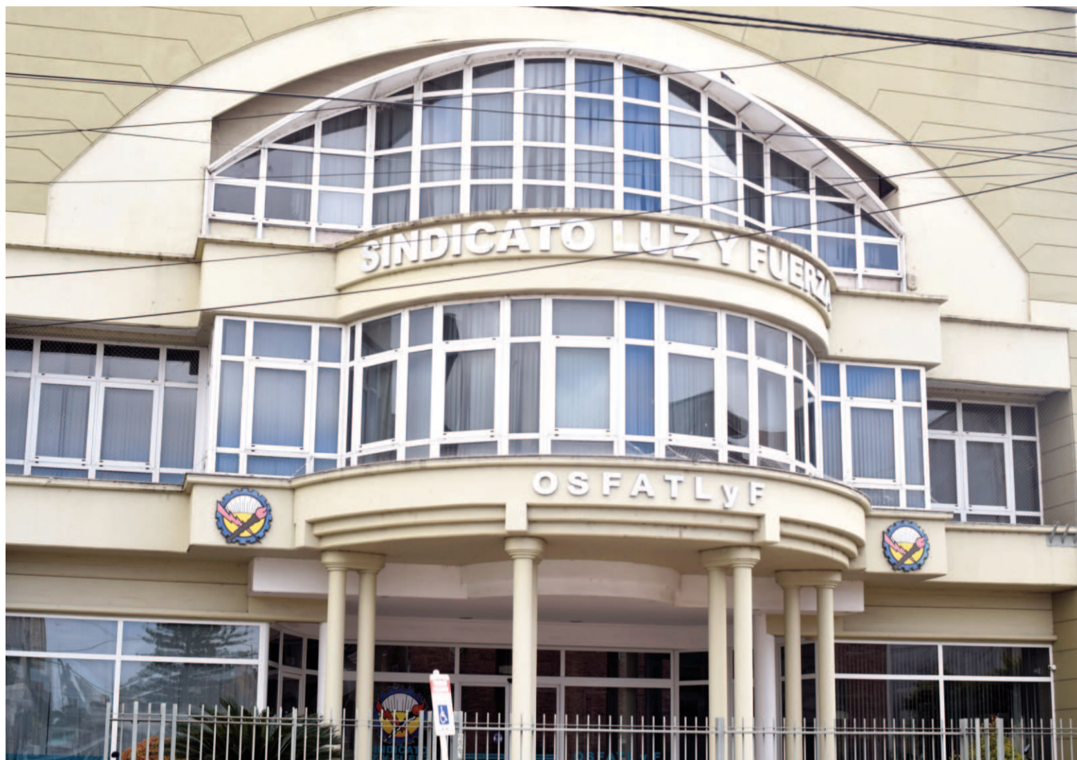
Desde 2015, la sede de Luz y Fuerza San Nicolás se encuentra ubicada en Garibaldi 221. IARA CERASI

En agosto de 1949, la FATLyF consiguió su personería Gremial Nro. 130 y un día después sesionó el Primer Congreso Ordinario de FATLyF en la ciudad de Rosario, firmando el 31 de agosto el primer Convenio