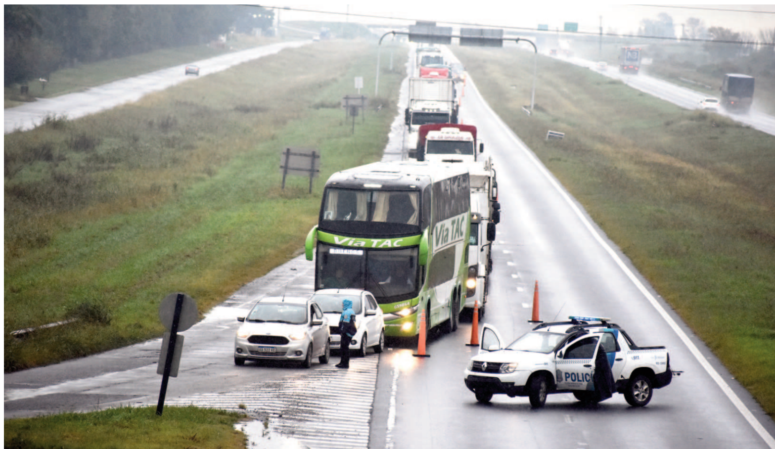
Vialidad Nacional definió distintos cortes totales en la traza de la Ruta 9, uno de ellos a la altura de San Nicolás.

Otro frente de dificultades fue el que tuvo que ver con las condiciones de transitabilidad de las rutas nacionales y provinciales que atraviesan la zona castigada por el temporal. Vialidad de la provincia de Buenos Aires y Vialidad Nacional reportaron anegamientos en: Ruta Provincial N° 51 entre Arrecifes y Carmen de Areco; Ruta Provincial N° 191 entre Arrecifes y Salto; Ruta Provincial N° 31 en Salto y Rojas; Ruta Provincial N° 32 entre Salto y Pergamino; en el acceso a Villa Lía por Ruta Provincial N° 41, en San Antonio de Are-