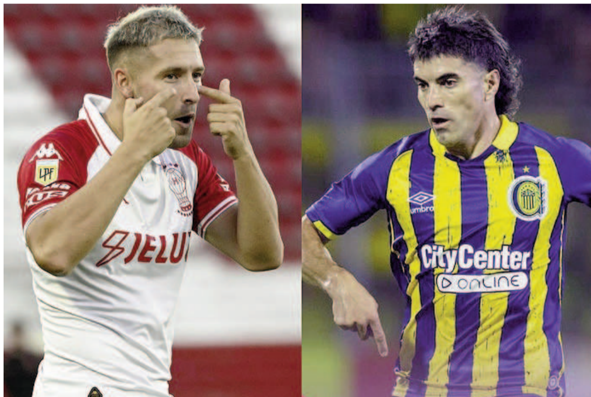
El Canalla y el Globo jugarán al todo o nada. WEB

Se medirán hoy a partir de las 19.00 en el primer choque de curtos de final en el Gigante de Arroyito. En el canalla volvería Campaz como titular, y en el globo Kudelka haría dos cambios.