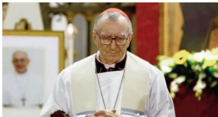
El cardenal Pietro Parolin podría suceder a Francisco.