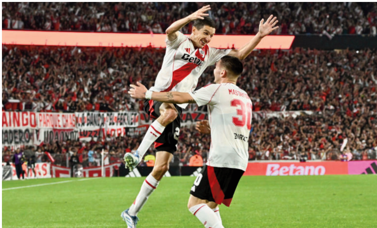
LA LIGA PROFESIONAL YA TIENE DEFINIDOS LOS CRUCES DE OCTAVOS DE FINAL

Dos proyectos energéticos ya están oficialmente dentro del Régimen de Incentivos a las Grandes Inversiones. Hay otras nueve iniciativas a la espera de ser aprobadas: entre ellas, la de Sidersa que con una inversión de 300 millones de dólares prevé la construcción en San Nicolás de una planta siderúrgica integral de última generación. Se espera que la inversión genere 300 puestos de trabajo directos y otros 3500 de manera indirecta. Local 3