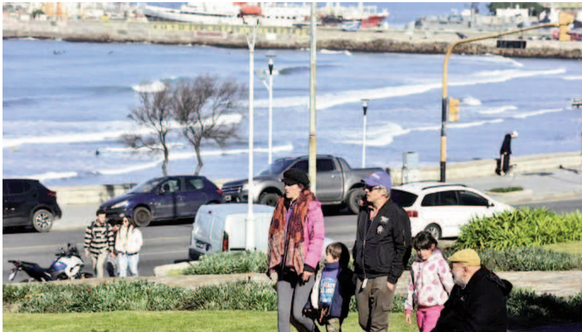
Según CAME este turismo fue de cercanía.

El fin de semana largo por el Día del Trabajador movilizó a 1.159.000 turistas en todo el país, con un impacto económico estimado en $ 256.960 millones durante los cuatro días. Según el relevamiento de la Confederación Argentina de la Mediana Empresa (CAME), cada turista gastó en promedio $ 82.100 por día y permaneció 2,7 días, lo que representa un gasto total aproximado de $ 221.670 por persona en todo el viaje. Desde la cámara empresaria destacaron que la principal característica de este feriado fue el turismo de cercanía, con viajeros que redujeron gastos, acortaron su estadía y eligieron destinos con promociones. A su vez, "muchos turistas optaron por países vecinos. Más de 20.000 personas cruzaron de Mendoza a Chile por el Paso Cristo Redentor. Aprovecharon para hacer compras de indumentaria y tecnología. Solo durante el 1 de mayo salieron 8.000 personas y se registraron 61 ómnibus