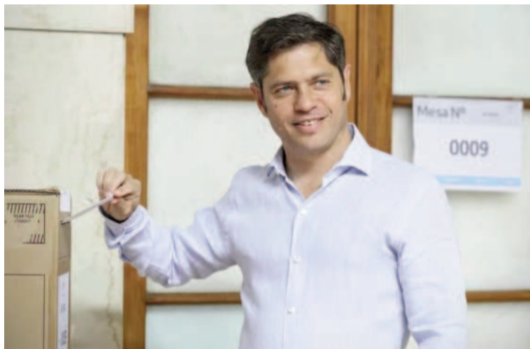
Kicillof se juega una parada decisiva en la organización electoral.

La ley 5109 vigente en provincia dispone de 30 días antes de la elección para la presentación de candidatos. Y 20 días antes de la elección para la ofi-