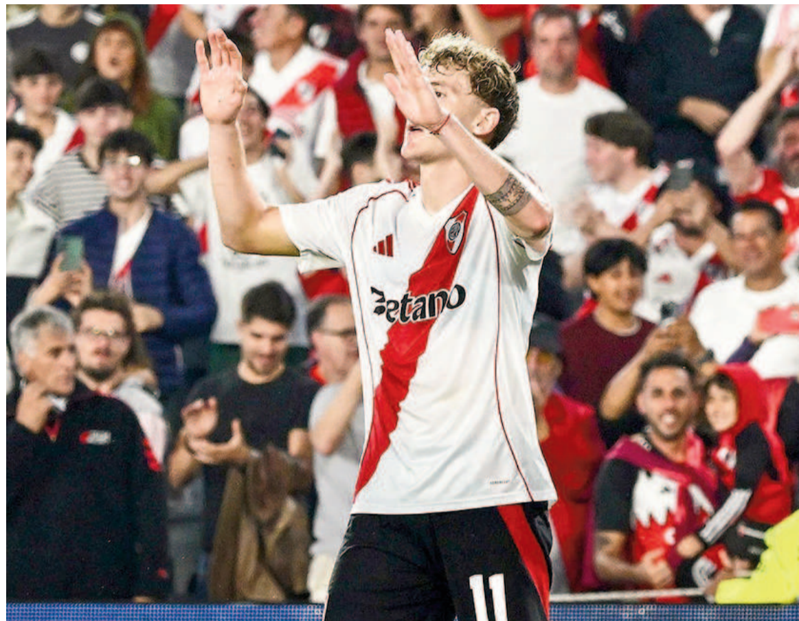
El Millonario fue muy superior y en octavos chocará ante Barracas Central.

El equipo de Gallardo se impuso por 4 a 1 en el Monumental y quedó segundo en la Zona B. Driussi, Colidio, Fernández y Borja (de penal) anotaron los goles del local, descontó Carrizo.