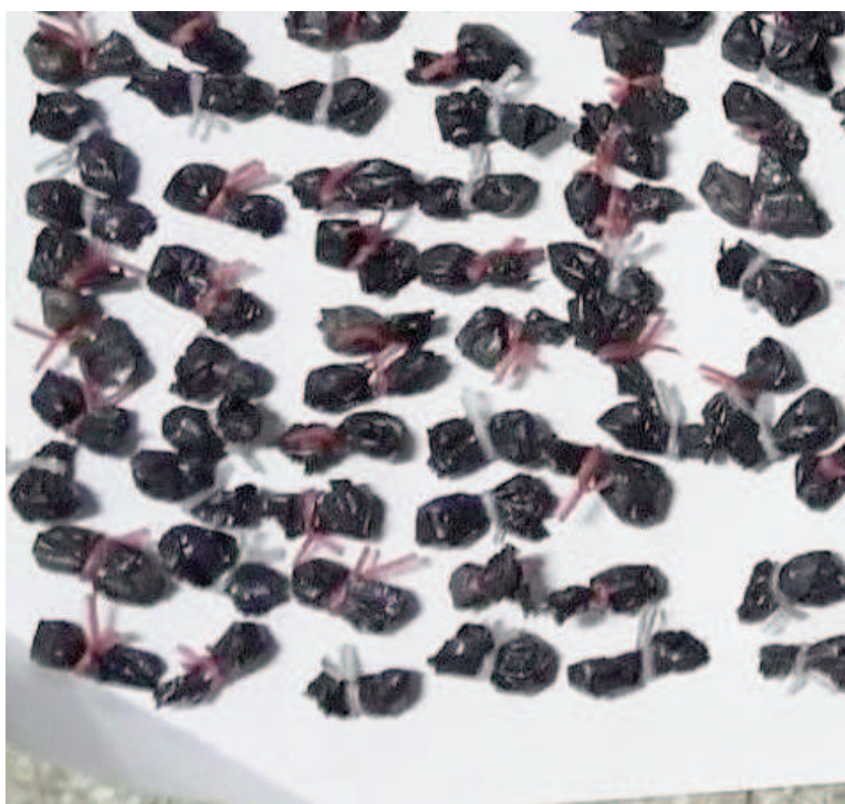
Se incautaron 102 envoltorios con una sustancia blanquecina que sería cocaína.

Durante la persecución, un agente resultó lesionado en el pie derecho con una herida pun-