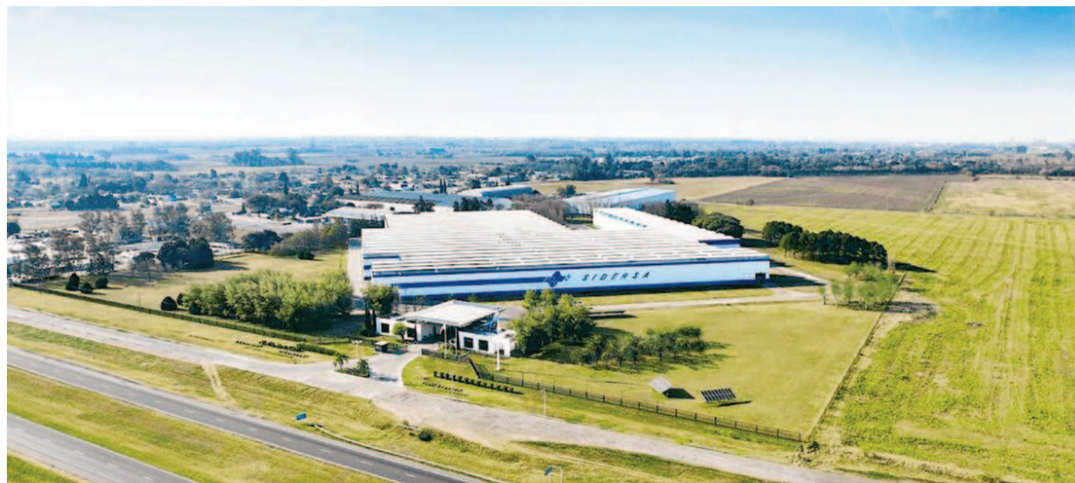
En diciembre del año pasado, Sidersa inscribió su plan de inversiones por 300 millones de dólares en el RIGI.

El RIGI, sancionado en 2024 y reglamentado en agosto de ese año, establece un marco de beneficios fiscales, aduaneros y cambiarios para