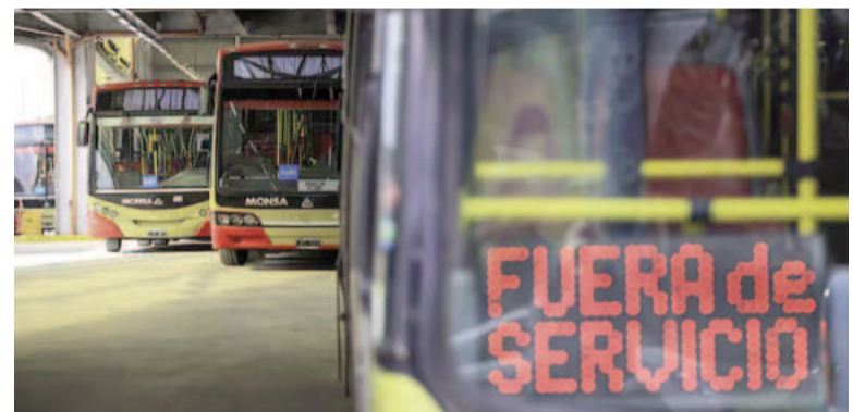
Mañana habría paro de colectivos.

Y añadió: "Hay veces que las gestiones se agotan producto de esa intensidad. Los funcionarios dicen estoy llegando hasta acá".