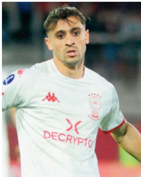
El primer finalista del certamen se conocerá esta noche.

El Rojo y el Globo se enfrentarán hoy desde las 18:30 en el Estadio Libertadores de América-Ricardo Enrique Bochini en un interesante duelo de dos equipos que juegan bien.