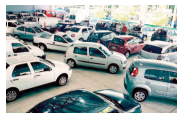
Concesionarios de autos elogian las medidas del gobierno.