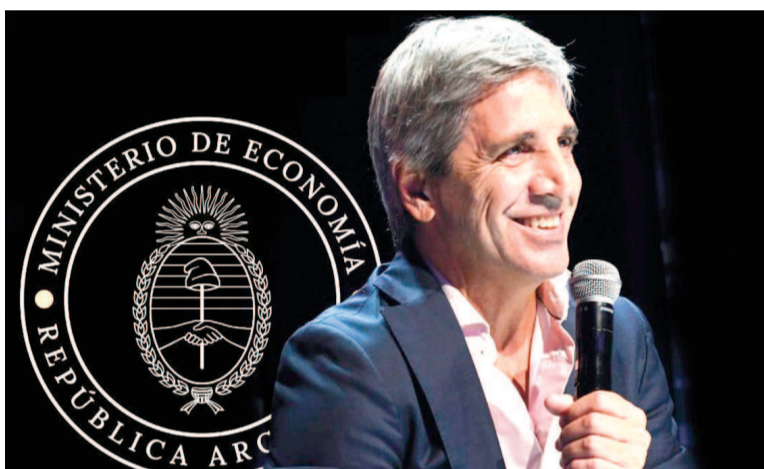
El ministro de Economía, Luis Caputo.

En tanto, el ministro explicó que el consumo y los bienes registrables serán dos vías diferentes donde cada uno podrá utilizar el dinero.