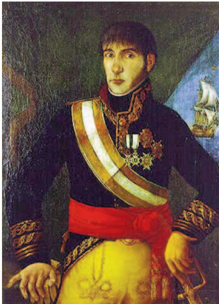
Baltasar Hidalgo de Cisneros y de la Torre en un cuadro de la época.

No querría que parezca esta nota una defensa de Cisneros,