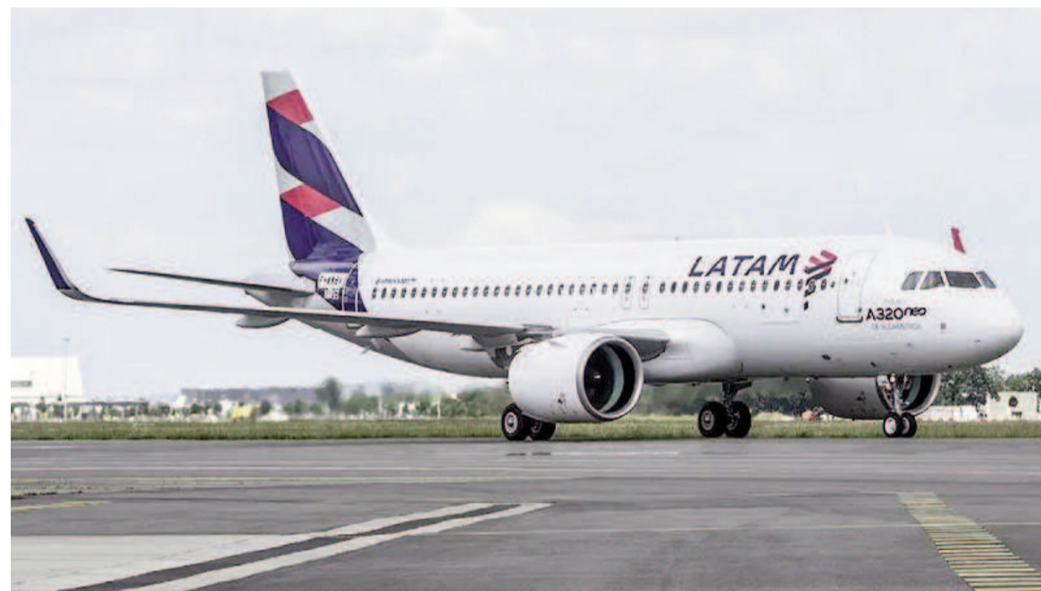
Latam indicó que buscan fortalecer el mercado entre Argentina y Brasil.

Con cuatro vuelos semanales a São Paulo desde diciembre, Rosario se consolida como una opción cercana y conveniente para los nicoleños que quieran viajar al exterior sin pasar por Buenos Aires.