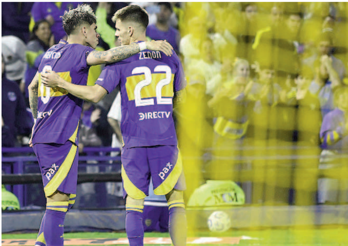
Zenón y Palacios estarán en el Xeneize ante el Granate.

En cuanto a su última presentación en el Apertura, Lanús viene de perder 1-0 con Atlético Tucumán. Los de Mauricio Pellegrino cayeron con un plantel alternativo