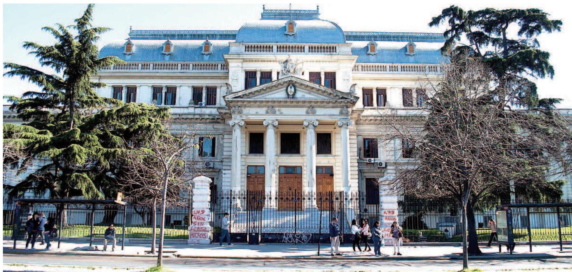
El Senado provincial y la Cámara de Diputados de la Legislatura bonaerense sesionan el lunes, en sucesivos encuentros.