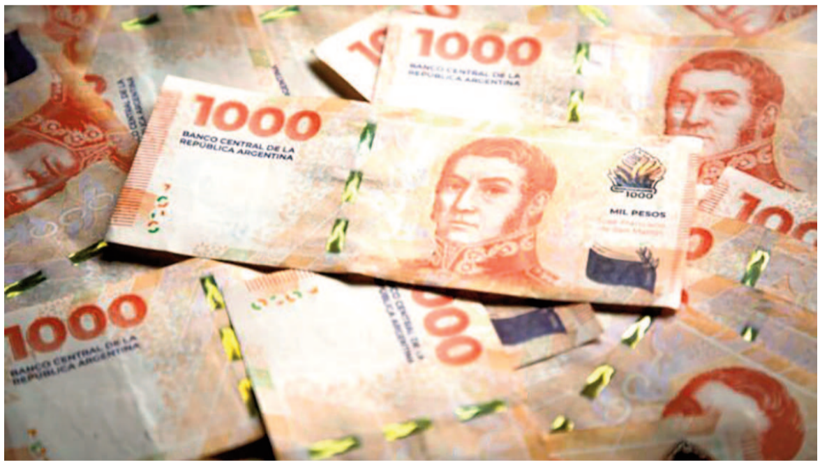
Una serie de billetes de mil pesos argentinos.

La progresión establecida por esta Resolución se completa con dos últimos aumentos: el primero está previsto para el 1° de julio, cuando la cifra correspondiente a los mensualizados será de $317.800 y la de los jornalizados de $1.589 por hora; y el restante para el 1° de agosto, con valores de $322.000 y $1.610, respectivamente. Cabe recordar, que como pasó en las convocatorias anteriores, no hubo acuerdo en el Consejo del Salario entre los representantes empresarios y sindicales por lo que el Gobierno fijó mediante un "laudo" el nuevo valor del salario mínimo y de