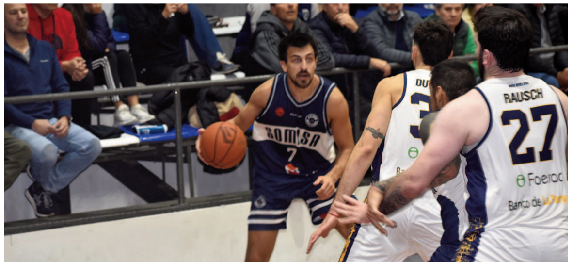
Cognigni tuvo otra noche productiva en Somisa, con 22 puntos (9-14 en tiros de cancha).

había comenzado el anterior; es decir con Somisa apresurado y sufriendo pérdidas. Y a esto se le sumó que Abeiro lució errático en ese pasaje. Claro que mantuvo su ímpetu en defensa (con Calcaterra destacándose en ese aspecto). Y cuando su pivot recuperó la puntería, se despegó definitivamente el dueño de casa, que sacó la máxima de diecisiete (66-49 a 5'30). All Boys fue a la carga como pudo. Y no tuvo suerte en su in-