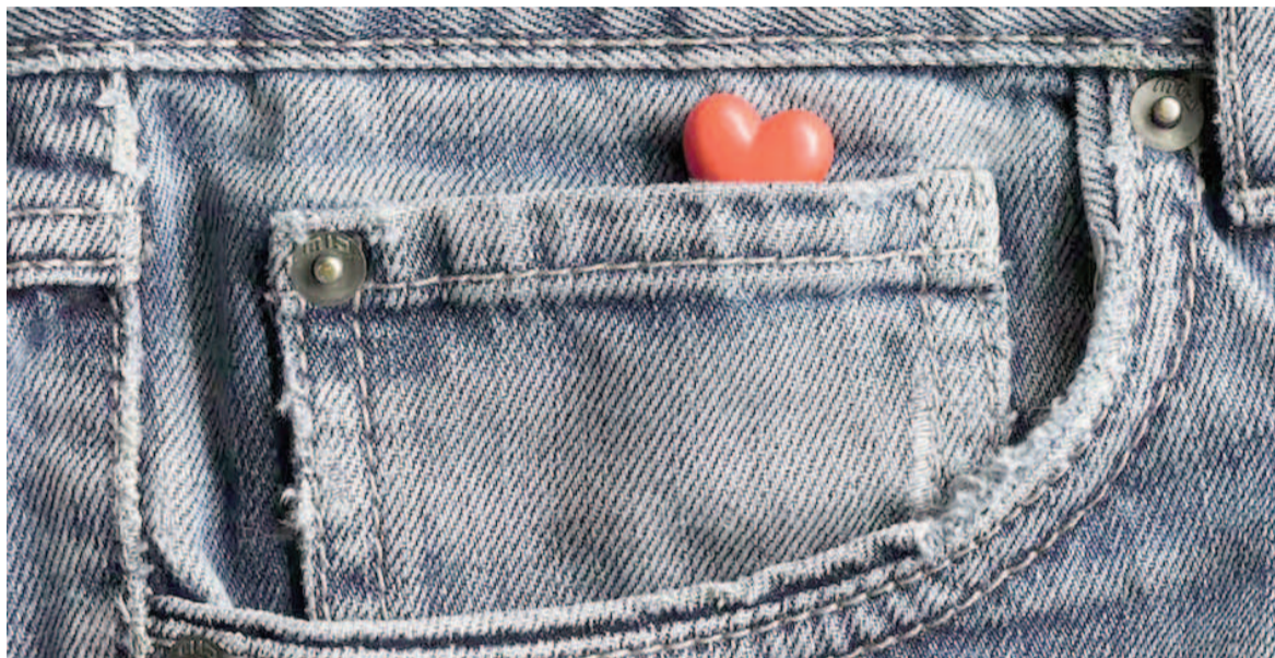
Los jeans tienen un remache que nadie sabe para qué sirve.