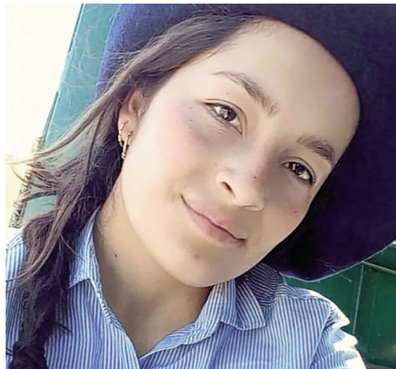
La joven era buscada luego de que cayera al Arroyo Dulce.

El lunes a la tarde encontraron a Pablo a una distancia aproximada de más de cuatro kilómetros de donde fue el incidente y este martes la hallaron a ella, muy cerca del lugar donde estaba el cuerpo sin vida del joven.