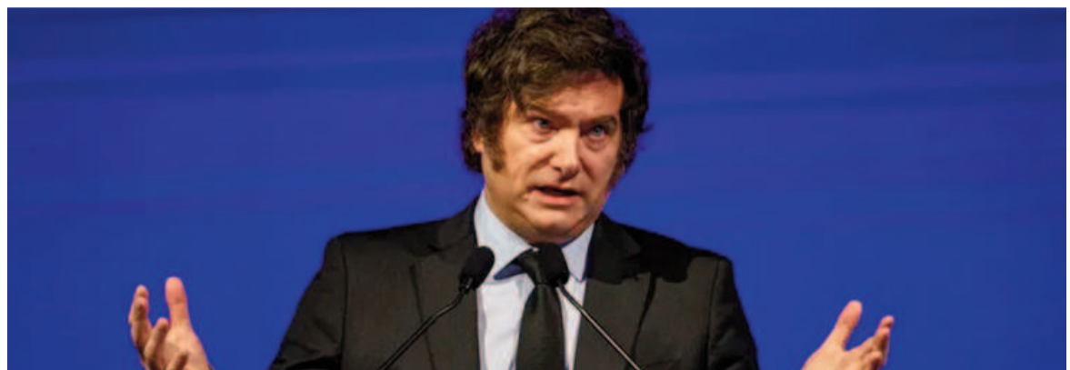
Javier Milei en AmCham Summit.

En materia estrictamente económica, Milei explicó: "El crecimiento no se genera por consumo, se genera subiendo la relación capital trabajo,