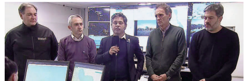
El gobernador junto a sus funcionarios.

El gobernador informó que "el agua está bajando en toda la provincia de Buenos Aires", aunque reconoció que "las excepciones más notorias son Salto y Campana, donde seguimos con can-