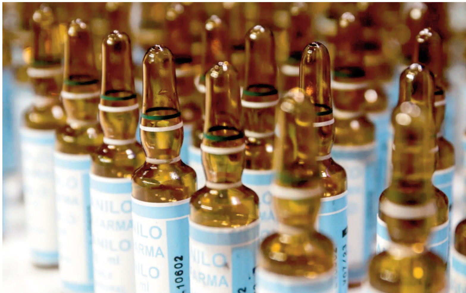
El fentanilo es un opioide sintético con potentes propiedades analgésicas.

El fentanilo es un opioide sintético con potentes propiedades analgésicas. Es entre 50 y 100 veces más potente que la morfina, lo que lo convierte en una herramienta eficaz en contextos médicos controlados, para tratar el dolor agudo en cirugías o procedimientos médicos, y el manejo