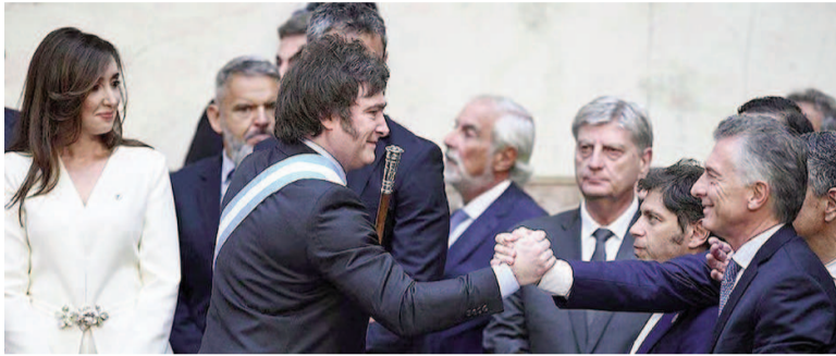
Javier Milei y Mauricio Macri.

Luego del contundente triunfo en la ciudad de Buenos Aires que fortaleció a La Libertad Avanza para negociar con el PRO de cara a las elecciones en el distrito que gobierna Kicillof, Javier Milei se refirió a los comicios del 7 de septiembre y pidió un acuerdo con el partido que lidera Mauricio Macri para ganarle al kirchnerismo. Para graficar la importancia de una alianza, el mandatario aclaró que el oficialismo podría ganarle a Cristina Kirchner en la provincia de Buenos Aires, pero "por muy poquito". Y advirtió: "El problema del error estadístico no me gusta". "Nosotros solos le ganamos al kirchnerismo, pero le ganamos por muy poquito. Y el problema del error estadístico no me gusta. Este es el rumbo y hay que alinearse. Si vamos todos juntos, le ganamos por más de 10 puntos. Y yo le quiero ganar, si fuera por mí, 70 a 30", afirmó el líder libertario. Al respecto, aclaró que el acuerdo, de existir, "es violeta" y sentenció: "No podemos poner en riesgo en ganar la provincia de Buenos Aires. Los colores son los violetas que le ganan al kirchnerismo. De 5 elecciones, 5 a 0 le ganó. Nosotros recibimos a todos los que estén dispuestos a recibir las ideas de la libertad".