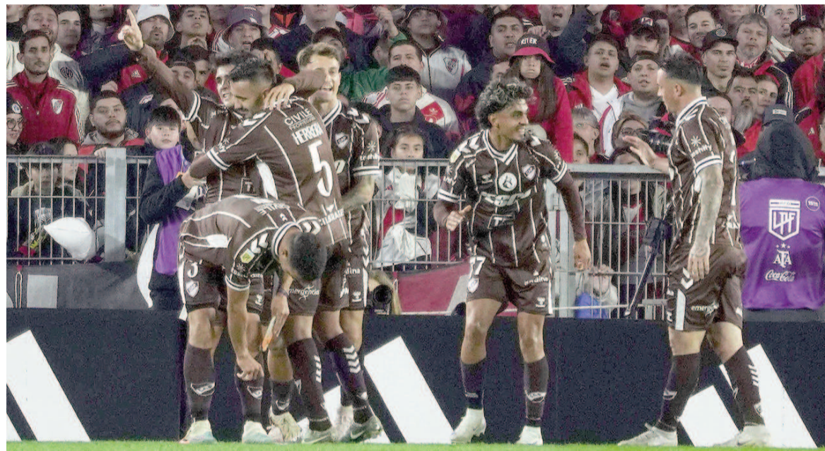
El Calamar dio el golpe al derrotar al Millonario y avanzó a semifinales.

El equipo de Orsi-Gómez se impuso en los penales luego de igualar 1 a 1 en los 90 minutos. El visitante se puso en ventaja por intermedio de Taborda, y Mastantuono igualó sobre la hora desde los doce pasos.