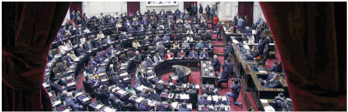
La sesión de hoy está en duda.

Este tema, que podría empiojar el trámite de la sesión, podría haber sido relegada para una futura convocatoria pero tras el pacto de Unión