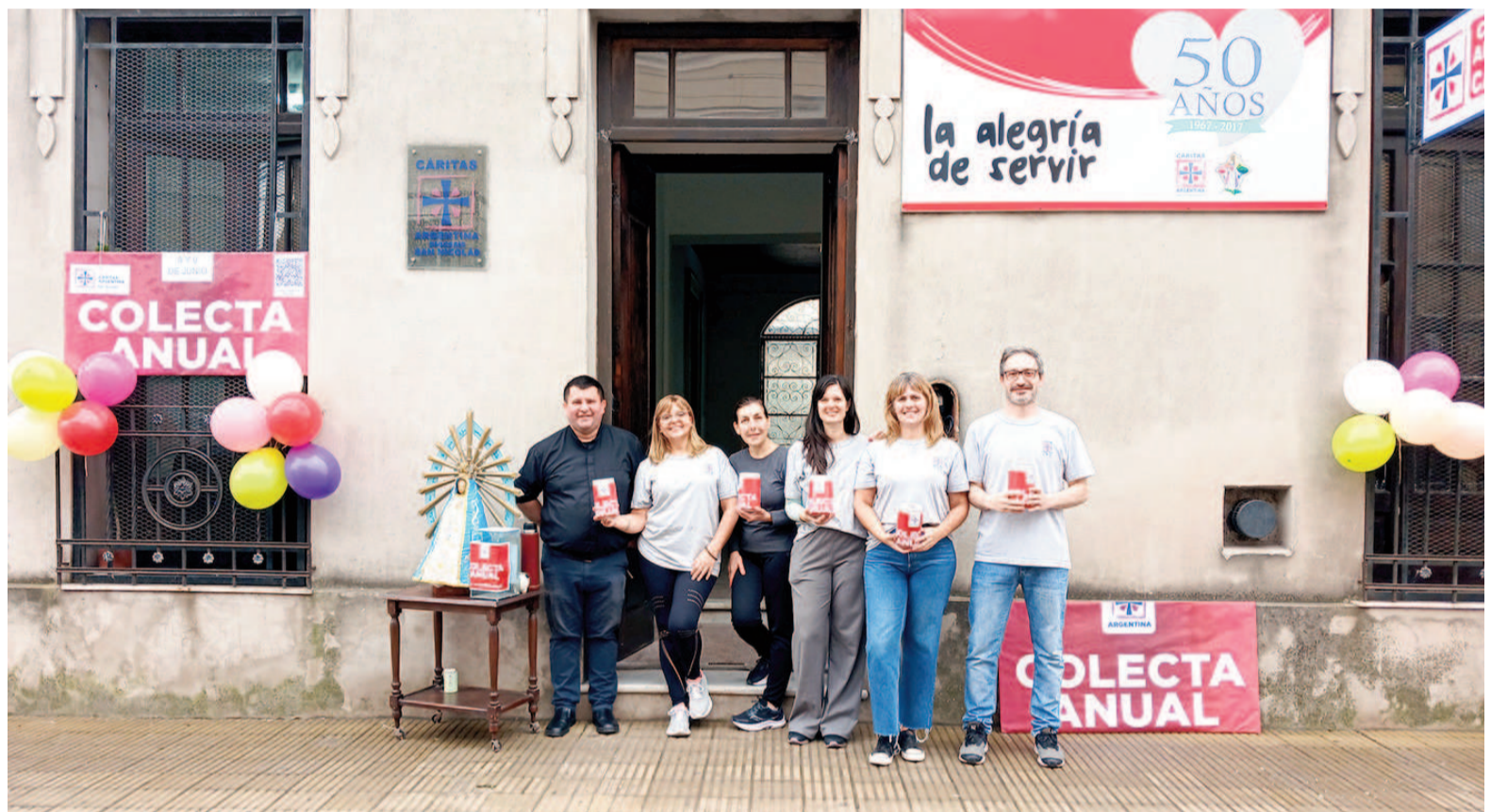
Mediante su Colecta Anual, Cáritas convoca a la sociedad a colaborar con un aporte económico que contribuirá directamente a mejorar las condiciones de vida de miles de familias.

León XIV, electo como nuevo papa de la Iglesia católica, se ha reafirmado la continuidad de este compromiso con los más necesitados, recogiendo los gestos y enseñanzas de su antecesor. Su papado comenzó el 8 de mayo de 2025, en coincidencia con la festividad de la Virgen de Luján, patrona del pueblo argentino, un símbolo especialmente significativo