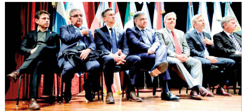
Axel Kicillof hoy se reúne con sus pares.

Hoy martes se llevará a cabo un encuentro en el marco del Consejo Federal de Inversiones (CFI) en Entre Ríos. El mandatario bonaerense confirmó su presencia y hay expectativas sobre la reunión.