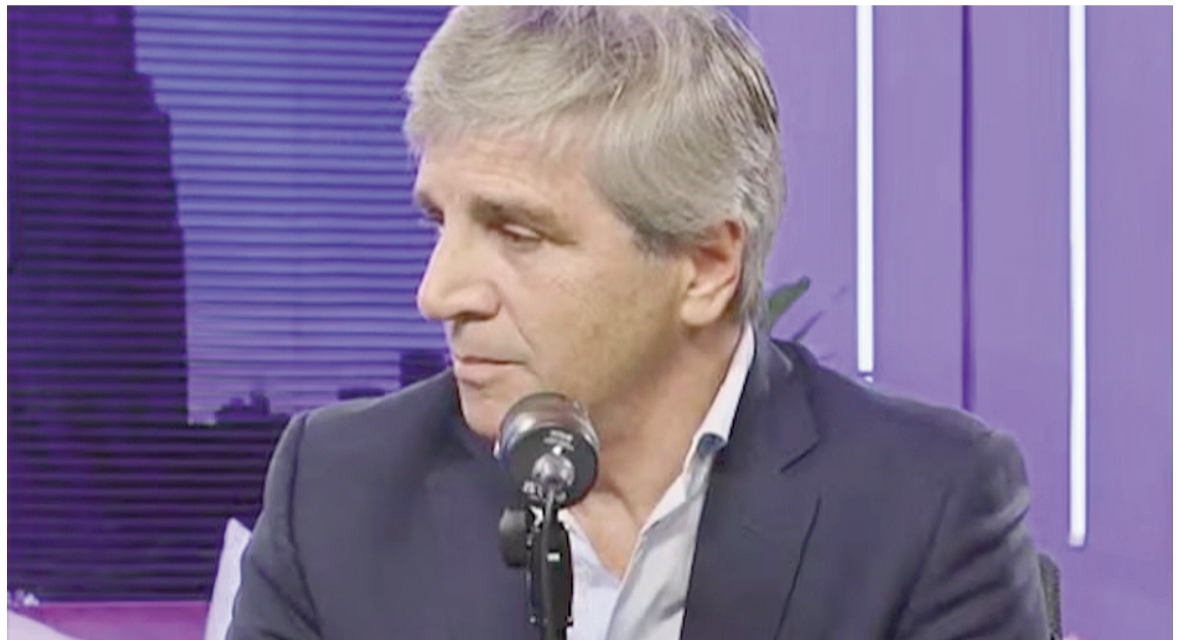
Caputo habló en una señal de streaming.

El ministro aclaró que el Gobierno no se enfoca en los resultados de corto plazo: “No nos focalizamos en eso. La inflación va a colapsar, es un proceso que va a pasar inexorablemente. Es cuestión de tiempo”.