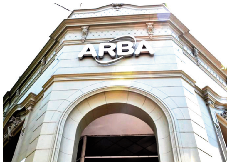
Se actualizan los valores del Inmobiliario y Automotor bonaerense.

La semana comenzó con la notificación a los contribuyentes de la segunda cuota del Impuesto Inmobiliario Urbano y Rural con un incremento con respecto a la anterior. Y también llegan con un incremento las patentes. Desde la Agencia de Recaudación de la provincia de Buenos Aires (ARBA) explicaron los motivos al tiempo que se reaviva el dilema por la prórroga de la Ley Impositiva luego de que no se aprobara en la Legislatura.