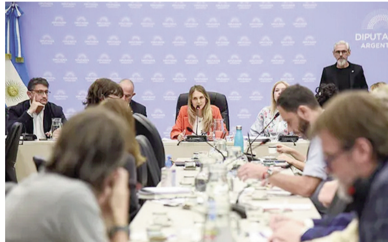
Avanzará en comisión el debate para restaurar la moratoria previsional.

Los proyectos para extender la moratoria por dos años fueron presentados por los diputados