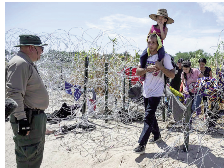
Un grupo de venezolanos cruza la frontera de México con Estados Unidos.

El Departamento de Seguridad Interior lanzó una aplicación móvil para que esas personas le comuniquen al gobierno su intención de volver a su país.