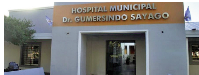
El joven nicoleño se encuentra internado en un nosocomio cordobés.