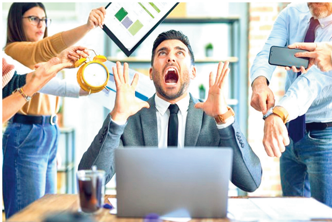
El análisis identificó una serie de factores que actúan como detonadores del estrés crónico en un entorno de trabajo.

A estos tres factores se suman otros como la imposibilidad de conciliar la vida familiar con las exigencias del empleo. La falta de equilibrio entre la vida personal y profesional fue señalada como un riesgo comparable al de trabajar en exceso, con consecuencias físicas igualmente graves.