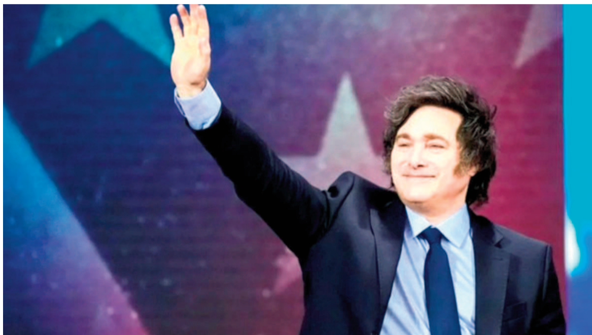
Un Milei eufórico quiere ir por más.

"Los que quieran abrazar las ideas de la libertad, los vamos a recibir. En la provincia de Buenos Aires vamos a dar otro batacazo", ahondó Milei sobre las elecciones en suelo bonaerense y concluyó: "Mauricio Macri debería entender que su momento ya pasó".