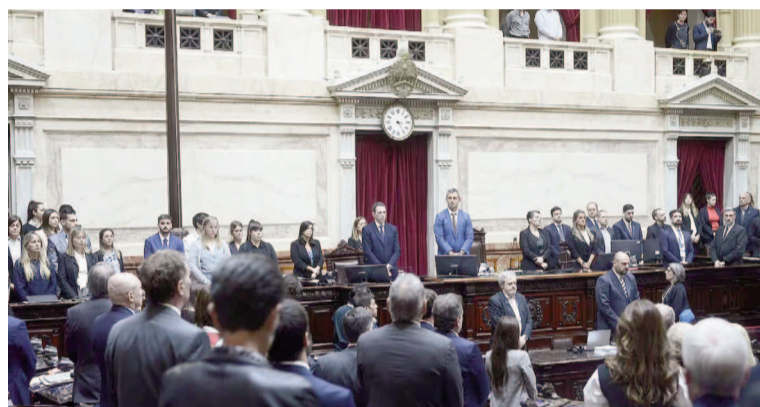
Diputados llamó a sesión este miércoles para tratar un nuevo régimen jubilatorio.

Por estas horas, Unión por la Patria insistía con impulsar el dictamen que establece una nueva moratoria por dos años prorrogables, un objetivo compartido con la izquierda y que tiene como factor de factibilidad y punto a favor el bajo impacto