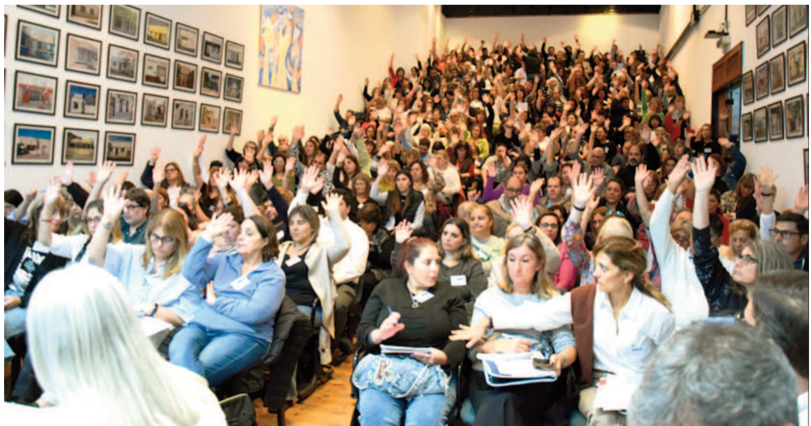
El Congreso de la FEB definió convocar a un paro provincial de 24 horas para hoy, y anunció anoche que lo sostendrá a pesar de la conciliación dictada en las últimas horas.

La mayoría de los gremios educativos aceptaron una oferta que eleva al 19,9% el acumulado de aumento salarial entre enero y julio. "Cuando se presenta la paritaria, se aborda con mesa de trabajo con cada uno de los gremios del Frente de Unidad Docente. Dependiendo de la estructura y organización de cada uno, los secretarios generales pueden dar una definición en el momento o consultar a los congresales, como es en el caso de la FEB. La Federación hace una consulta con los docentes en cada escuela a través de sus delegados y formularios de Google donde constan sus miradas y sus voces que construyen un mandato. El mandato de San Nicolás hace ya cuatro ofrecimientos salariales que es de rechazo, por un 60 o 70 por ciento. En esta oportunidad, la mayoría de los mandatos consideraron la oferta insuficiente. La FEB no decide de un momento para otro decir 'no'. En sus congresos siempre ha estado presente en un porcentaje fuerte. Cada distrito al mismo tiempo propone medidas, por lo que esta ocasión