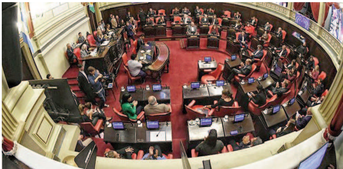
El próximo jueves nuevamente habrá sesión.