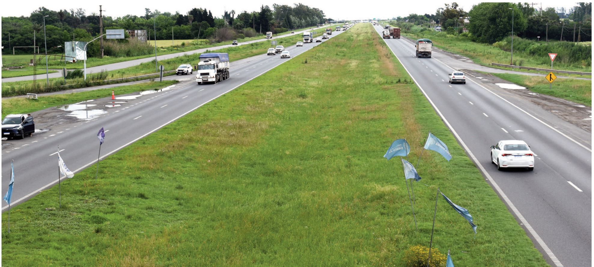
Las obras proyectadas para el Tramo Portuario Sur contemplan 164 kilómetros sobre la Ruta 9 y otros 472 sobre la 188. EL NORTE

La Dirección Nacional de Vialidad convocó a audiencias públicas que constituyen el paso preliminar para los procesos de licitación pública de obras en un total de 15 rutas nacionales y tres autopistas. Están contenidas las porciones de las rutas 9 y 188 que atraviesan el Partido de San Nicolás, que integran el denominado «Tramo Portuario Sur». La audiencia tendrá lugar el 13 de junio en el Auditorio Municipal de nuestra ciudad.