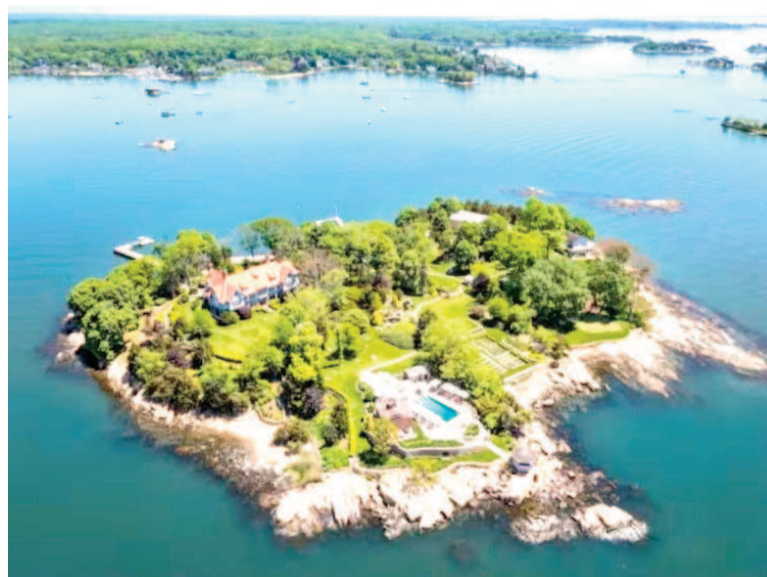
La isla privada volvió a la venta.

Otras comodidades, propias de un resort, incluyen una cancha de tenis y una hoguera entre las piedras. El paisajismo es muy característico de la propiedad, con un jardín formal y un estanque de koi con cascada.