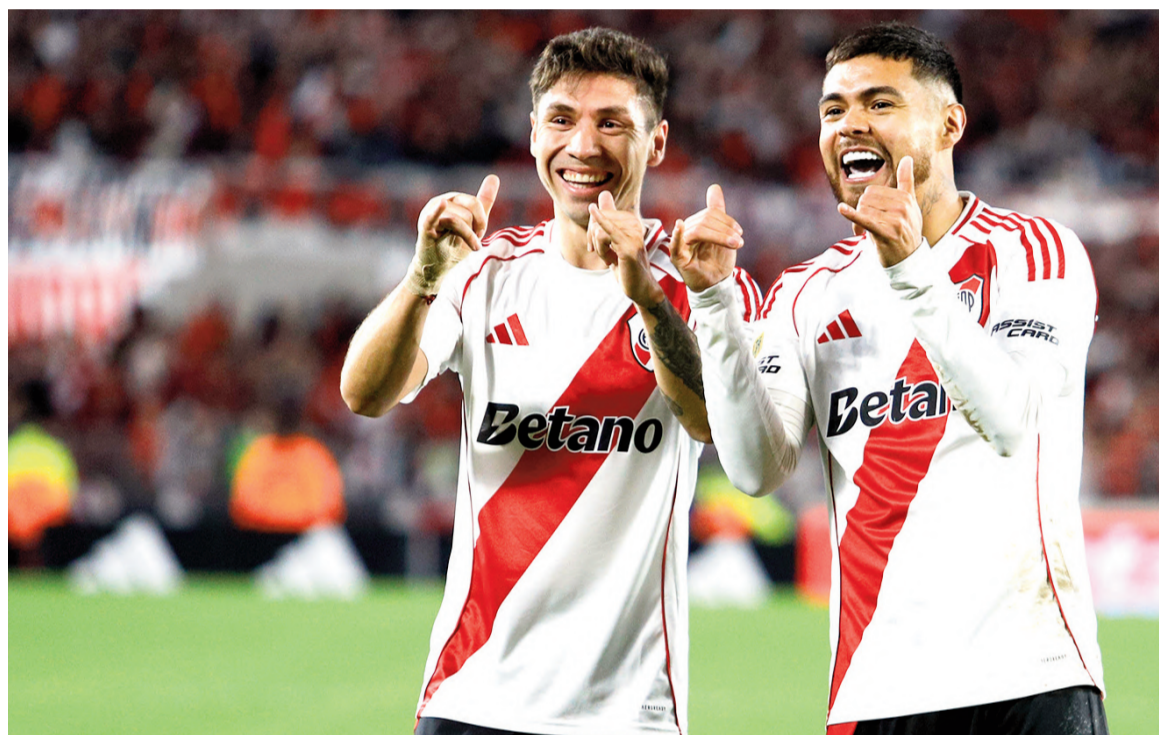
El Millonario goleó y ahora le tocará enfrentar a Platense.

El equipo de Gallardo se impuso por 3 a 0 sobre el Guapo en el Monumental y avanzó a cuartos de final. Paulo Díaz, Nacho Fernández y el Huevo Acuña fueron los autores de los goles.