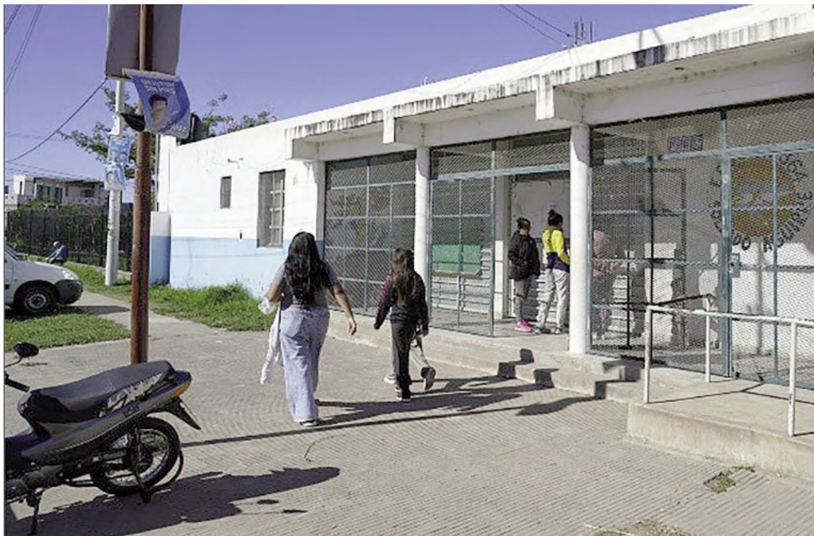
El frente del establecimiento por donde escapó el chico.

La madre de una alumna de quinto grado contó que su hija le avisó por teléfono que un