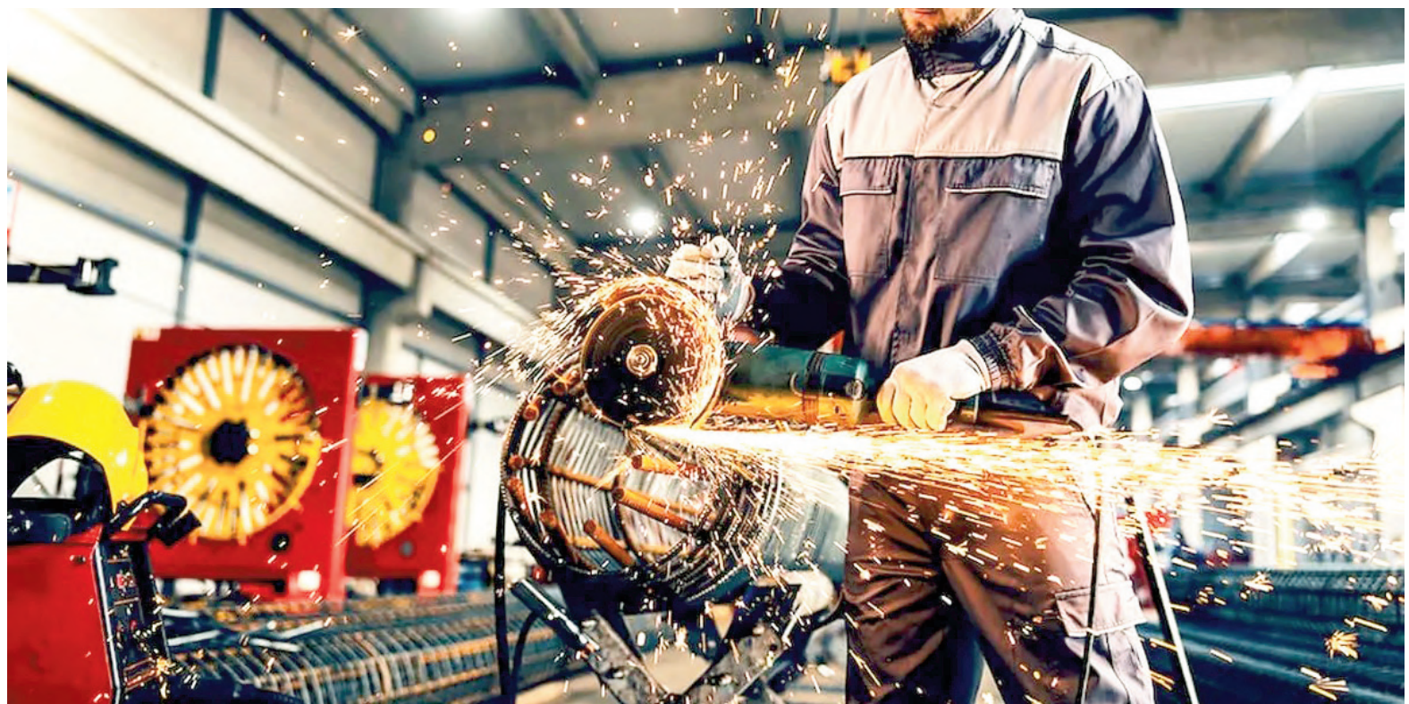
Hoy al mediodía y en modalidad presencial, la UOM se reúne con Adimra y el resto de las cámaras de Rama 17.

Según publicó Infobae, un alto funcionario libertario aseveró que “no hay más discusión salarial por inflación”. Así, ratificó la pauta de aumentos del 1% mensual que fijó el Ministerio de Economía en las paritarias, con la baja inflacionaria como objetivo y en medio de las tensiones por la decisión oficial