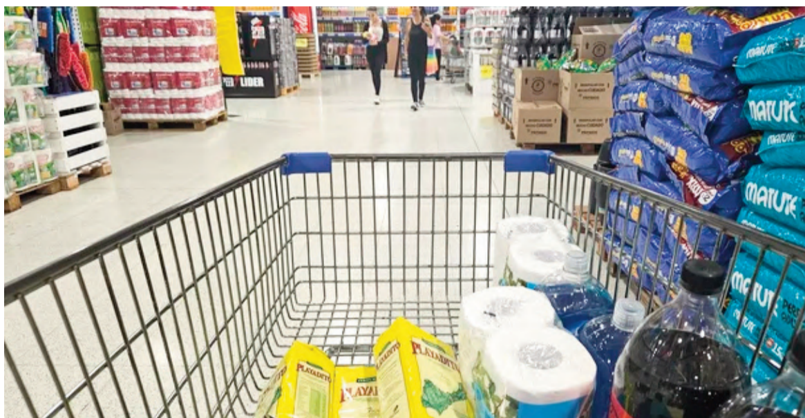
CABA tuvo, en abril, una inflación menor que el mes anterior.

La inflación esperada para los próximos 12 meses en abril fue del 41,3%, lo que mostró una suba respecto al 40,5% de marzo, según el relevamiento mensual que realiza la Universidad Torcuato Di Tella (UTDT).