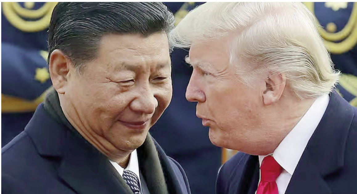
Trump y Xi Jinping en 2017.

Los mercados bursátiles subieron considerablemente mientras las dos principales potencias económicas del mundo daban un paso atrás en un enfrentamiento que ha desestabilizado la economía global. La bolsa de Nueva York abrió este lunes con alzas pronunciadas. En los primeros intercambios, el índice industrial Dow Jones subió un 2,66%, el tecnológico Nasdaq se disparó 4,16% y el índice ampliado S&P 500 avanzó 2,97%. La suspensión entrará en vigor "de aquí al 14 de ma-