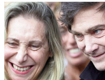
El Presidente ratificó a su hermana como "jefe" de campaña.