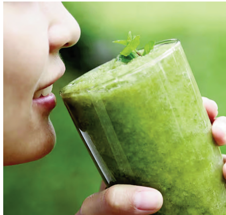
Este preparado, conocido popularmente como "oro verde", combina espinaca, pepino y manzana verde.

Esta bebida no solo ha sido bien recibida por nutricionistas, sino que también ha sido mencionada como una opción saludable por organizaciones como la Asociación Americana de la Diabetes, que recomienda alimentos con alto contenido en micronutrientes y bajo índice glucémico.