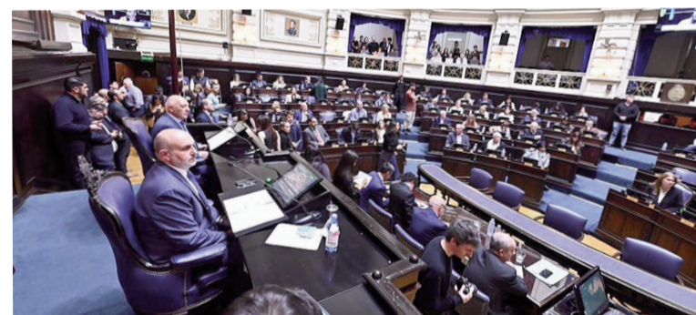
El Senado bonaerense aprobó la ampliación de plazos electorales.

Acto seguido realizaron un homenaje por el 106 aniversario del nacimiento de Eva Duarte de Perón. La primera en tomar la palabra fue la se-