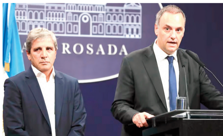
El anuncio lo efectuaría el vocero Adorni.

De la confección de la normativa participaron muchas áreas del equipo económico -Ministerio de Economía,