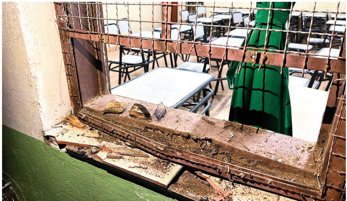
Los autores materiales –no identificados por el momento– rompieron una de las rejas de la escuela e intentaron incendiarla arrojando un palo prendido fuego al interior.

“El año pasado a esta altura ya se habían registrado unos 40 robos, y este año unos 10. De enero a diciembre se pasaron las 100 denuncias. Ya para agosto, había 66 robos”, habían precisado y agregaban: “La baja de este tipo de hechos nos deja más tranquilos porque los gastos