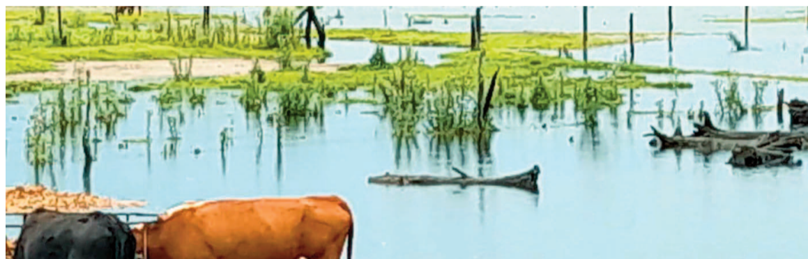
Crítica situación del campo tras las inundaciones.

cados y en esos lugares volvió a llover. Están destrozados y detonados esos lugares. Por lo tanto, Bolívar vuelve a estar complicado, 25 de mayo también y hay una generalidad en una amplia zona de la provincia