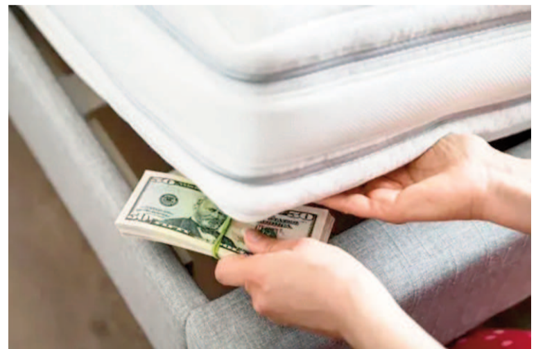
La intención del Gobierno es estimular el uso de esas divisas sin necesidad de emitir pesos.

«Esto es un tema estrictamente del Ministerio de Economía, por supuesto con todos los asesoramientos legales, pero será el ministro de Economía (Luis Caputo) el que hará el anuncio cuando esté lista la norma», indicó Francos.