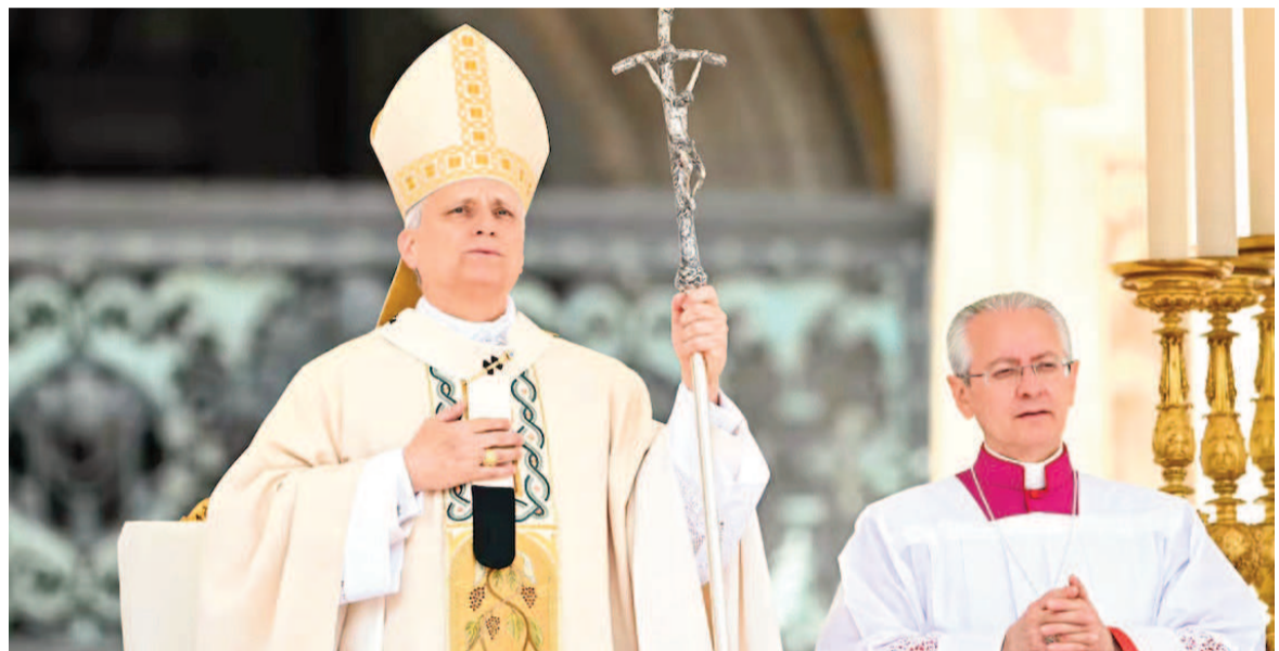
León XIV comenzó formalmente su papado.

«Hermanos, hermanas, ¡esta es la hora del amor!», exclamó el Papa al final de su homilía. «Con la luz y la fuerza del Espíritu Santo, construyamos una Iglesia fundada en el amor de Dios y signo de unidad, una Iglesia misionera que abra los brazos al mundo, que anuncie la Palabra, que se deje perturbar por la historia