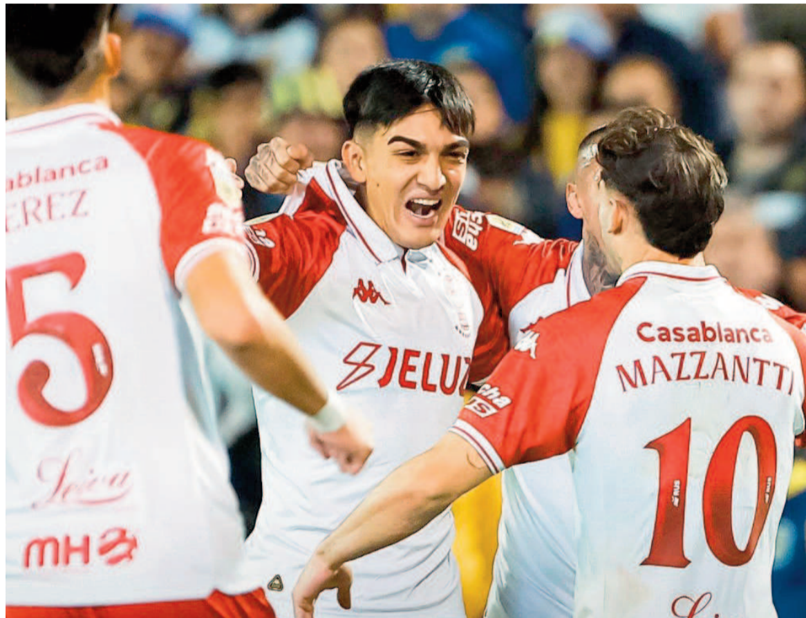
El equipo de Fran Kudelka dio el golpe ante el "Canalla". NA

El Globo derrotó a Central por 1 a 0 con gol de Walter Mazzanti en el Gigante de Arroyito y avanzó a semis, instancia en la que se medirá frente al ganador de Boca vs. Independiente.