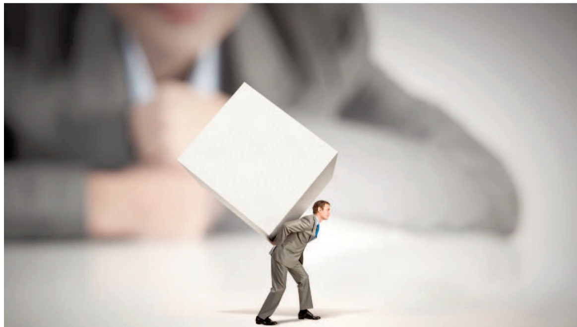
La autoexigencia, otro símbolo de época.

se ve afectado. Las digestiones lentas, la distensión abdominal, la acidez o los cambios en el ritmo de evacuación intestinal (estreñimiento o diarrea) son reacciones frecuentes ante un estilo de vida acelerado y tensionado.