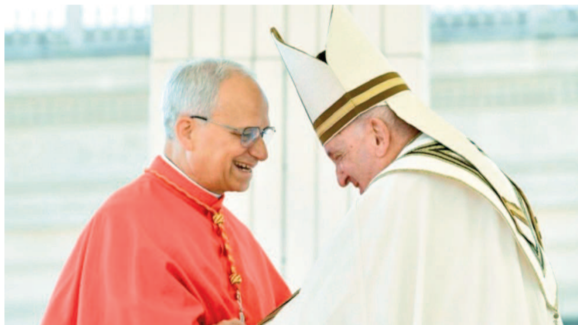
El actual pontífice destacó las virtudes de su antecesor.

En su primera homilía como pontífice, el papa León XIV recordó con emoción a su predecesor, Francisco, a quien definió como una guía espiritual cuya partida dejó al pueblo de Dios “como ovejas que no tienen pastor”.