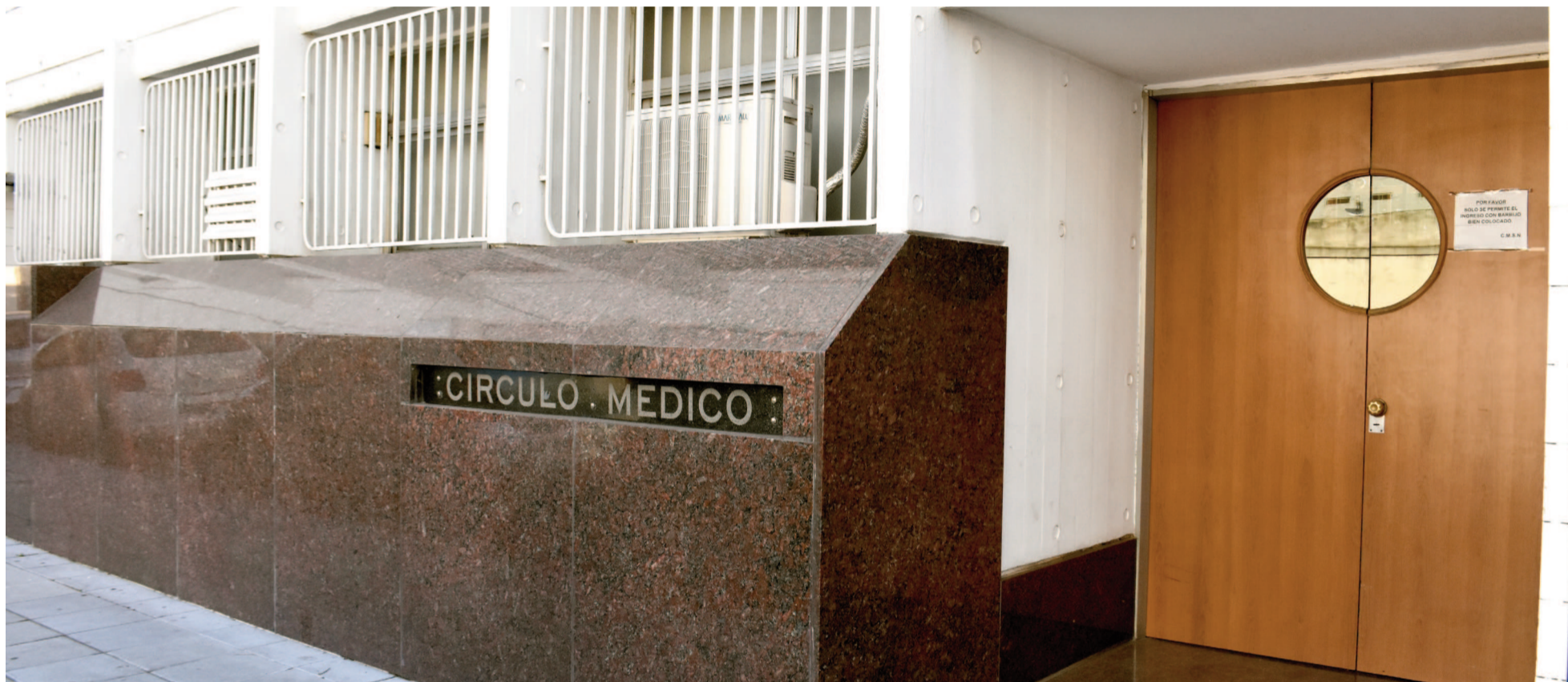
La fundación del Círculo Médico de San Nicolás data del 19 de mayo de 1933. Hoy la entidad tiene su sede en Guardia Nacional 15.

Creado en 1933, con el objetivo de cultivar el científicismo, dictar normas que orienten el ejercicio profesional, defender el interés del gremio, fomentar la unión entre sus afiliados y velar por el mantenimiento de la ética profesional, el Círculo Médico de San Nicolás continúa hoy acompañando a los profesionales de la salud y bregando por sus derechos en un marco de diálogo, compromiso y respeto.