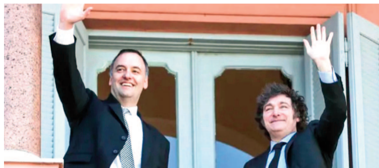
Adorni y Milei, los ganadores del domingo.

"Macri está hecho un llorón, está muy de cristal. Puro cristal", lanzó sin filtros.