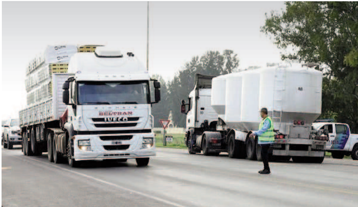
ARBA realiza controles al campo.

"Se trata de un operativo clave para la Agencia porque acompaña uno de los principales circuitos económicos de la Provincia. Queremos asegurar que cada carga