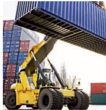
Eliminaron retenciones a exportaciones industriales.

Por otro lado, el funcionario informó que el descubrimiento, en el distrito sanjuanino de Vicuña, de