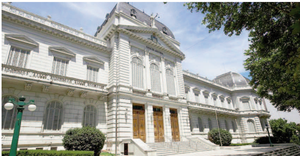
Los judiciales bonaerenses mostraron su descontento.

Luego explicaron que "se trató de un paro convocado por la CGT y las CTAs y que tuvo un amplio acatamiento por parte de trabajadoras y trabajadores de todo el país". En