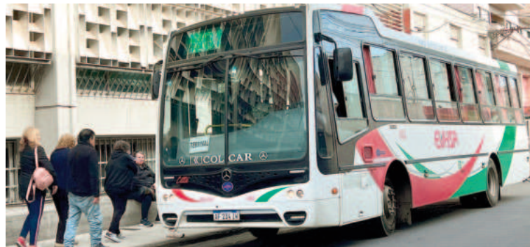
FATAP pidió al Gobierno por el transporte del interior. EL NORTE

“Sin previo aviso formal y desoyendo las normas de la Ley 14.786, se ha paralizado una actividad esencial para millones de argentinos que carecen de medios alternativos de transporte público, perjudicando sus actividades diarias a causa de un conflicto suscitado entre el sector