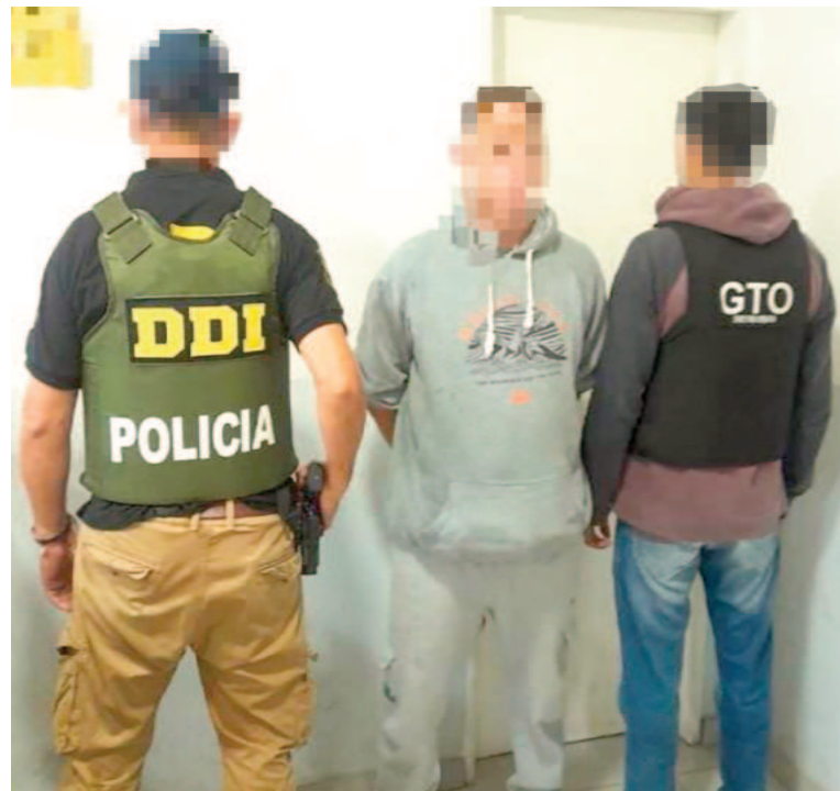
Detuvieron a un sujeto acusado de robo y secuestro.

El fiscal interviniente avaló las actuaciones policiales y dispuso las diligencias de rigor. El caso fue caratulado como "Robo agravado por el uso de armas de fuego - esclarecido".