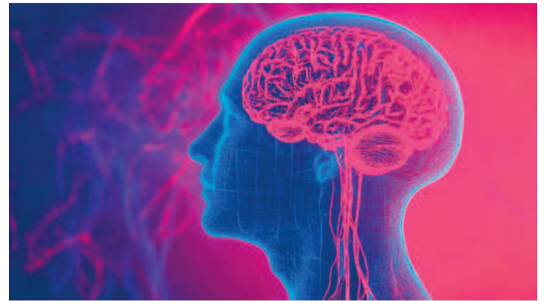
Las conexiones neuronales pueden ajustarse para reforzar pensamientos positivos con el tiempo.

Algunas evidencias sugieren que la felicidad puede cambiar la estructura de los recuerdos en el cerebro, modificando la interpretación de las experiencias pasadas. Esto implica que la percepción del mundo no es un proceso estático, sino que está en constante transformación según el estado emocional de cada individuo. La influencia de la felicidad no se limita a un simple sentimiento de bienestar y puede determinar cómo una persona enfrenta su presente o proyecta su futuro.