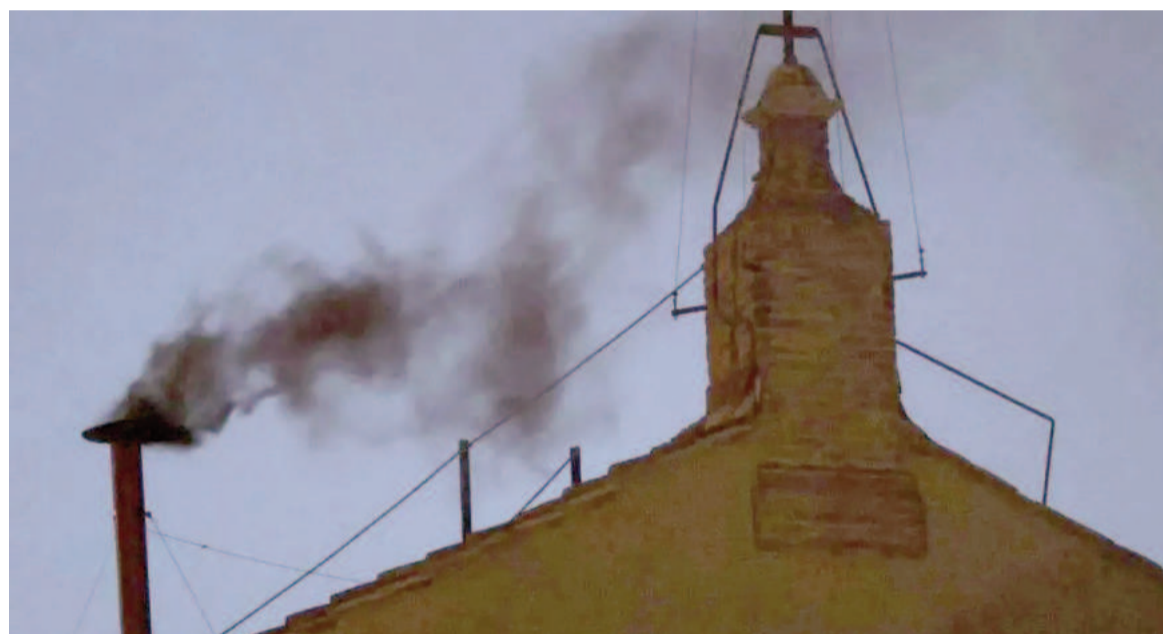
Hoy hubo fumata negra.

Tal como se preveía, no hubo acuerdo entre los cardenales en la primera jornada y continúa la incertidumbre sobre quién será el sucesor de Francisco.