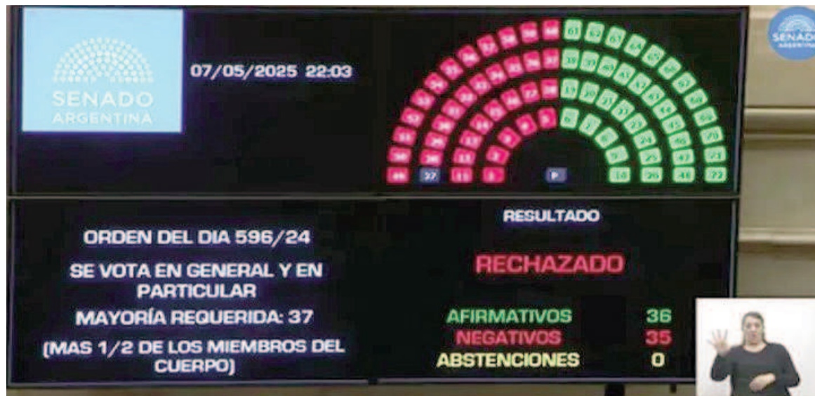
La iniciativa necesitaba una mayoría de 37 votos, que no consiguió por uno.

El giro de los renovadores misioneros, que se han mostrado como