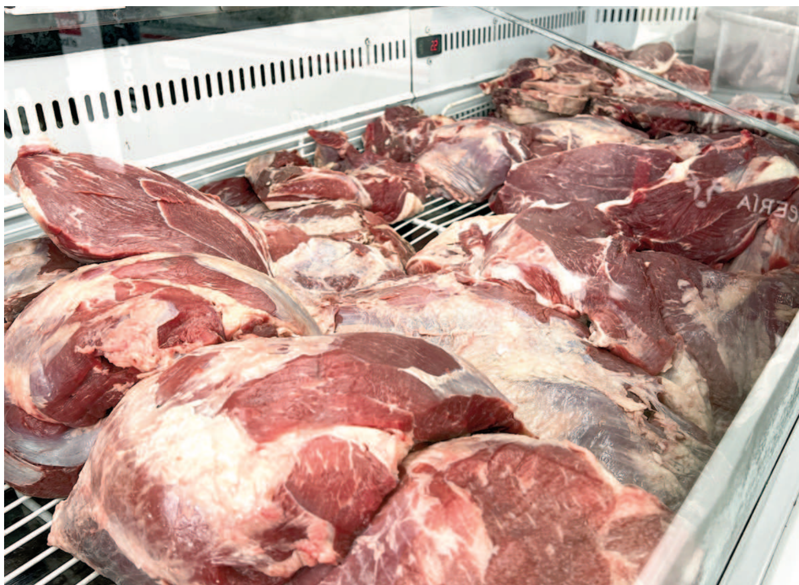
En San Nicolás se registró en el cuarto mes del año un aumento de la carne que promedió en los mostradores el 3,8%.

Aunque sostuvo que no se vislumbran nuevos aumentos en el corto plazo, advirtió que “habiendo incluso promociones de algunos cortes, la gente igual no consume porque no hay poder adquisitivo”. Y sumó: “Cayó mucho el consumo, más que en nuestro rubro ya no hay casi ofertas de las billeteras virtuales. El Banco Provincia mantiene un solo sábado por mes la promoción, y el Banco