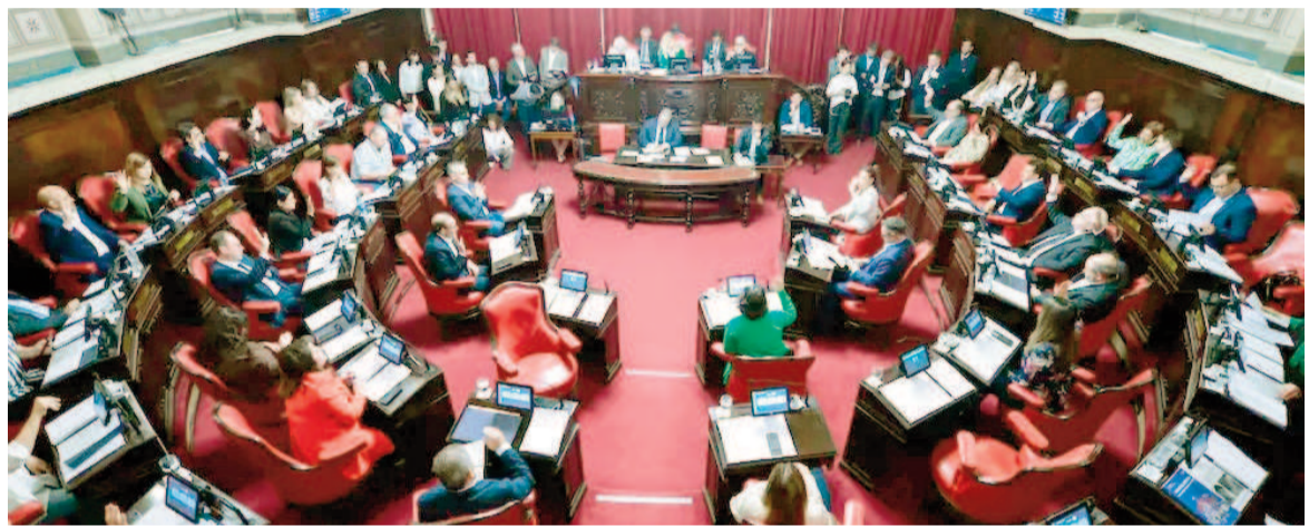
El Senado bonaerense aprueba 131 pliegos judiciales.

El acuerdo que permitió la aprobación de los pliegos fue alcanzado después de intensas negociaciones entre los distintos bloques. Desde la administración de Axel Kicillof señalaron que los acuerdos se lograron tras un diálogo con la oposición, y que la mayoría de los nombres propuestos