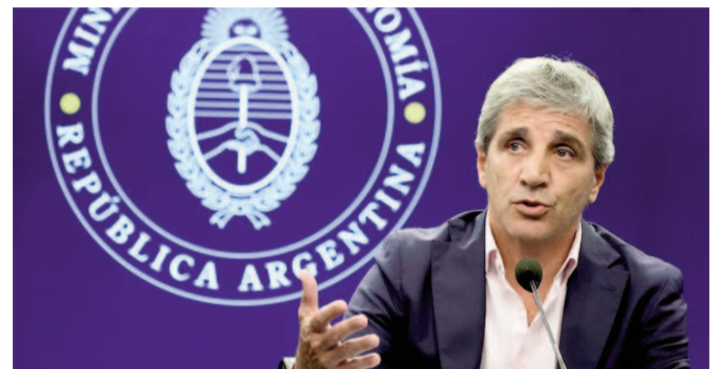
Ministro de Economía Luis Caputo.

Si bien en el mercado se especuló en los últimos días con un título “peso linked”, se trata de un formato distinto. A diferencia del típico dólar linked, implicará el uso de dos monedas distintas. En los bonos atados al tipo de cambio el inversor invierte pesos y recibe pesos. Para el nuevo Bonte licitado hoy, los fondos usan sus dólares y al vencimiento recibirán pesos. Además, serán bonos que se regirán bajo ley local y no bajo jurisdicción Nueva York, que es la más utilizada para emitir bonos