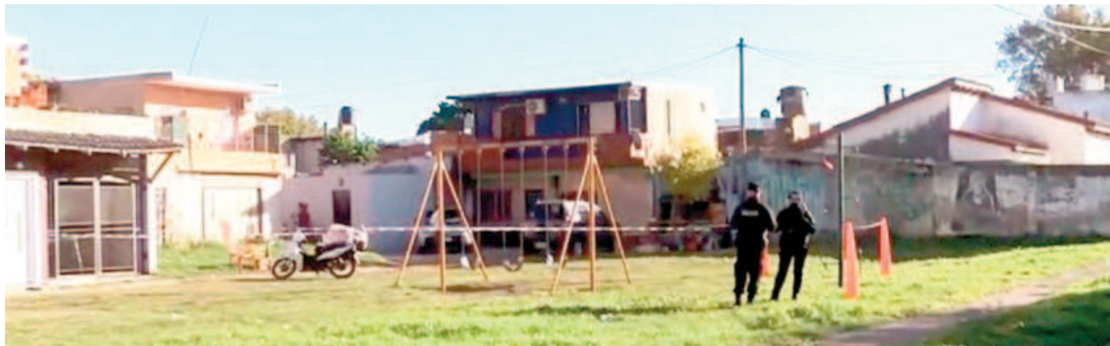
La plazoleta del sur rosarino donde ocurrió el violento suceso.

La víctima, que estaría en situación de calle, logró caminar