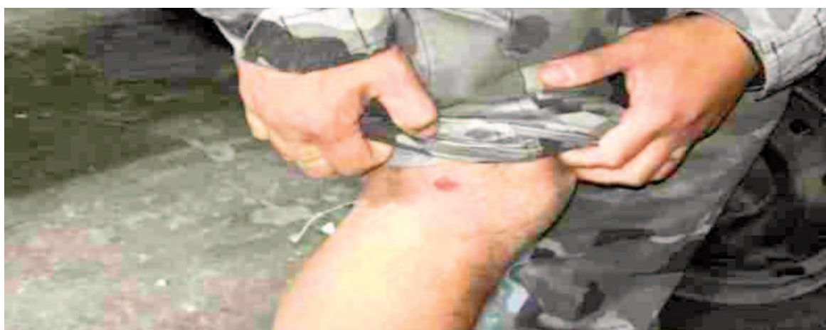
El suboficial sufrió una herida de bala en su pierna derecha, pero está fuera de peligro.

El personal policial también detuvo al hermano del atacante por un intento de resistencia a la autoridad durante el allanamiento llevado a cabo en la zona sur de Rosario.