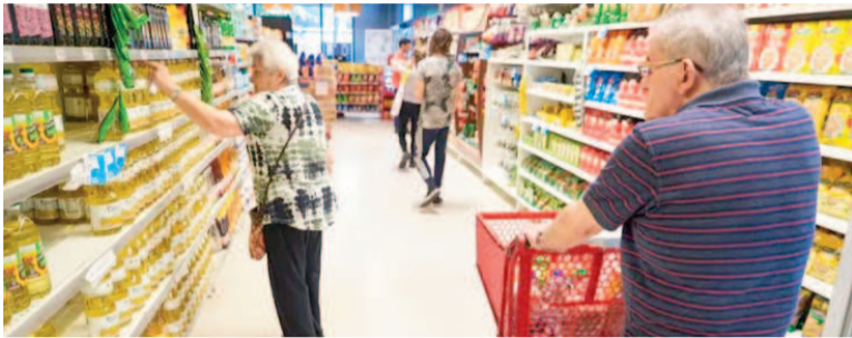
La inflación continuaría bajando en este mes.

Falta poco para que termine el mes y el sector privado publicó proyecciones de inflación similares para mayo. Si estos números se condicen con el dato oficial del Indec, el Índice de Precios al Consumidor (IPC) volvería a mostrar una desaceleración, aunque no perforaría todavía el 2%.