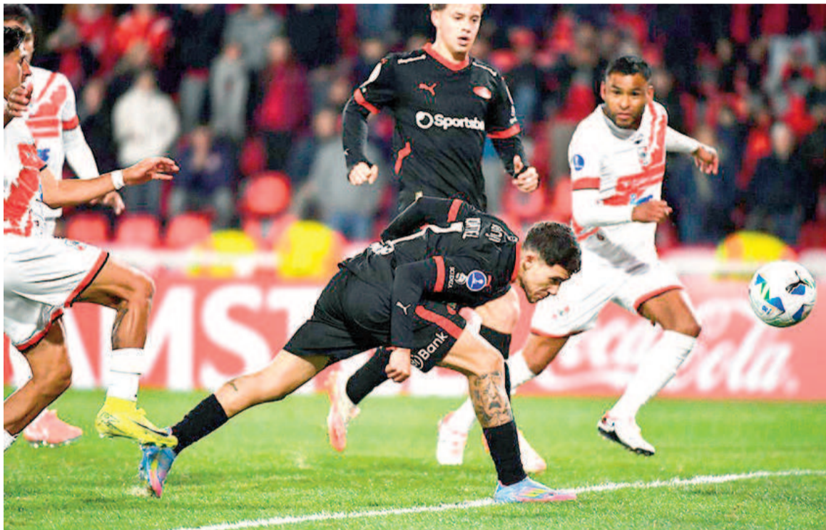
El Rojo fue una máquina y goleó al equipo boliviano.