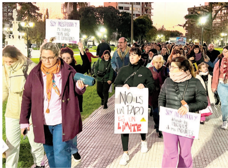
Integrantes de equipos de prestaciones en discapacidad, familias y pacientes se convocaron ayer en la Plaza Mitre para mostrar la difícil situación del sector.

El foco está puesto en presionar al Gobierno nacional para mejorar las condiciones de los prestadores de servicios en discapacidad como salud, transporte y educación, quienes alertan sobre una situación económicamente insostenible que amenaza con forzar el cierre de muchas instituciones y dejar a chicos y chicas sin apoyos. La crisis no solo afecta a quienes dependen directamente de estos servicios, sino también a las organizaciones que trabajan diariamente en el cuidado