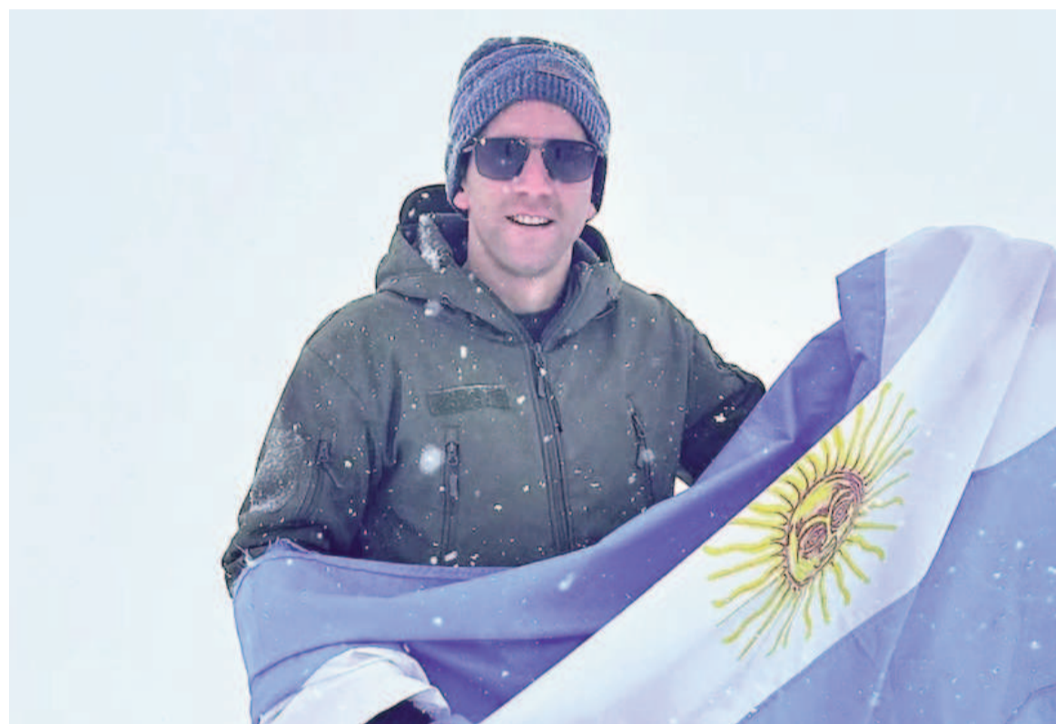
El gendarme argentino había viajado por primera vez a Venezuela.