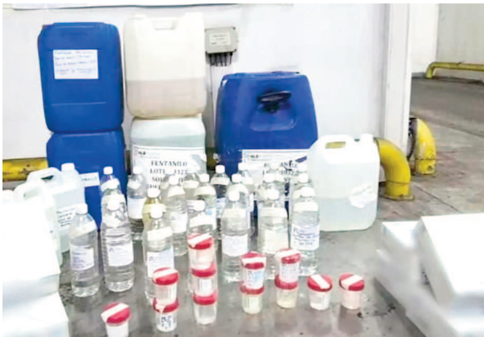
Material secuestrado por la Policía Federal Argentina en los allanamientos a HLB Pharma y Laboratorios Ramallo.

- Además, la Anmat deberá remitir en el mismo plazo de 48 horas "toda la documentación administrativa vinculada a HLB Pharma Group S.A. y Laboratorios Ramallo S.A., especialmente relacionada con fentanilo y con los lotes contaminados, desde