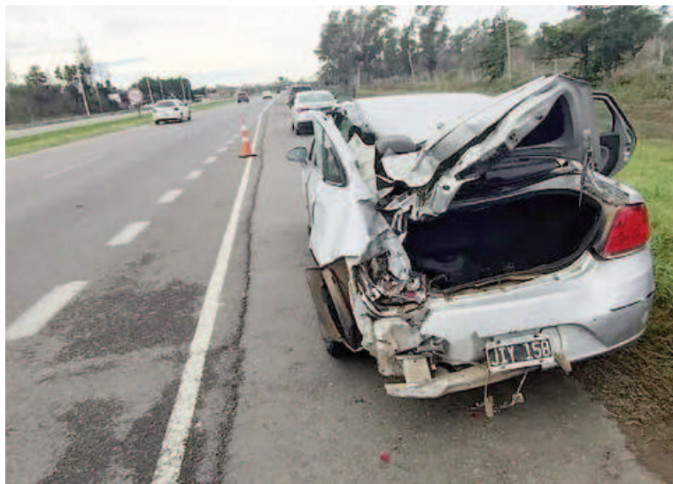
La carrocería del automóvil quedó totalmente destruida.

El hecho generó preocupación dentro de la fuerza policial, tanto por el estado de salud de los efectivos