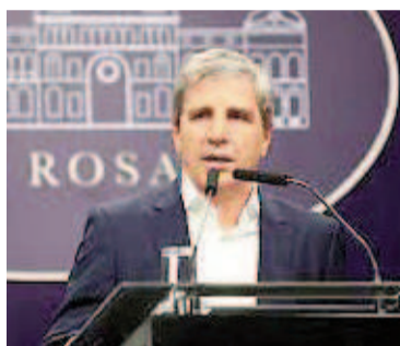
Ministro de Economía Luis Caputo.

"No vamos a permitir que el kirchnerismo tenga la oportunidad de acusar de electoralista un paquete de medidas trascendentales para todos los ahorristas argentinos", había expresado Adorni, por su proximidad con las elecciones legislativas de CABA. El ministro de Economía, Luis Caputo, anticipó durante