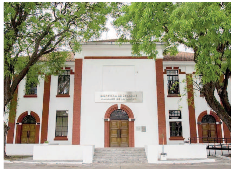
Reducen la jerarquía del área de Derechos Humanos.

"Cada peso que se ahorra nos permite seguir bajando impuestos", sostuvieron desde el Poder Ejecutivo.