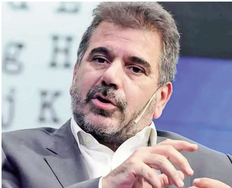
El PRO busca refloatar esta foto.

Ayer, en el marco del AmCham Summit, el dirigente reafirmó que