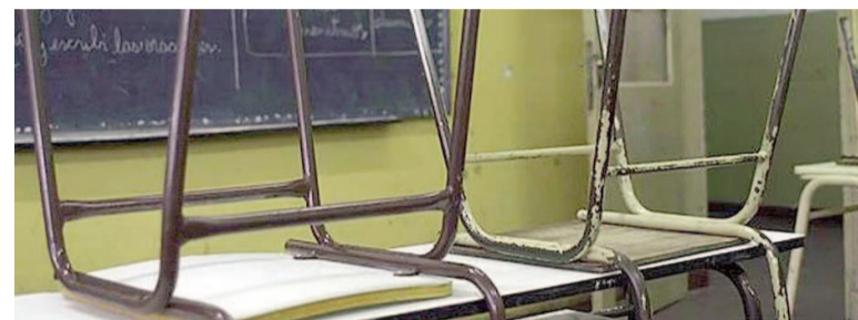
La educación es uno de los sectores incluidos en el decreto 340.

más servicios portuarios. Lo mismo para los servicios aduaneros y migratorios, y otros vinculados al comercio exterior; el cuidado de menores y la educación en los niveles de guardería, preescolar, primaria, secundaria y educación especial; y el transporte marítimo y fluvial de personas, mercaderías y carga, junto a los servicios conexos y operaciones costa afuera.