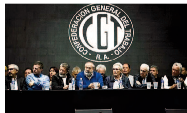
La CGT mostró su descontento.

A través de un decreto que busca regular el funcionamiento de la marina mercante, el Gobierno resolvió volver a la carga con su objetivo de limitar el derecho a huelga, un apuesta que la gestión de Javier Milei ya había intentado a través del DNU 70/23 -cuyo capítulo laboral fue frenado por la Jus-