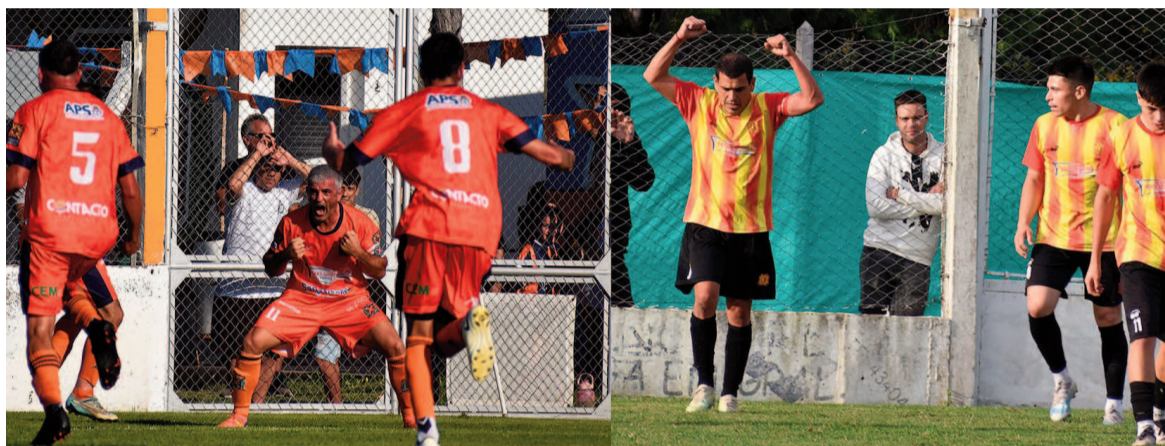
El Náutico y el Rojo juegan por primera vez en el Estadio San Nicolás. EL NORTE

La situación del Rojo es mucho más apremiante: necesita la victoria para mantener sus chances de clasificar a la Liguilla, lugar del que salió luego de una seguidilla de resultados adversos. El equipo de Huber tuvo un muy buen arranque, pero dejó escapar puntos clave en las últimas fechas y cayó al noveno puesto. En las tribunas se espera