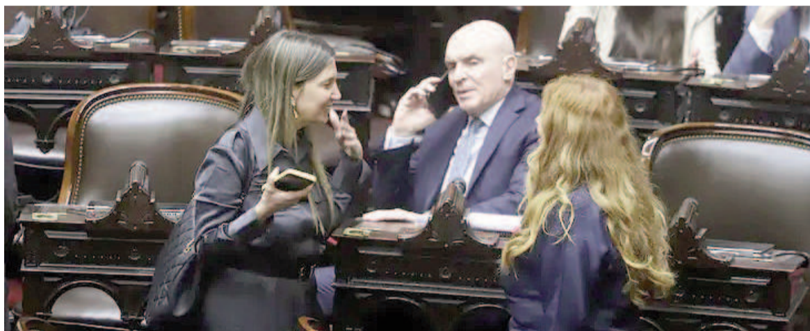
Javier Milei promueve a José Luis Espert en provincia.

Sobre Espert, además destacó que "es un jugador importantísimo y cla-