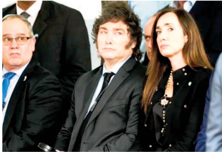
Javier Milei junto a Victoria Villarruel, en el Tedeum de 2024.

otros que se comprometan, pero yo ¿qué hago?, ¿podremos mirarnos y responder esa pregunta sin echar