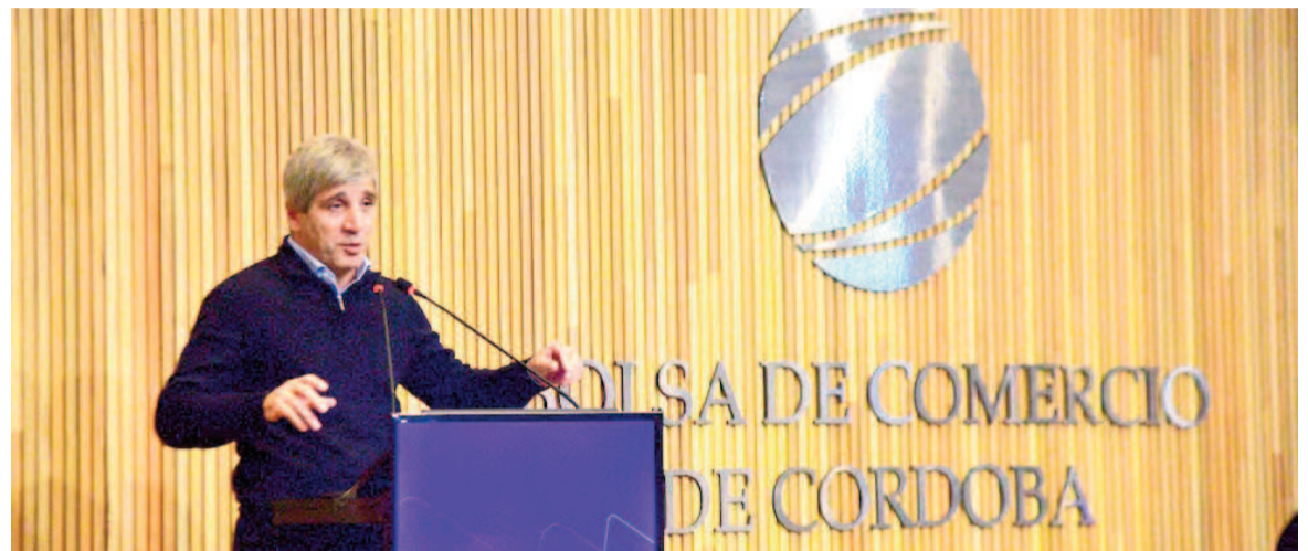
El ministro de Economía habló ante empresarios en la Bolsa de Comercio cordobesa.

El ministro dijo que «el modelo anterior no funcionaba. Desde los 90, el Estado duplicó su tamaño, el gasto público pasó del 23% al 47% del PBI y eso vino acompañado de una presión impositiva y regulatoria asfixiante, que empujó a ciudadanos y empresas