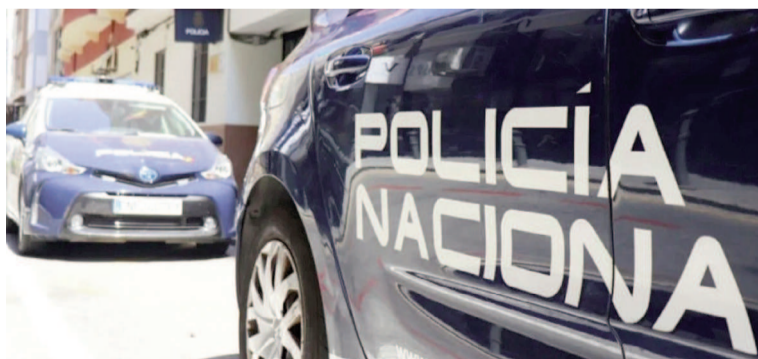
La Policía de España investiga el suceso.

Como resultado de una primera inspección ocular se constató que ambos cadáveres tenían diversos