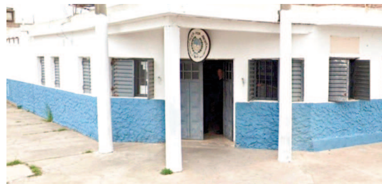
El mensaje intimidatorio apareció frente a esta seccional.

La nota –y la granada– también estaba dirigida a “la gente de Peyrano”, localidad cercana perteneciente al mismo departamento.