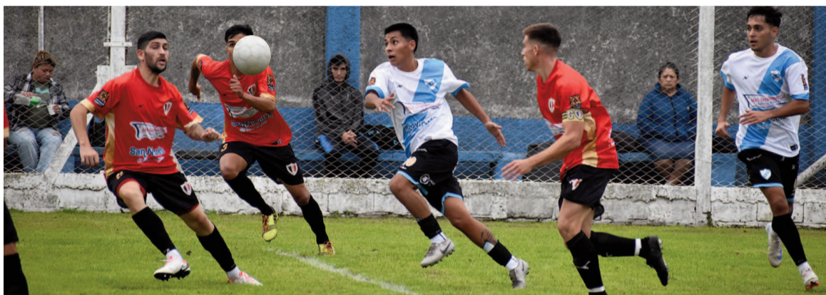
Paraná ganó y es único escolta de Regatas.