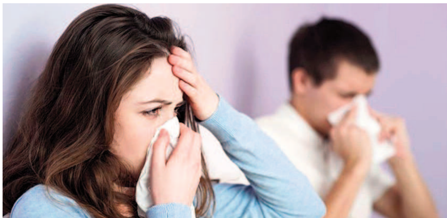
La vacunación de calendario y el lavado de manos son fundamentales para prevenir las afecciones prevalentes en el período invernal. ILUSTRACIÓN

La Sociedad Argentina de Infectología (SADI) recomienda también la vacu-