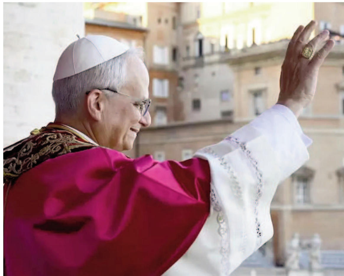
El papa León XIV vendrá a la Argentina.

El Sumo Pontífice había manifestado en reiteradas oportunidades su intención de visitar América Latina. Ahora, fue el cardenal uruguayo Daniel Sturla quien confirmó que León XIV incluirá a la región en su agenda de viajes.