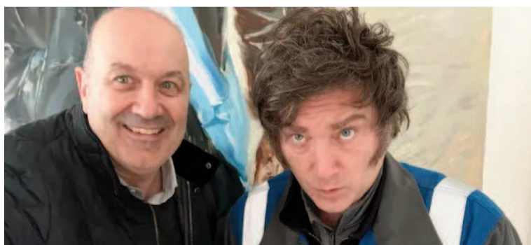
Federico Sturzenegger se reunió con Javier Milei este sábado a la mañana.

“Siempre la idea fue no renovarlas (las facultades delegadas) porque yo necesitaba que mi equipo estuviera muy consciente del tiempo que teníamos. Y todo lo que podíamos hacer por facultades delegadas, cuando venzan esos días va a estar hecho”, explicó Sturzenegger.