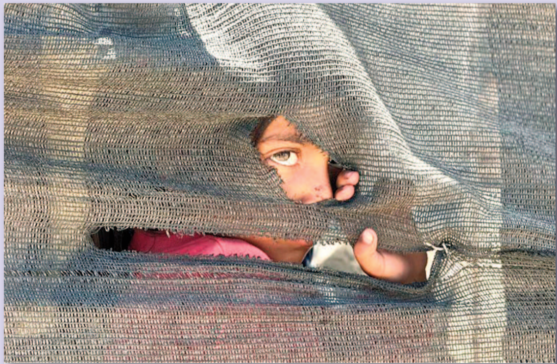
Foto de una niña en el puerto en la Ciudad de Gaza.

El martes el secretario de la Oficina de la ONU para Asuntos Humanitarios, Tom Fletcher, advirtió que 14.000 bebés corrían riesgo de morir en Gaza en las 48 horas siguientes si no se permitía el ingreso de ayuda humanitaria a la zona. Dos días después, la Organización Mundial de la Salud advirtió que «la intensificación de las operaciones militares de Israel sigue amenazando un sistema de salud ya debilitado, en un contexto de creciente desplazamiento masivo de la población y una grave escasez de alimentos, agua, suministros médicos, combustible y refugio». En un comunicado, el organismo detalló que 94% de los hospitales de la Franja de Gaza están dañados o destruidos, tanto solo 19 de los 36 centros hospitalarios que sobreviven a los ataques están funcionando.