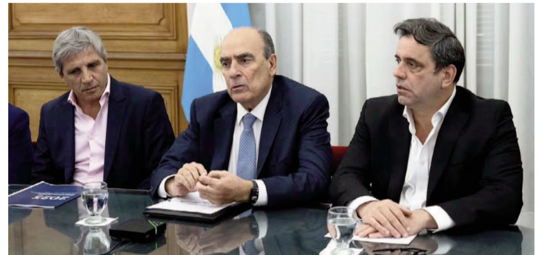
La Casa Rosada recibe a gobernadores para firmar la adhesión al nuevo régimen de información fiscal.

La Casa Rosada convocará también a comprometerse con la apli-