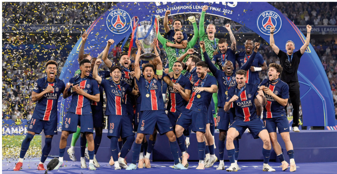
El club parisino logró su primera orejona con gran actuación. NA

Paris Saint-Germain consiguió su primera Champions League, tras golear por 5 a 0 al Inter de Milán en el partido final disputado esta tarde en el estadio Allianz Arena de Munich ante una multitud. El resultado reflejó la diferencia entre uno y otro equipo, y no dejó dudas respecto a la superioridad del PSG, que a los 20 minutos ya ganaba 2-0 y tenía todo controlado. El conjunto francés golpeó de forma contundente con los