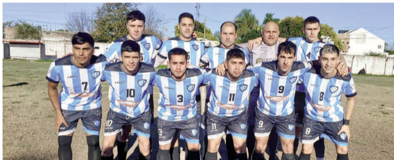
La Academia llega con posibilidades a la última fecha. EL NORTE