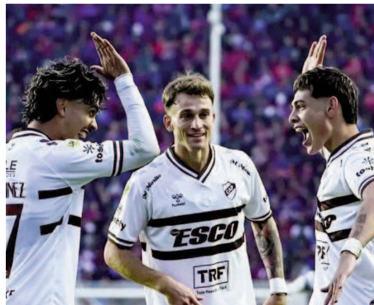
Platense buscará hoy el primer título de su historia.