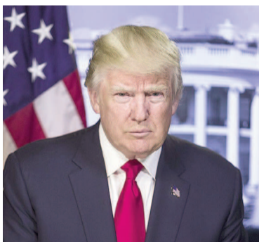
Trump anunció la duplicación de aranceles al acero y al aluminio.

Argentina exporta aproximadamente 180.000 toneladas de productos de acero a Estados Unidos