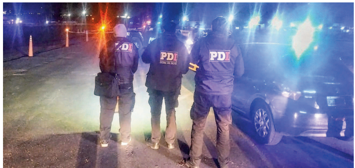
Otro menor muerto en la provincia de Santa Fe.

Una rara secuencia que arrancó con la denuncia del delito, siguió con la intercepción de personas montadas y en vehículos y derivó en el hallazgo del cuerpo del adolescente, cerca del cruce con la A012, con dos orificios de bala en el pecho.