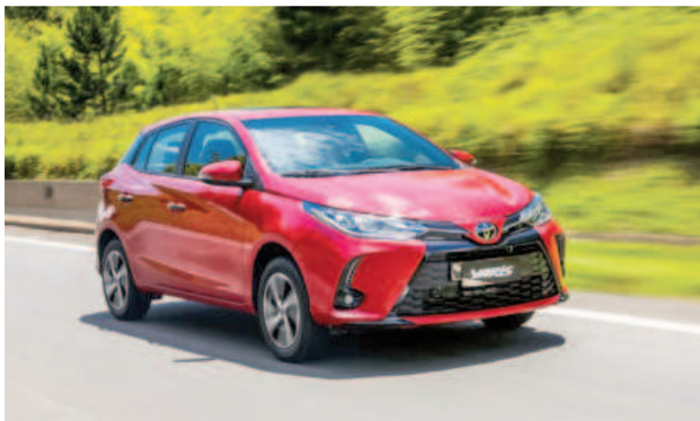
Toyota Yaris fue el auto más patentado durante mayo.

El mercado automotor argentino continúa en alza: durante el mes de mayo se patentaron 55.363 vehículos nuevos, con un incremento del 59,1% respecto al mismo mes de 2024, según informó la Asociación de Concesionarios de Automotores de la República Argentina (Acara).