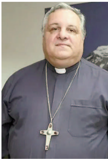
Monseñor Marcelo Colombo.

“El esfuerzo cotidiano de las familias que los acompañan muchas veces se realiza en soledad, sin el reconocimiento suficiente de la sociedad ni el apoyo adecuado del Estado. Esa realidad no es una cifra estadística: tiene nombres, rostros e historias. Son niños, jóvenes y adultos que ven cercenadas sus posibilidades de desarrollo, participación e inclusión plena”, enfatizó la Iglesia.