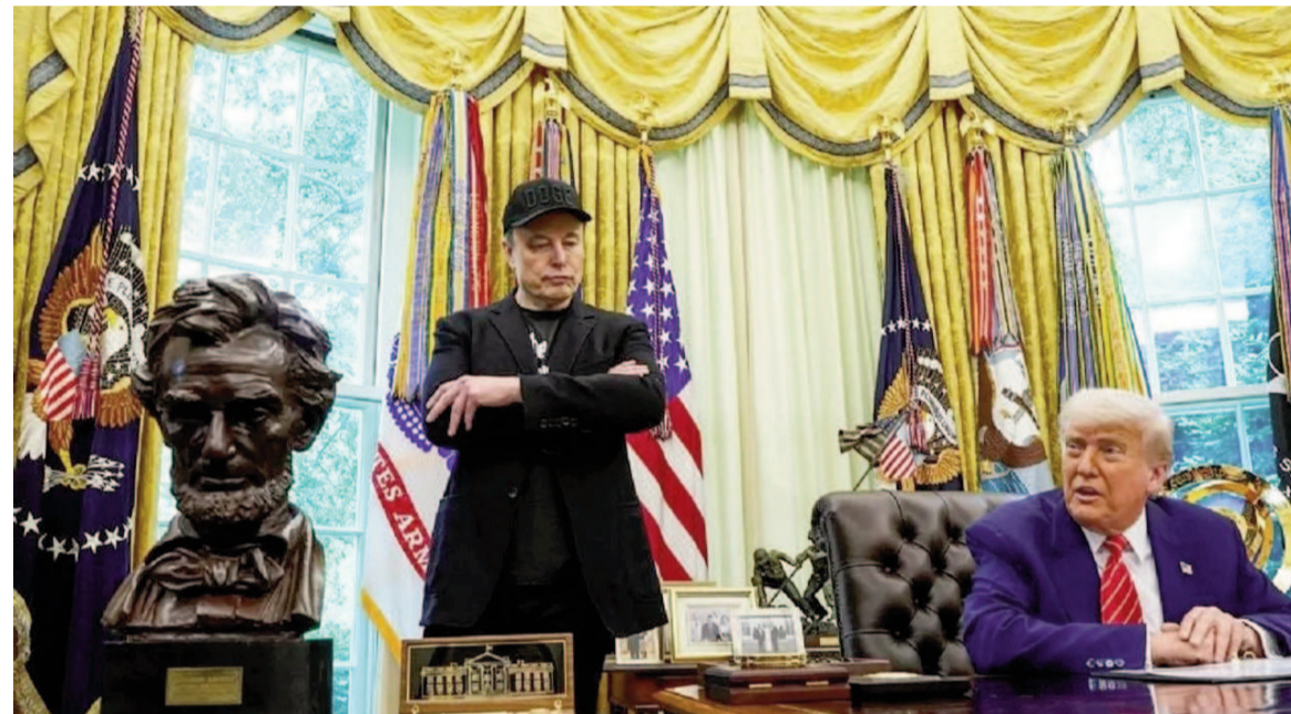
Elon Musk dejó el Departamento de Eficiencia Gubernamental de EE.UU.

El multimillonario empresario regresará a sus negocios privados como Tesla, SpaceX y la red social X. El presidente estadounidense le otorgó la "llave dorada".