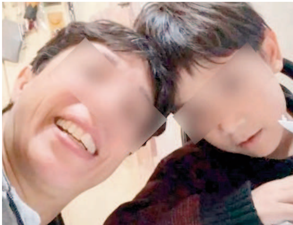
Una mujer de 47 años y su hijo de 6 fueron encontrados muertos a tiros en su casa de Florencio Varela.