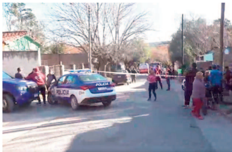
El hecho ocurrió en la casa de la víctima.

Según informaron fuentes policiales, la víctima habría sufrido le-