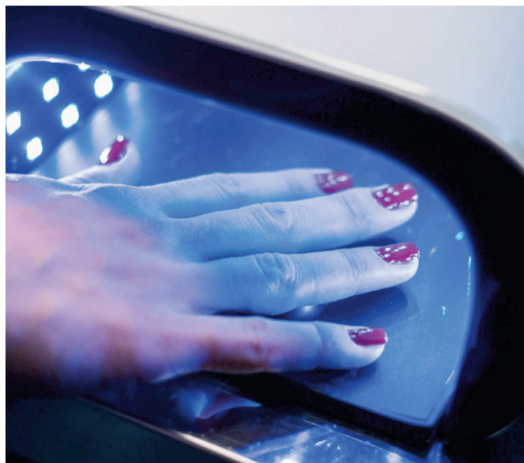
Investigadores del Conicet evaluaron el impacto de las lámparas de secado UV sobre moléculas clave de la piel, como la tirosinasa.

“Se trata de procesos que, de una u otra forma, derivan en la muerte celular. El ejemplo más claro en este caso es la acción que se produce sobre la tirosinasa, una de las enzimas que participan de la síntesis de melanina, el pigmento natural que da el color a la piel y el pelo y que nos protege de los