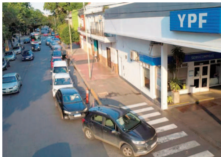
YPF es la primera petrolera en aplicar el aumento.

Este ajuste se produce luego de varios movimientos en el mercado durante mayo. A comienzos del mes, YPF sorprendió con una baja promedio del 4% en los precios de la nafta y el gasoil, decisión que fue replicada por otras compañías del sector. La medida estuvo motivada por la caída en las cotizaciones internacionales del petróleo, en un contexto de menor demanda global y tensiones comerciales, especialmente por la política arance-