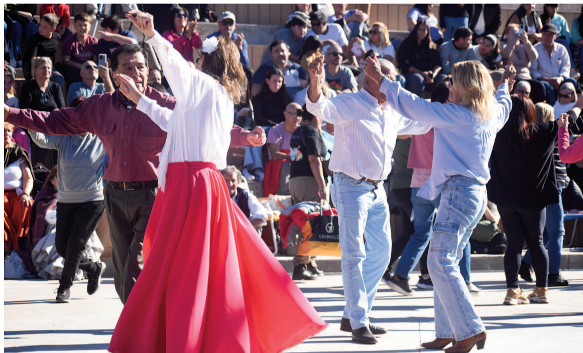
Los bailarines y la música en vivo invitaron al público presente a sumarse a la celebración en el escenario.

“Quería saludarlos en este día tan especial para San Nicolás y para nuestra historia, para la historia de nuestro país. Porque hoy estamos celebrando un aniversario más del Acuerdo de San Nicolás, que fue tan