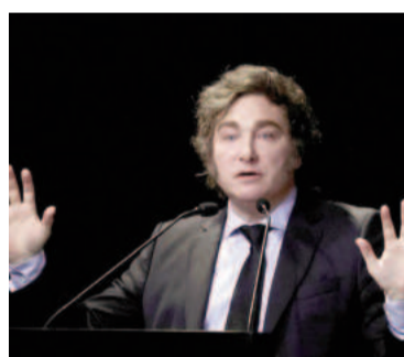
El Gobierno hizo saber el enojo del jefe de Estado tras la votación en el Senado.

dores tuvieron a disposición los pliegos de los Dres. Manuel García-Mansilla y Ariel Lijo, participando en toda instancia del proceso de selección establecida por la normativa vigente. Sin embargo, luego de dilatar la votación durante meses, optaron por priorizar la preocupación por sus causas judiciales y las de sus dirigentes, en detrimento del funcionamiento de uno de los tres poderes de la República", agrega el comunicado.