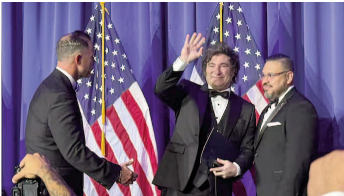
El presidente Javier Milei en el evento.

"Como resultado de todas las medidas implementadas. El crecimiento punta a punta de diciembre de 2023 a 2024 fue del 6%, razón por la cual sacamos de la pobreza al 20% de la población argentina", destacó y ratificó: "Nuestra agenda de reformas