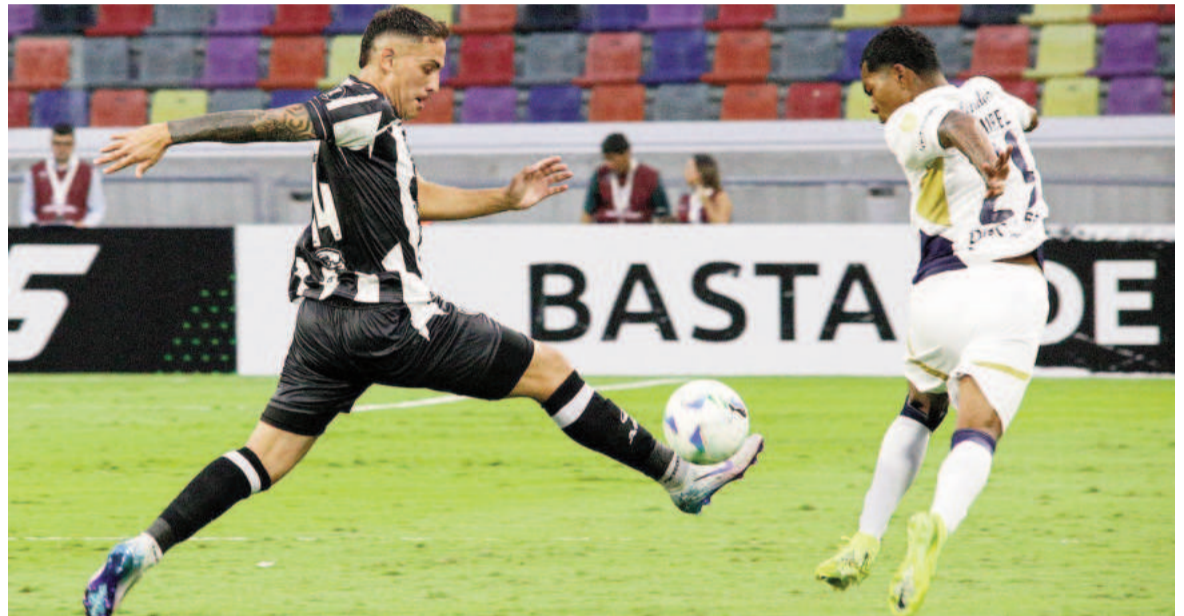
El Ferroviario jugará en el Maracanã la próxima semana. NA

El equipo santiagueño tuvo su estreno absoluto en el máximo certamen continental. Fue 0 a 0 en el "Madre de Ciudades" frente a Liga de Quito, en el arranque del Grupo C.