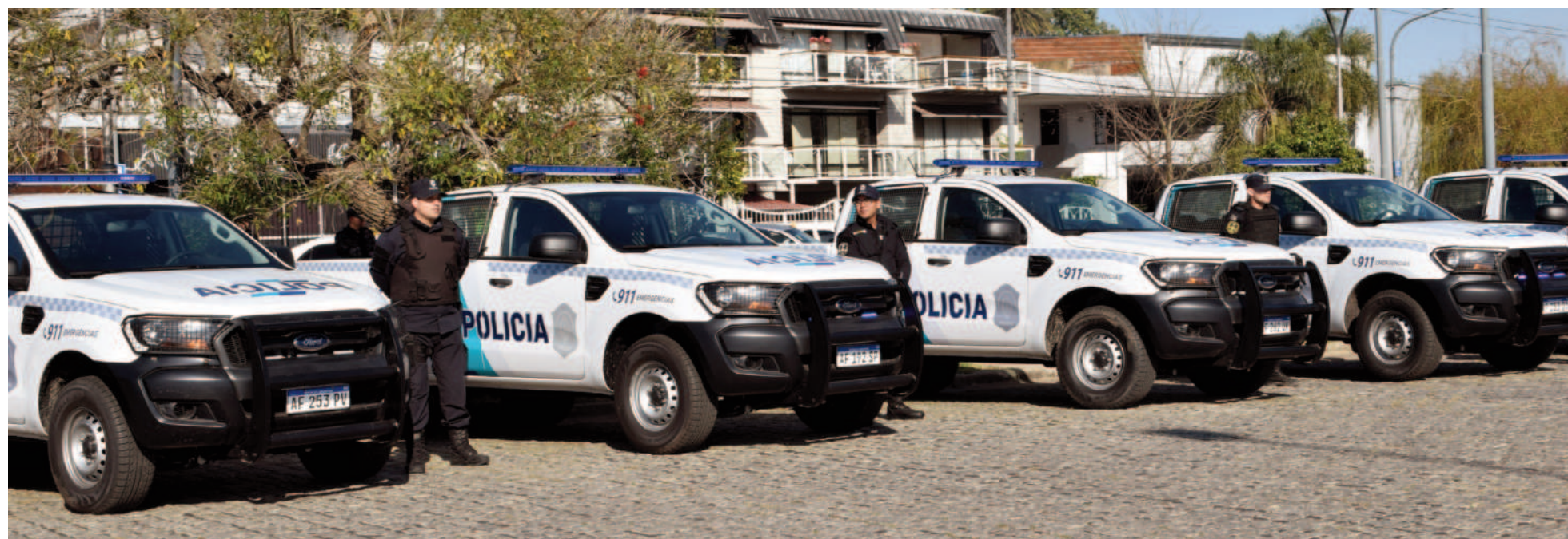
En cada distrito, los recursos deberán ser destinados por los intendentes exclusivamente a inversión en seguridad.

De los $70.000 millones que el Gobierno provincial repartirá entre 44 municipios con más de 70.000 habitantes, a San Nicolás corresponden $770,5 millones. Los desembolsos deberán darse en tres tramos: 40% en abril, 30% en junio y otro 30% en octubre. En la Segunda Sección también están alcanzados Zárate con casi $603 millones y Pergamino con $560 millones.