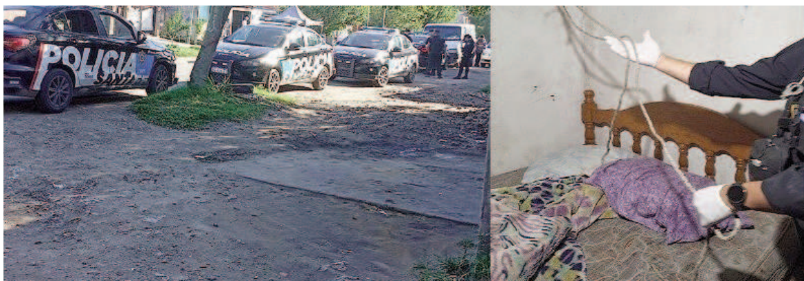
Los efectivos del Comando Radioeléctrico encontraron una soga con la que habría inmovilizado a la mujer.

Se halló una soga, con la cual habría maniatado a la mujer, y un ma-