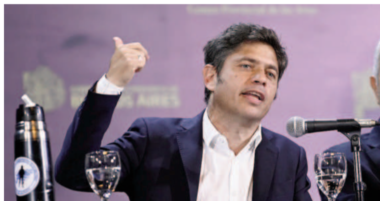
Axel Kicillof en el Teatro Argentino de La Plata.

"Pretendo tener una discusión fraternal y compañera. Poder solucionarla y no repetir lo que pasó. Y contener a todos los sectores que se sintieron excluidos y se fueron", manifestó Kicillof, al ensayar una autocrítica sobre la derrota del peronismo en 2023.