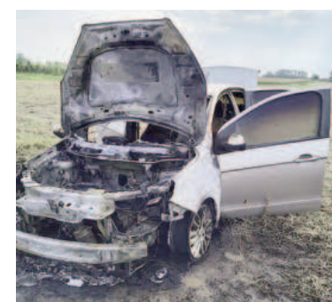
Estado en que quedó la unidad.

La Fiscalía N° 5, que subroga el fiscal Francisco Furnari, dispuso que se labren las actuaciones correspondientes bajo la carátula de "accidente sin intervención de terceros", al no haber personas lesionadas. El vehículo no fue secuestrado y quedó en el lugar del siniestro.