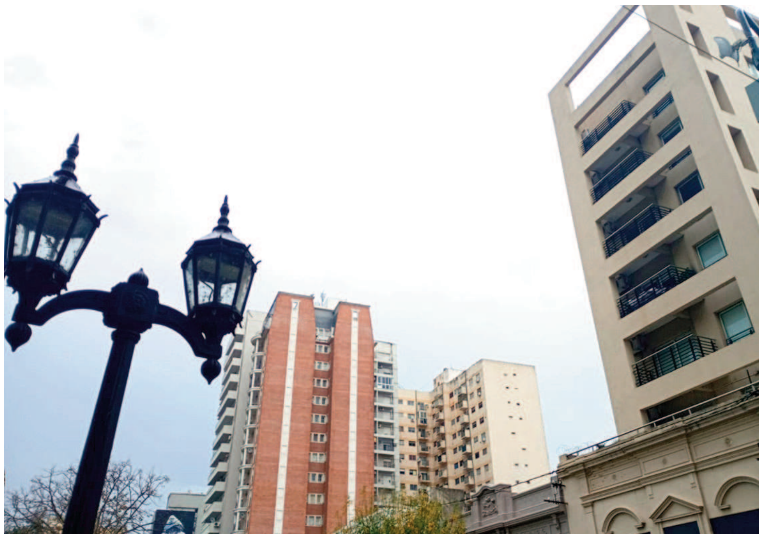
Tras la derogación de la anterior Ley de Alquileres, en San Nicolás la mayoría de los contratos se acordaron con actualizaciones cuatrimestrales. EL NORTE

Los contratos firmados bajo lo que establecía la Ley de Alquileres incluían una cláusula que establecía que la actualización anual (así lo exigía aquella normativa) operaría en virtud de lo que indicase la variación del Índice de Contratos de Locación (ICL), que contempla tanto la evolución de la inflación (medida mensualmente por el Indec a través del Índice de Precios al Consumidor