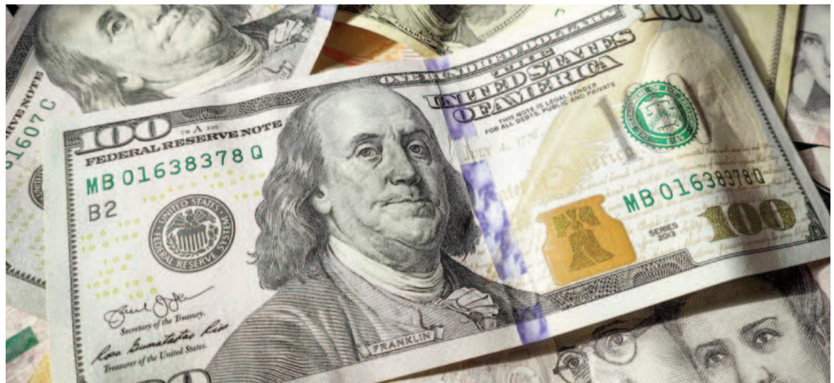
El dólar subió por segunda jornada consecutiva.

El dólar cripto cotizó a $1.198,41. El Bitcoin operó en US$ 93.950.