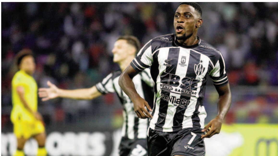
El equipo de De Felipe sigue firme en el certamen continental. NA

El Ferroviario derrotó a Deportivo Táchira de Venezuela por 2 a 1 en el Estadio Único Madre de Ciudades de Santiago del Estero y es puntero del Grupo C. Angulo y Quagliata anotaron los goles del local.