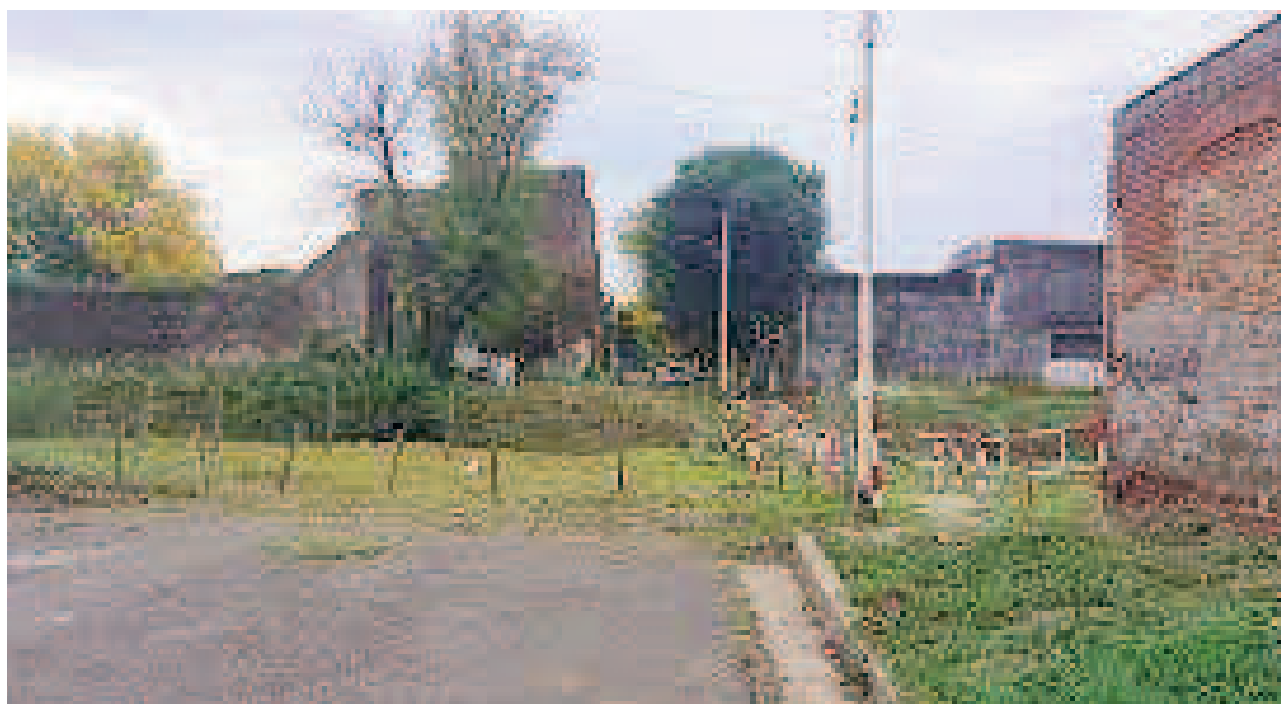
Lugar donde se habrían desarrollado los hechos denunciados.

El hecho ocurrió en una zona conocida por su escasa iluminación y baja circulación durante buena parte del día, lo que la convierte en un sitio vulnerable para personas en situación de calle o en contextos de prostitución. La víctima relató que fue abordada por un sujeto que, luego de amenazarla, la llevó a un sector apartado donde sufrió un ataque sexual. Además, habría sido agredida físicamente,