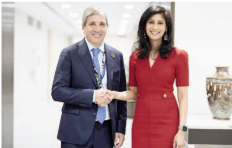
Luis Caputo se reunió con la número 2 del FMI, Gita Gopinath.

La subdirectora gerente del Fondo Monetario Internacional, Gita Gopinath, expresó este jueves su respaldo al rumbo económico del Gobierno argentino, tras mantener una reunión con el ministro de Economía, Luis "Toto" Caputo, en el marco de los encuentros de seguimiento del programa vigente con el organismo.