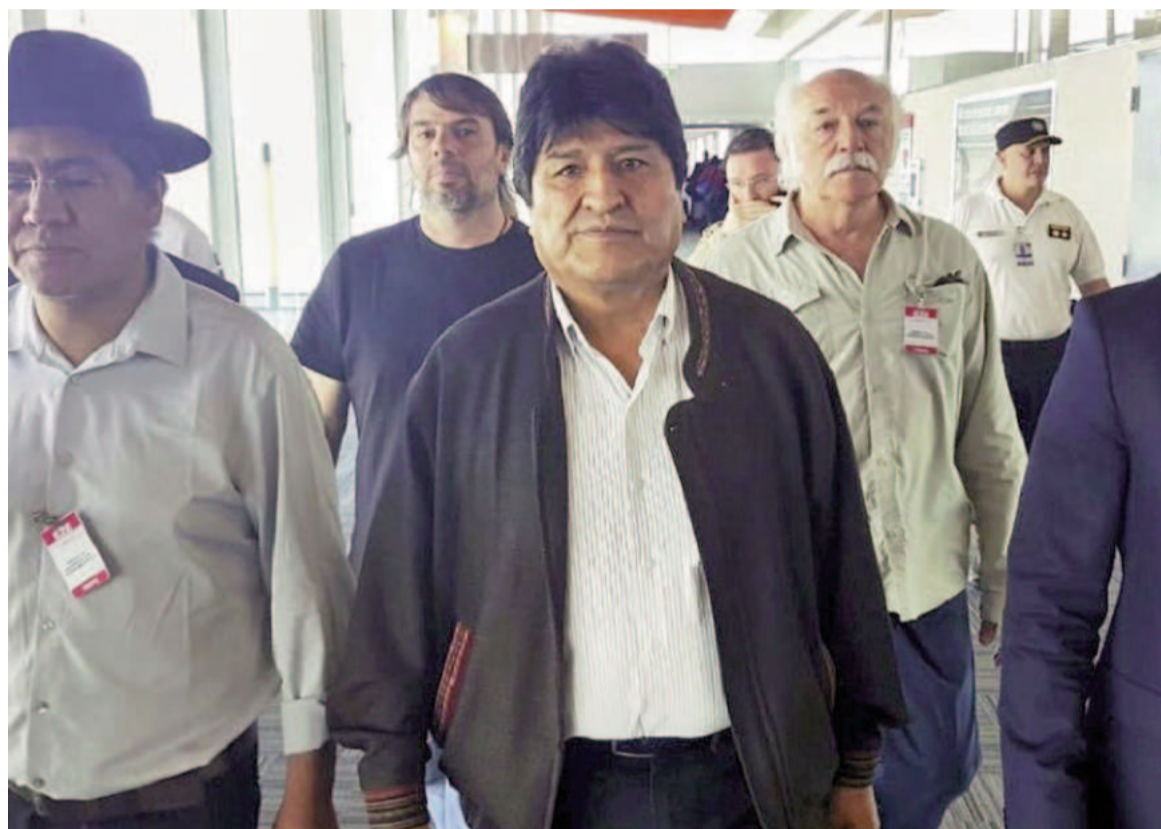
Evo Morales durante su exilio en Argentina.

La Cámara Federal porteña revocó el archivo del expediente y ordenó seguir investigando al expresidente de Bolivia cuando tuvo asilo político en el país.