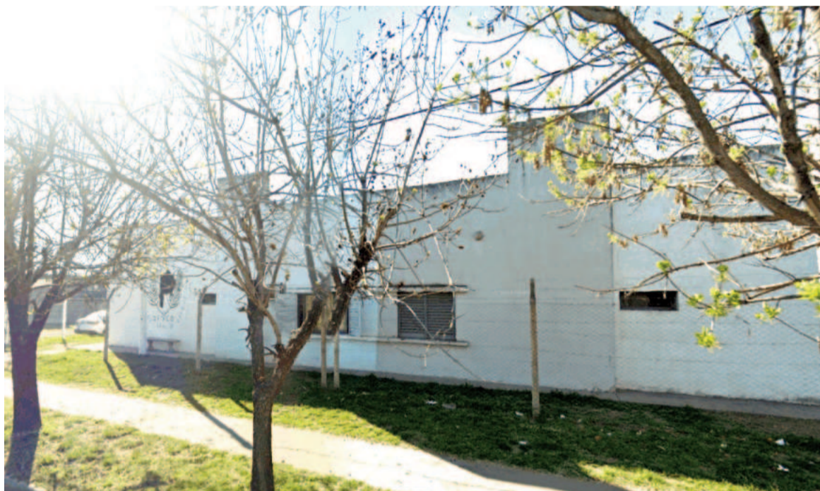
Los menores detenidos escaparon al patio, cortaron el alambrado perimetral y lograron fugarse del centro.

Fuentes extraoficiales informaron que los jóvenes extrajeron una planchuela de abajo de la mesada y llamaron a los guardias de seguridad con una excusa poco clara para que les abrieran la puerta. Una vez que uno de los vigiladores ingresó, lo golpearon con la planchuela. Luego escaparon al patio, cortaron el alambrado perimetral y lograron fugarse del centro.