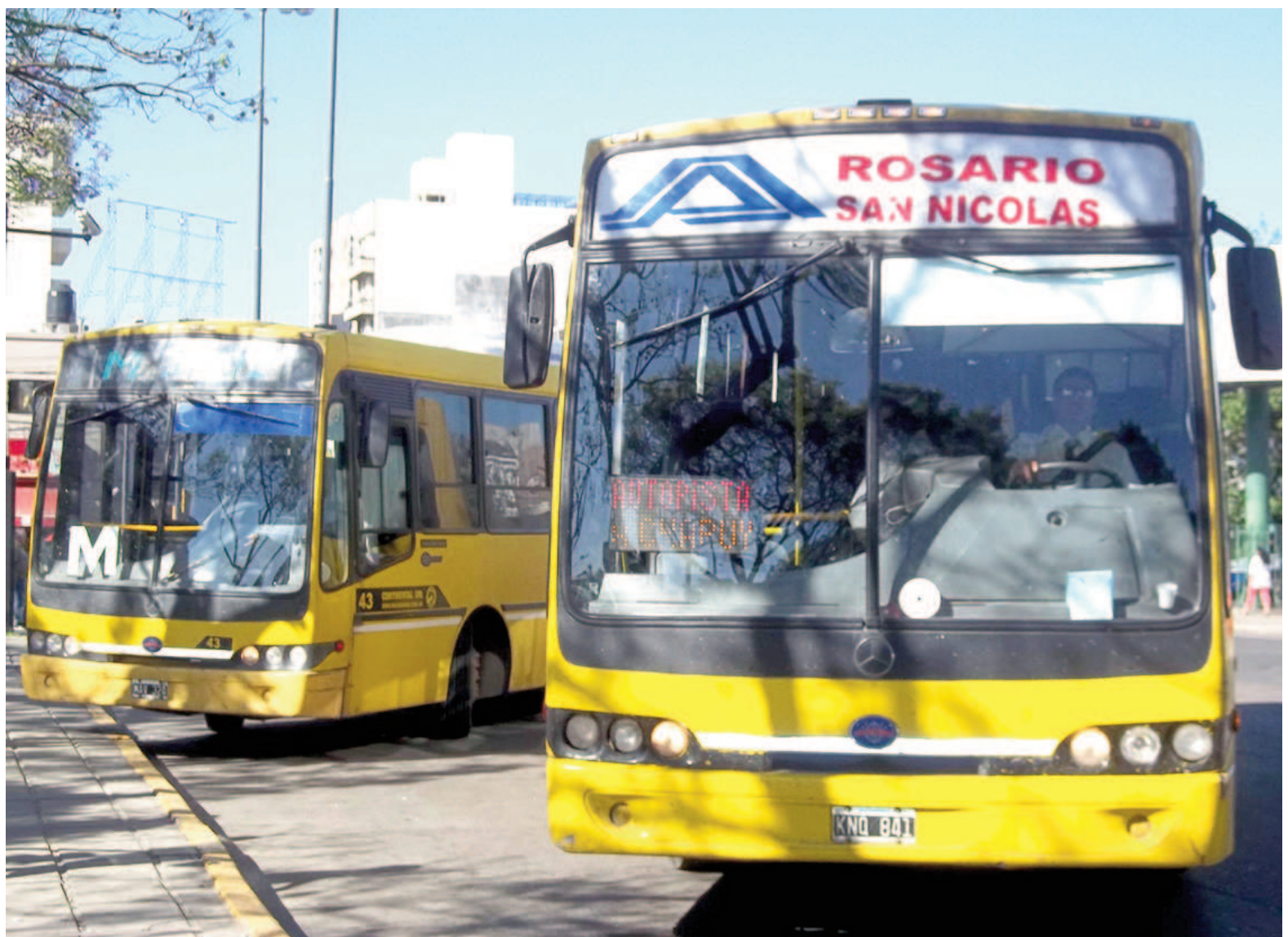
Entre las empresas afectadas se encuentra Rosario Bus, línea que es utilizada habitualmente por los nicoleños.

Tradicionalmente, muchos pasajeros resolvían la falta de saldo realizando una recarga online desde el celular o el home banking, y luego solicitaban al chofer del colectivo que habilitara el saldo mediante la máquina canceladora. Sin embargo, esa opción está actualmente desac-