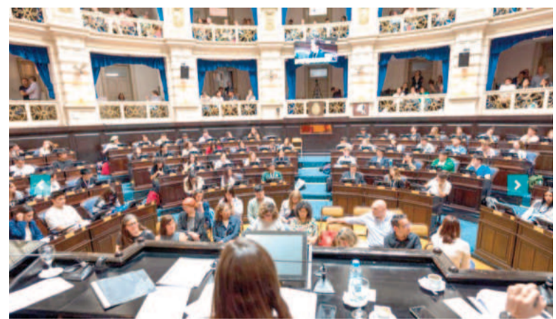
El Parlamento Juvenil procura fomentar el pensamiento crítico, favoreciendo la formación política y ciudadana de las juventudes.

Entre los objetivos específicos, se detallan: potenciar la participación estudiantil para el fortalecimiento de los procesos de inclusión educativa; generar espacios destinados a fortalecer la construcción de una ciudadanía democrática mediante el ejercicio de debate parlamentario, el diálogo y la escucha atenta a la diversidad de opiniones; afianzar y profundizar el principio de representatividad de la vida en democracia; una voz parlamentaria que debe constituirse como colectiva; fomentar la tarea investigativa y promover la vinculación con organizaciones comunitarias y sociales para garantizar acciones concretas; favorecer la reflexión sobre la dimensión local de las problemáticas