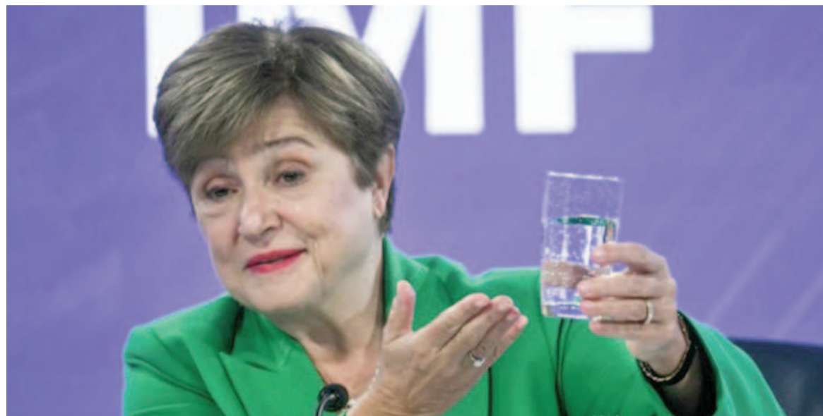
Kristalina Georgieva sugiere votar a los libertarios.

La titular del organismo destacó la necesidad de «mantener el rumbo».