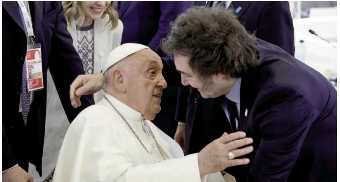
El papa Francisco y el presidente Javier Milei, durante la cumbre del G7.

Desde la Casa Rosada aseguraron que no preparan otro homenaje a Bergoglio y descartan impulsar un nuevo feriado o establecer espacios de memoria luego de la muerte del sumo pontífice. En Nación aclararon: “No va a suceder nada de eso. Ya hicimos todo lo que está a nuestro alcance y Milei va a estar en el funeral” Desde Nación explicaron que no habrá más homenajes ni actividades por Bergoglio porque intentó evitar “hacer política con la muerte del papa”. El Presidente decretó siete días de duelo y suspendió las actividades electorales que estaban previstas para esta semana.