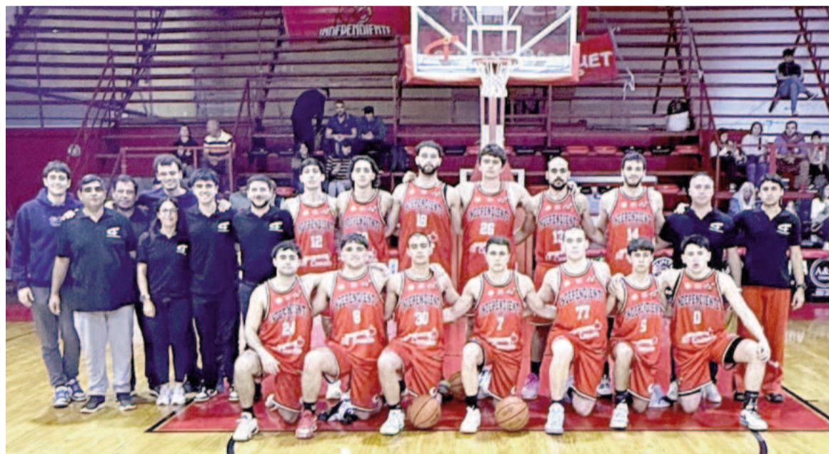
Independiente de Zárate, la gran sorpresa del Grupo B.

Por su parte, Somisa debería aguardar que ganen Estudiantes e Independiente de Zárate y al mismo tiempo sacar cuentas para ser segundo. Belgrano, en tanto, si cae con Independiente deberá esperar por los otros resultados para co-