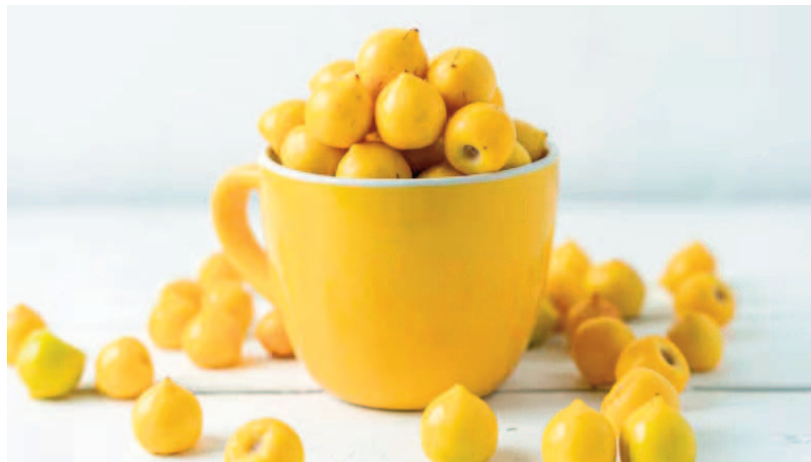
El nanche tiene sabor dulce y cuenta con algunos toques ácidos.

El Servicio de Información Agroalimentaria y Pesquera de México detalla que la fruta pertenece a la especie Byrsonima crassifolia y que su árbol puede alcanzar una altura de 9-20 metros. También revela que comienza a florecer en abril y puede llegar a producir