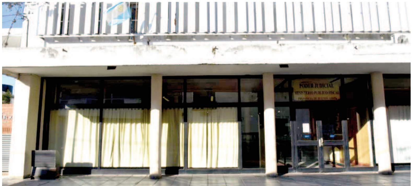
La audiencia tuvo lugar en la UFI N° 1 Tematizada en Estupefacientes.

El imputado había sido aprehendido la noche anterior a la audiencia durante un allanamiento en su domicilio ubicado en barrio 12 Marzo. En su poder encontraron una importante cantidad de envoltorios de cocaína listos para la venta.