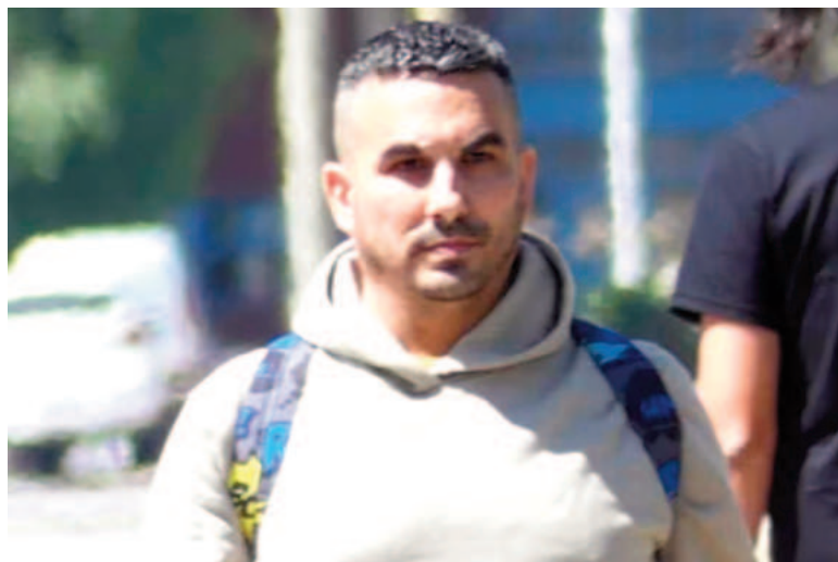
Tablado mató de 113 puñaladas a Carolina Aló.

La Justicia de San Isidro resolvió extender por un año la perimetral a Fabián Tablado, el hombre que mató de 113 puñaladas a Carolina Aló en 1996, para que no se acerque a 300 kilómetros al padre de la víctima.