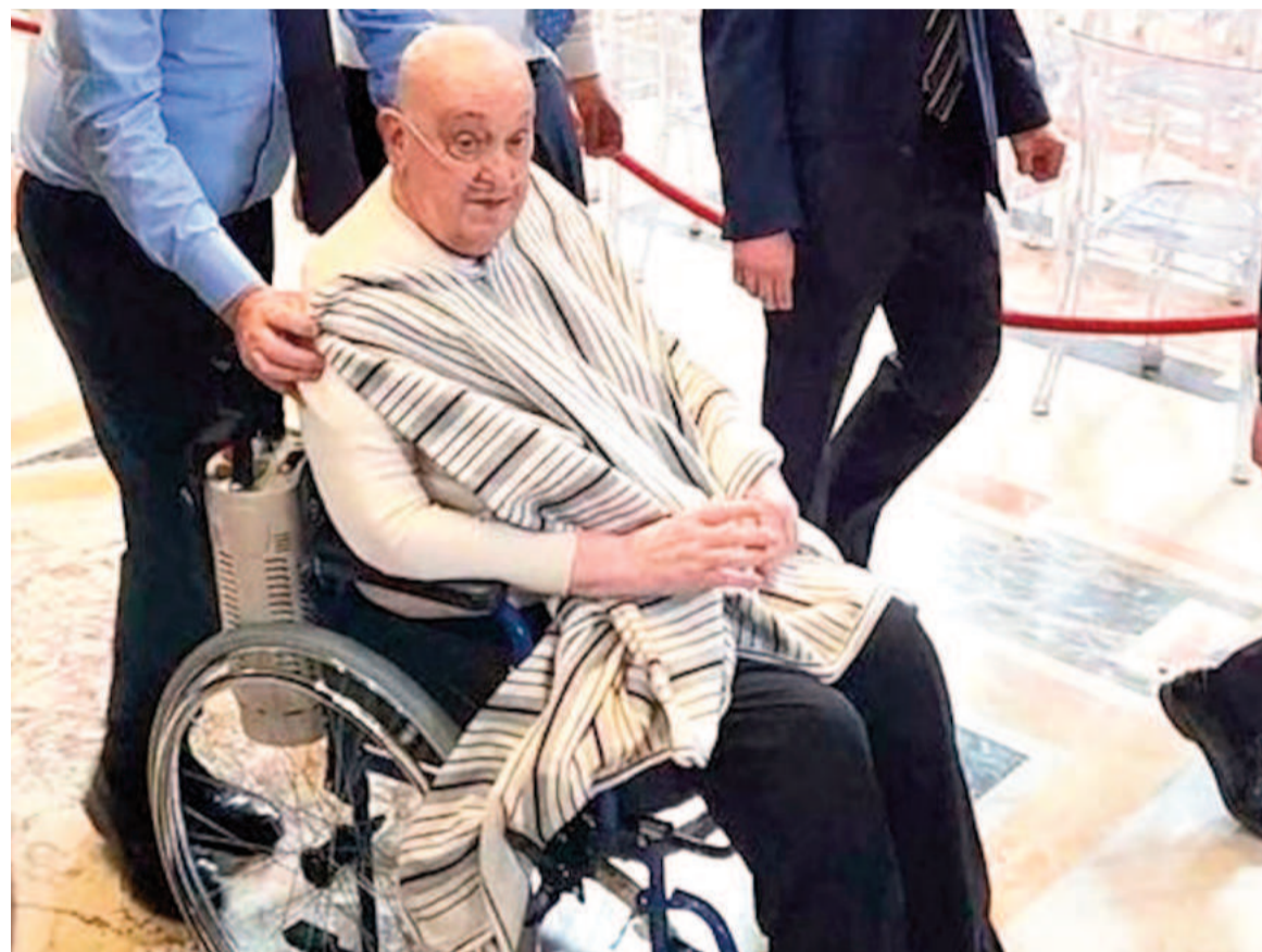
El papa Francisco realizó una visita sorpresa a la Basílica de San Pedro.

Vestido de manera informal, el nuevo gesto inesperado del pontífice provocó la emoción de quienes se encontraban en el lugar.