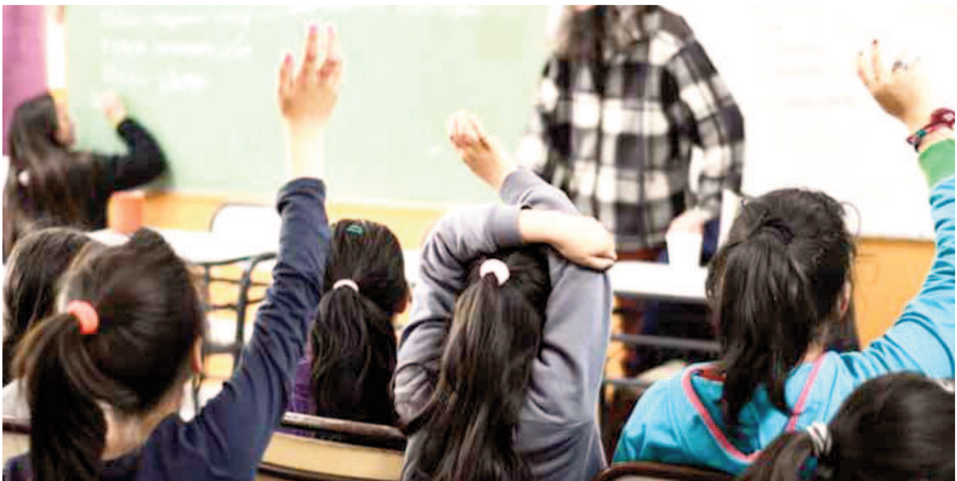
Los hechos, que involucran a adolescentes y jóvenes como protagonistas, dejaron en evidencia el clima de agresividad que afecta a algunas comunidades educativas.

Frente a los recientes episodios de violencia en instituciones escolares, la cartera educativa bonaerense hizo un llamado a promover la convivencia pacífica. Además, destacó la importancia de la escuela como espacio de cuidado y la necesidad de un compromiso colectivo para abordar los conflictos y fomentar el respeto entre estudiantes y adultos.