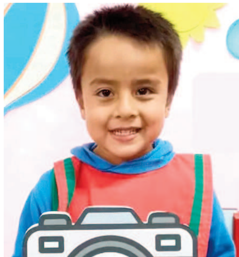
El niño de cinco años fue visto por última vez el 13 de junio de 2024.