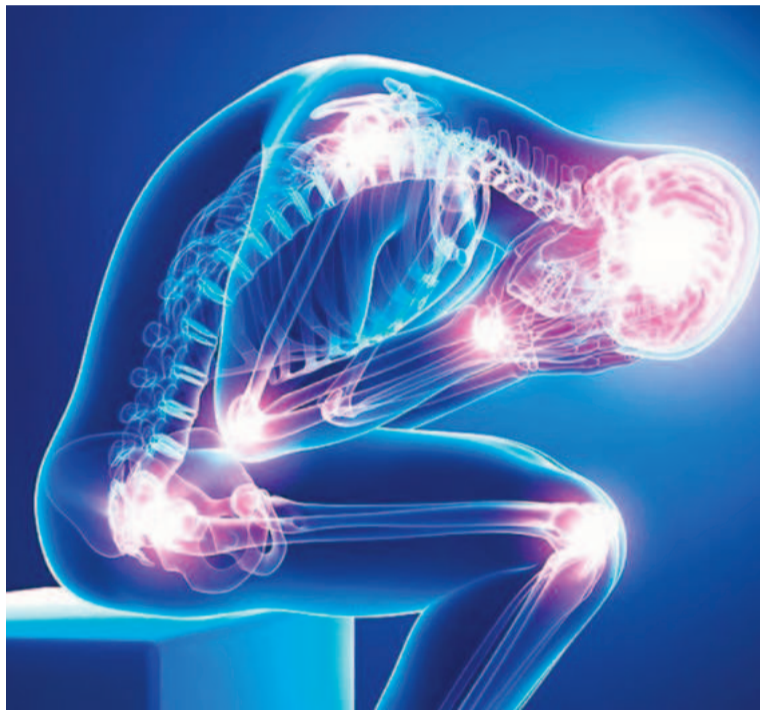
En todas las edades, el estrés y el sedentarismo intensifican los dolores en hombres y mujeres.

● El dolor de espalda, el más prevalente en la población mundial, es experimentado por 8 de cada 10 personas en algún momento de su vida. Este dolor puede ser agudo o crónico, y puede ir desde un malestar leve hasta un dolor intenso e incapacitante. Las causas varían, pero el sedentarismo y las malas