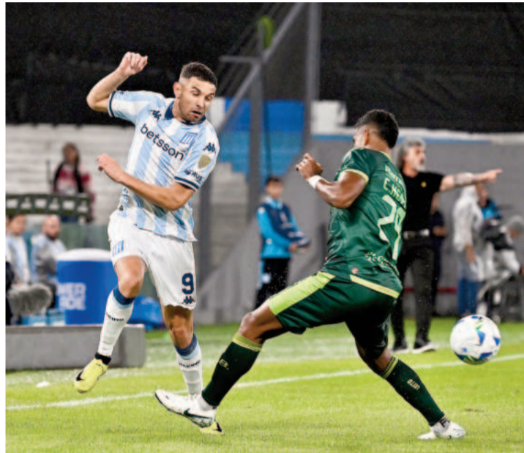
La Academia estuvo lejos de su nivel ante los cafeteros. NA