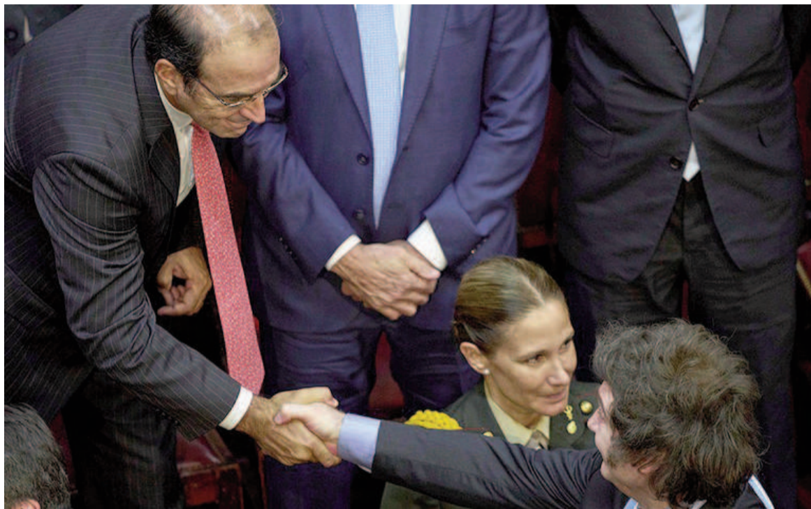
Manuel García Mansilla saludando al presidente Javier Milei en el Congreso.

Sin embargo, más allá de las acusaciones, lo cierto es que tanto Villarruel como Macri habían expresado públicamente reparos a la postulación de Ariel Lijo, el otro candidato propuesto por el Ejecutivo. La falta de consenso y de negociación política terminó derivando en un escenario incierto, con una Corte aún incompleta y un gobierno sin margen para imponer su voluntad sin respaldo parlamentario.