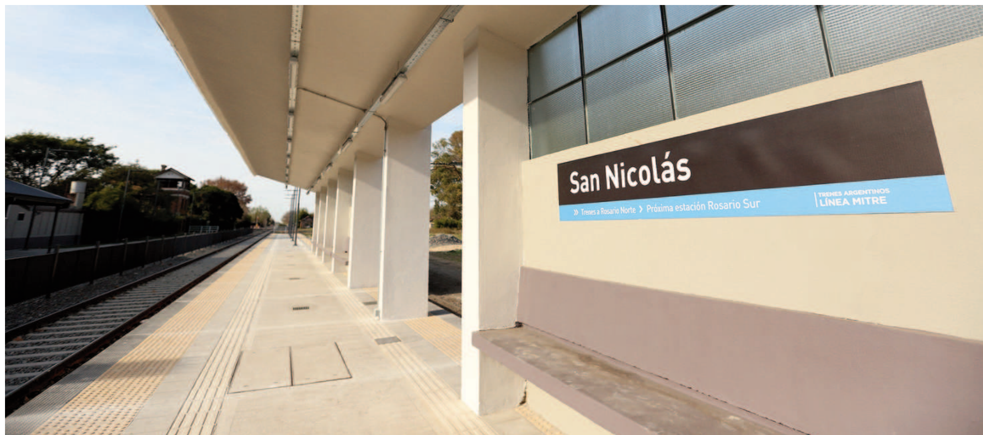
El convoy que se dirige a Retiro se detiene en la estación San Nicolás a las 4:57.

El promedio mensual de pasajeros que abordan el convoy en la estación San Nicolás con destino a Retiro es de 850 personas. En marzo pasado fueron 861, lo que arroja una media diaria de 28,7 nicoleños que eligen este medio de transporte. En comparación con el traslado en micro, el único pro que ofrece el tren es el costo del boleto. Lo demás son todas contras: horario de abordaje, frecuencia y tiempo de viaje.