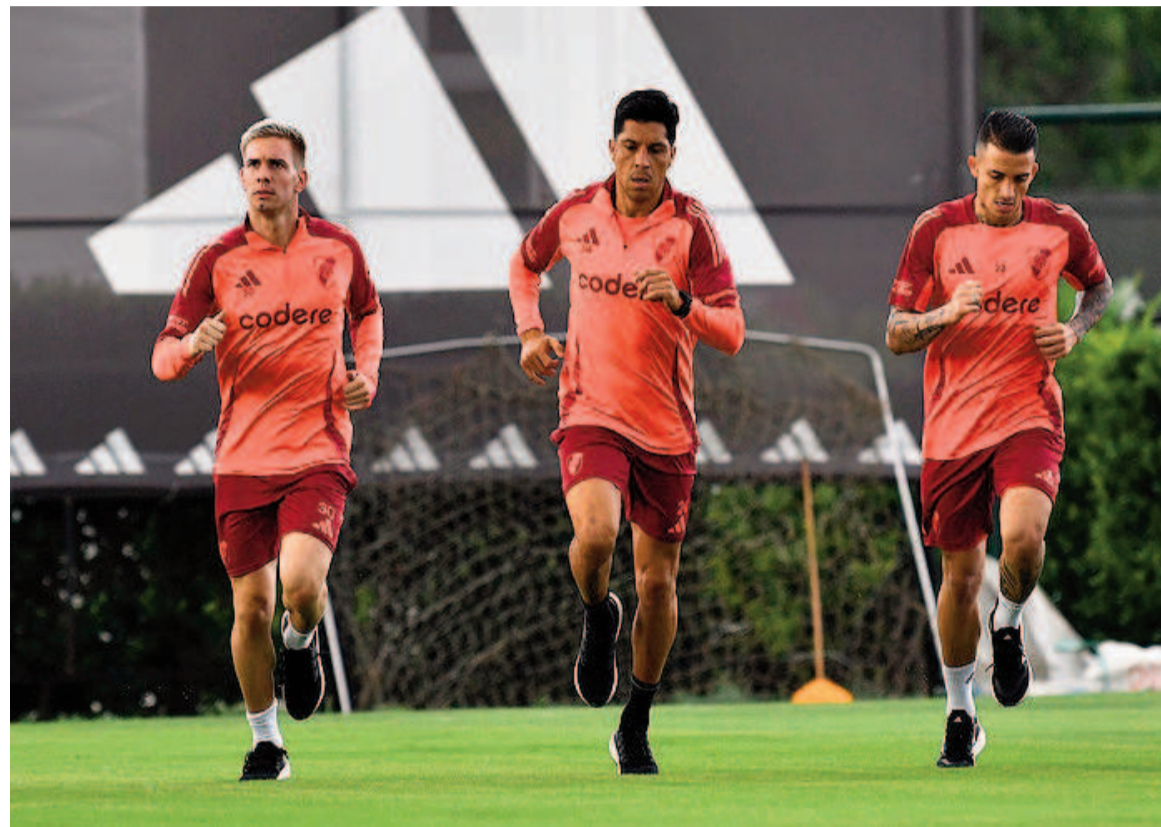
El Millonario intentará sumar de a tres. WEB

Tras el éxito en Perú en su debut copero, el equipo de Núñez buscará ganar para acercarse a la cima de la Zona B.