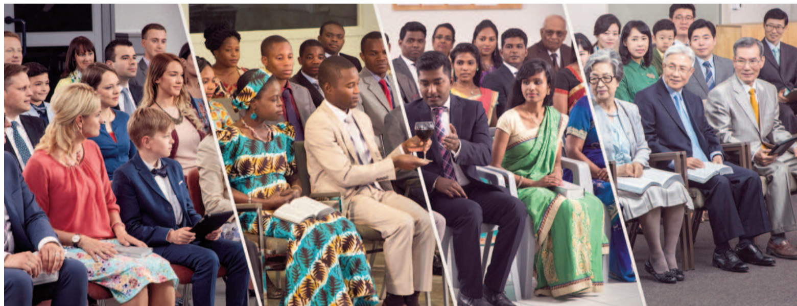
Durante un mes entregarán una invitación en Arroyo Seco.

Será el sábado 12 de abril por la noche, con la conmemoración de la muerte de Jesucristo, conocida como la Cena del Señor. Esta reunión especial incluirá un discurso sobre el significado de su sacrificio y por qué es importante recordarlo. Ambos encuentros son gratuitos y para todo público. Quienes deseen más información pueden consultar la web oficial de la organización: jw.org .