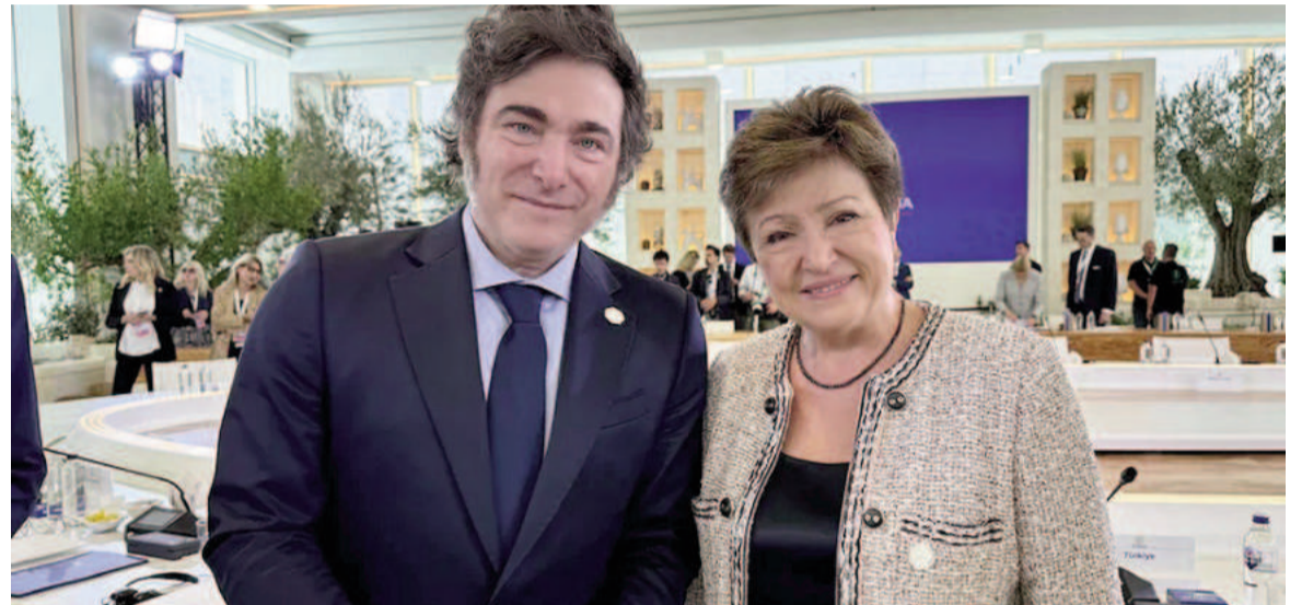
El FMI vuelve a reunirse para discutir sobre el programa de Argentina y un conflictivo pago inicial

El directorio del FMI evaluó un nuevo préstamo por US$ 20.000 millones y discutió el monto que podría adelantarse a la Argentina.