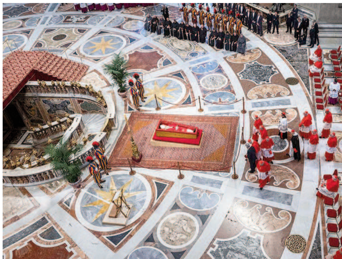
Funeral del papa Francisco.

Este sábado, el mundo despedirá al papa Francisco con una ceremonia histórica en Roma, que reunirá a más de 200.000 fieles, 130 delegaciones internacionales y un despliegue de 11.000 efectivos de seguridad.