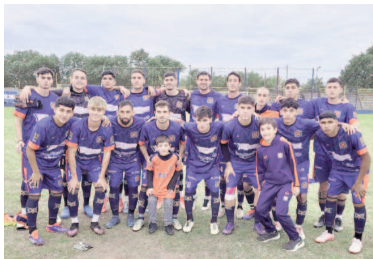
Regatas es el líder del torneo y hoy visitará a Matienzo.

Pensando en la lucha por quedar entre los ocho mejores, en tanto, un duelo importante protagonizarán en Pérez Millán General San Martín y La Emilia, dos de andar irregular en el certamen. Otro que pelea por mantenerse en la carrera por el título, 12 de Octubre, será local del campeón vigente, Los Andes, que ocupa la parte baja de la tabla. Justamente, en un choque por escaparle al fondo, se medirán Fútbol San Nicolás y Argentino Oeste. Y además Somisa -que no pudo jugar entre semana con Paraná-, intentará seguir entre los de arriba jugando