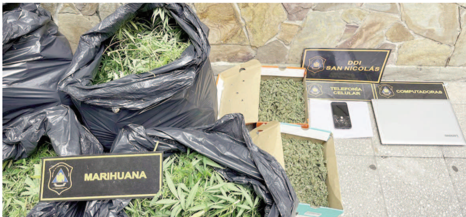
Las fuerzas policiales realizaron tres allanamientos; aprehendieron a un sujeto de 20 años y secuestraron varias plantas de cannabis sativa, entre otras cosas.

El primer objetivo se concretó en calle Peatonal 2 José Ponte al 1000