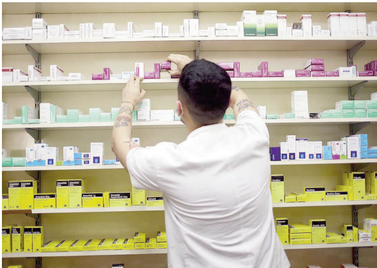
Prohíben vender medicamentos fuera de las farmacias.

Para los camaristas, las modificaciones que fueron introducidas por el decreto de necesidad y urgencia en relación con el expendio de medicamentos, la regulación del ejercicio de la profesión de farmacéutico, las condiciones de funcionamiento de los locales y el poder de policía en materia de salubridad “revelan por un lado, un desapego del potencial riesgo sanitario de la habilitación y venta de medicamentos fuera de las farmacias y, por otro lado, una desatención del rol trascendental que desempeña la figura del farmacéutico en el sistema”.