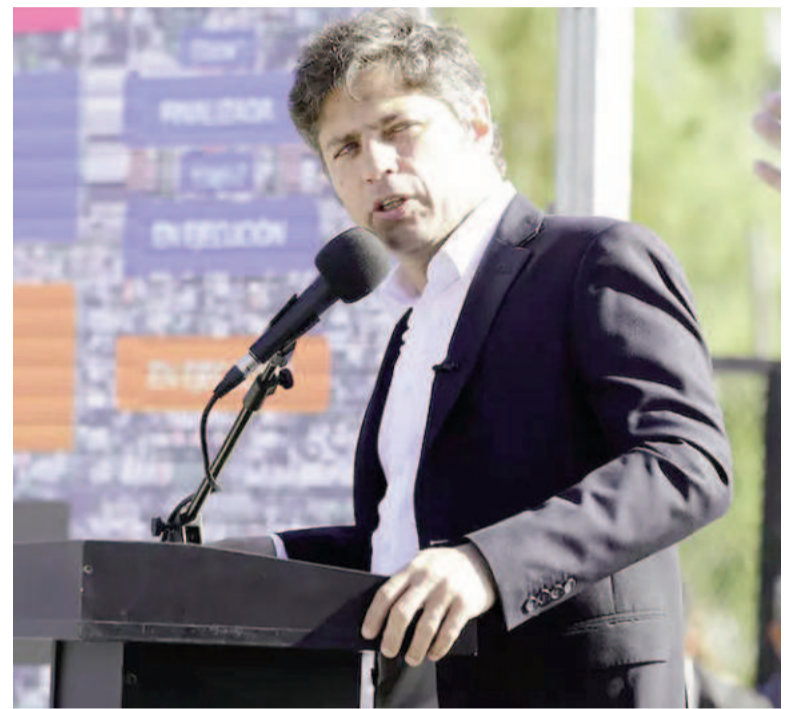
Kicillof cargó duro contra el gobierno y el FMI.

Además, recordó que el Fondo “aún no pidió disculpas por el préstamo ilegal que le entregó a Mauricio Macri, violando su propio reglamento y comprometiendo el futuro de los argentinos para financiar la reelección de un presidente en retirada”. Y advirtió: “Ahora sale al rescate de un nuevo experimento de crueldad y sumisión”.