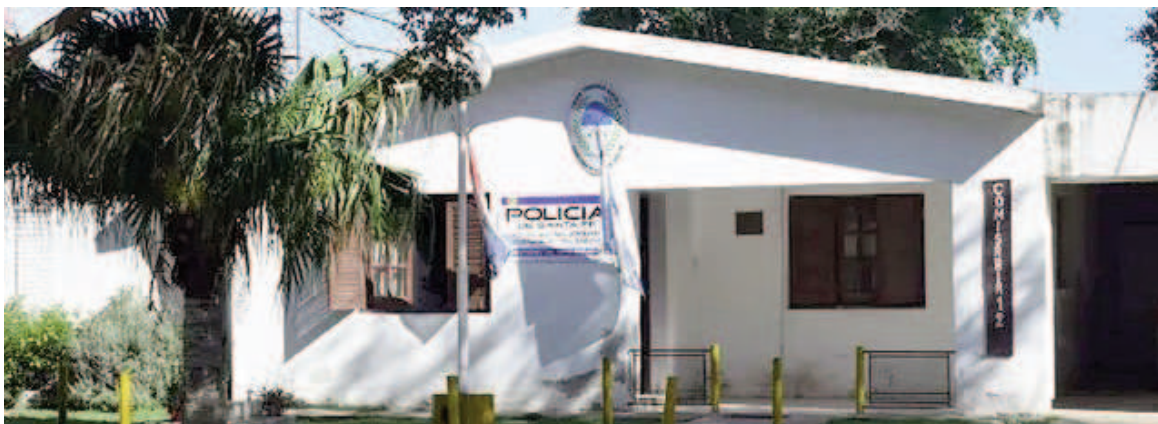
Comisaría 12ª de Puerto Gaboto.

sentación de la menor, se dirigieron al domicilio donde había tenido lugar el hecho. Allí encontraron a otros tres hijos de la víctima, quienes presenciaron todo. Los menores de edad señalaron puntualmente que fueron seis personas las que entraron a la casa y robaron los cuatro celulares que estaban en la propiedad, además