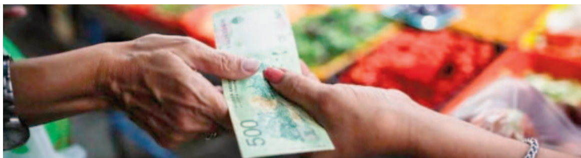
La inflación de abril viene con subas en carnes y lácteos.

Por el contrario, el aceite y las verduras registraron bajas de hasta 1,6% en sus precios.