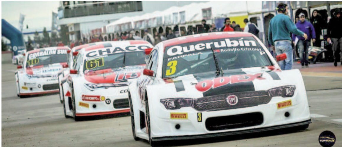
La última visita del Top Race a San Nicolás fue en mayo del 2023.

Además competirán en una prueba especial con invitados el Top Race Series, la Fiat Competizione y la Fórmula Nacional. Esta última iniciará hoy las actividades en pista a las 8.30 con el primero de los dos entrenamientos programados. Luego le tocará al Top Race Series hacer lo propio a su término, mientras que el Top Race