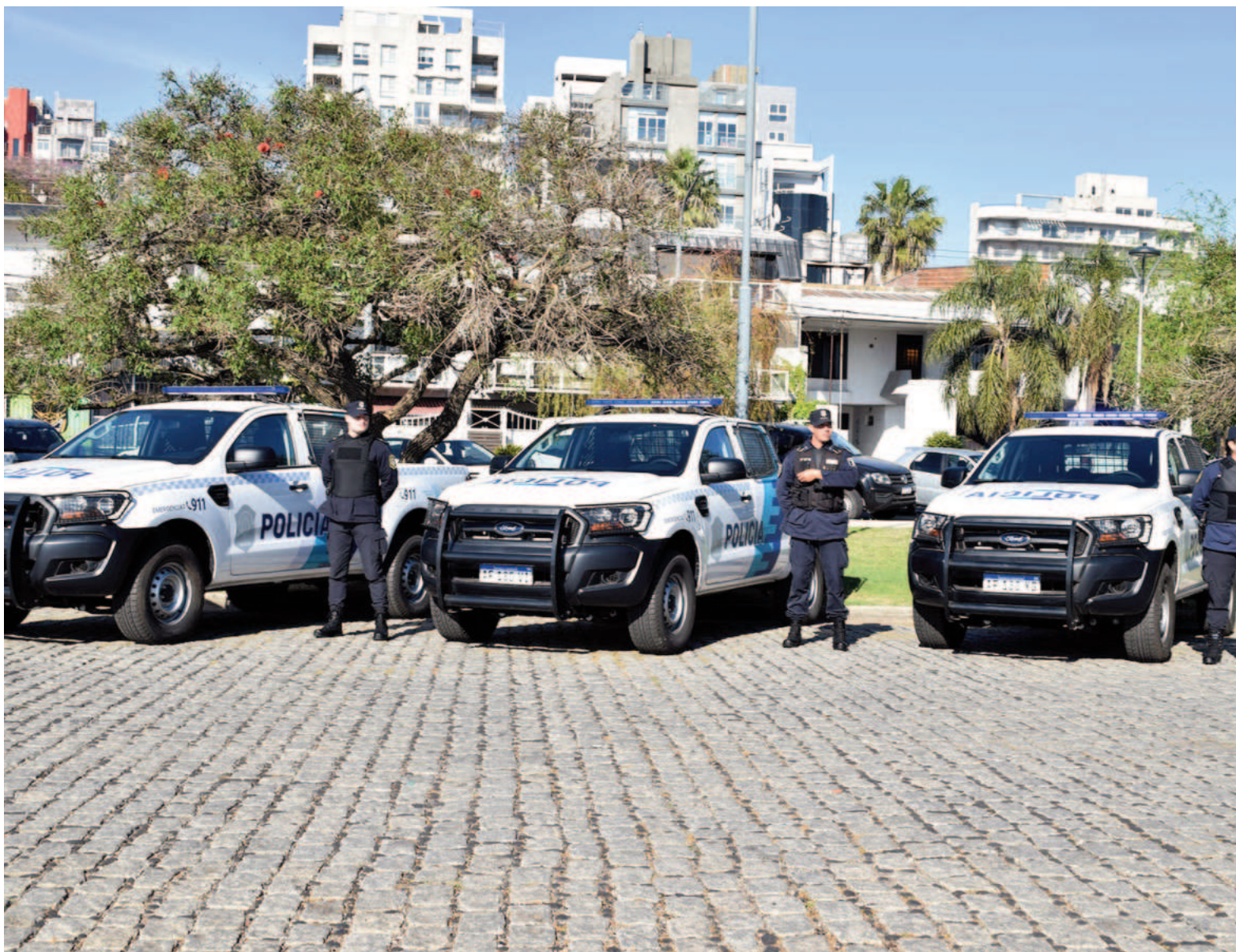
La última vez que la provincia entregó patrulleros a su policía de San Nicolás fue hacia mediados de 2022.

Según los números que evalúan en el municipio, el total de los recursos alcanzará para comprar, blindar, equipar y plotear entre 10 y 11 nuevos patrulleros. Los 5 que se incorporen a partir de la primera entrega de los recursos del fondo especial, serán los primeros en incorporarse a la flota local de seguridad desde mediados de 2022. En aquel momento el entonces ministro de Seguridad Sergio Berni había entregado al intendente Manuel Passaglia las llaves de 23 patrulleros. En los casi tres años posteriores, el Gobierno provincial no volvió a reforzar la flota de vehículos de su propia policía en San Nicolás.