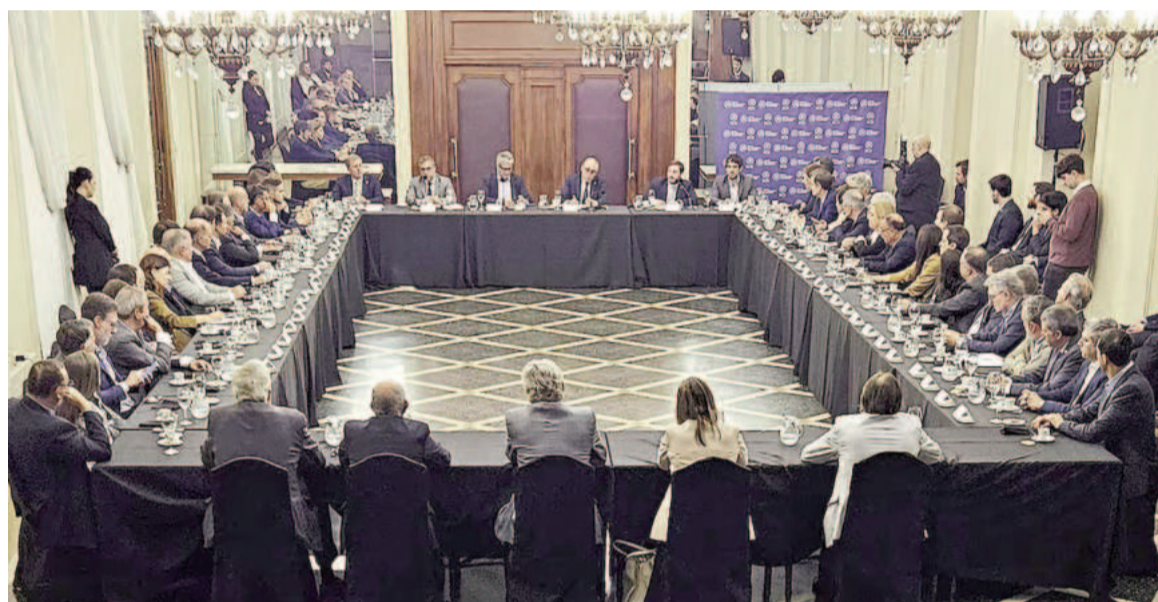
Del encuentro en la Bolsa de Comercio de Rosario, participaron referentes del equipo económico y de toda la cadena agroindustrial.

Sobre el fin de la reducción transitoria de los derechos de exportación, el equipo económico hizo una ligera mención, sólo a los efectos de recordar que esa medida caducaba el 30 de julio. Ya lo había dicho el presidente Javier Milei días atrás: "Dijimos que eran transitorios, avisen al campo que si tie-