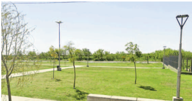
Sector donde ocurrió el robo.