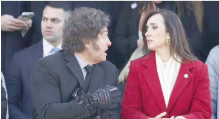
Javier Milei y Victoria Villarruel.

Victoria Villarruel habló de "soportar los desprecios" en Viernes Santo y la frase es leída como crítica velada a su aislamiento en el gobierno de Javier Milei.