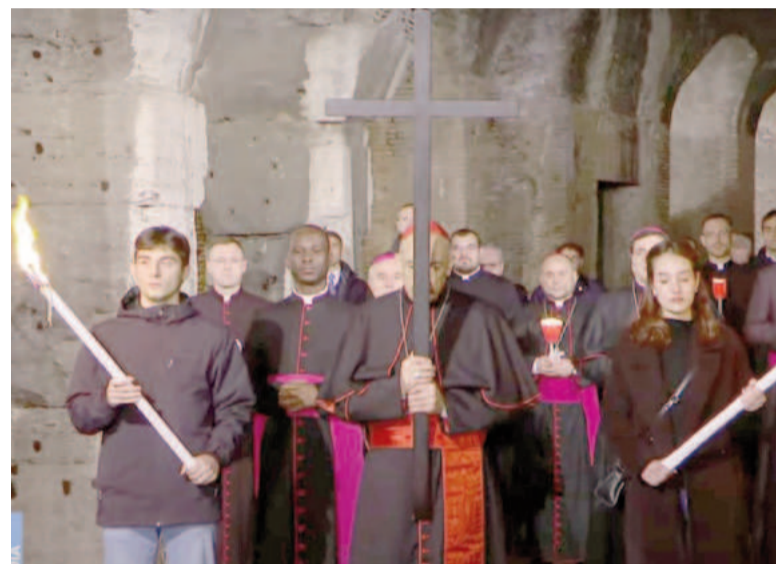
Imagen de la transmisión del Vía Crucis en Roma.

Sobre el camino del Vía Crucis, el momento previo a la crucifixión con sus catorce estaciones, Francisco asevera que en los pasos de Jesús camino del Gólgota "está nuestro éxodo hacia una nueva tierra, porque Cristo vino a cambiar el mundo", y por eso debemos "cambiar de dirección, ver la bondad de sus pasos". Y afirma: "El Vía Crucis es la oración de los que se mueven. Interrumpe nuestros caminos habituales. Y es un camino que nos cuesta el de Jesús, en este mundo que lo calcula todo y donde la gratuidad tiene un alto precio".