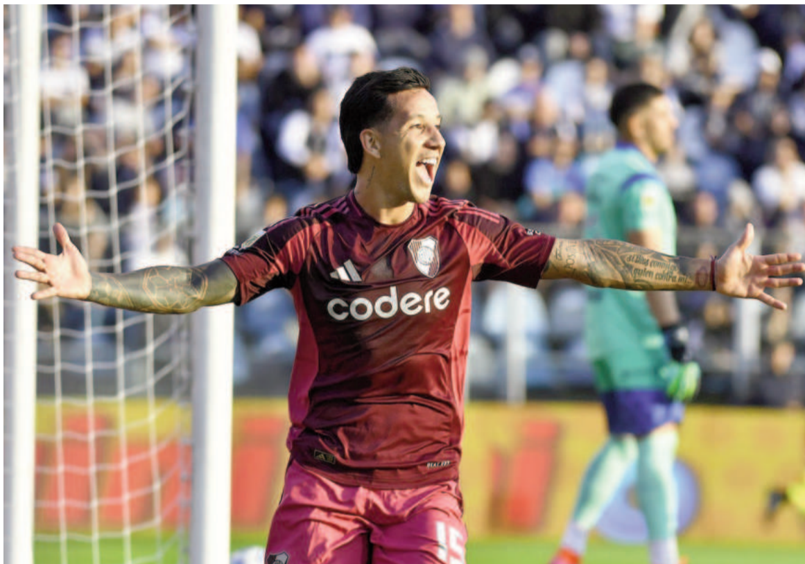
El Millonario fue efectivo y ganó cómodo en La Plata.

El equipo de Marcelo Gallardo fue contundente ante el Tripero en el Bosque platense al prevalecer por 3 a 0 con goles de Driussi, Mastantuono y Aliandro. De esta manera, los de Núñez aseguraron su boleto a los octavos de final.