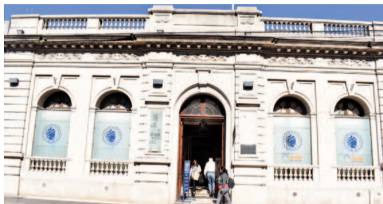
El 19 de abril de 1913 se creó una asociación bajo el nombre de “Centro de Fomento de Comercio e Industria”, precursora de la Federación de Comercio.

Entre los servicios de la entidad se encuentran: participación permanente en Rondas de Negocios nacionales e internacionales; generación de Networking entre asociados conectando empresas, comercios y servicios; asesoramiento en opciones de inversión, crédito y financiamiento; beneficios para los socios en entidades bancarias vinculadas a la Federación, Sociedades de Garantías Recíprocas y otros organismos a cargo de profesionales especializados; acompañamiento en iniciativas de impor-