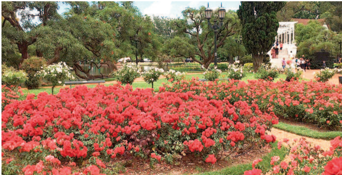
El Rosedal de Palermo fue calificado como uno de los jardines más hermosos del mundo.

Su diseño paisajístico combina historia, arte y naturaleza, y conforma un respiro en medio del ritmo urbano.