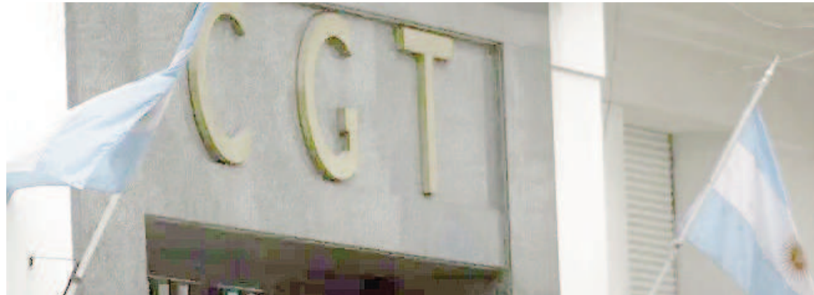
La central obrera convocó a una nueva movilización.

Las decisiones se adoptaron ayer a la tarde en una reunión del Consejo Directivo cegetista, con ausencia de dirigentes del ala dialoguista. Se analizó el nuevo escenario económico y coincidieron en que habrá aumento de los precios y baja de los salarios.