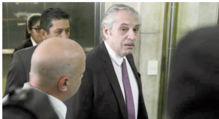
El expresidente durante su paso por Comodoro Py, en la causa por violencia de género contra Fabiola Yáñez.

Los jueces profundizaron en que "todo demuestra que la damnificada era alguien que notoriamente estaba en una situación de desigualdad de poder, al interior y exterior de la pareja, con relación a su victimario. En un contexto así, por imperio del sentido común más básico, es razonable presumir que, en ese momento, no guió a sus acciones otra finalidad que pedir algún modo de auxilio sobre una situación que, efectivamente,