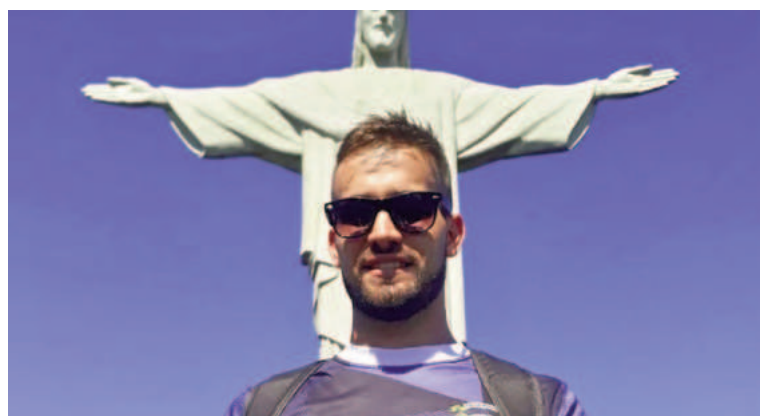
El infortunado joven.

El accidente que lo tuvo como protagonista se produjo el pasado 21 de marzo cuando en horas de la madrugada regresaba desde San Pedro a Gobernador Castro en su auto Peugeot 405 sobre la Ruta 191, cuando por cuestiones que se desconocen se salió de la calzada e impactó contra un árbol. El hombre fue despedido y sufrió heridas de carácter grave. La persona que viajaba como acompañante tuvo lesiones menores.