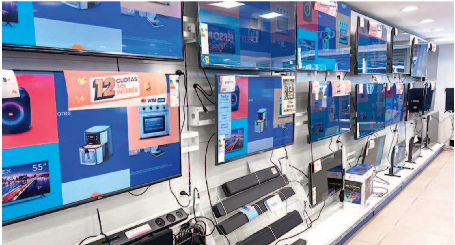
Por el momento, los precios de electrodomésticos y tecnología no mostraron modificaciones tras la apertura del cepo.

Desde otra cadena de electrodomésticos, coincidieron en el análisis. “No hubo cambios en los precios tanto en nuestra empresa como en varias de la competencia con las que estamos en contacto. Había mucha expectativa sobre lo que podría pasar, pero no pasó nada. Puede haber pequeñas subas o bajas pero dentro de la normalidad del rubro”, aseguró el encargado de una empresa del sector.