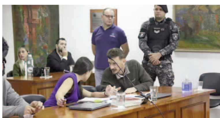
El exdiputado misionero alegó persecución política.

Farrel relató que en coordinación con el Centro Internacional para Personas Desaparecidas y Niños Explotados (IMEC, por sus siglas en inglés), CRC estaba trabajando en la operación denominada "Guardianes de la Niñez". El