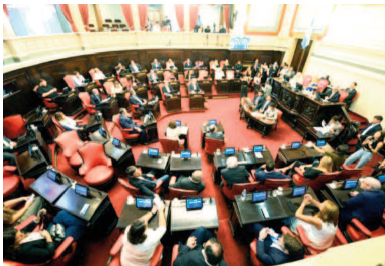
El Senado bonaerense aprobó la suspensión de las PASO con apoyo casi total.

La iniciativa no incluyó un artículo clave que proponía ampliar los plazos para la presentación de boletas y listas, algo que había sido solicitado por el Ejecutivo bonaerense. Con esta decisión, y tras la confirmación del desdoblamiento, la elección general en la provincia quedó fijada para el próximo 7 de septiembre.