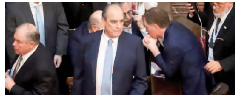
Guillermo Francos asistirá una vez más al Congreso de la Nación.

Un nuevo revés, en este caso totalmente simbólico, se prepara en la Cámara de Diputados. El Gobierno dispuso que Guillermo Francos ofrezca el balance de gestión pero por faltas masivas puede llegar a suspenderse la sesión. La situación provocó incluso resquemores dentro de la coalición oficialista, dado que el PRO pidió la postergación de la actividad pero fue ignorado por Martín Menem. "No respondieron la nota que mandamos, que significaba cuidar a su jefe de Gabinete", le dijeron a Ámbito .