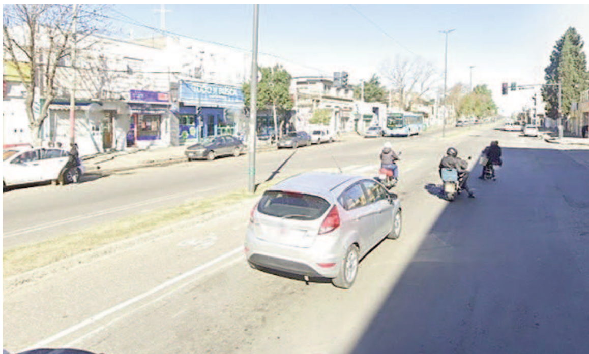
El sector comercial de Provincias Unidas y Rivarola.

El dueño del local, por su parte, recibió al menos un tiro en una pierna, al parecer en un forcejeo con el ladrón.