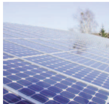
Expertos recomiendan la transición hacia energías renovables.

Agregó: "Estamos en camino de experimentar 3 grados para el año 2100. Basta pensar en las inundaciones en España, los incendios en Portugal o las olas de calor del verano pasado