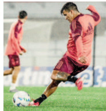
Acuña sería titular esta noche en el Millonario.

Además, el club de Guayaquil atraviesa un buen presente porque en el certamen de su país lidera con 15 puntos luego de siete fechas, en las que ganó cinco de los seis duelos que disputó.