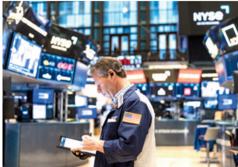
Las bolsas del mundo no logran asentarse.

Trump ha pedido al banco central que baje los tipos de interés y ha acusado a China de ser el "mayor abusador" por haber con-