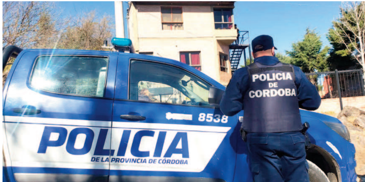
Demoraron al hijo de la mujer asesinada.

Las investigaciones continúan para determinar la situación de la mujer y el estado de salud en que se encontraba antes de su muerte, así como las razones detrás de la denuncia que alertó a la policía.