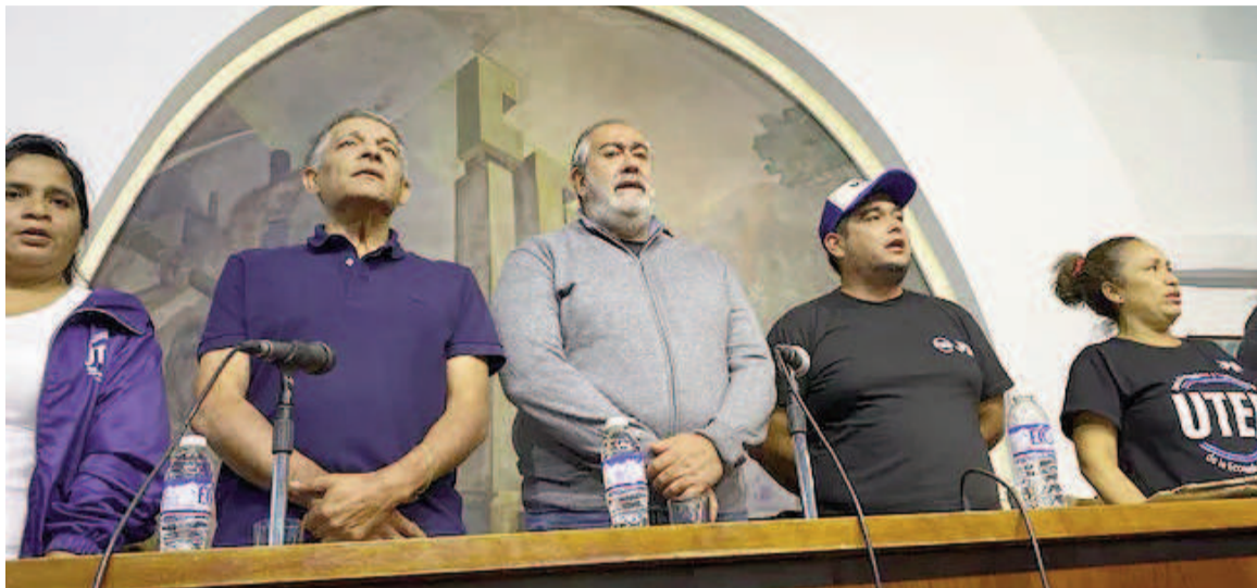
La CGT se prepara para un nuevo paro contra el Gobierno.

«Con el Gobierno hay diálogo pero no hay negociación», puntualizó Daer. «La inflación se desaceleró pero estamos con valores más altos que en 2022 cuando Guzmán era