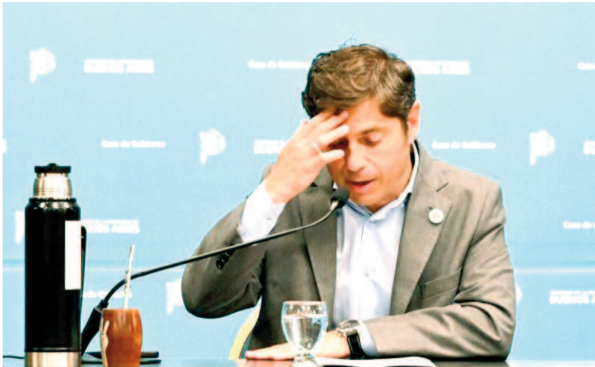
El gobernador desdobra las elecciones.

“Javier Milei impulsó de manera inconsulta y con total irresponsabilidad un sistema nuevo de votación en la PBA, jamás utilizado, la Boleta única de papel. En la ley de BUP se obliga a que cada persona vote en dos urnas diferentes, con boletas diferentes y sistemas