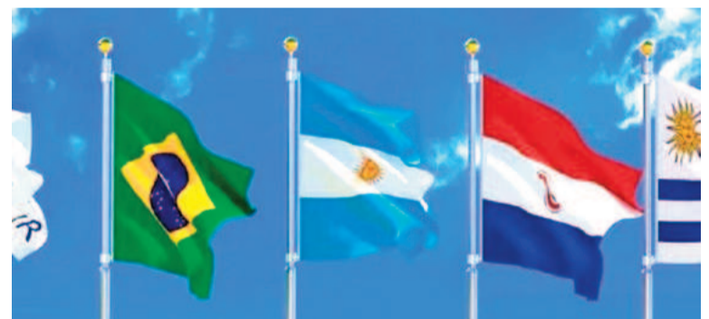
Los cancilleres del Mercosur se reunirán el viernes en CABA.

que pretende un acuerdo con Estados Unidos. Hasta el momento no se ha conocido una respuesta conjunta de Argentina, Brasil, Uruguay y Paraguay frente al nuevo escenario que plantea el gobierno norteamericano. Los dos socios mas grandes han hecho manifestaciones individuales, con un Luis Inacio Lula Da Silva muy crítico, y un Javier Milei totalmente aliado con Trump.