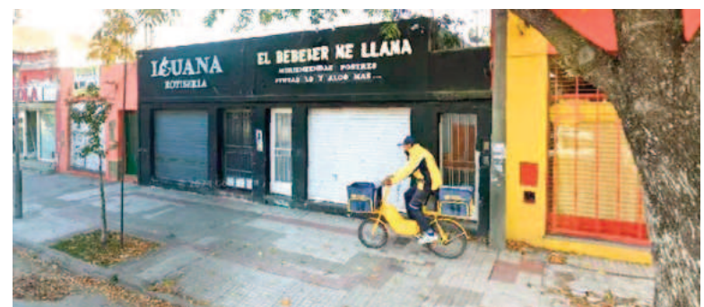
Volvieron a balear una cervecería.

sencia de una moto KTM negra, con características similares a la que se había notificado por frecuencia radial a partir de la denuncia de los tiros contra la cervecería. El vehículo estaba en un pasillo de French al 2000, donde había sido abandonada según reportaron los policías. No es la primera vez que «El beber me llama» es blanco de un ataque a tiros. En un hecho similar el local había sido baleado en octubre de 2023.