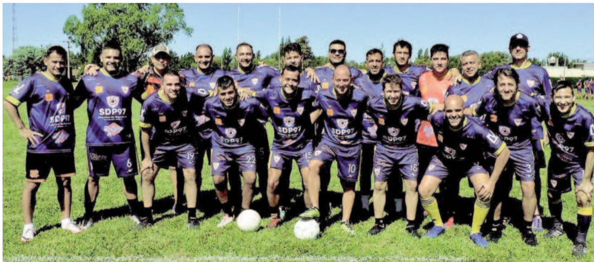
El Sevilla es uno de los 11 equipos que están tomando parte en el torneo de fútbol interno +35 en el club Belgrano. WEB

Dio comienzo en el transcurso de la semana anterior en el camping del Club Belgrano, el certamen de fútbol +35, integrado por once equipos, que se enfrentan todos contra todos los sábados y ya llevan jugadas dos fechas, cuyos resultados fueron los siguientes: 1era. fecha: Celta 1 Valencia 0; Sevilla 1 Girona F.C. 0; Real Madrid 5 Mallorca 2; C.D. Alavés 2 Barcelona 0 y Atlético Madrid 3 Villarreal 0. Libre Athletic Bilbao; 2da. fecha: Athletic Bilbao 5 Atlético Madrid 0; Celta 3 C.D. Alavés 0; Valencia 1 Girona F.C. 0; Sevilla 1 Mallorca 0 y Barcelona 4 Villarreal 0. Libre Celta.