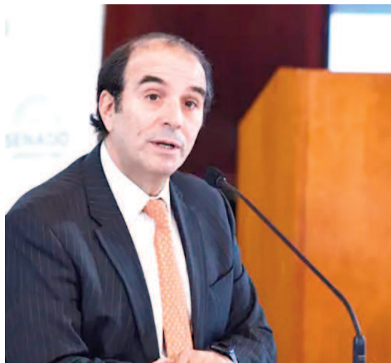
Manuel García Mansilla presentó su dimisión al máximo tribunal.

Cerca del final asegura que «tal vez este episodio y esta renuncia sirvan de advertencia para que se den cuenta de una vez de que la integración de la Corte Suprema, y de todo el Poder Judicial federal, es urgente y que deben dejarse de lado las mezquindades que parecen haberse impuesto hace mucho tiempo».