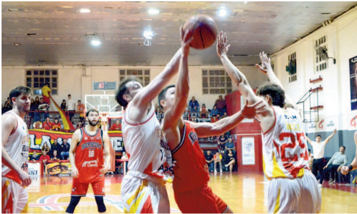
Al momento de la suspensión Belgrano ganaba 17 a 11 con 56 segundos por jugar en el primer cuarto.

El partido correspondiente al Grupo B de la Conferencia Sudeste de la Liga Federal de Básquet entre Belgrano e Independiente en Zárate, que fuera suspendido el domingo por incidentes cuando el Rojo ganaba 17 a 11 a un minuto para el cierre del cuarto inicial, continuará disputándose este viernes a las 20.30 en el estadio "Omar Olguín" a puertas cerradas; es decir, sin público presente. Esto se le comunicó a la dirigencia belgranense ayer en horas de la tarde, después de haber accedido al informe del Comisionado Técnico y tras la presentación del correspondiente descargo ante el Tribunal de Disciplina de la Confederación Argentina. Por lo que los directivos del club nicoleño le comentaron a EL NORTE lo informado por las autoridades: "No estuvo ajustado a lo que ocurrió realmente". Y en su exposición mantuvieron la postura de responsabilizar a Independiente por lo sucedido. Esto lo había expresado horas después de la suspensión en redes sociales el club de la calle Pellegrini. En su mensaje, Belgrano expuso lo siguiente: "Se aclara que en el partido en Zárate fue suspendido luego de que un dirigente del local, supuestamente su presidente, agrediera a un simpatizante menor de edad (de Belgrano) y con ello se generaran disturbios antes del ingreso. Esto provocó que los jueces ordenaran el desalojo de ambas parcialidades para