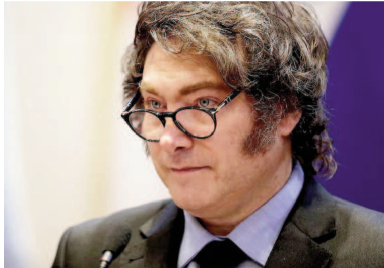
Cae la consideración de su gobierno.

clive en la presente medición a mediados de su primer año de gestión. Sin embargo, desde octubre de 2024 había logrado revertir la confianza y acumuló meses consecutivos de buena ponderación entre la ciudadanía, según lo reflejado por el estudio.