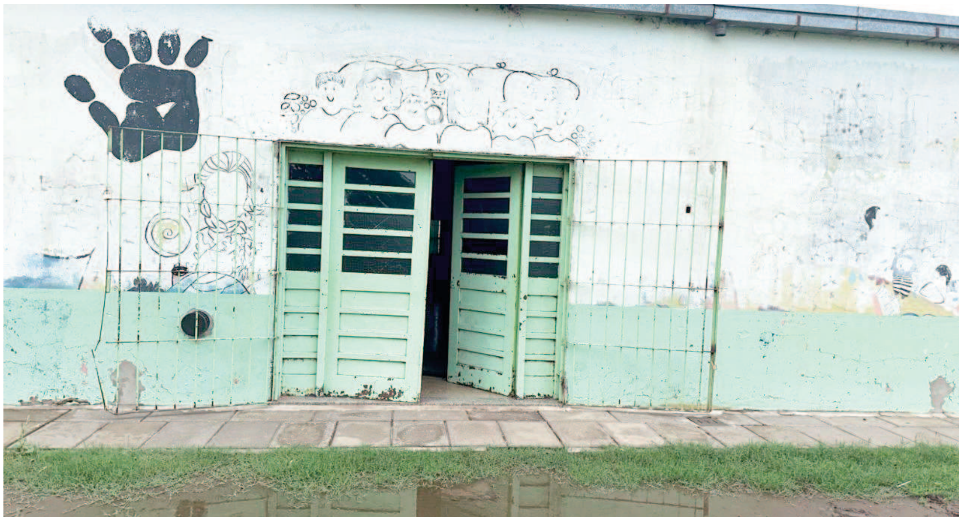
Tras un robo, en la Escuela 45 se colocó recientemente un sistema de alarma.

PARA MAYO DE 2024 SE HABÍAN REGISTRADO UNOS 40 HECHOS Y ESTE AÑO, ALREDEDOR DE 10