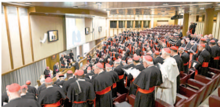
Los cardenales se preparan para la elección pontificia.

Unos 135 cardenales, todos menores de 80 años y procedentes de todo el mundo, son elegibles para suceder a Francisco. La Capilla Sixtina, donde tendrá lugar la votación, ya fue cerrada al público.