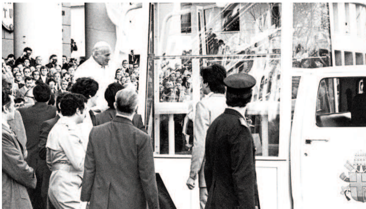
Juan Pablo II fue el primer papa que visitó Argentina.

El trabajo incluyó retirar la grúa de la parte trasera de la camioneta y colocar la cabina donde viajaría Juan Pablo II. El piso del habitáculo tiene una