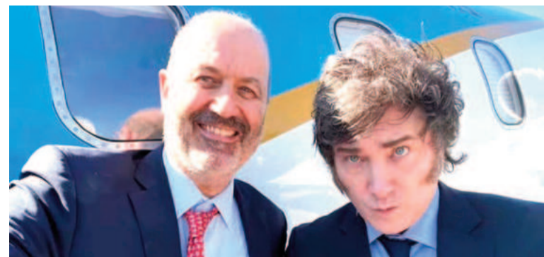
El Ejecutivo trabaja en la eliminación y fusión de organismos del Estado.

Distintos delegados gremiales aseguran que una de las fusiones que realizaría el Ejecutivo es lograr que el INTA (Instituto Nacional de Tecnología Agro-