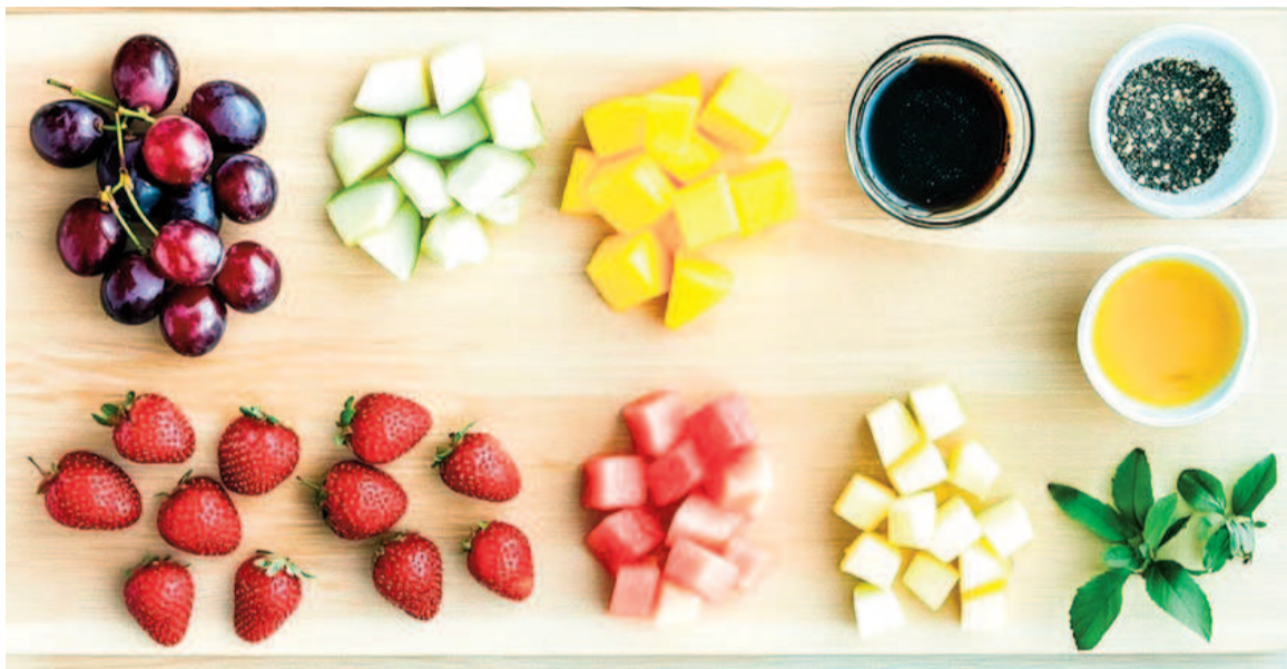
Expertos sugieren consumir 400 mg de magnesio al día para hombres y 310 mg para mujeres.

Los Institutos Nacionales de Salud establecen que los hombres adultos deben consumir al menos 400 miligramos de magnesio al día, mientras que las mujeres requieren un mínimo de 310 miligramos para sostener un funcionamiento corporal óptimo.