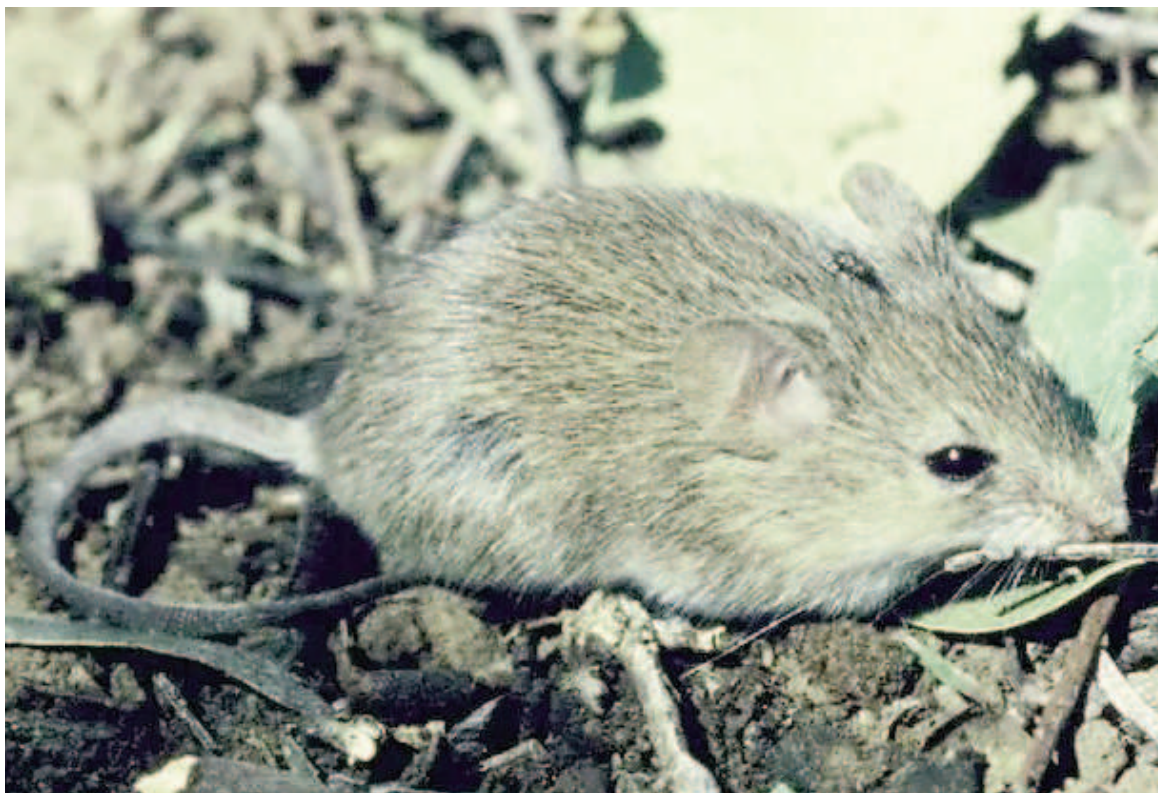
El ratón maicero es el encargado de transmitir el virus Junín, causante de la fiebre hemorrágica argentina.

Es de suma importancia que se vacunen todas las personas mayores de 15 años que realizan activi-