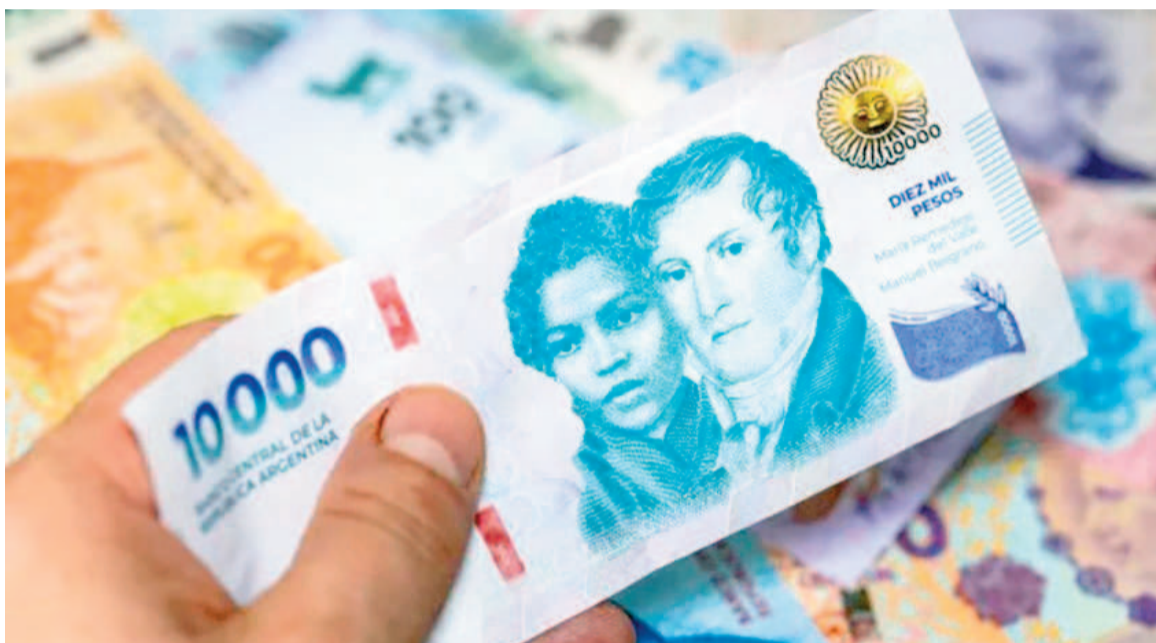
Se reabre la discusión sobre el Salario Mínimo.

En las últimas horas se reunieron las tres centrales sindicales del país, CGT y las dos CTA, con el fin de acordar posiciones. Uno de los focos primordiales será el reclamo por un SMVM digno, ya que en la era Milei dicha referencia perdió un 30% de poder adquisitivo, según estimacio-