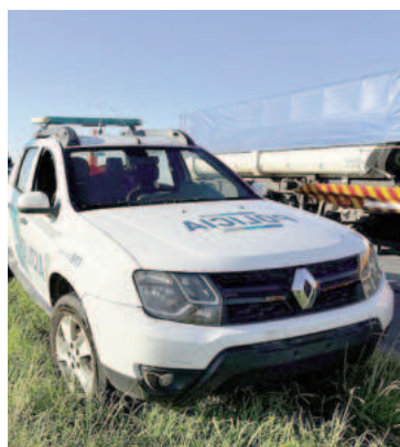
Trágico siniestro en la Ruta 188.

La Unidad Fiscal de Instrucción N° 14 interviene en el caso, que fue caratulado como "lesiones culposas", y dispuso las actuaciones de rigor.