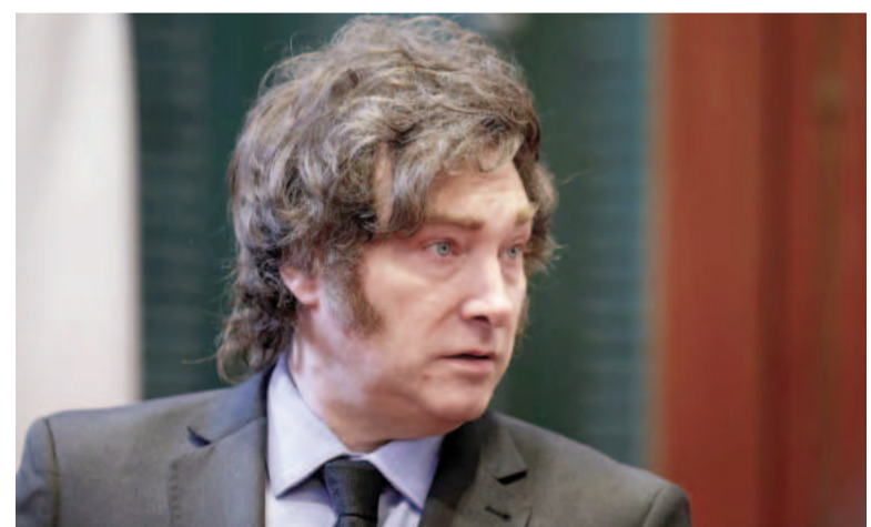
El presidente asegura que la salida del cepo no acelerará la inflación.

El presidente aseguró también que el valor del dólar no aumentará, ya que "las bandas tienen dos características, la superior crece 1% y la inferior cae 1% por mes". "Si nosotros seguimos con esto de no emitir dinero, se recompone la demanda, y al mismo tiempo la economía crece, algo que está pasando, eso quiere decir que la demanda de dinero a a volar y la