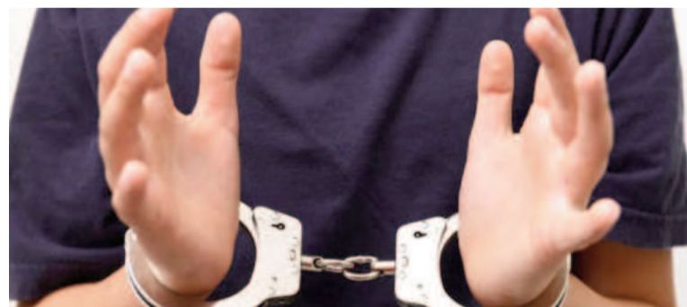
Vuelve el debate para modificar el régimen penal de minoridad.

Otro aspecto relevante es la diferencia en las penas máximas propuestas para los menores en comparación con los adultos. Según el Gobierno, la pena máxima debería ser de 20 años, mientras que aproximadamente la mitad de los proyectos presentados sugieren un