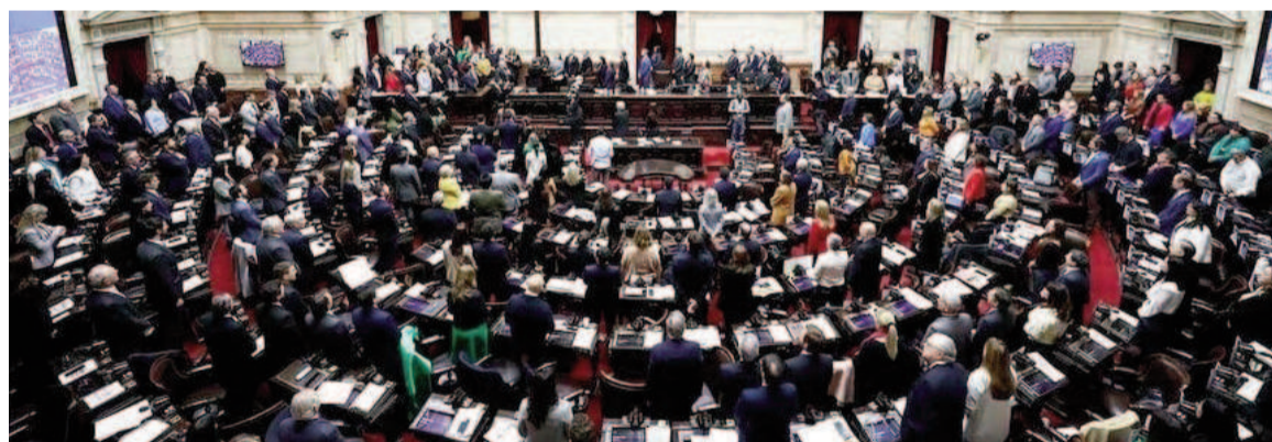
Cámara de Diputados de la Nación.

Emulando la estrategia del oficialismo, los radicales aliados al Gobierno conformaron un nuevo