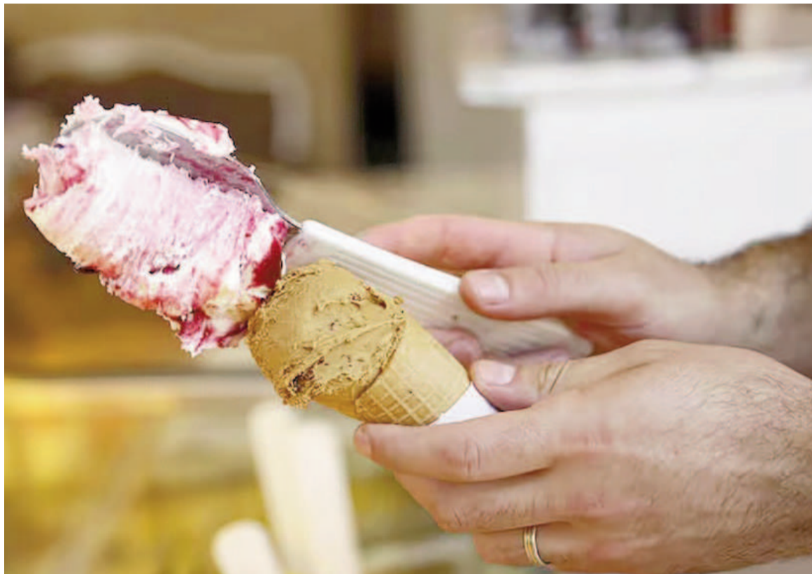
Al momento del postre, gana el helado artesanal.

tina, Brasil, Colombia, Perú, Venezuela, Ecuador, México y, por primera vez, Estados Unidos, con equipos que competirán en pruebas creativas como tortas heladas, petit fours de chocolate, finger food, monoporciones y el temido mystery box.