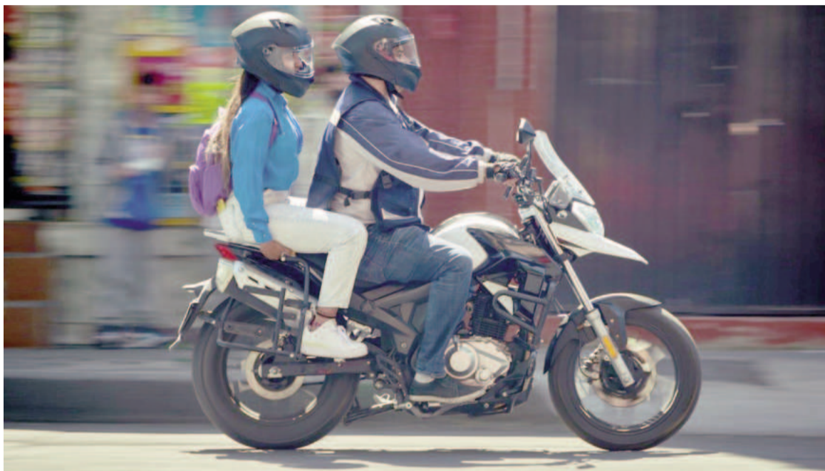
Promueven la Ley Antimotochorros.

“Es una medida sensible, por eso creemos que debe ser el intendente el que lo solicite. Hay una ley que nos permite tomar esa medida como Ministerio de Seguridad”, añadió. Si bien en algún pasaje sugirió que la idea está pensada principalmente para implementarse en el Conurbano, aclaró