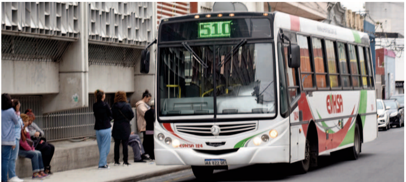
Hoy se cumple un año desde que por primera vez se aplicó una actualización tarifaria por IPC en el transporte público de San Nicolás.

Con el nuevo sistema, la primera actualización tarifaria se produciría casi dos meses más tarde: el 15 de abril de 2024, hace hoy exactamente un año. En los 12 meses transcurridos, hubo igual cantidad de actualizaciones. Algunas incorporaron un único IPC, mientras que en otros casos el incremento se hizo esperar por más tiempo pero terminó llegando con las variaciones de dos IPC incorporadas al cuadro tarifario. La primera implementación del nuevo sistema llevó hace un año el pasaje local de $690 a $772, puesto que incorporó una suba del 11,9% correspondiente al IPC de febrero de 2024. Posteriormente