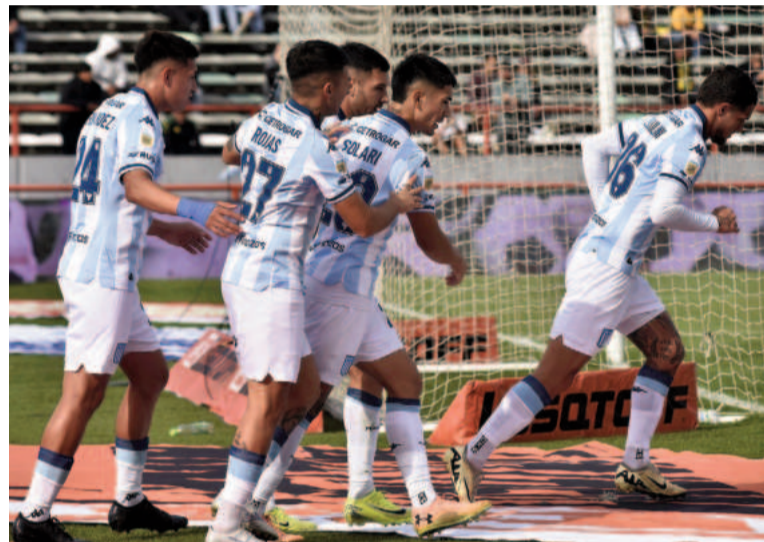
La Academia logró un triunfo clave para meterse entre los primeros ocho.