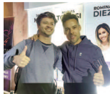
Los candidatos de La Libertad Avanza.

Este nivel de ausentismo y anulación se traduce en una señal de alerta que no debería pasar inadvertida para la dirigencia política en su conjunto. Pero hay más. Entre los datos que encendieron luces rojas en los análisis posteriores, se destaca que detrás de La Libertad Avanza —la fuerza más votada tanto a nivel local como departamental— se ubicaron los votos nulos y en