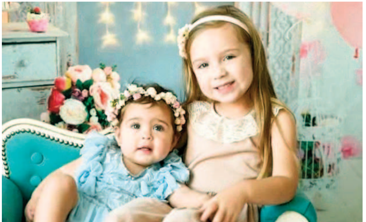
La hermana menor continúa desaparecida.