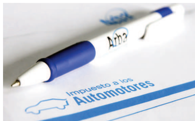
ARBA extendió el vencimiento de la patente.

La actualización del tributo tomará como referencia la inflación