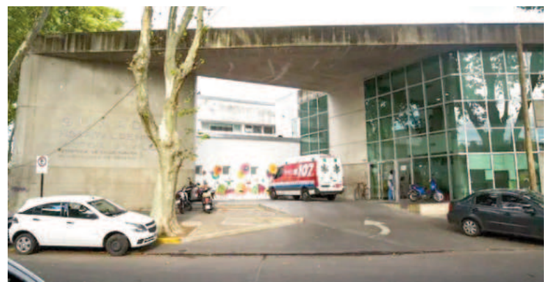
El chico está internado en el Vilela.

El fiscal en turno Walter Jurado solicitó al gabinete criminalístico que realice las pericias de levantamiento de rastros, toma de testimonios, secuestro del arma y envío a balística para el análisis.