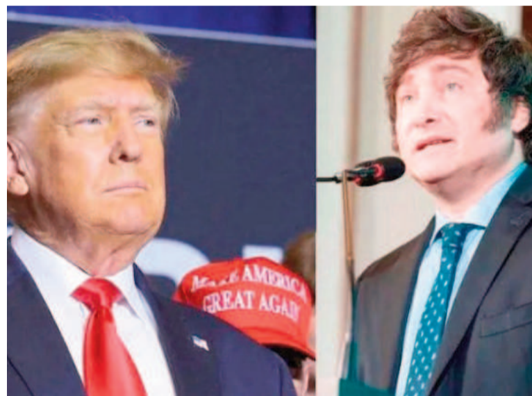
Trump impuso aranceles que Milei buscar alivianar.

Las dudas sobre la voluntad de Trump para negociar persisten. Incluso aliados como Israel fueron alcanzados por nuevas tarifas. «Es de necio pensar que vas a poder encerrar a 350 mi-