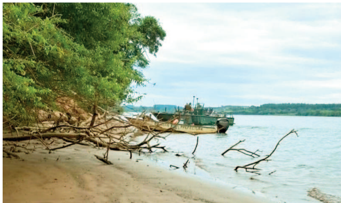
La madre y su hijo menor lograron salvarse tras el hundimiento de la embarcación en el río Paraná.

Tiene conexiones con otros puertos aguas abajo, como Rosario,