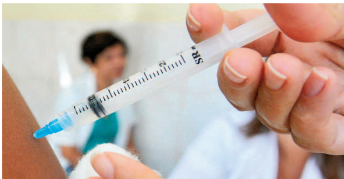
La vacuna antigripal no requiere orden médica y puede aplicarse junto con otras del Calendario Nacional.

Si bien la primera etapa de la campaña estuvo dirigida únicamente a mayores de 65 años y personal de salud, desde este lunes 7 de abril podrán acceder a la vacunación todos los que se encuentren dentro de los grupos de riesgo. Ello contempla a embarazadas (en cualquier trimestre), puérperas (en los 10 días posteriores al parto, preferentemente antes del egreso de la maternidad), niños y niñas de entre 6 meses y 2 años, personas de 2 a 64 años con factores de riesgo y per-