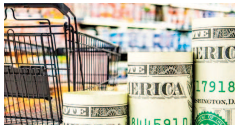
La inflación de marzo podría volver a acelerarse.

La inflación de marzo estuvo presionada por el alza de alimentos y bebidas, así como también por el mayor ritmo de aumento en los servicios públicos de la mano de la suba del transporte. «Carnes volvió a despuntar con un aumento por encima del promedio, pero fue parcialmente compensado por la caída de Panificados