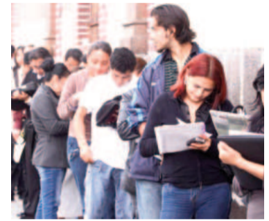
La desocupación bonaerense sigue escalando.

El ministro López expuso que «el achicamiento del mercado laboral y la licuación de los ingresos reales de las familias explican la caída de la actividad económica». A su vez, también remarcó que el modelo económico nacional «está orientado a la desindustrialización», haciendo énfasis en un gráfico de la variación