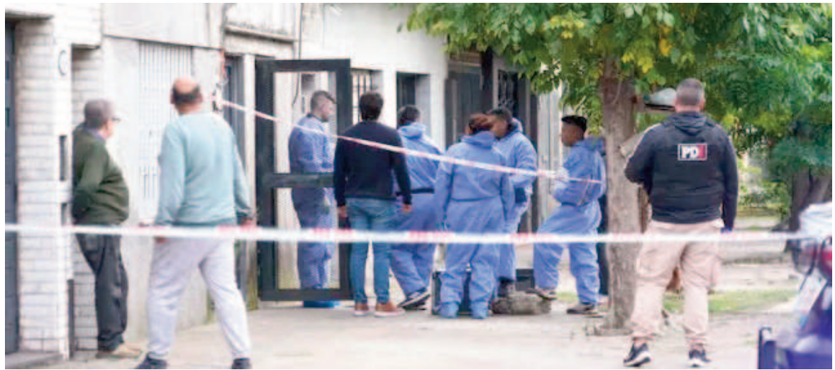
Personal de la Policía de Investigaciones en la casa de Uruguay al 5300, donde hallaron los cuerpos.

vivencia de la pareja eran conocidos en la cuadra donde ayer, en líneas generales, se mencionó que el sospechoso había dejado a su familia para irse a vivir con la víctima, pero las cosas no habrían funcionado y hace un tiempo