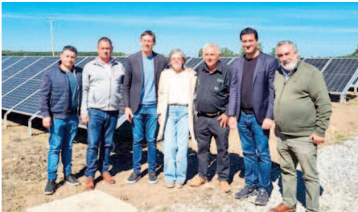
Maximiliano Abad en San Andrés de Giles.

En el marco de una visita a San Andrés de Giles para inaugurar la refacción de la Casa Radical, el senador nacional Maximiliano Abad opinó que “el gobernador (Axel) Kicillof confunde a la población. Hasta el momento, no convocó a las elecciones legislativas para el presente año”. De acuerdo con Abad, “confundir a la gente es faltarle el respeto. El gobernador Kicillof debe convocar a elecciones generales de manera urgente”.