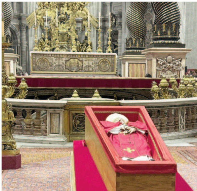
El féretro del Sumo Pontífice en la basílica.

El cuerpo del papa Francisco se encuentra en la capilla de la residencia Casa Santa Marta de la basílica de San Pedro, y los fieles que espe-