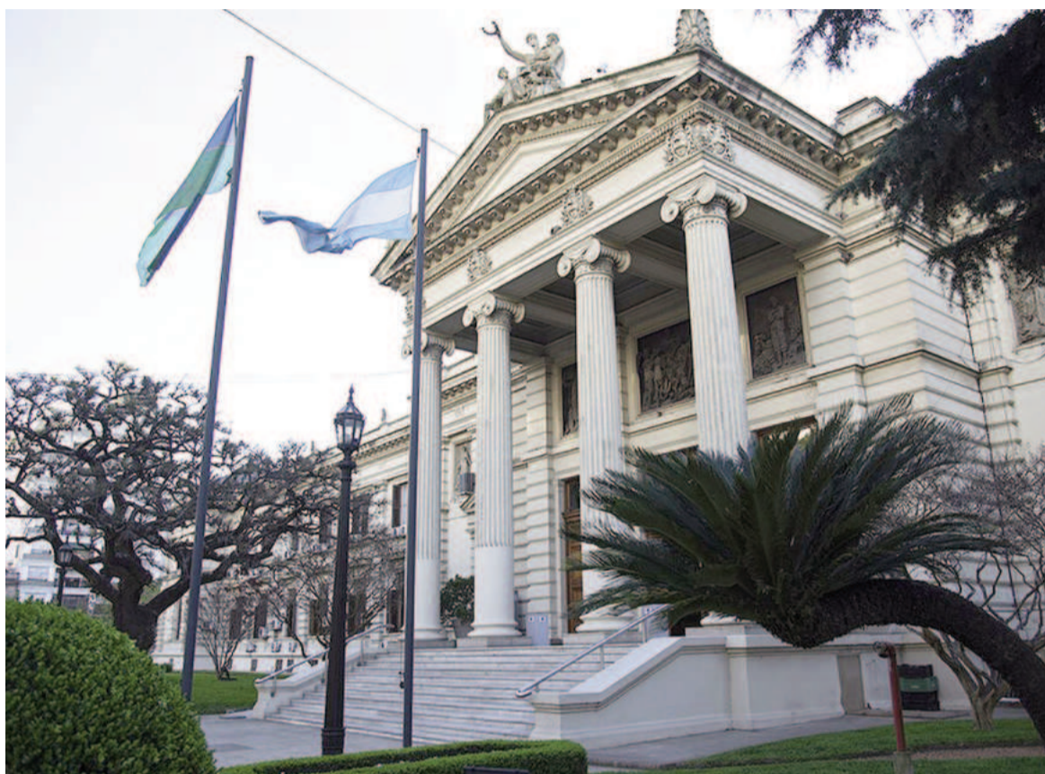
La Cámara de Diputados bonaerense.

Asimismo, calificó al Santo Padre como un líder que trascendió su obra eclesial y tuvo un papel "mucho más grande" a escala local y mundial. "Creo que nos vamos a ir dando cuenta con el tiempo de la importancia de su obra y de las discusiones que dio Francisco", concluyó.