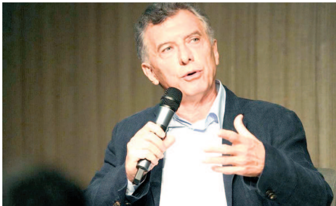
El expresidente Mauricio Macri

Ciertamente, Ritondo, Montenegro y Diego Santilli se habían cortado solos, desairando a Macri, en una reunión de alto nivel que tuvo lugar días atrás en la Casa Rosada junto a la secretaria general de Presidencia, Karina Milei, y los armadores liber-