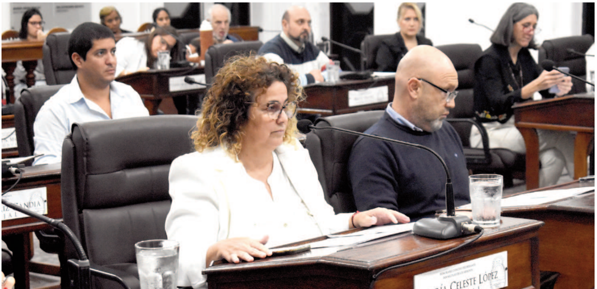
Con impulso del oficialismo, tuvo despacho favorable el proyecto del Ejecutivo para alentar la regularización de inmuebles familiares.

Los concejales que integran la comisión de Presupuesto y Hacienda dieron dictamen favorable al proyecto por el cual el Departamento Ejecutivo propone eximir del pago de una tasa municipal a los vecinos que deban presentar los planos de sus viviendas familiares para su aprobación y empadronamiento. La ordenanza se vota hoy en el recinto.