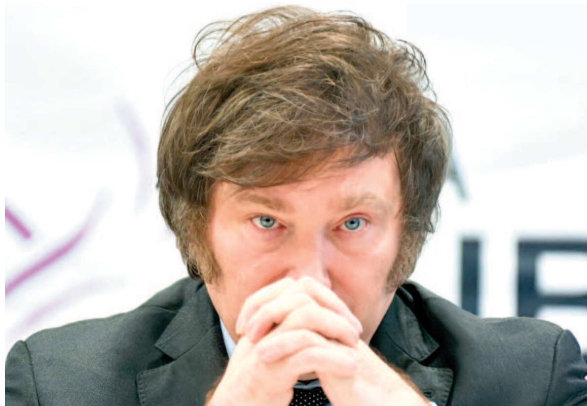
En el Ejecutivo dicen que buscarán retomar la agenda a la vuelta del funeral de Francisco.

El Gobierno se enfoca en el viaje del presidente Javier Milei al Vaticano, con gran parte del Gabinete, con motivo del funeral del papa Francisco. El Ejecutivo canceló la mayoría de sus actividades institucionales y partidarias en señal de respeto por la conmoción que significó el fallecimiento del Sumo Pontífice.