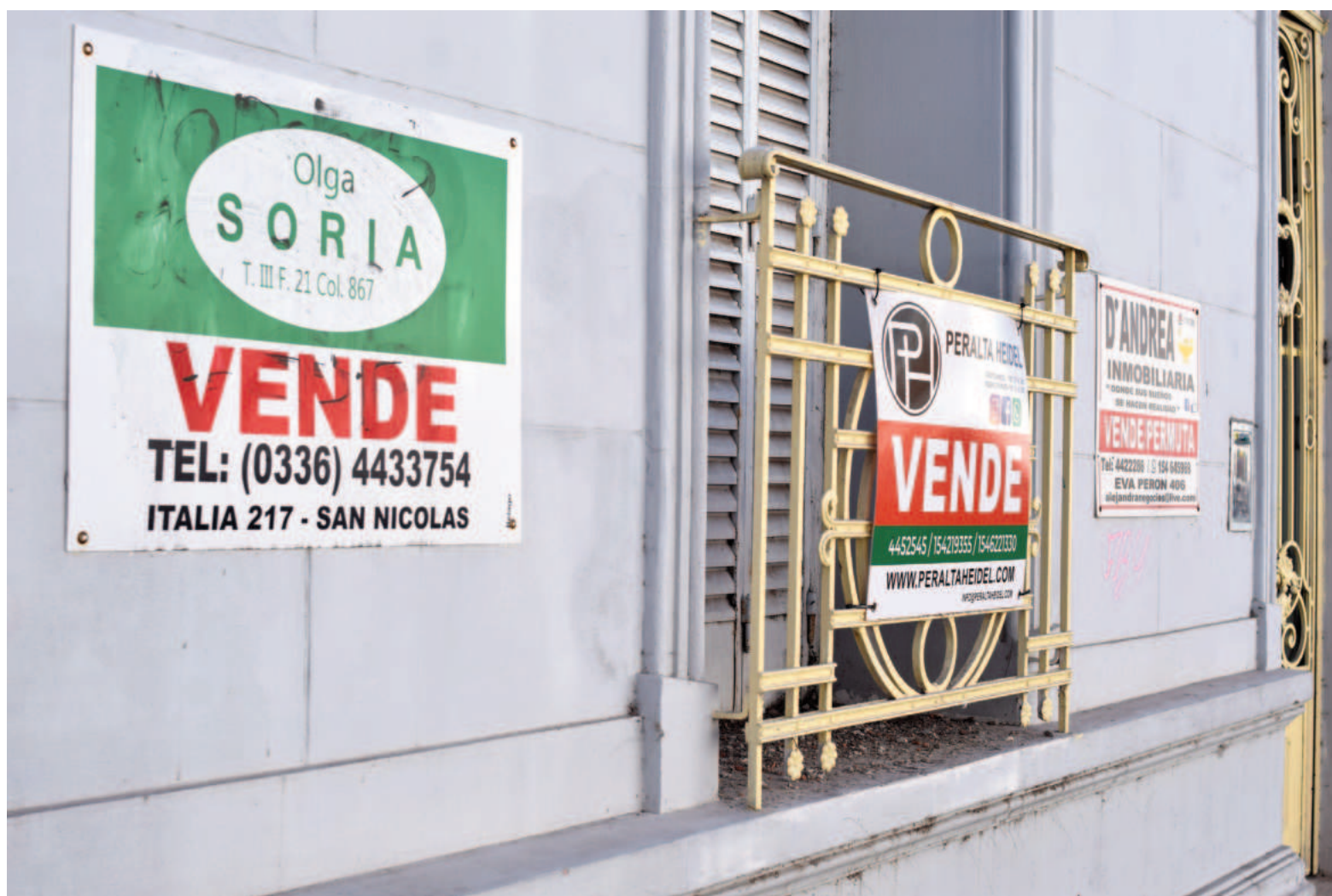
En San Nicolás y en el resto de la provincia de Buenos Aires la compraventa de inmuebles creció en el primer trimestre del año.

Situación que se refleja también en nuestra ciudad, con una demanda sostenida y con tendencia al crecimiento en el mercado inmobiliario. "Se sigue manteniendo el nivel de actividad, se nota una mayor cantidad de consultas, lo que nos hace predecir que el mer-