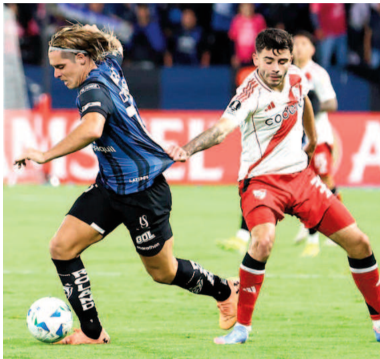
El Millonario cambió su imagen y consiguió un gran empate en la altura.

Dos minutos después se dio el segundo ataque de peligro de River, de la mano del mediocampista Franco Mastantuono, que sorprendió con un remate lejano. Su disparo salió rasante y al primer palo, y estuvo a pocos centímetros de ser efectivo.