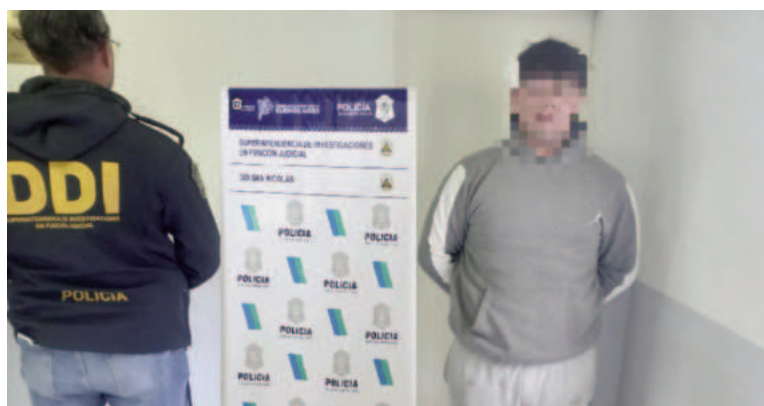
Aprehendieron a joven por un caso de grooming .

La investigación se encuentra a cargo de la Unidad Funcional de Instrucción N° 15 del Departamento Judicial San Nicolás, que venía trabajando desde el 7 de abril sobre las pistas digitales. Tras el allanamiento y la revisión