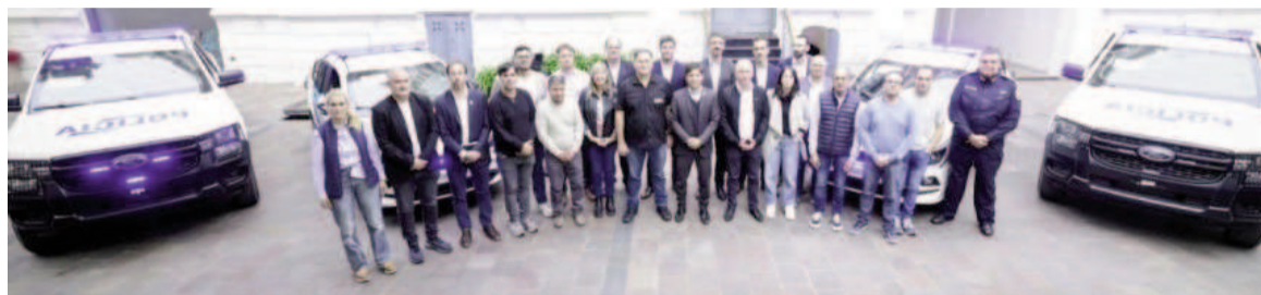
El gobernador se rodeó de intendentes.

"Tenemos que trabajar todos juntos porque sabemos que si a algún vecino de la Provincia le roban o lo matan, no