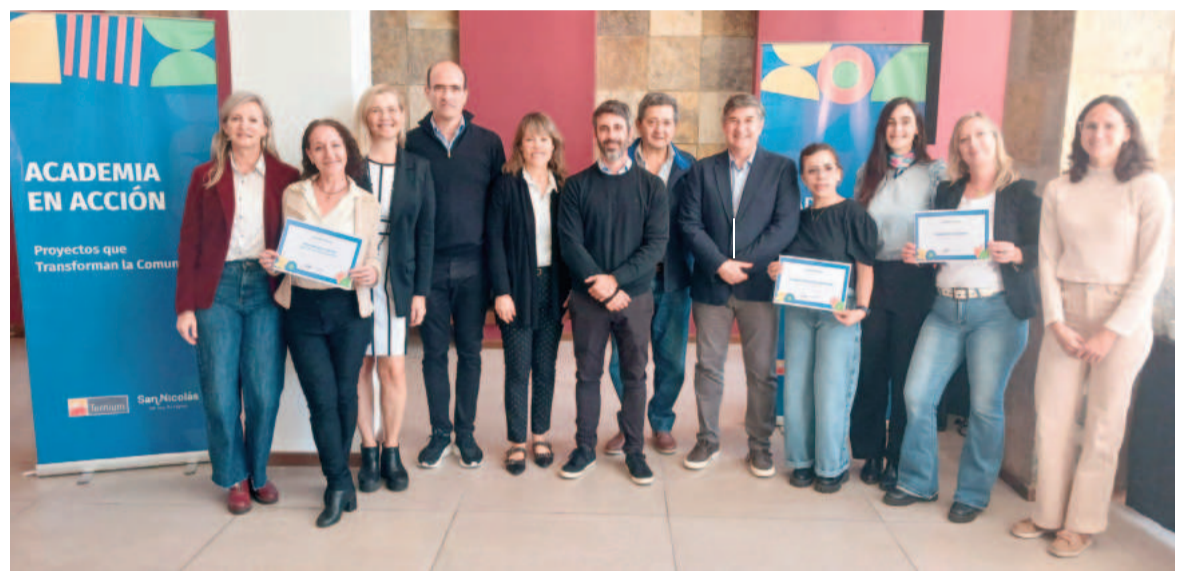
El compromiso de Ternium fue financiar por un total de $18.000.000 a tres instituciones que presentaron iniciativas locales de alto impacto social.

* UTN – FRSN Centro Cultural: Espacio Interactivo Sensolab. Despertando la curiosidad de niños de barrios vulnerables a partir de juegos con la Electrónica: espacio de experimentación mediante la creación de juegos inter-