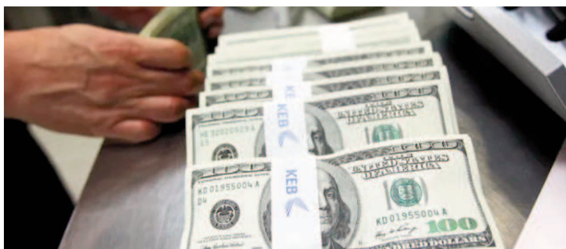
Los bancos registran un aumento en la demanda de dólares tras el fin del cepo.

El Banco Central de la República Argentina (BCRA) anunció que permitirá la libre flotación del tipo de cambio dentro de los límites establecidos, interviniendo únicamente