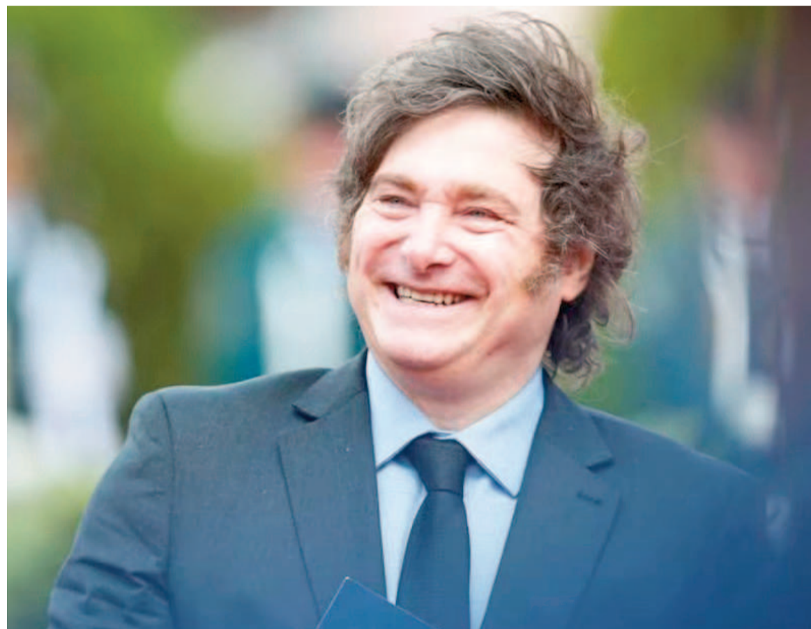
El "influyente" presidente de Argentina, Javier Milei.

El presidente argentino integra la sección "líderes mundiales", junto a Donald Trump, Claudia Sheinbaum y Keir Starmer. El listado, además, lo integran Elon Musk, Mark Zuckerberg, Ed Sheeran y Gisèle Pelicot.