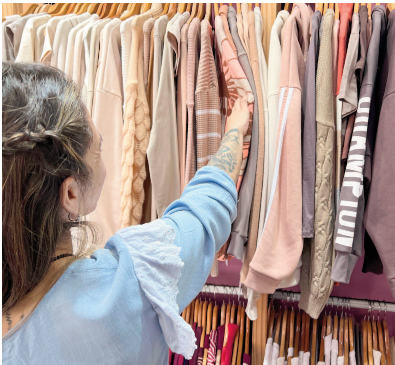
Por el momento no se registran subas de precios, aunque el panorama es de incertidumbre por tratarse de una resolución reciente.

En otro orden, el precio de la ropa había aumentado antes de la rebaja