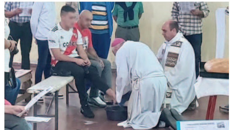
Hoy Jueves Santo, a las 9.00 en la Unidad Penal 3, el obispo Hugo Santiago procederá al lavatorio de pies de los internos.

Por su parte, la Municipalidad de San Nicolás recordó en sus redes sociales diversos puntos de la ciudad que son atractivos para el encuentro en este fin de semana largo, como el Teatro, el EcoParque, el centro y la Costanera, bares, la Plaza Mitre, el Puente de los Deseos y las inmediaciones del Santuario. “El fin de semana es una oportunidad perfecta para ponerte al día con amigos, visitar a la familia, desconectar entre la naturaleza o redescubrir a la ciudad con otros ojos. San Nicolás