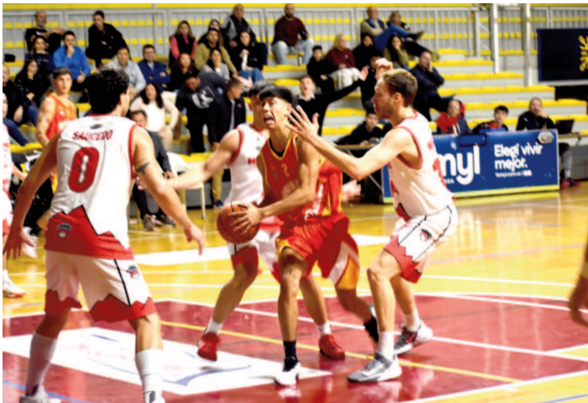
Giaccio sumó 16 puntos, nueve de ellos en el último cuarto (con tres triples)

su suerte en el Grupo B de la Conferencia Sudeste con cuatro partidos de visitantes.