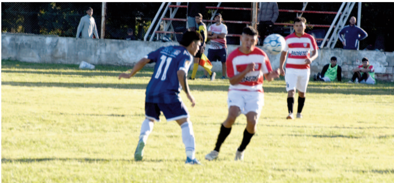
Somisa goleó y es único puntero.