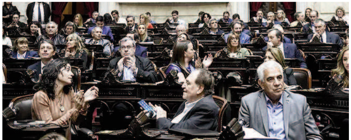
La oposición convocó a una sesión para este martes en Diputados.

impulsores de la sesión para este martes es que, con esa estrategia, Francos intentará "cancelar" los pedidos de informes y de interpelación que ya cuentan con dictamen de comisión. Entre los pedidos de inter-