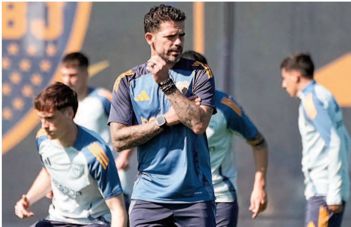
El Xeneize intentará volver a la senda del triunfo.

Independiente visitará este domingo a Lanús con el objetivo de asegurarse la clasificación a los play-offs. El Rojo llega a este encuentro luego de un frustrado debut en la