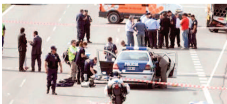
El asesinato de los dos policías nicoleños se produjo en un asalto en 2010 en la autopista Panamericana, cuando custodiaban un camión de caudales.

A partir del material balístico incautado los peritos establecieron que hubo cinco tiradores armados con dos