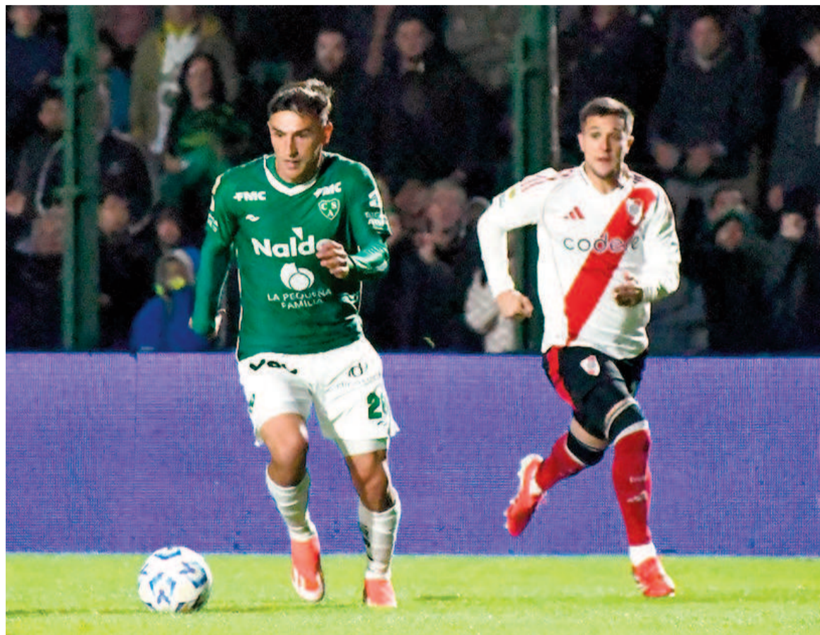
El Millonario jugó mal y sumó un empate ante el Verde.

El equipo de Gallardo empató 1 a 1 en Junín en floja actuación. Armani evitó la derrota con sus atajadas. Borja puso en ventaja al visitante y el ex Boca Insaurralde marcó la paridad.