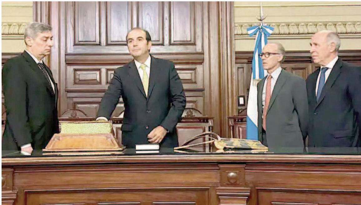
Rosatti le tomó juramento a García-Mansilla bajo la mirada de Lorenzetti y Rosenkrantz.

El presidente Javier Milei designó por decreto y en comisión a Manuel García-Mansilla como juez de la Corte Suprema el 25 de febrero de 2025. Dos días después, Horacio Rosatti le tomó juramento, mientras Lorenzetti y Carlos Rosenkrantz observaban atentamente. La decisión, tomada