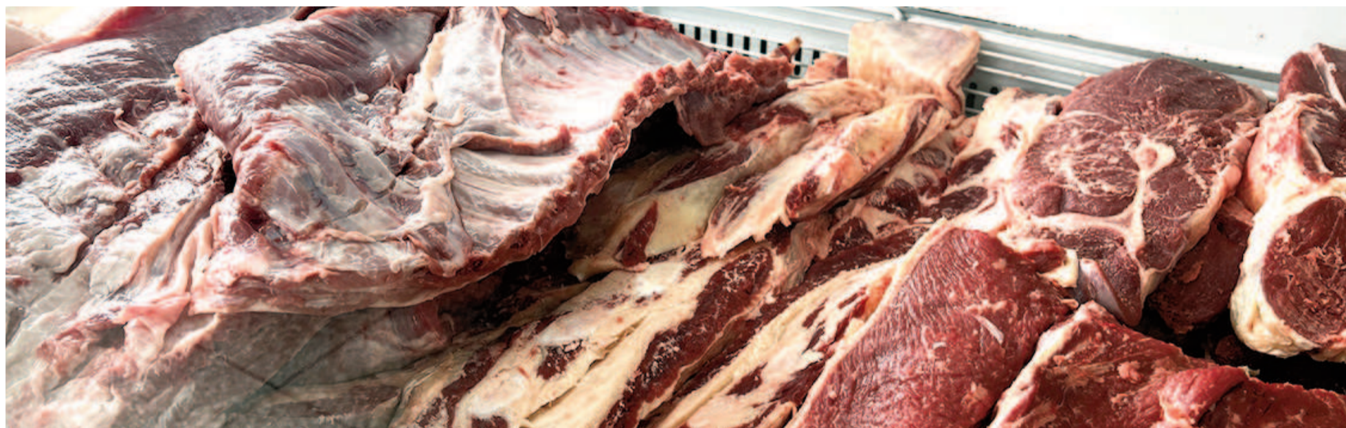
Hoy se está pagando la media res por kilo $7000, que al mostrador suele duplicar su valor.

El precio de la carne “se disparó” el jueves y vuelve a subir el lunes, según indicaron fuentes del sector, por lo que el kilo de pulpa o asado rondará entre 14.000 y 15.000 pesos en los mostradores nicoleños. A ello se agrega la disminución de descuentos que ofrecían las billeteras virtuales para compras cárnicas. “Cada vez se resiente más el consumo y ya hay carnicerías que tuvieron que cerrar”, advierten.