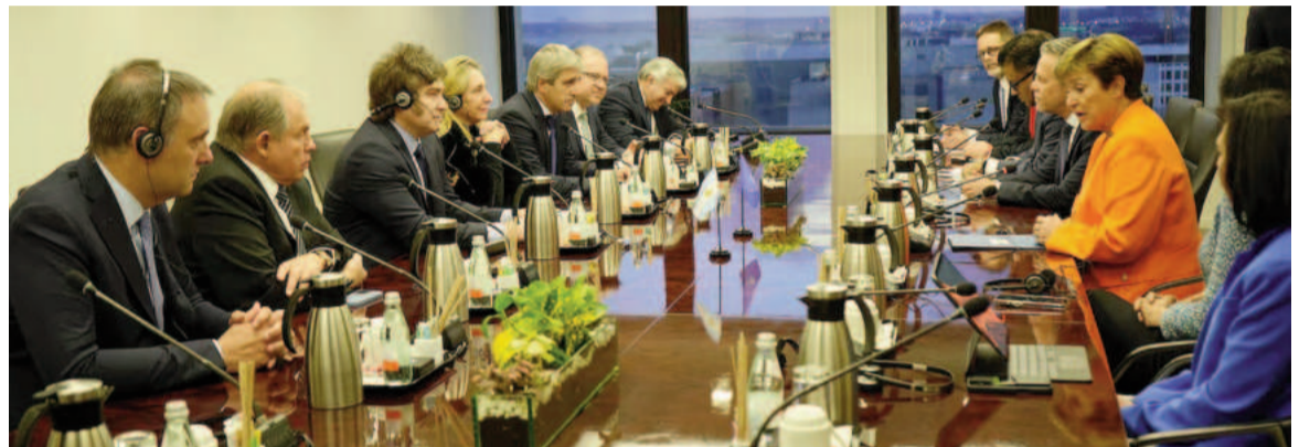
El Gobierno apunta a un paquete amplio para incrementar las reservas internacionales.

Se trata de un monto, ya de por sí, considerado excepcional como primer giro de divisas para este tipo de programas. El 60% de los últimos 311 acuerdos celebrados por el organismo contempló desembolsos iniciales de entre el 20 y el 30%, según la consultora 1816. El argumento