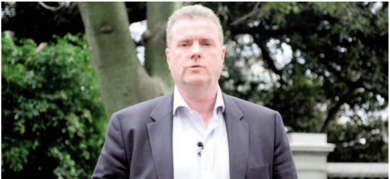
El diputado nacional Gerardo Milman.

Según trascendió en ese momento, Milman habría comentado