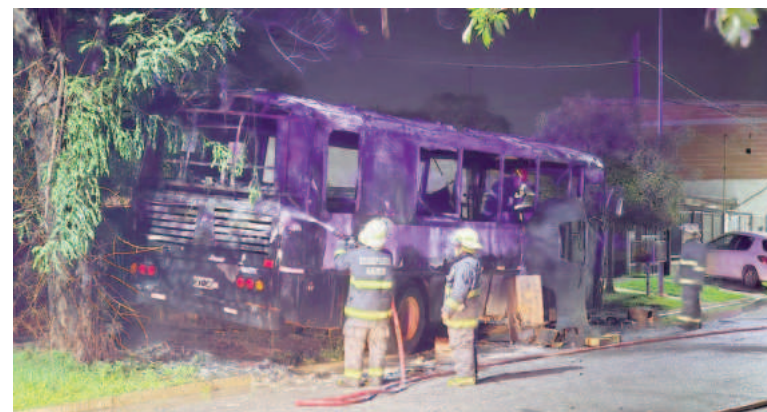
Bomberos trabajaron en el lugar.

En el lugar trabajaron dos dotaciones de Bomberos de San Ni-