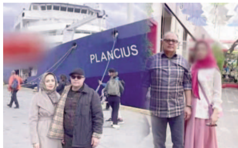
Shahram Dabiri, ahora exvicepresidente del régimen iraní, durante su viaje a Argentina.

En abril de 2024, la Justicia responsabilizó a Irán por el atentado contra la Embajada de Israel de 1992 y el ataque en 1994 contra la organización judía AMIA, ambos ocurridos en Buenos Aires. La Cámara Federal de Casación Penal argentina dictaminó que ambos ataques fueron ordenados por el gobierno de Teherán y llevados a cabo por la organización chiita li-