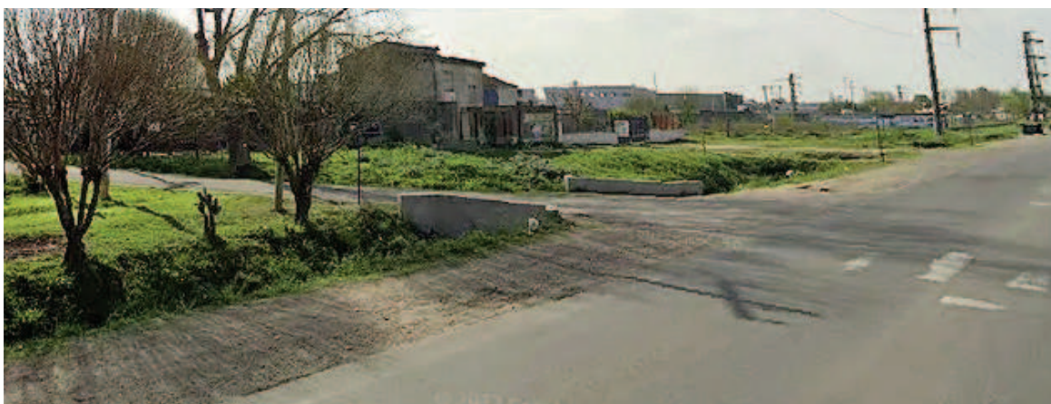
Investigan la muerte de una mujer hallada en una zanja.

vestigación, una cámara de monitoreo de la zona registró el momento en el que la mujer cayó a la zanja. Sin embargo, por el momento la carátula de la investigación es muerte dudosa y la lleva adelante la Fiscalía de Homicidios Culposos del Ministerio Público de la Acusación.