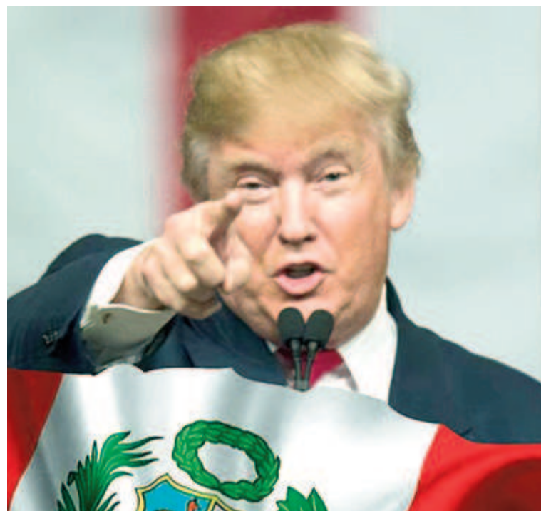
Los aranceles se aplican desde ayer 5 de abril.

"Esta práctica de Estados Unidos no se ajusta a las normas comerciales internacionales, socava gravemente los derechos e intereses legítimos