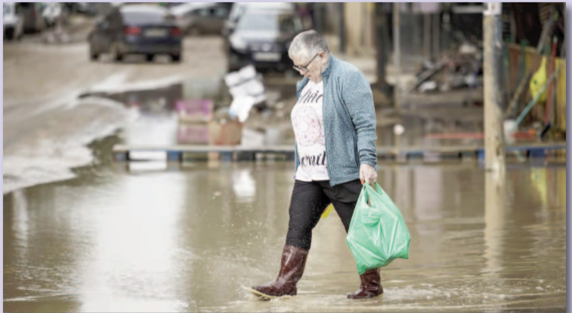
El informe subraya que una acción climática eficaz debe dar prioridad a la seguridad, la equidad y el liderazgo de mujeres y niñas.

La carga de esta crisis no se distribuye por igual. Las mujeres y niñas que viven en la pobreza, incluidas las pequeñas agricultoras y las que viven en asentamientos urbanos informales, se enfrentan a una mayor vulnerabilidad, según el informe. Las mujeres indígenas, dis-