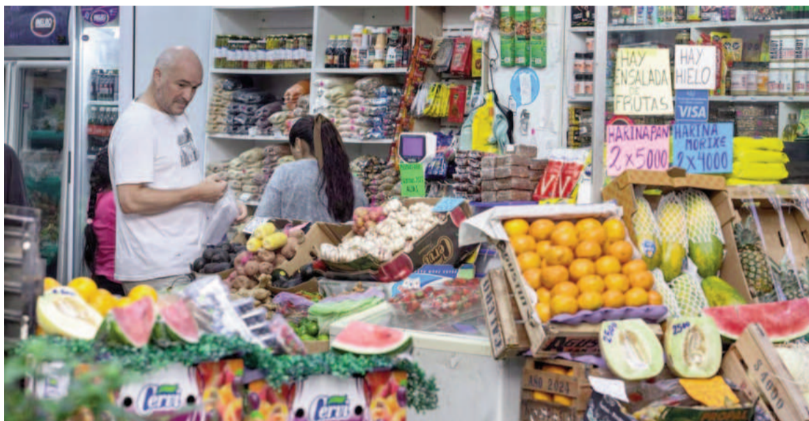
Las empresas alimenticias dejaron en suspenso las listas tras las críticas públicas de Caputo.

La proyección de Equilibra es que abril tendrá una inflación del 3,3%. En la misma línea, en la consultora LCG prevén que sea del 3,4%,