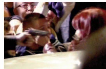
Momento en que se intentaba el magnicidio.