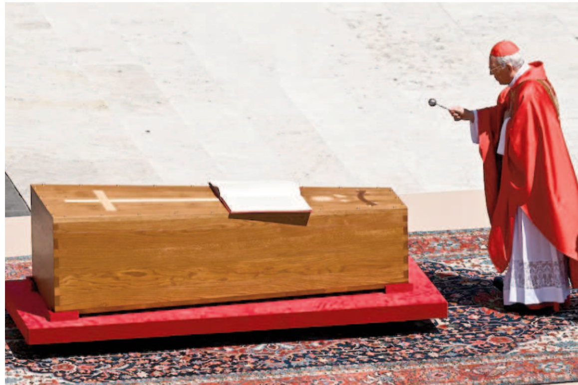
El cardenal Giovanni Battista Re bendice el ataúd.

El Vaticano enterró al primer pontífice argentino de la historia ante la presencia de más de 200.000 personas.