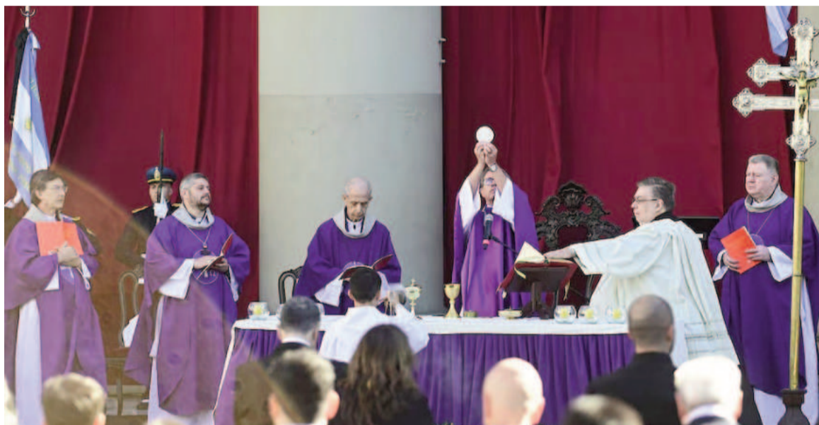
La liturgia frente a la Catedral de Buenos Aires, encabezada por García Cuerva.

Desde la madrugada, en la Catedral hubo una vigilia con canciones, velas y banderas en medio de la tormenta, a la espera de la misa porteña y del funeral en la Plaza San Pedro del Vaticano.