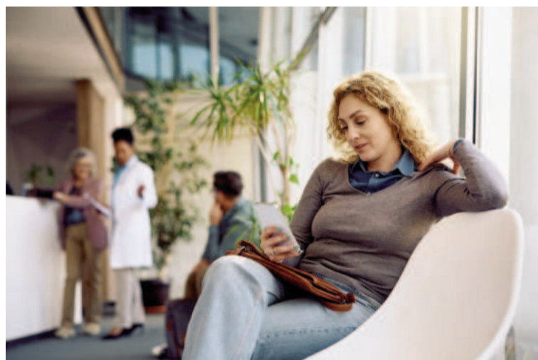
Los controles médicos periódicos son esenciales para detectar tempranamente posibles alteraciones y anticiparse a futuras complicaciones.

El programa de Grupo Oroño disponible en San Nicolás abarca un conjunto coordinado de estudios fundamentales para cuidar la salud femenina. Durante una única visita, cada paciente podrá realizarse: ecografía ginecológica o intravaginal, para evaluar en detalle el sistema reproductor femenino; ecografía mamaria, para detectar tempranamente cualquier alteración en el tejido mamario; mamografía, que es un estudio fundamental indicado por recomendación médica para complementar la evaluación mamaria; densitometría ósea, esencial para prevenir o detectar osteoporosis; análisis de laboratorio, opcionales según indicación