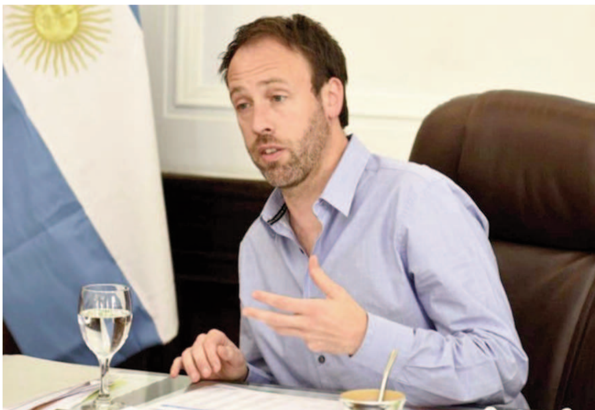
Ministro de Economía Pablo López.

Mostrando datos estadísticos, el funcionario de Axel Kicillof señaló que “la caída de los ingresos