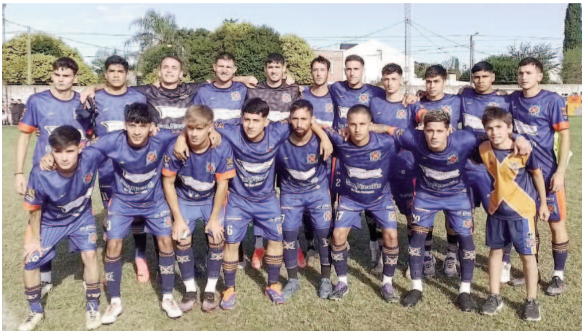
El Náutico es el único invicto que tiene el campeonato. EL NORTE