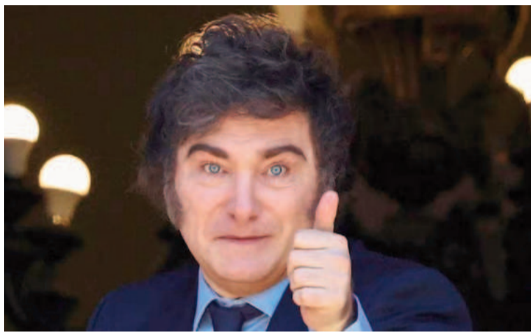
Milei busca acercar posiciones con el PRO.

En esa línea, profundizó: “Estamos orgullosos de haber sacado a 10 millones de argentinos de la pobreza. Debo tener al menos 50 ofrecimientos de universidades de pri-