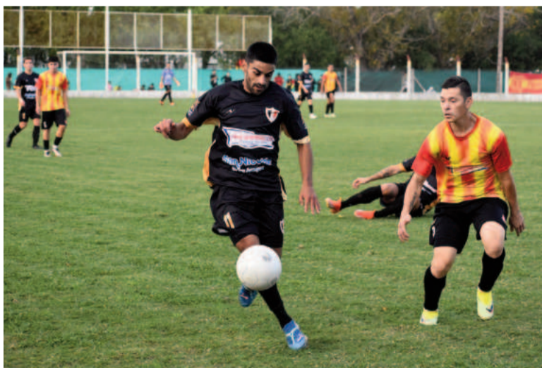
En el camping, Belgrano y Rojo repartieron puntos. EL NORTE