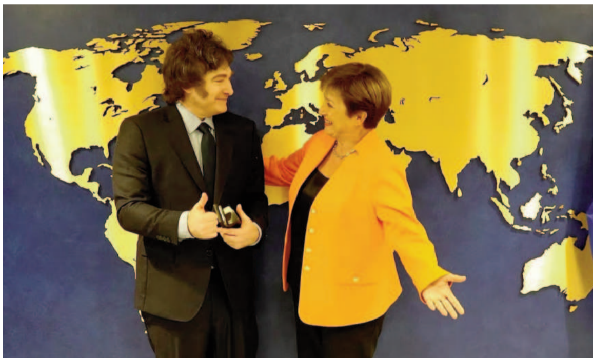
Milei y Georgieva, en el encuentro que tuvieron en febrero de 2025 en la sede del FMI.

Y siguió: “No existe asunto más necesario y urgente que terminar con la inflación que durante años le arruinó la vida a los argentinos. Por ello, el Presidente de la Nación aspira a obtener un compromiso