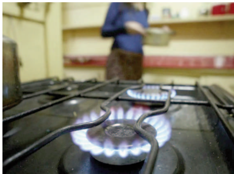
Vuelve a aumentar el gas.

En el caso de la firma que brinda el servicio en el Área Metropolitana de Buenos Aires (AMBA), el precio PIST para los usuarios residenciales que no poseen subsidios será de