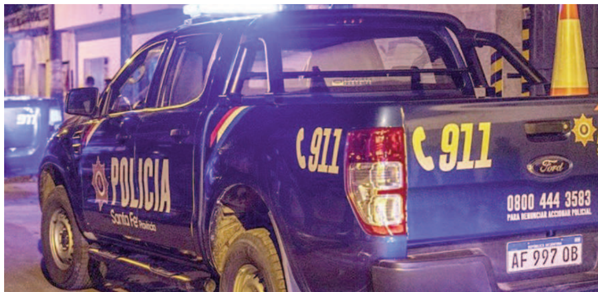
La Policía intervino en tres episodios de violencia en Villa Gobernador Gálvez.

Según trascendió, el adolescente había acudido al lugar donde fue atacado luego de recibir un mensaje de su hermano, quien está privado de la libertad y le pidió que retirara dinero