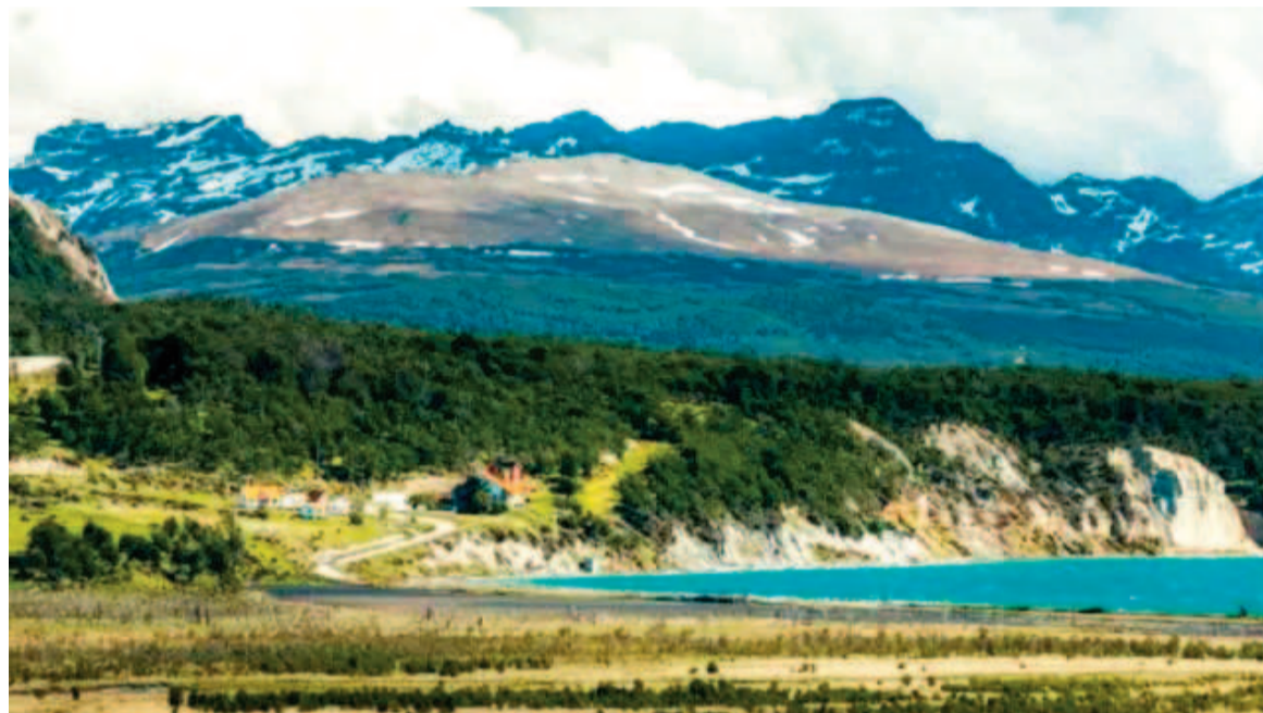
La provincia de Tierra del Fuego cobra una tarifa a quienes visitan y suben al Glaciar Martial.

El Martial es un glaciar con forma de semicírculo que se encuentra a situado a 1000 metros sobre el nivel del mar. Supo formar parte de un glaciar más importante en cuanto a