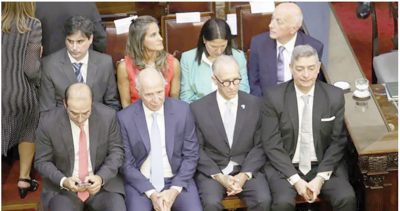
Los integrantes de la nueva Corte.

La oposición en el Senado se prepara para avanzar con el rechazo de los plie-