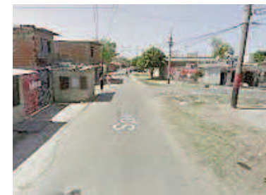
La zona del hecho.

El hombre fue hallado con heridas en distintas partes del cuerpo. Personal del Sies lo asistió y lo trasladó hasta el hospital, donde permanece en la unidad de terapia intensiva.