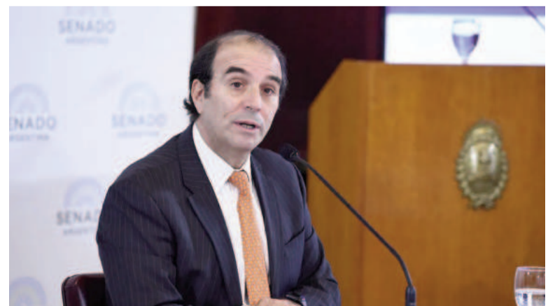
El voto de García Mansilla descolocó al gobierno.

Tras esto, el oficialismo buscará volver a intentar a tratar el pliego en la Cámara alta.