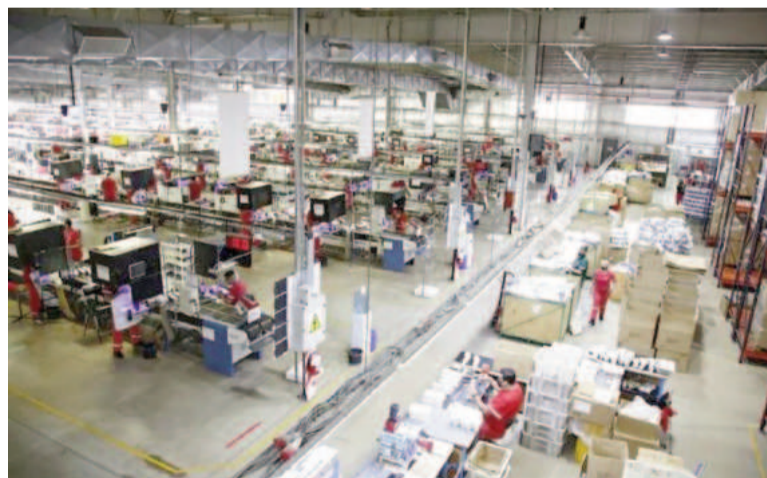
La industria sigue contraída.

El informe, basado en un sondeo de la Unión Industrial Argentina (UIA) sobre más de 800 empresas, advierte que este resultado no implica una retracción estricta de la actividad, ya que enero es un mes de alta estacionalidad debido a las vacaciones y paradas de planta.