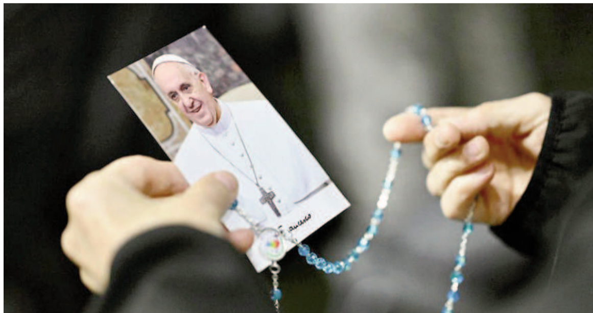
La voz de Francisco se escuchó durante el rezo del Rosario.

La Santa Sede compartió un mensaje del Sumo Pontífice para agradecer a la gente por sus plegarias. Fue grabado ayer jueves y es el primero en sus 21 días de internación.