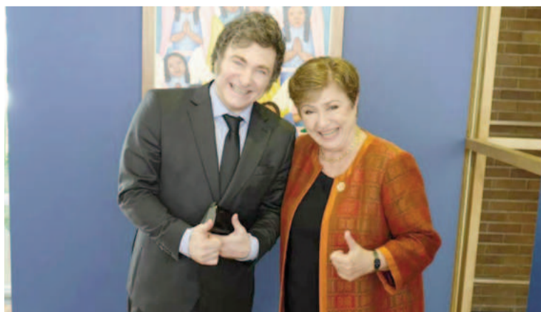
El acuerdo técnico con el FMI llegaría en breve.

se deberá avanzar en la elaboración y firma del Memorandum de Políticas Económicas y Financieras, que describe las políticas o compromisos -fiscales, cambiarios, monetarios- que se pretenden implementar. Y está la firma del Memorandum Técnico de Entendimiento, que plasma aspectos tales como los mecanismos de medición del déficit fiscal o la acumulación de reservas. Por último, esos documentos deberán ser enviados al Directorio del FMI, que deberá aprobarlo para su finalización. En el calendario del organismo