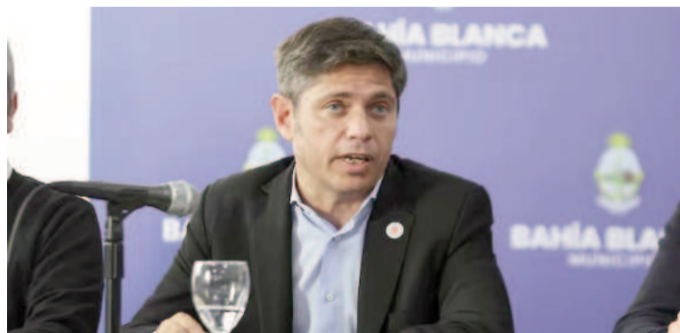
El gobernador criticó a Milei.

“Nuestro modelo es el que hace de la educación pública una política de Estado para mejorar la calidad de vida en Morón y en los 135 municipios”, insistió Axel Kicillof.