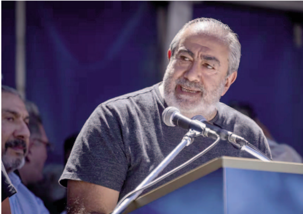
La CGT confirmó un nuevo paro contra el gobierno de Javier Milei.