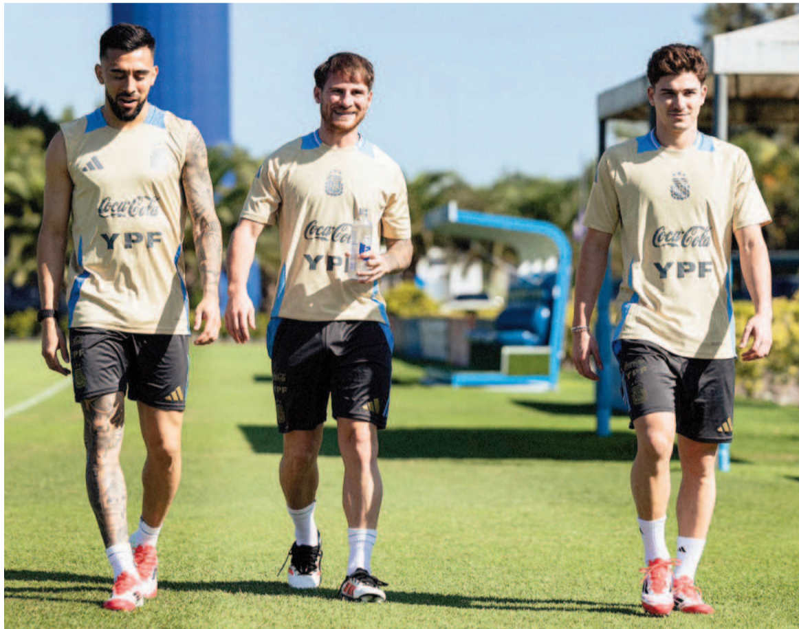
El equipo de Scaloni tendrá una prueba de fuego ante los charrúas.

La "Albiceleste" es líder y buscará dar un paso a la clasificación sin Messi y sin otras figuras. El partido se disputará en el Estadio Centenario a la partir de las 20.30.