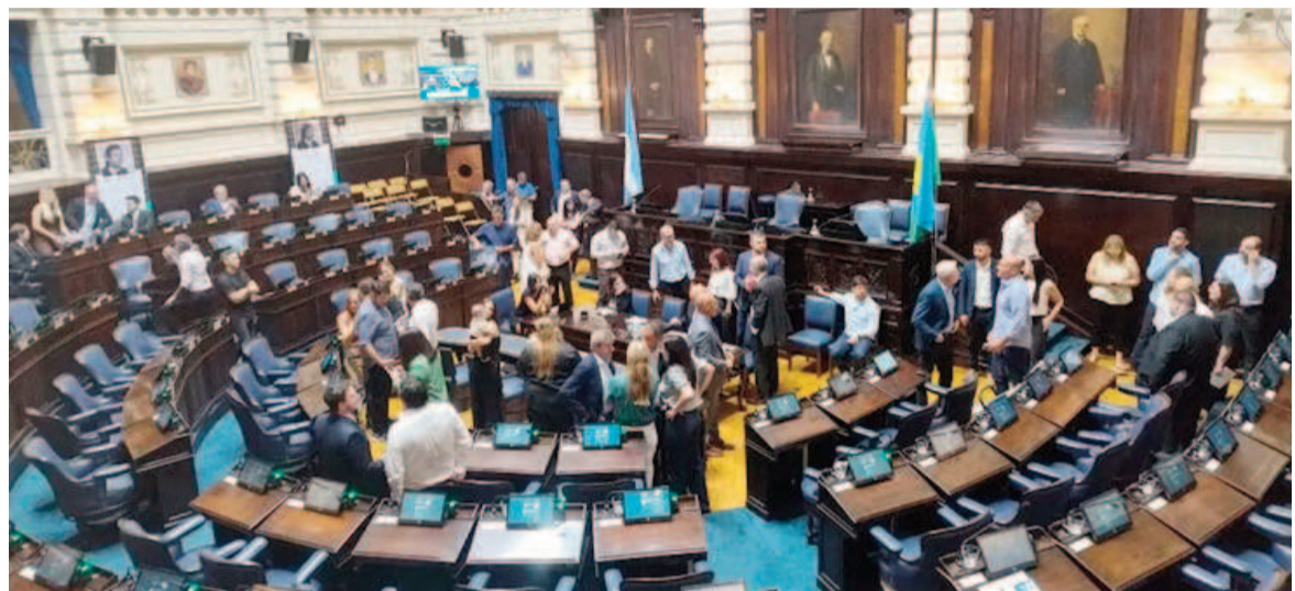
La interna peronista hundió la sesión para suspender las PASO.