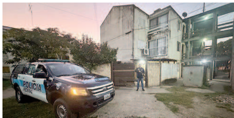
El allanamiento, realizado por la Policía Federal División San Nicolás, se cumplió en un domicilio de barrio Fonavi de San Pedro.

de Castañares había sido practicada en la morgue de San Nicolás y arrojó que el joven sampedrino, de 33 años, había muerto por asfixia tras un incendio provocado por desconocidos que habrían ingresado a su vivienda entre la noche del domingo y la madrugada del día siguiente. Los primeros resultados indicaban prima facie que la causa eficiente del deceso fue la inhalación de humo.