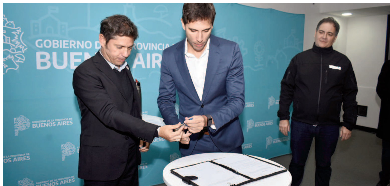
El 17 de mayo de 2024 el gobernador y el ministro de Seguridad habían puesto en funcionamiento a la UTOI en San Nicolás.

La asignación de estos recursos quedará a cargo de los intendentes, que deberán rendir cuentas ante las autoridades provinciales, pero se es-