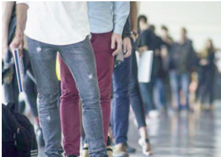
Casi un millón y medio de personas sin trabajo.

El crecimiento del empleo privado formal mostró diferencias significativas entre sectores. Entre noviembre y diciembre de 2024, seis de los catorce sectores analizados registraron aumentos en la cantidad de trabajadores, mientras que dos se mantuvieron sin cambios y otros seis mostraron caídas. En particular, el sector Comercio representó el 85% del crecimiento total del empleo registrado en ese período.