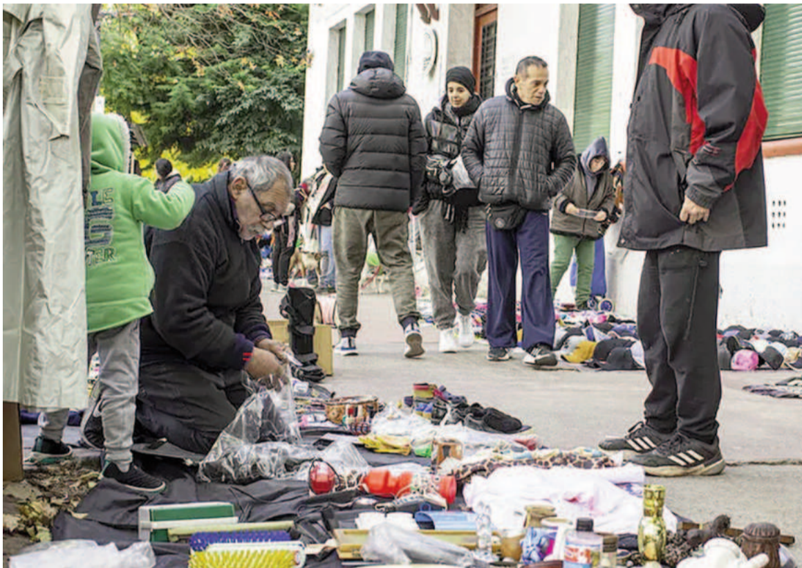
En diciembre hubo una fuerte caída en la cantidad de monotributistas sociales.

El empleo registrado tuvo en diciembre de 2024 su mayor caída mensual desde que el Secretaría de Trabajo publica los datos. La causa estuvo vinculada a una razón puntual y fue que el Gobierno dio de baja a 406.000 personas del monotributo social, el 60% del padrón.