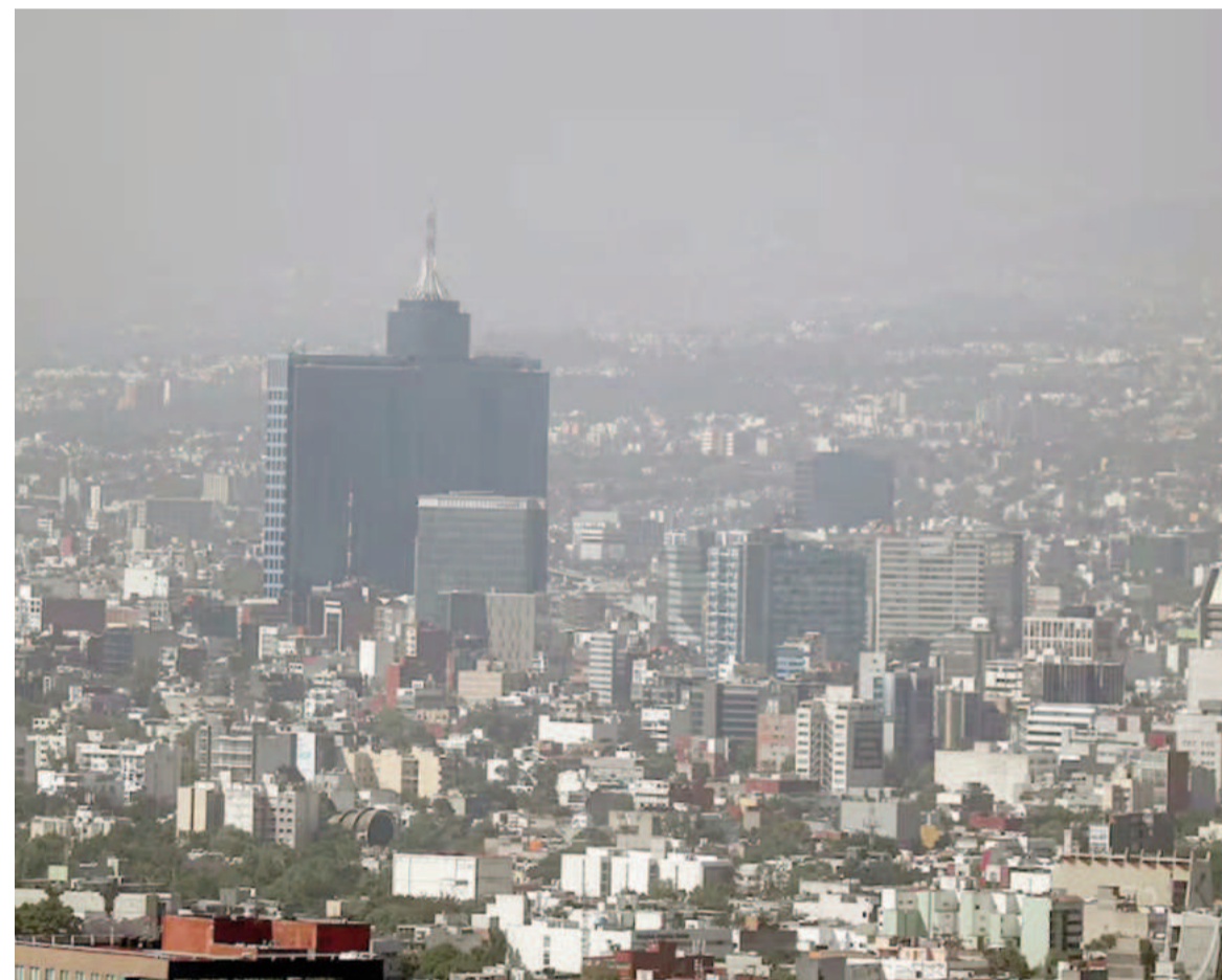
La ciudad fue construida hace varios años sobre un antiguo lago.

La capital de este país fue construida sobre un antiguo lago. El consumo de aguas subterráneas, el cambio climático y la densidad de población se consideran las principales causas de este fenómeno.