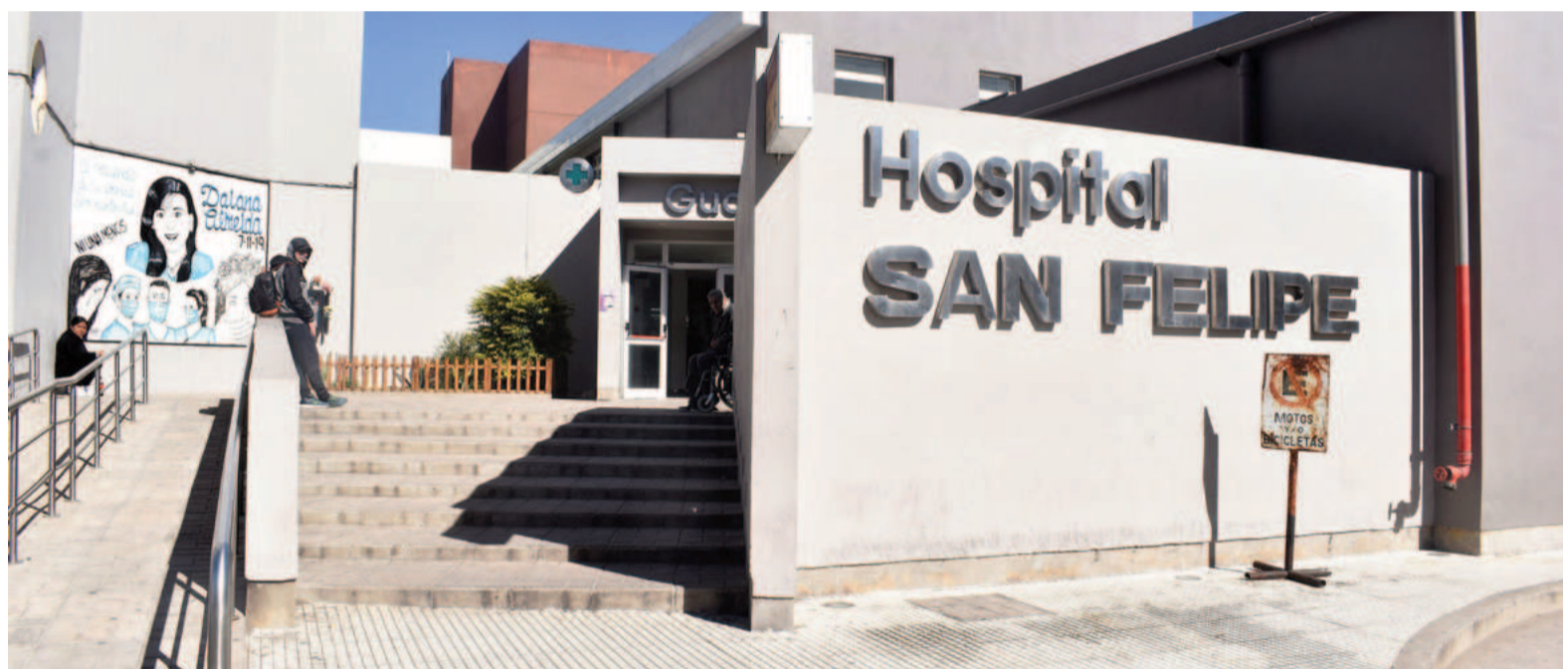
El Centro de Vacunación del Hospital San Felipe aplica todas las dosis incluidas en el Calendario Nacional, que son gratuitas y obligatorias.

El Centro de Vacunación aplica todas las dosis incluidas en el Calendario Nacional de Vacunación. Estas vacunas son gratuitas y obligatorias, y su propósito es prevenir enfermedades que pueden tener consecuencias graves para la salud. Entre ellas se inmuniza contra la tuberculosis (BCG), hepatitis B, neumococo, polio, rotavirus, meningococo, gripe, hepatitis A, triple viral (sarampión, rubéola y paperas) y varicela. Es fundamental que los ciudadanos accedan a estas vacunas, ya que ayudan a prevenir una amplia variedad de enfermedades que afectan tanto a niños como a adultos.