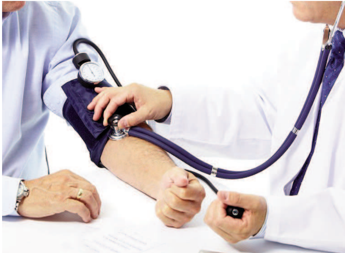
La hipertensión es conocida como un "asesino silencioso" ya que, en muchos casos, no presenta síntomas evidentes.

La cifra más baja es el valor de la presión diastólica, que mide la presión en las arterias cuando el corazón está en reposo entre latidos.