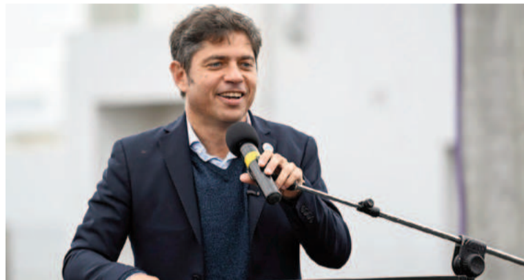
El gobernador Axel Kicillof.

ción en la provincia de Buenos Aires, lo que está haciendo es arruinarle la vida a miles de familias que esperan hace mucho tiempo acceder a su hogar”, afirmó el gobernador. En ese sentido, Kicillof apuntó directamente al presidente, cuestionando su enfoque hacia los sectores más acomodados: “Todos esos bonaerenses se ven postergados por la responsabilidad de un Presidente que tiene como prioridad a los sectores más ricos: para ellos trabajan y para ellos gobiernan”, expresó con firmeza. Kicillof destacó además el compromiso de la Provincia en la construcción de viviendas, asegurando que se mantiene un récord de ocho mil casas en construcción