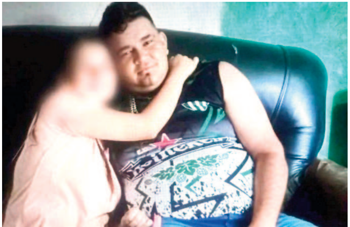
El hombre acusado de matar a la niña de 3 años fue atrapado en Rosario.

La mujer deberá afrontar una durísima acusación: homicidio triplemente agravado por el vínculo con ensañamiento y alevosía, delito que tiene una pena en expectativa de prisión perpetua. También se la acusa del mismo delito, pero en grado de tentativa, contra la hermanita de la víctima, de 7 años de edad.