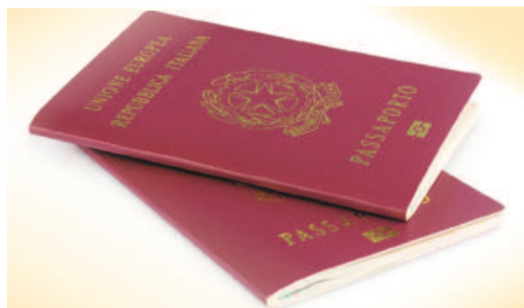
Se deberá tener padre o abuelo nacido en aquel país.

Según un cálculo del ministerio italiano de Asuntos exteriores, con la ley que estaba en vigor hasta este