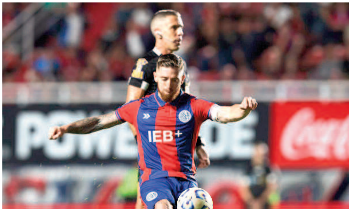
El Ciclón sumó un punto en casa. NA

El equipo de Russo igualó 1 a 1 y sigue en puestos de clasificación en la Zona B. El español Muniain puso en ventaja al local e igualó Moreno para el Granate.