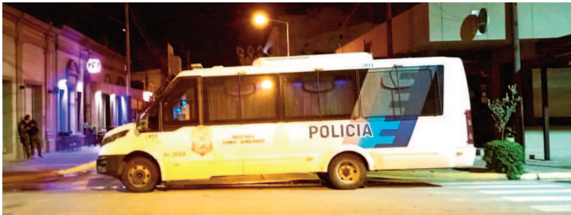
A través del megaoperativo los efectivos policiales lograron secuestrar 264 envoltorios de cocaína (400 gramos) y dos ladrillos de marihuana (1,2 kilos).