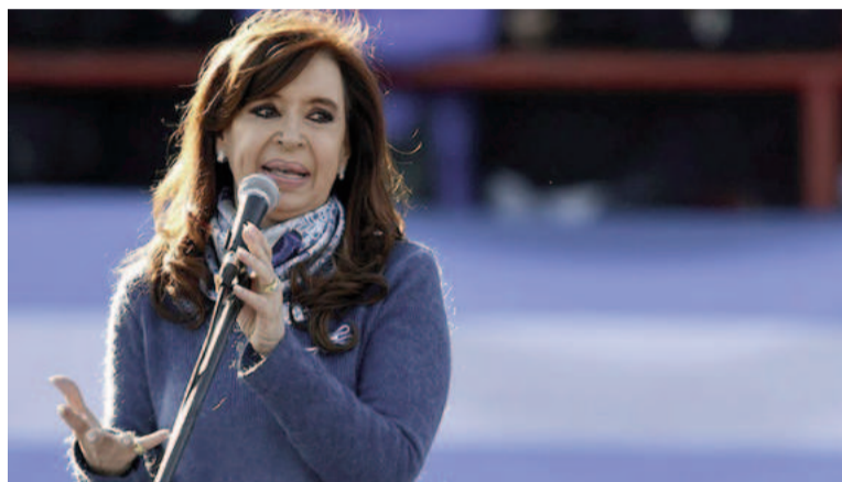
Cristina Fernández de Kirchner.

Criticó también la incapacidad de la gestión libertaria para no defender el préstamo, aludiendo a que quieren tapar "el saqueo a la Nación" mediante la persecución a su figura. En relación a esto último, también increpó a la Cámara de Casación, a la cual tachó de "macrista" y de la cual aseguró que dicta "un fallo sin prue-