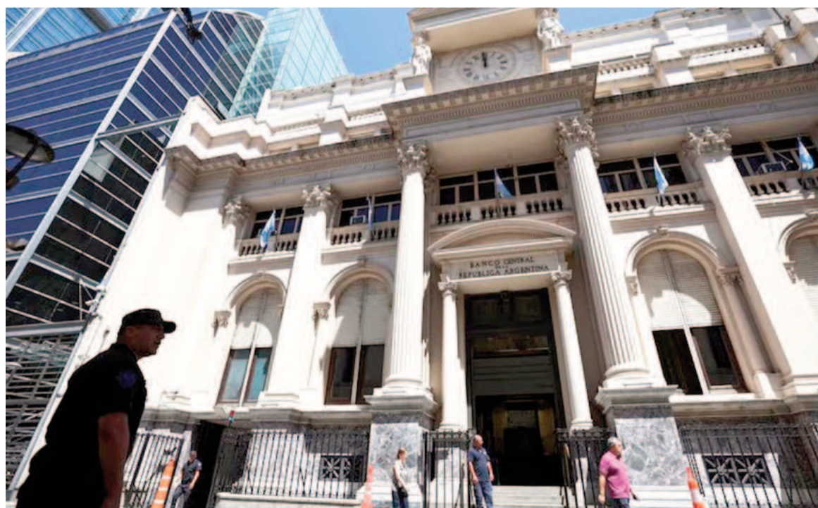
La sede del BCRA, en el centro porteño.

En la semana, las ventas de contado del Central sumaron USD 433 millones en cuatro ruedas operativas habida cuenta de un feriado el lunes 24. En marzo, el acumulado de ventas