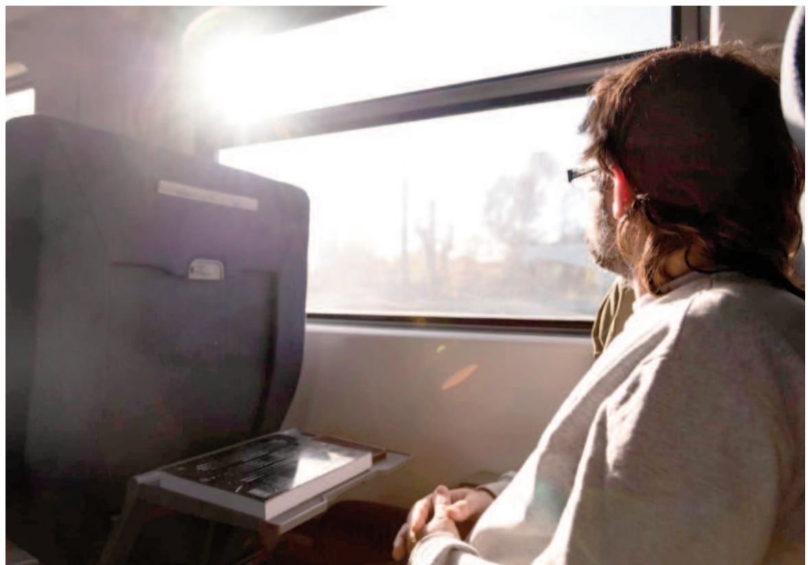
Los pasajes que salieron a la venta no registraron variaciones tarifarias, los valores son los mismos que entraron en vigencia en diciembre pasado.

En los pasajes que unen San Nicolás con Córdoba ($13.300 en Primera y $16.100 en Pullman) y Tucumán ($30.700 en Primera y $36.800 en Pullman) tampoco hubo en esta oportunidad variación tarifaria.