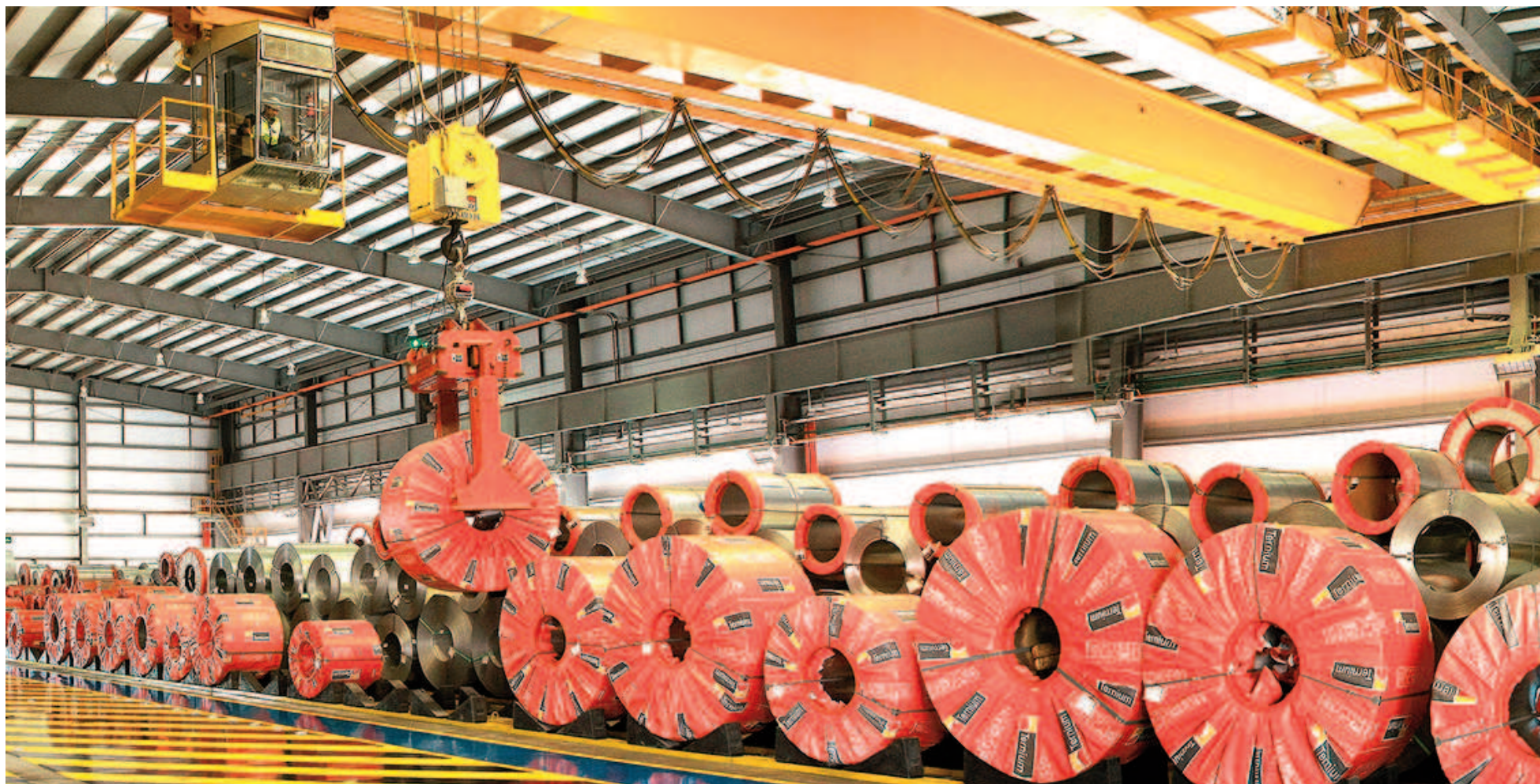
La fuerte disminución en la producción de laminados se debió a paradas extraordinarias en distintas plantas.