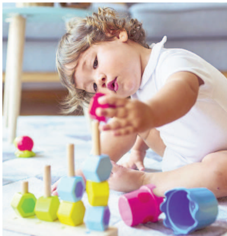
Investigación publicada en Science desafía la hipótesis de la amnesia infantil. ILUSTRACIÓN

Además, el área del hipocampo que se activó con mayor intensidad fue la parte posterior, la misma re-