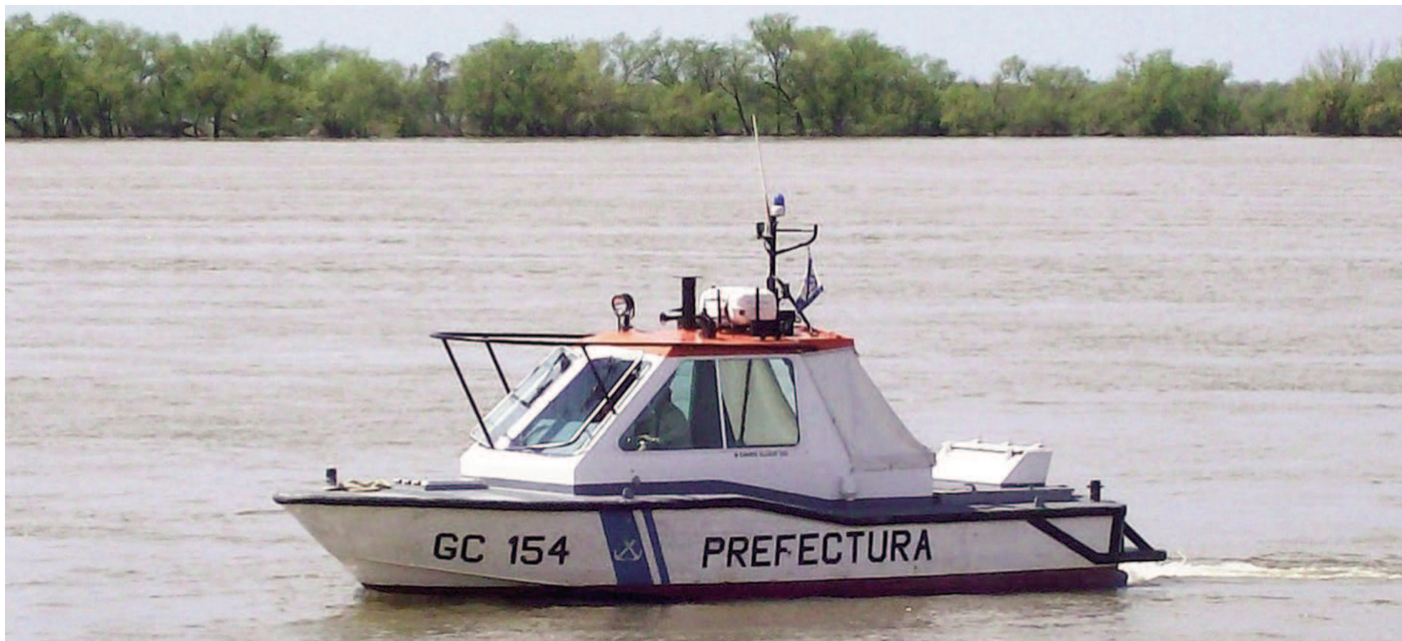
En la medición de primera hora de este martes, el río mostró una altura de 0,64 metros frente a la costa de San Nicolás.