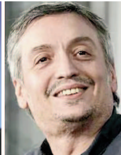
Axel Kicillof, Sergio Massa y Máximo Kirchner.

la suspensión de las PASO, Kicillof no desdoble los comicios generales. En las próximas horas se reunirán