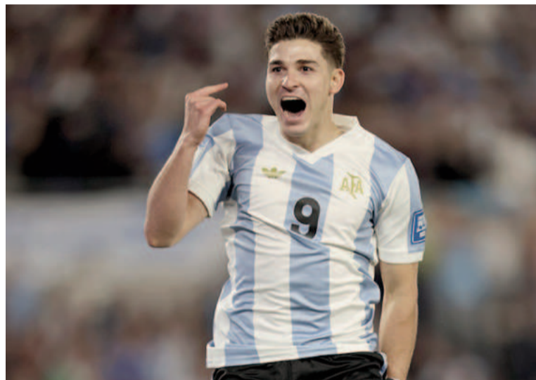
Julián Álvarez abrió la goleada argentina.

Cambios: ST, en el inicio, Léo Ortiz por Murillo (B); João Gomes por Joelinton (B); Endrick por Rodrygo (B); 23m Giuliano Simeone por Almada (A); 24m Savinho por Cunha (B); 31m Facundo Medina por Tagliáfico (A); Nico Paz por Mac Allister (A); 37m Ángel Correa por J. Álvarez (A); Exequiel Palacios por Paredes (A); 39m Éderson por André (B).