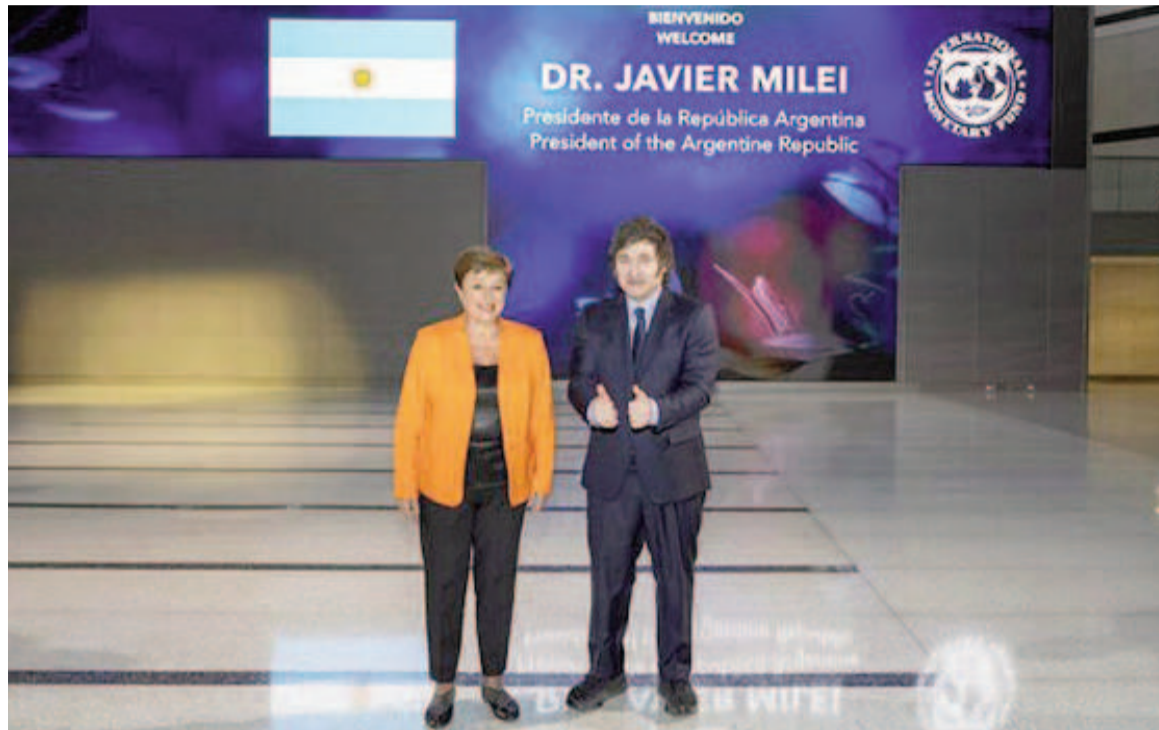
Javier Milei junto a Kristalina Georgieva, presidenta del Fondo Monetario Internacional.

El problema es que para anunciar un acuerdo falta una eternidad si se tiene en cuenta la pérdida de dólares que sufre el Banco Central. La autoridad monetaria volvió a vender divisas este martes y ya se tuvo que desprender de más de US$ 1.300 millones en siete días.