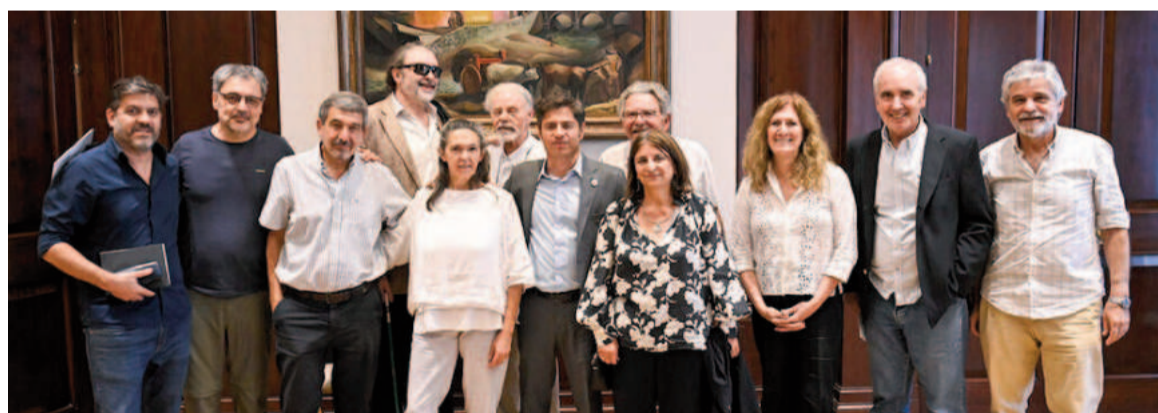
El gobernador Axel Kicillof se reunió con prestigiosos científicos argentinos.

Durante el encuentro, se evaluó la situación del sector a nivel nacional y se analizaron las distintas políticas implementadas en apoyo a la ciencia y la tecnología por parte del gobierno