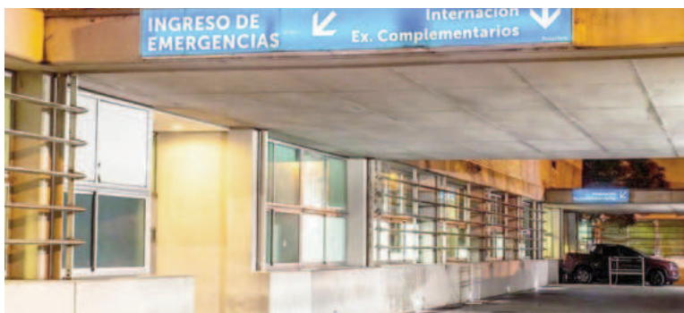
Una de las mujeres agredidas anteanoche sufrió heridas cortantes y debió ser atendida en el HECA.

En el hospital determinaron que había sufrido cortes en el tórax, ambas piernas, brazo derecho y cuello.