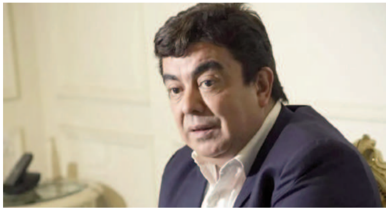
El intendente de La Matanza, Fernando Espinoza.

dos posturas. Por un lado la de la querrela que le da validez al testimonio de la mujer y la de la defensa que lo rechaza: “A modo de síntesis, cabe destacar que la controversia se ciñe a la credibilidad del discurso de la querellante, como única prueba directa del abuso sexual denunciado, por cierto negado por el imputado, cuyo descargo ha quedado parcialmente desvirtuado con evidencias objetivas, que respaldan su presencia en el lugar al momento del hecho investigado”.