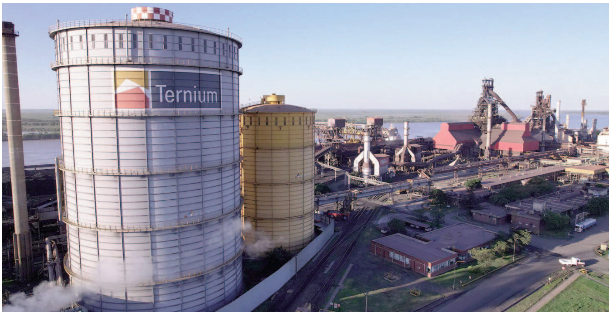
El esquema de suspensiones iniciado ayer en Ternium se extenderá hasta mayo inclusive.

LA MEDIDA SE EXTENDERÁ HASTA MAYO INCLUSIVE, CON UN NÚMERO CRECIENTE DE TRABAJADORES ALCANZADOS