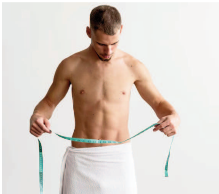
El fenómeno del crecimiento es más pronunciado en hombres.

Con el tiempo, el colágeno y las fibras del cartílago se degradan, lo que, sumado a la acción de la gra-