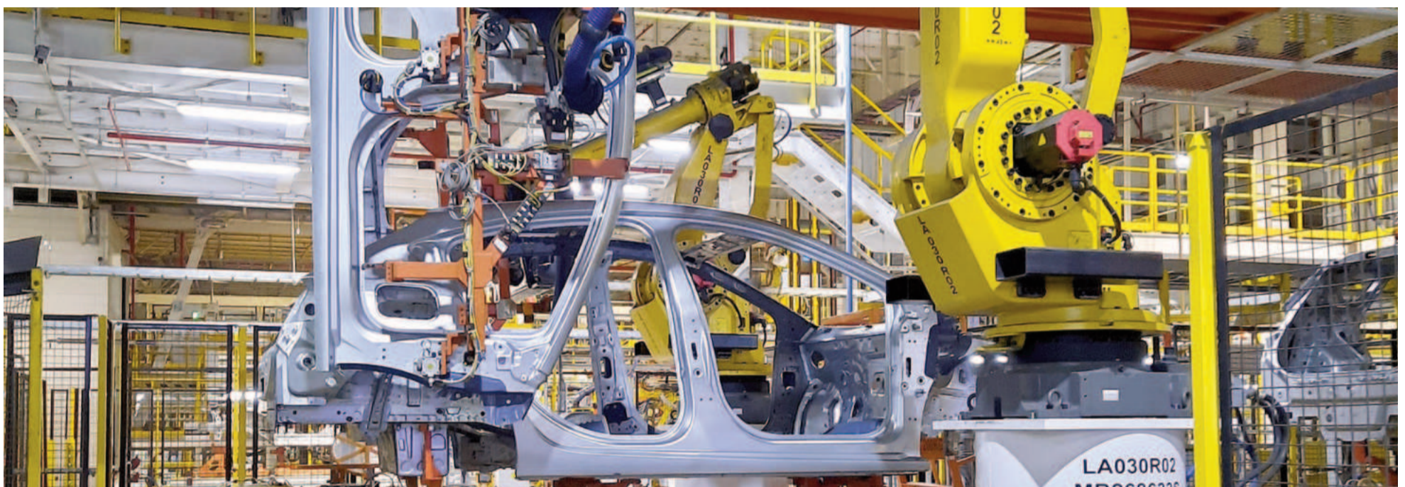
El nuevo parate productivo en GM busca adecuar los volúmenes de exportación a Brasil y tiene que ver con la caída de la producción de la Chevrolet Tracker.

Un mes después de desvincular de su staff a 309 trabajadores, General Motors definió un nuevo parate productivo en su planta ubicada a 50 kilómetros de San Nicolás. La actividad quedará paralizada entre el próximo martes y el 14 de abril. Las suspensiones productivas habían sido moneda corriente en el segundo semestre de 2023 y el primero de 2024.