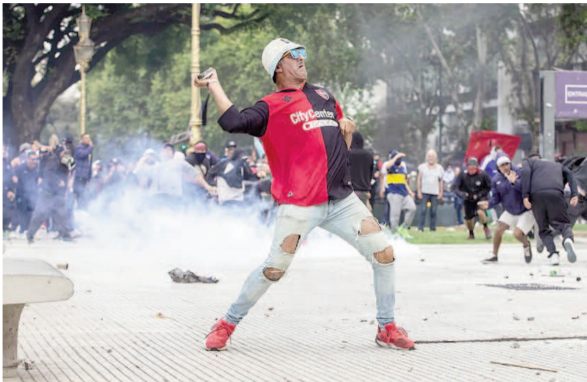
Temor por la nueva marcha de esta tarde.

«Después de la represión ilegal, está más claro que nunca que la lucha es por los jubilados y princi-