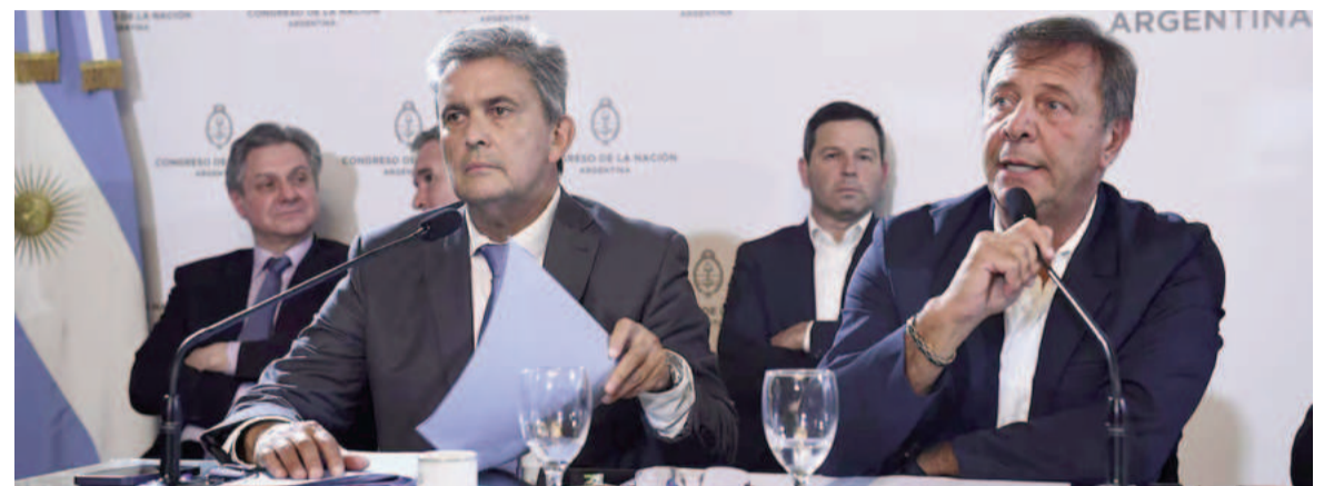
El oficialismo obtuvo dictamen en la bicameral.

El ex libertario Paoltroni promovió un dictamen de rechazo y el oficialismo llegó así a las nueve firmas necesarias para que el decreto pueda ser discutido en la Cámara de Diputados hoy miércoles; expusieron funcionarios del Banco Central y Economía.