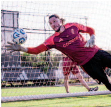
Ledesma será el arquero de River hoy.