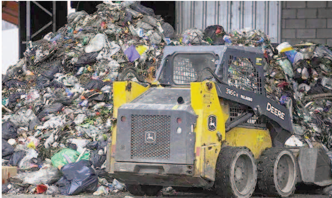
Hallaron más partes en el relleno sanitario de Ricardone.

El domingo por la mañana, un joven que caminaba por calle Maipú