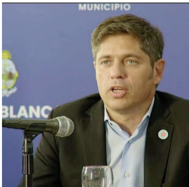
El gobernador Axel Kicillof.

Por otra parte, desde los ministerios de Desarrollo de la Co-