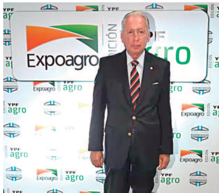
Daniel Funes de Rioja, presidente de la Unión Industrial Argentina (UIA).

En relación con la competitividad, destacó que la presión fiscal en Argentina está muy por encima del promedio mundial, afectando tanto a nivel nacional como provincial y municipal.