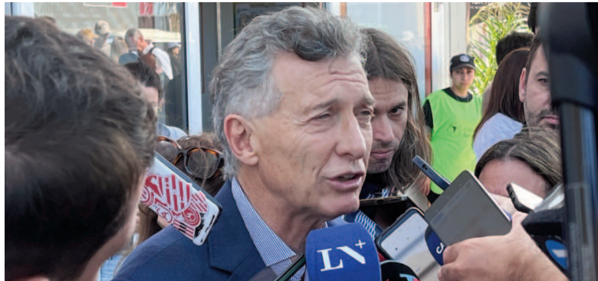
Mauricio Macri en Expoagro.

El exmandatario se diferenció de la gestión de Javier Milei en materia de infraestructura y habló sobre las negociaciones con el FMI.