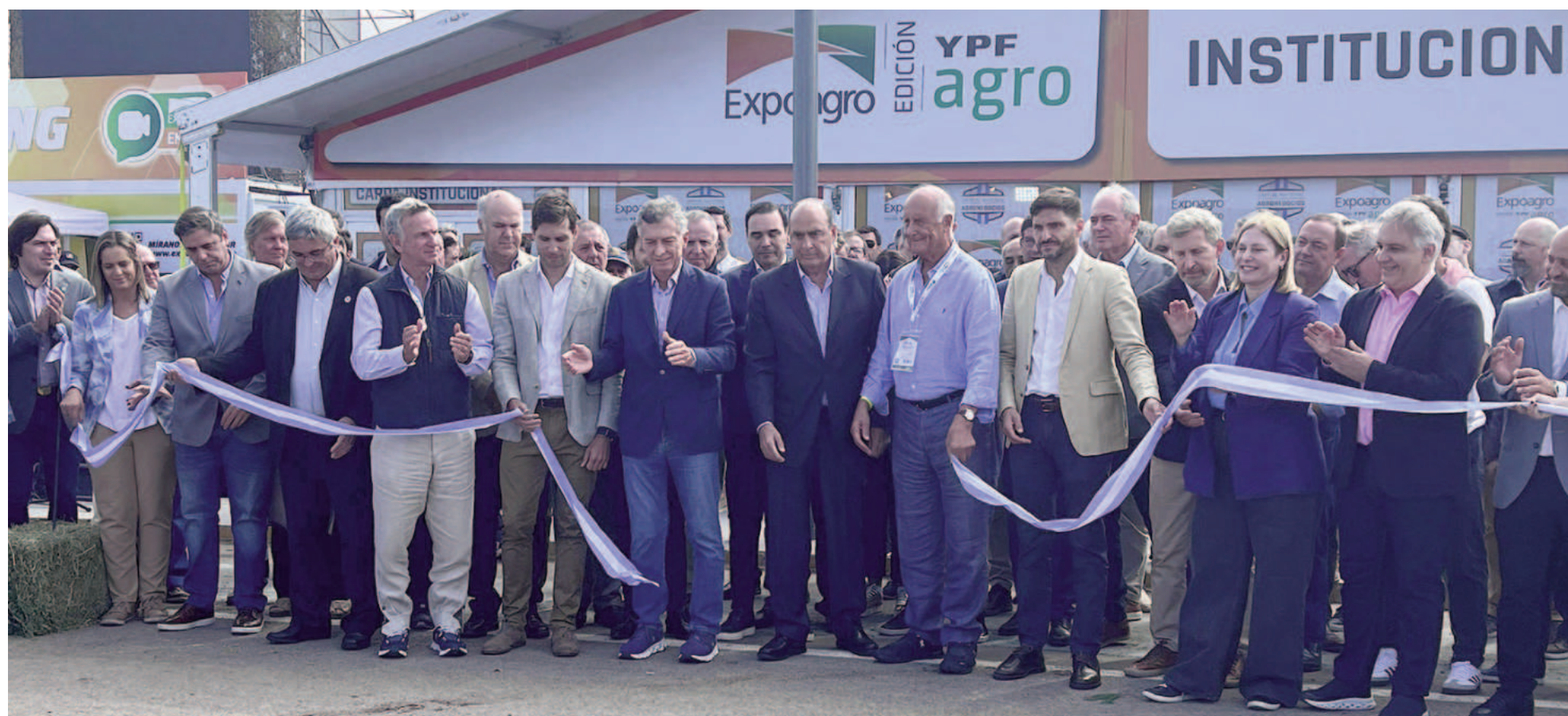
La edición 2025 de Expoagro tuvo un corte de cintas con muchas personalidades destacadas. EL NORTE