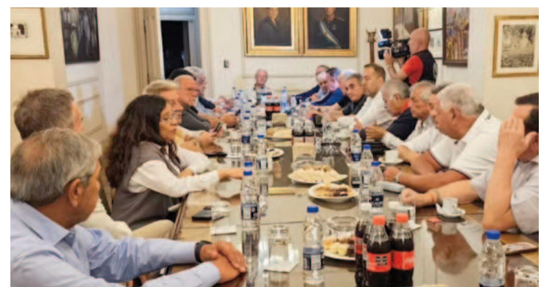
La mesa chica de la CGT decidió endurecerse contra el Gobierno.

Uno de los puntos que resaltaron en la reunión fue «el momento de de-