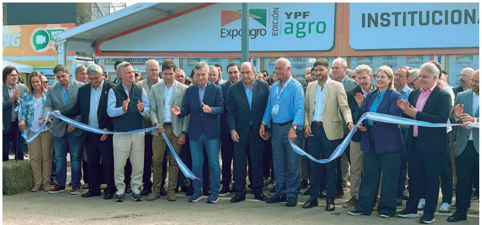
La edición 2025 de Expoagro tuvo un corte de cintas plagado de personalidades destacadas.