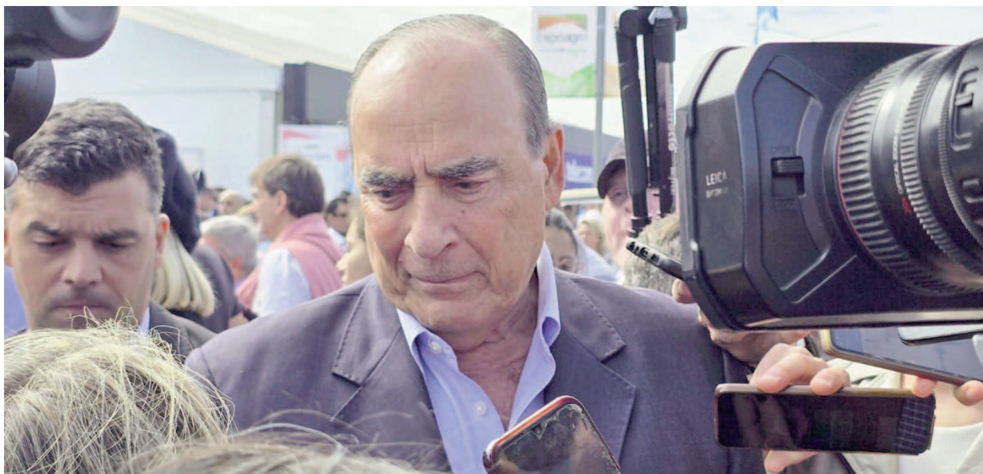
Guillermo Francos, jefe de Gabinete de Ministros de la Nación, estuvo este martes en Expoagro.

La muestra agroindustrial más importante del país recibió la visita del jefe de Gabinete de Ministros de la Nación, quien destacó el crecimiento del sector y la importancia de la exportación agroindustrial para la economía. Abordó temas clave como las retenciones, el acuerdo con el FMI y la reconstrucción de Bahía Blanca.