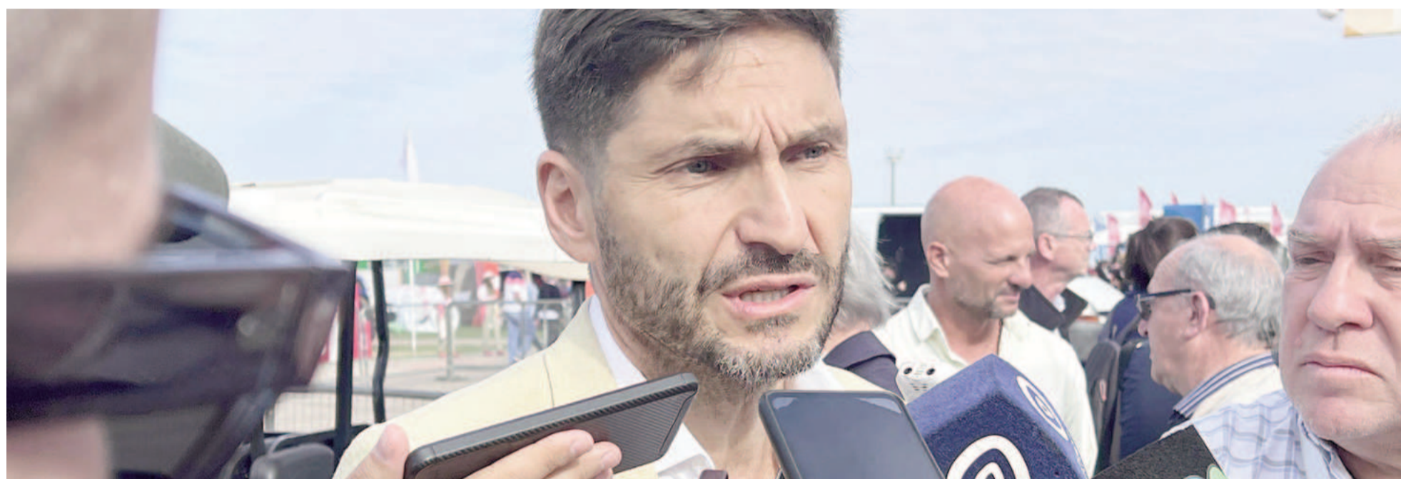
Maximiliano Pullaro, gobernador de Santa Fe, estuvo este lunes en el Predio Ferial y Autódromo San Nicolás.

Antes de participar del corte de cintas inaugural de la edición 2025 de Expoagro, el gobernador de Santa Fe envió sendos mensajes al Gobierno nacional libertario. Pidió “seguir bajando impuestos” y también por la reactivación de la obra pública en infraestructura. “Nosotros creemos en una administración eficiente, que baje los costos, que baje los impuestos, pero que también invierta en la obra pública”, lanzó el santafesino.