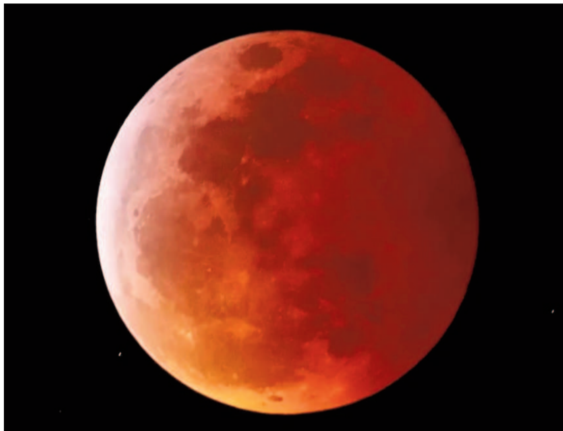
Durante el eclipse del 14 de marzo, la Luna adquirirá un tono rojizo mientras se sumerge completamente en la sombra de la Tierra.

Este eclipse total de Luna será un evento que se podrá disfrutar en toda América. En el caso de la Argentina, comenzará a ser verdaderamente apreciable a las 2:09 a. m. del viernes, hora local, según información proveniente del Planetario Galileo Galilei. Este ho-