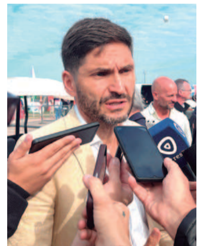
Maximiliano Pullaro, gobernador de Santa Fe, estuvo este lunes en el Predio Ferial y Autódromo San Nicolás.

Por último, el mandatario santafesino manifestó: “Nosotros creemos en la obra pública, creemos en una administración eficiente, que baje los costos, que baje los impuestos, pero que también invierta en la obra pública. La obra pública es desarrollo y también es trabajo”.