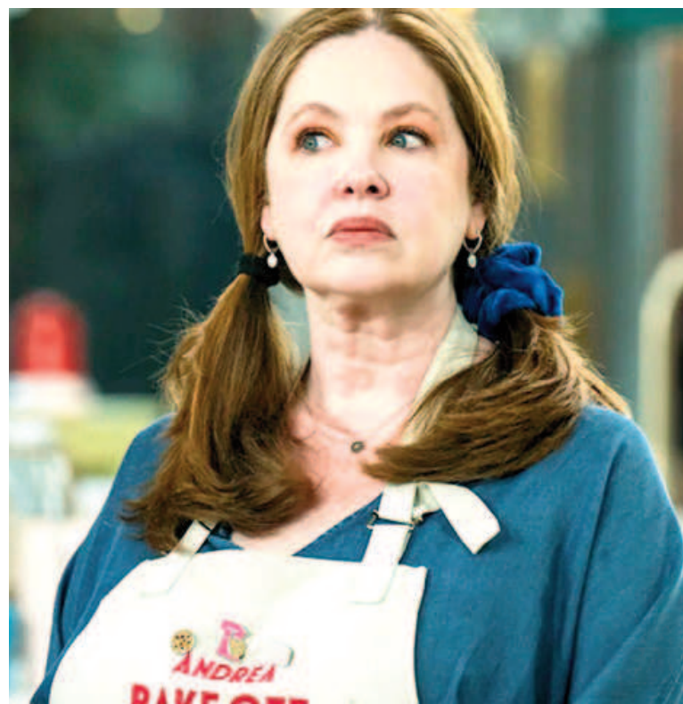
Andrea del Boca

De acuerdo con la acusación, se habría financiado con fondos públicos la novela y la venta internacional quedaba para la productora.