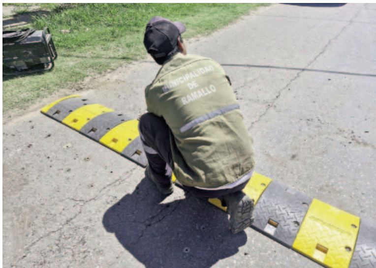
Preocupa la precarización laboral municipal.

En algunos casos, denunciaron los gremios, los haberes previstos superan a los de la planta permanente municipal, siendo los trabajadores registrados perjudicados por