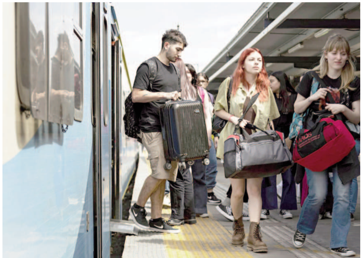
Los pasajes que salieron a la venta no registraron variaciones tarifarias, los valores son los mismos que entraron en vigencia en diciembre pasado.

Los jubilados tienen un 40% de rebaja al realizar la compra, y las personas con certificado único de discapacidad (CUD) podrán obtener su pasaje sin cargo a través de la página oficial de la compañía.