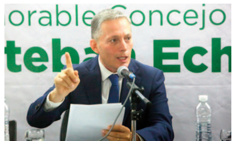
El intendente Fernando Gray.

También destacó el refuerzo de la Guardia Urbana (con 34 móviles activos) y la labor del Centro Operativo de Monitoreo, en donde se trabaja las 24 horas de manera mancomunada