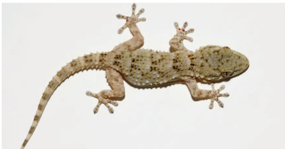
La aparición de lagartijas en los hogares de San Nicolás es un fenómeno natural que refleja la adaptación de la fauna al entorno urbano.

El aumento de temperaturas es una de las principales razones por las que estos reptiles buscan refugio en las viviendas. Al ser animales de sangre fría, las lagartijas dependen del calor externo para regular su temperatura corporal, por lo que suelen acercarse a las construcciones en busca de superficies cálidas. Además, la proliferación de insectos en esta época del año las atrae, ya que encuentran en ellos su principal fuente de alimento.