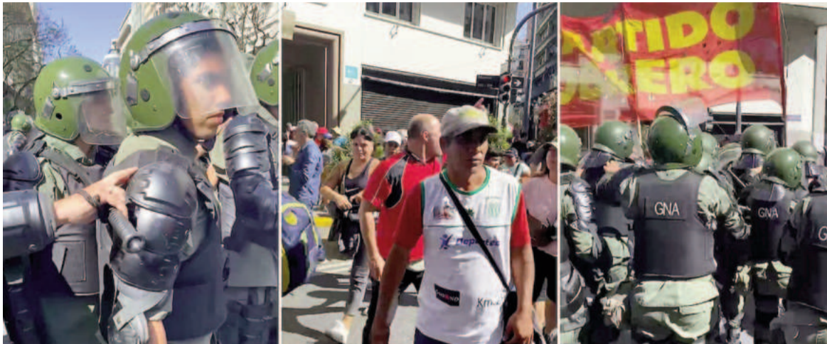
Prohíben dar de baja planes sociales a activistas y piqueteros que realicen actos violentos.