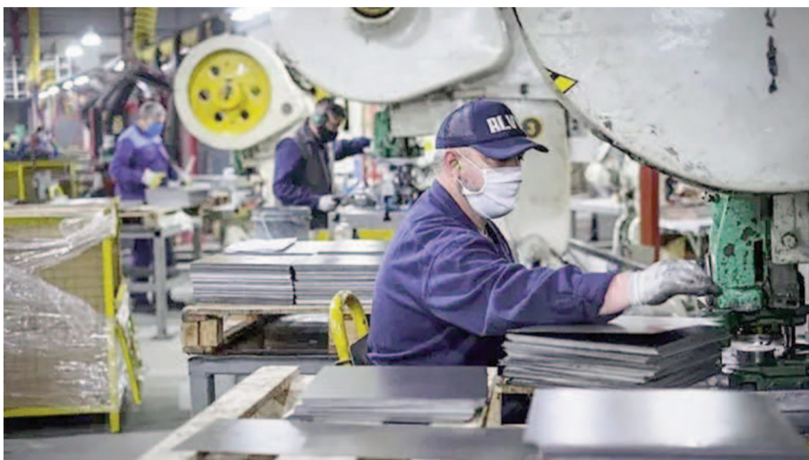
El empleo creció por sexto mes consecutivo.

El trabajo destacó que el ICA-ARG suma 10 meses consecutivos con resultados positivos y precisó que, "siete de los diez indicadores económicos, mostraron un desempeño positivo en enero, mientras que ocho series presentaron variaciones interanuales positivas".