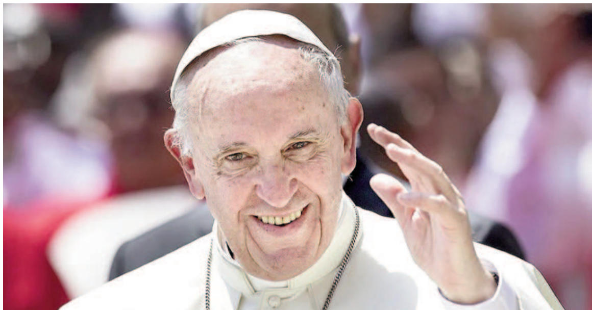
El papa tiene 88 años.

El Sumo Pontífice "permaneció alerta, orientado y cooperativo en todo momento", al tiempo que el texto sostiene: "Los valores de los análisis de sangre no cambian, lo