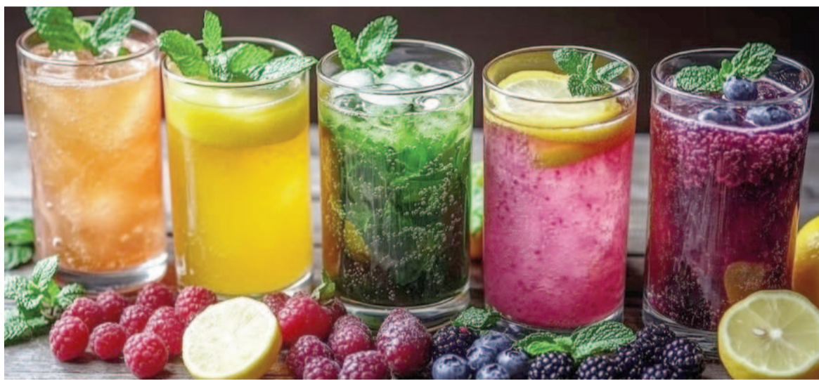
Siempre es mejor la fruta entera porque vas a aprovechar toda la fibra.

Y sabe qué, como el azúcar se absorbe rápidamente cuando está en el jugo, usted va a hacer un pico de glucemia en sangre, es decir, un pico de insulina. Siempre es sano, pero entre las dos cosas, yo me quedo con la fruta entera.