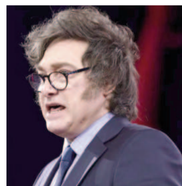
El presidente dejó su mensaje.

“En la Argentina, las organizaciones terroristas de mayor envergadura fueron Montoneros y el Ejército Revolucionario del Pueblo (ERP), ambas creadas varios años antes de 1976, que llevaron adelante los más horribles crímenes y actos de terrorismo. En la sentencia del juicio a las juntas militares de 1985, se computó que las organizaciones terroristas cometieron, entre 1969 y 1979, un total de 5215 atentados explosivos; 1052 aten-