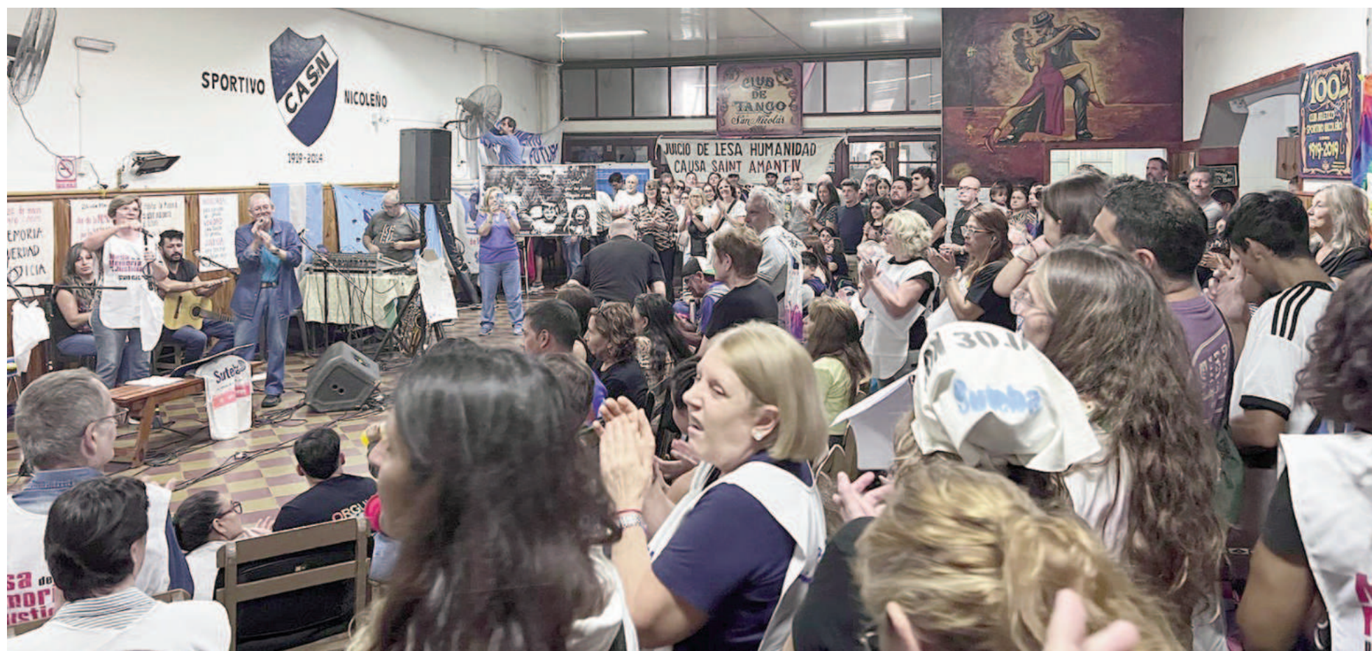
Organizaciones nicoleñas participaron del acto por el Día de la Memoria por la Verdad y la Justicia. EL NORTE

Convocados por la Mesa de la Memoria de San Nicolás, junto a diversas organizaciones locales, tuvo lugar en la tarde de ayer un acto para reivindicar la memoria, la justicia y la reparación de los crímenes cometidos por la dictadura. “A 49 años del 24 de marzo de 1976, aquel Nunca Más que tanto nos costó conquistar comenzó a estar en peligro”, advirtieron las entidades presentes mediante un documento conjunto.