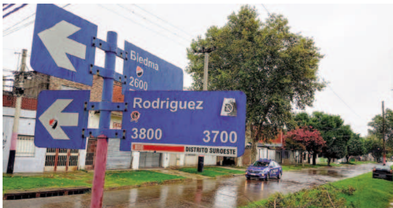
Uno de los hechos de sangre ocurrió en esta esquina.

Fuentes oficiales indicaron que poco antes de las 2.00 de este lunes se registró el ingreso de un hombre herido de bala en una pierna. El hecho se produjo en inmediaciones de Rodríguez y Biedma, en la zona sur de Rosario, y el joven en cuestión fue trasladado al HECA por su hermano en un vehículo particular. No trascendieron detalles de lo ocurrido y el herido quedó internado en observación para ser sometido a estudios.