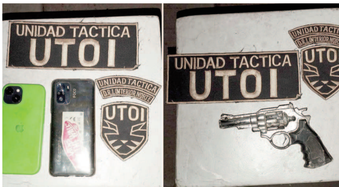
Todos los elementos sustraídos fueron incautados junto a una réplica de revólver calibre 38.