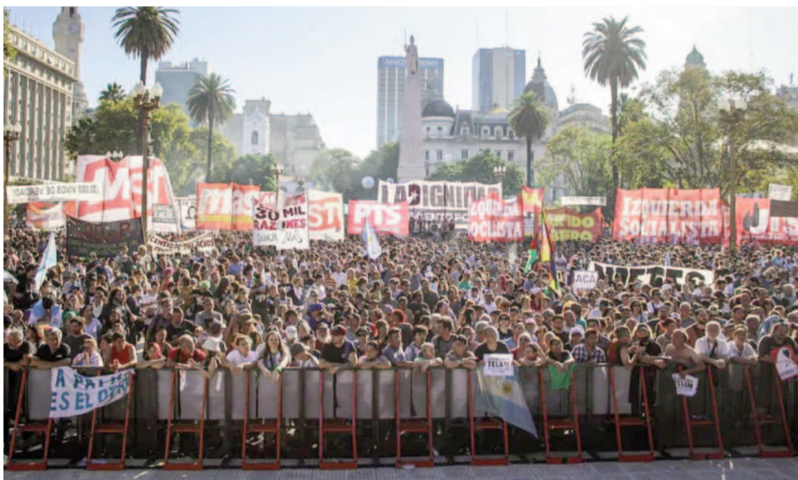
Múltiples organismos convocaron a la marcha.

“Luchamos para restituir la identidad a los cientos de bebés robados por la dictadura. La apropiación es desaparición forzada y hasta tanto no se conozca la verdadera identidad se