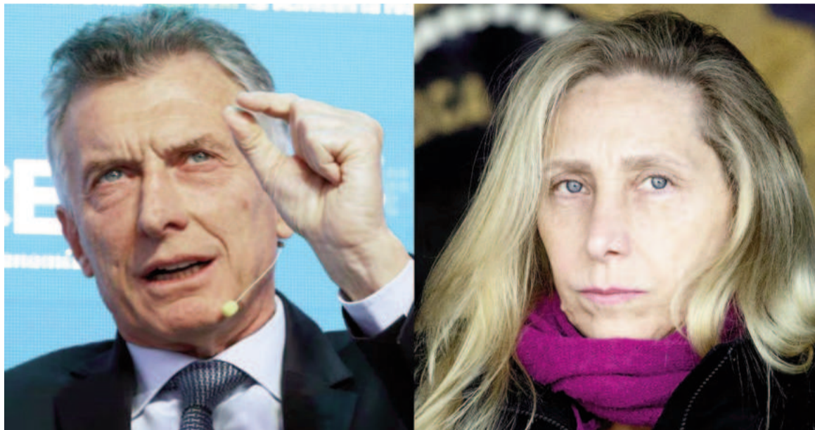
Macri volvió a criticar a Karina Milei.

“He tenido conversaciones con el Presidente de soñar juntos un proyecto de país que él llamó 1870,