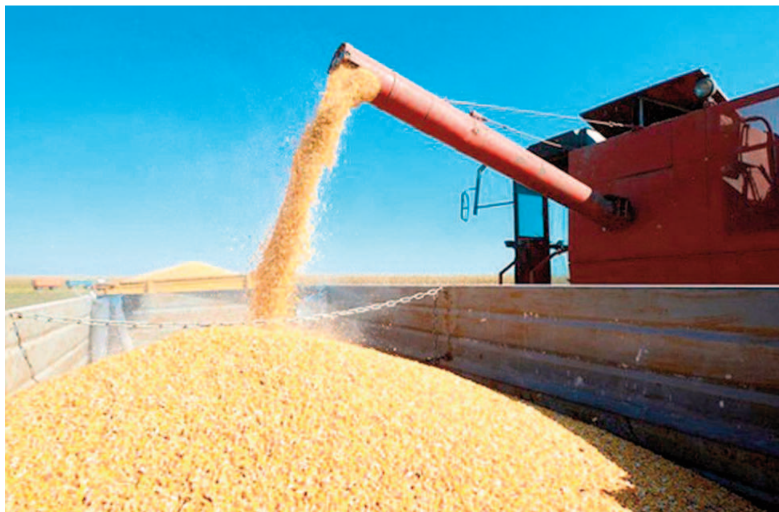
En San Nicolás y gran parte del noreste bonaerense la sequía durante diciembre y enero impactó de lleno sobre los cultivos en momentos clave.

San Nicolás y el noreste de Buenos Aires, entre las zonas más afectadas. Las lluvias de febrero no alcanzaron para revertir los daños. Las proyecciones se enfocan ahora en la siembra fina.