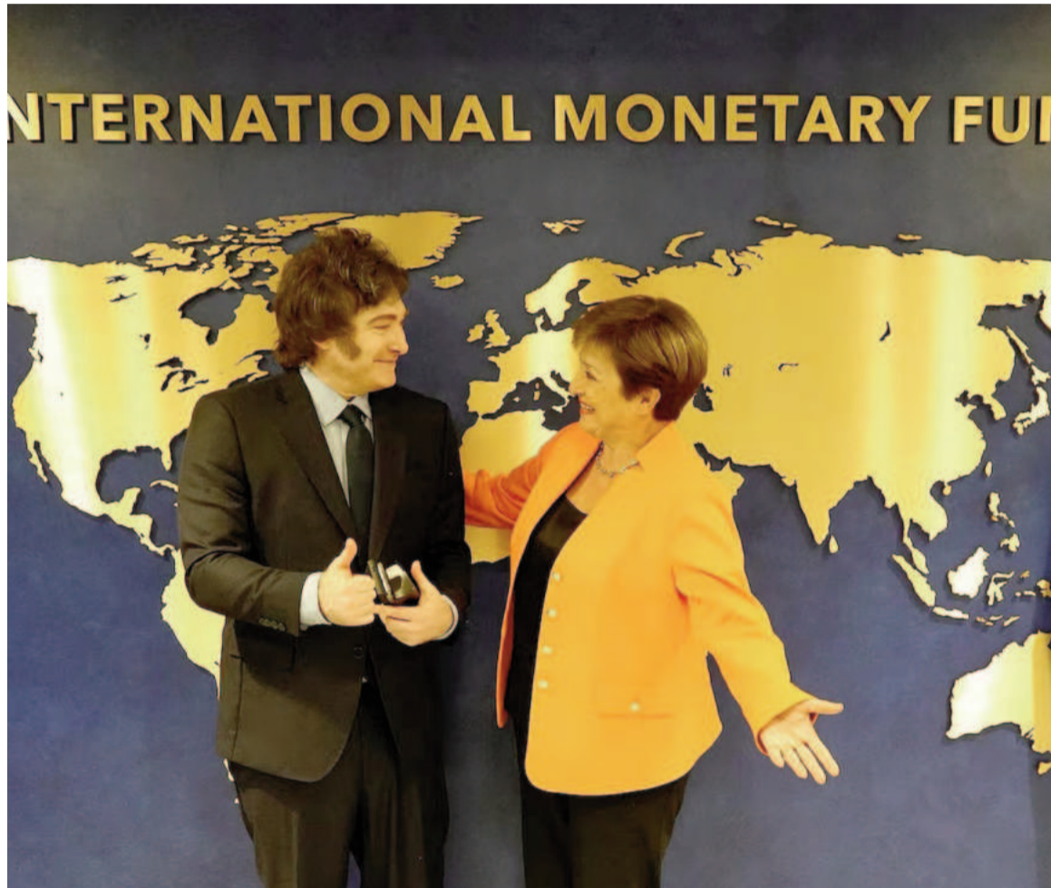
Javier Milei junto a Kristalina Georgieva.

En ese plano, continuó: “Pedimos más por una razón: en un acuerdo tradicional se hacen desembolsos a cambio de metas. En nuestro caso ya lo hicimos”, por lo que el Poder Ejecutivo buscó invertir la lógica: “Cuando terminen esos ajustes,