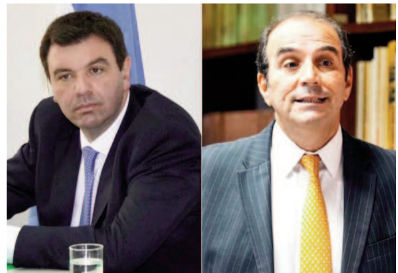
Ariel Lijo y Manuel García-Mansilla.

Por su parte, Manuel García-Mansilla fue nombrado en comisión por Javier Milei. Tras esa decisión, el Senado comenzó a buscar apoyos para conseguir dictamen y rechazar su pliego. En el oficialismo creen que van a sostenerlo en su cargo debido a que la Corte ya le tomó juramento al juez. Por otro lado, entienden que su designación tendrá vigencia hasta el final de este año legislativo.