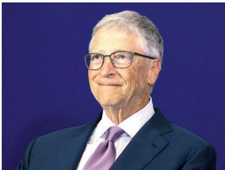
Bill Gates y su proyección para la humanidad.

Aunque esta idea podría evocar un futuro inquietante, Gates insiste en que el potencial de la IA reside en cómo la aprovechamos para enriquecer nuestras vidas, un mensaje que ya había explorado en su blog personal. Actualmente, reconoce, la IA sigue siendo un recurso costoso y poco común, especialmente en campos como la medicina o la educación, donde la presencia humana sigue siendo insustituible. «Con la IA, en la próxima década, eso se volverá gratuito y habitual. Es un cambio muy profundo porque resuelve problemas como la escasez de médicos