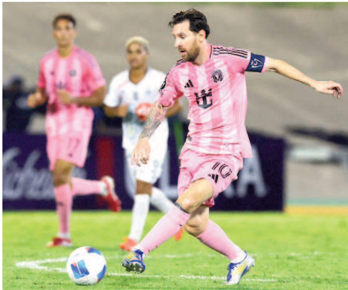
Lionel Messi se lesionó y quedó marginado para los clásicos.

El crack rosarino sufrió una sobrecarga muscular y no estará en los próximos compromisos clasificatorios para el Mundial 2026.