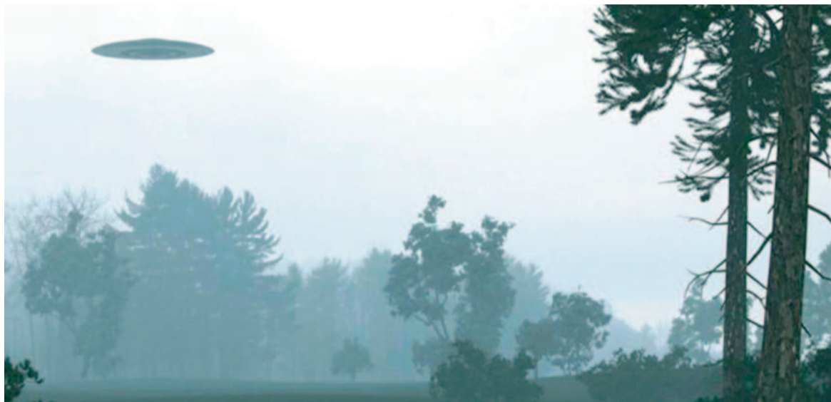
Desclasificaron un avistamiento de un ovni ocurrido en 1978.

que nunca habían visto antes. El mismo emitía destellos a través de lo que parecían ser ventanillas giratorias y desprendía una tenue bruma rojiza en su parte inferior, mientras que en la superior un potente reflector de luz blanca barría el cielo.