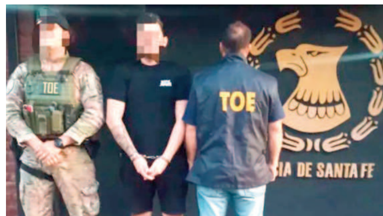
Un policía, en situación de disponibilidad, se presentó en las TOE.

Estos operativos son parte de una serie de medidas enmarcadas dentro de la causa que investiga los crímenes de Bracamonte y Attardo.