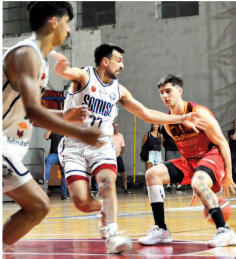
Belgrano y Somisa se enfrentaron en el Prefederal, con dos triunfos para el Rojo. Varias caras se repiten de esos choques.