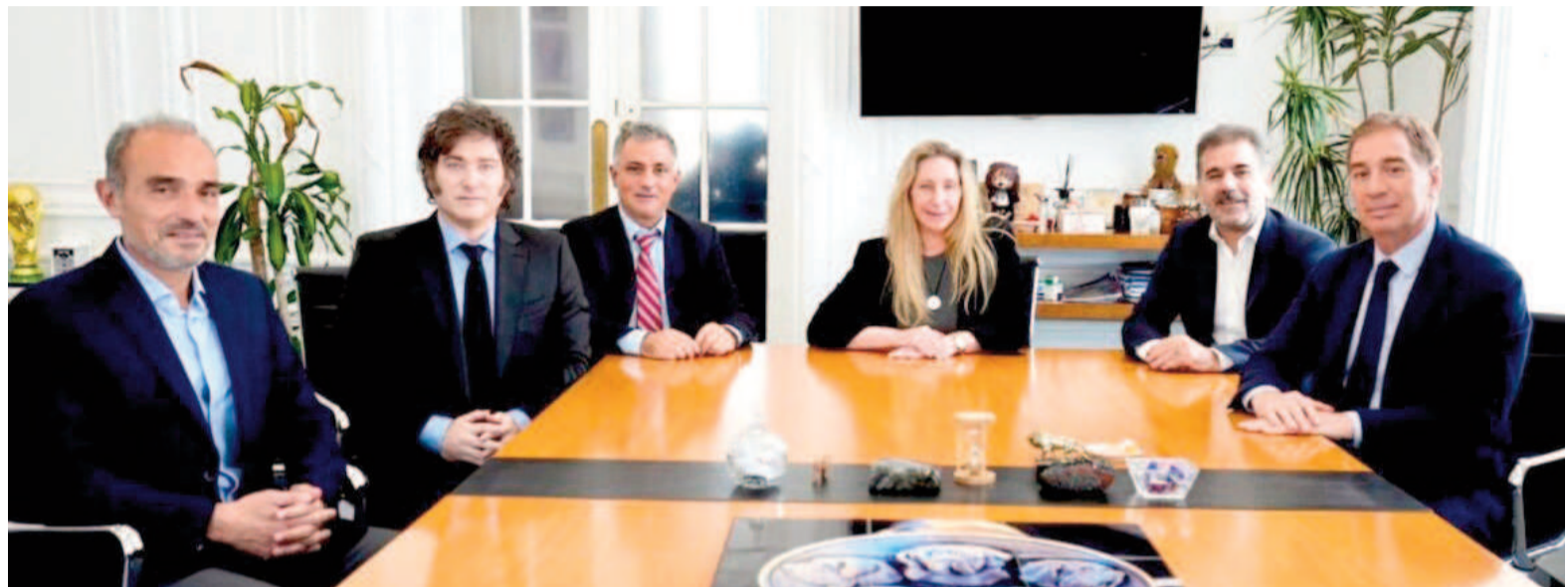
El presidente Javier Milei con referentes de la LLA y del PRO.

La cumbre se produjo apenas unas horas después de la decisión del gobernador bonaerense Axel Kicillof de convocar a las PASO en la provincia, la de mayor peso electoral. Todo apunta a conformar una alianza de cara a las elecciones de medio término que se realizarán el 26 de octubre entre