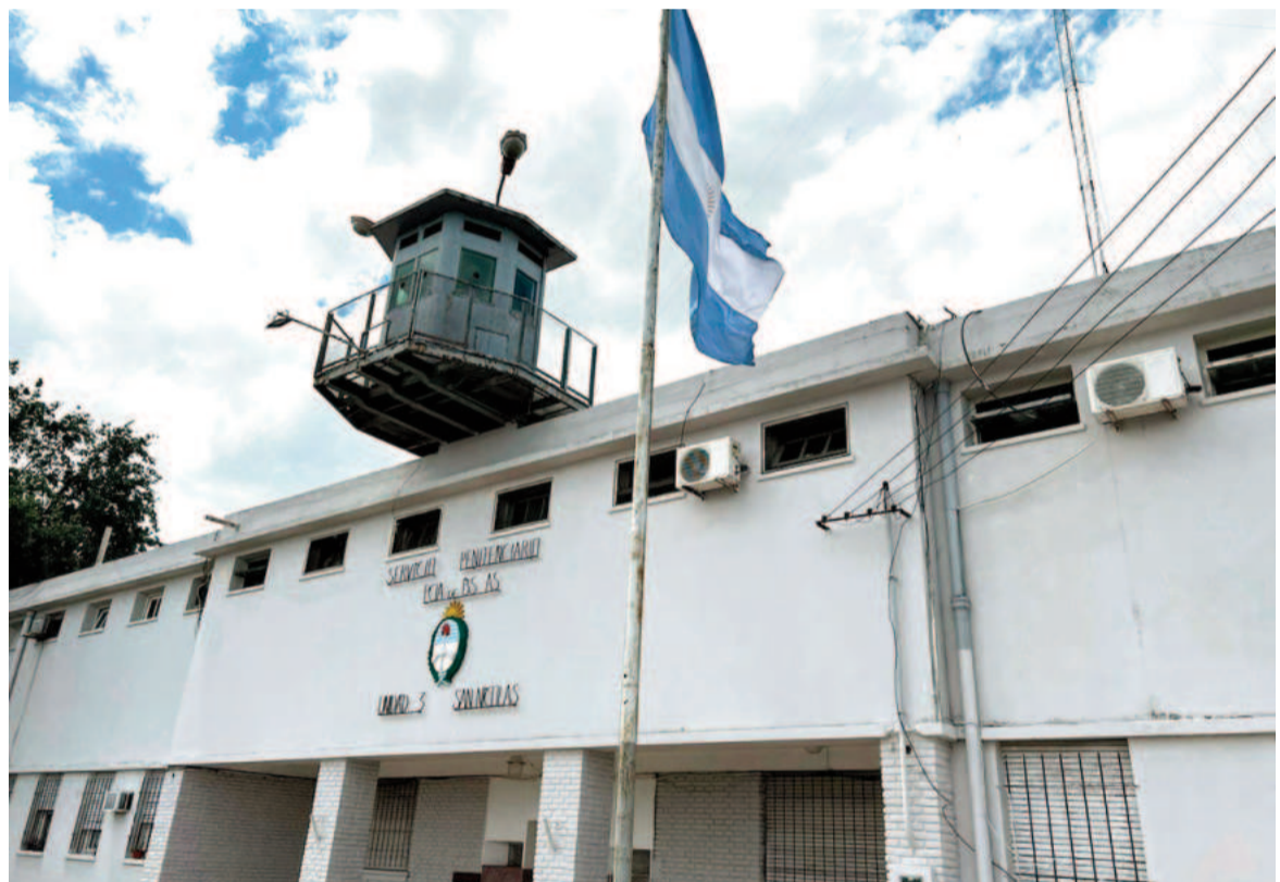
Unos 985 internos, entre mujeres y varones, se encuentran en la penitenciaría de San Nicolás, cuyo cupo es de 358 personas.

En cuanto a la población femenina en febrero de 2025, 69 detenidas se encontraban criando a sus hijos e hijas y/o cursando un embarazo dentro de una cárcel provincial. 37 internas están embarazadas y 32 niños y niñas viven en una unidad penitenciaria bonaerense bajo cuidado de madres