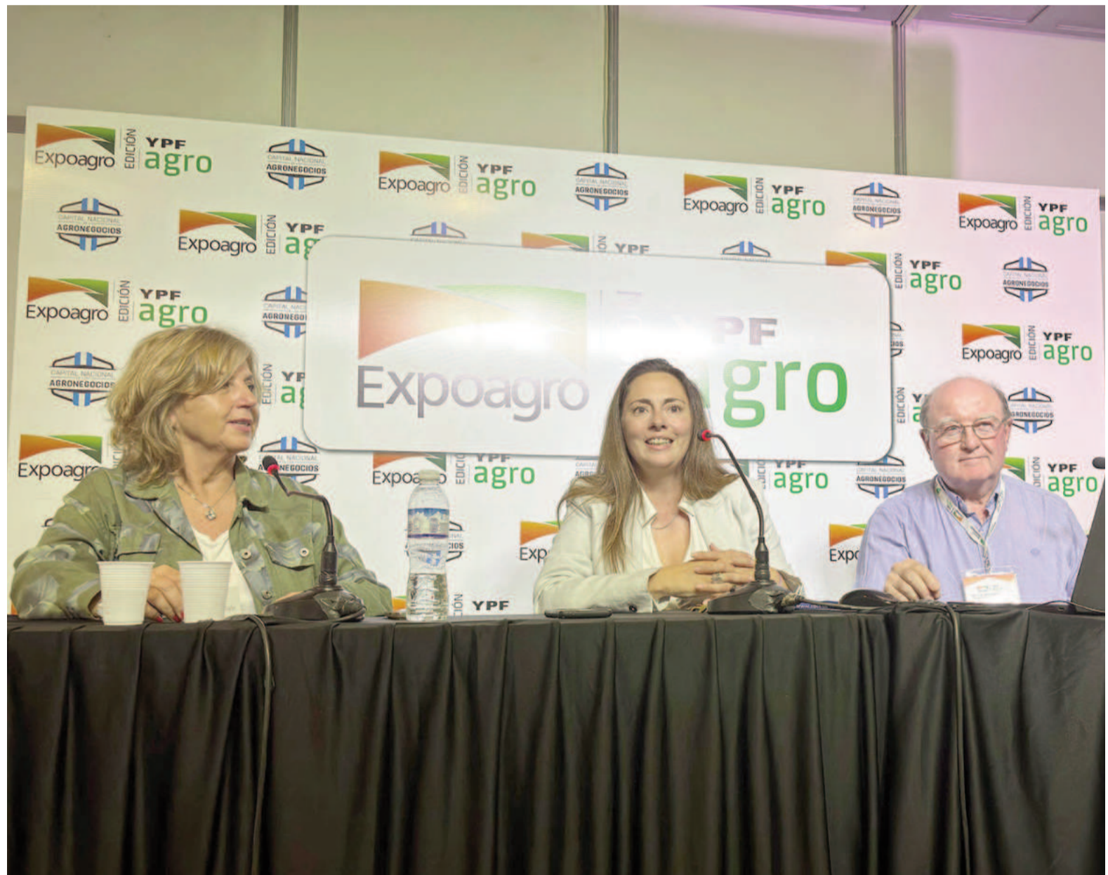
En Expoagro, Morales ofreció una disertación sobre fiebre hemorrágica argentina.

Por otro lado, debido a los estudios e investigaciones que realizan desde el Instituto Maiztegui, expresó: “En la parte de Córdoba, Santa Fe, Buenos Aires y La Pampa, esos son los lugares donde se han detectado casos humanos. Y nuestro equipo de trabajo de campo, que es el que sale a cazar