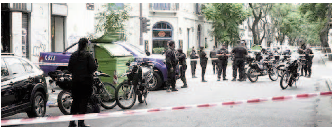
Hallazgo de restos humanos conmocionó el lugar.

examinó los restos hallados, y confirmó que se trata de un muslo y parte de un antebrazo.