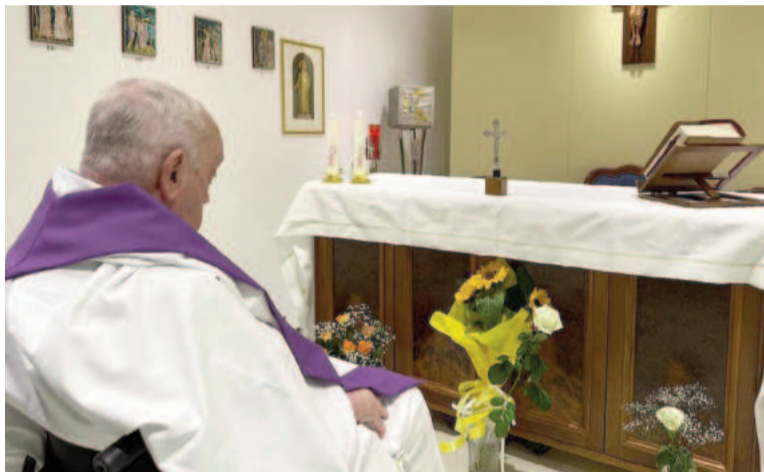
Francisco permanece hospitalizado.

La foto se dio a conocer ayer a través de las redes sociales. Desde la cuenta oficial de X (ex Twitter), el Vaticano difundió la imagen de Francisco y junto a ella un breve mensaje.