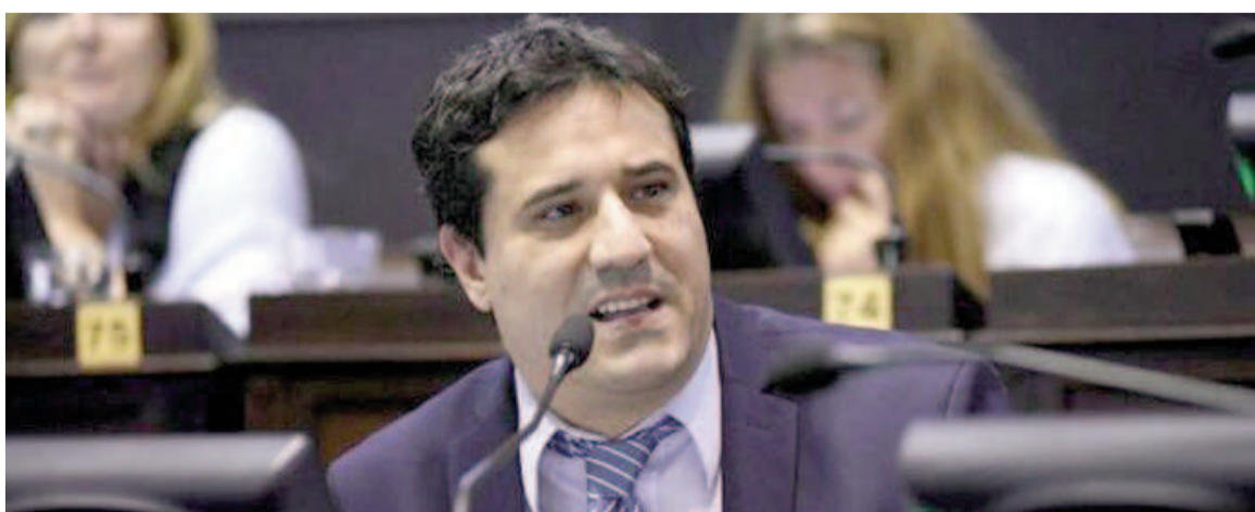
El senador Maximiliano Abad.

“El anuncio sobre la fecha de las PASO en la Provincia demuestra lo que ya sabemos: Kicillof actúa como un operador político antes que como el gobernador de todos los bonaerenses”, afirmó Abad. En este sentido, consideró que la convocatoria sólo para las primarias, sin definir la fecha de las elecciones