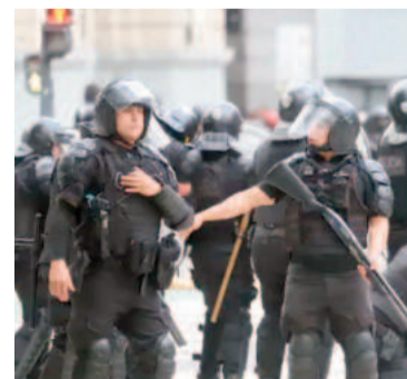
Preparan un operativo «reforzado» para este miércoles.

«Vamos a desplegar las mismas fuerzas, pero este miércoles vamos a sumar personal en apresto en distintos puntos estratégicos», reveló un funcionario del Ministerio de Seguridad de la Nación. Se repetirán además los controles en los colectivos