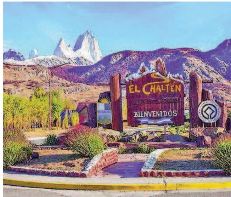
El Chaltén es uno de los pueblos destacados.

Es un pueblo galés que es famoso porque lo visitó Lady Di durante los noventa. Tiene casas de té típicas, cons-