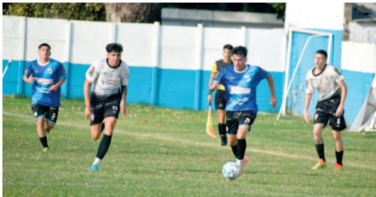
Paraná y La Emilia quedaron a mano.

El encuentro estuvo demorado porque la parcialidad local arrojó una bomba de estruendo al campo de juego, que afectó a un colaborador de La Emilia.