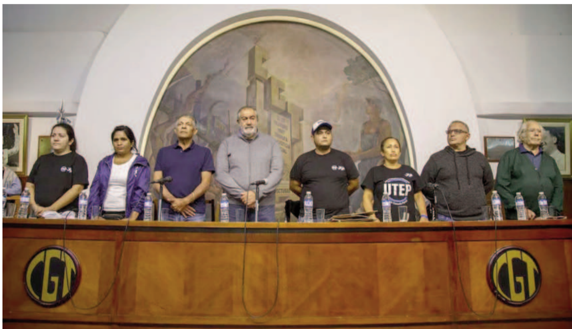
El viernes pasado la CGT anunció que iba al paro general.

Lo cierto es que, además de la fecha y de la participación de la marcha opositora del 24 de marzo -cuando se recuerda el día en que empezó la última y más criminal dictadura militar- los líderes sindicales tomaron la decisión de redoblar su posición crítica contra el gobierno de Milei,