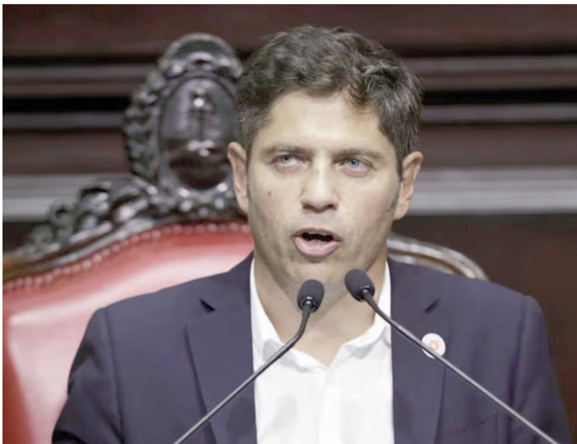
Axel Kicillof apuró a la Legislatura para que trate la suspensión de las PASO.