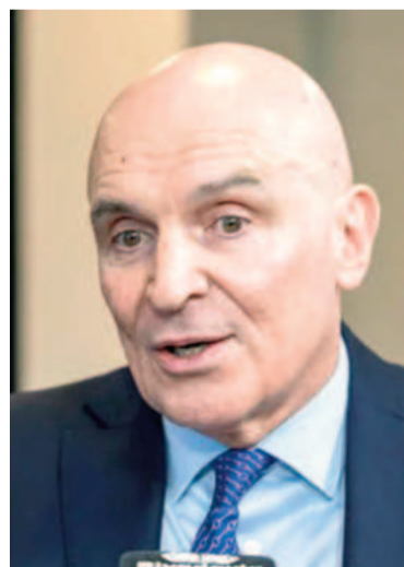
Espert duro contra Cristina.

hubieron 20 años de «decadencia» y de «populismo K». Y aseguró que nada de lo que diga ni haga va a