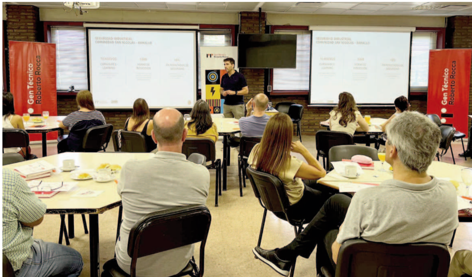
En la reunión con los directores y docentes de las escuelas técnicas se renovó el compromiso de Ternium con la educación técnica y el desarrollo local.

Los estudiantes realizan un total de 200 horas de práctica en 21 sectores clave de la planta industrial, bajo la guía de más de 40 tutores, quienes desempeñan un rol fundamental en la capacitación y formación de estos futuros profesionales. Como parte esencial de su formación, cada alumno recibió previamente 16 horas de capacitación en Seguridad Industrial, ga-