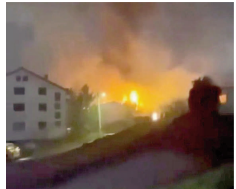
Así se incendiaba la discoteca.

La comisaria de Ampliación de la Unión Europea, Marta Kos, también expresó sus condolencias a las víctimas y sus familias.