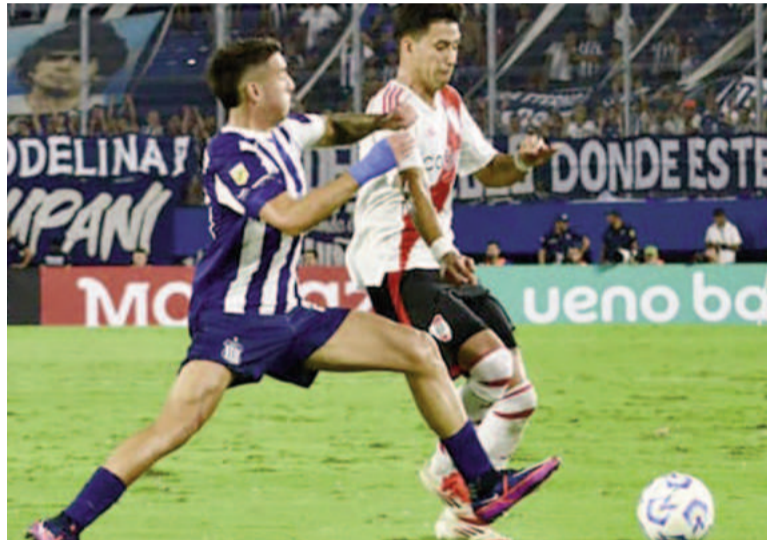
El encuentro se jugó bajo un calor tremendo.

Enzo Pérez, a los 37 minutos, recuperó la pelota y jugó rápido para Borja, que estaba sólo entre los centrales. El delantero abrió para Mastantuono, que no pudo