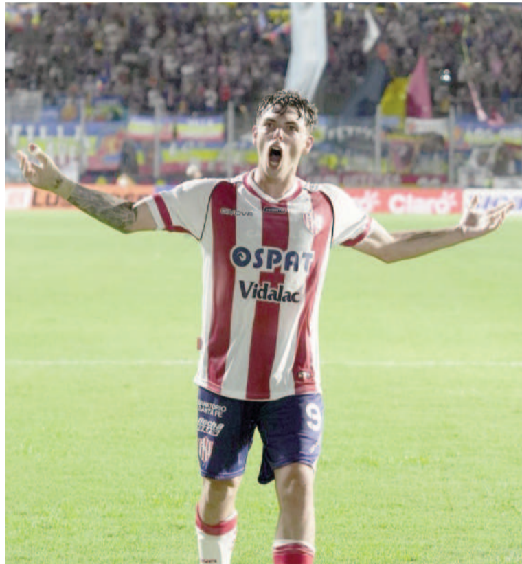
Unión festejó por primera vez en el Estadio San Nicolás.