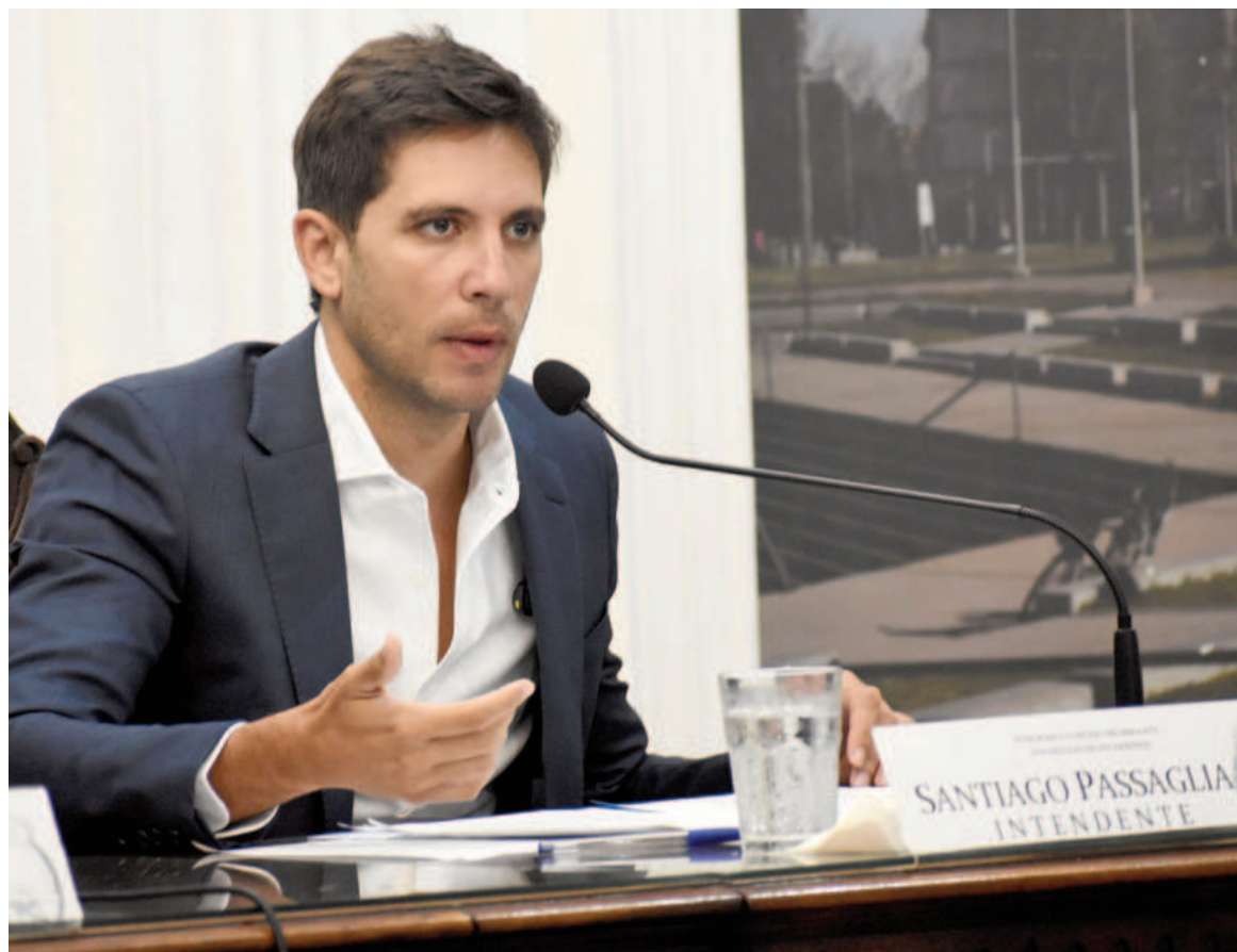
Desde el estrado presidencial del recinto Soberanía Nacional, el intendente pronunció un mensaje de 42 minutos.

En este sentido, el intendente destacó en primer término lo trabajado en materia de obras hidráulicas. “San Nicolás no se inundó como en otras épocas. Antes, cada vez que llovía la mitad de lo que llovió, por ejemplo, el sábado pasado, una cantidad de barrios de la ciudad quedaban bajo el agua y teníamos que salir a abrir centros de emergencia para cobijar a la gente que tenía que