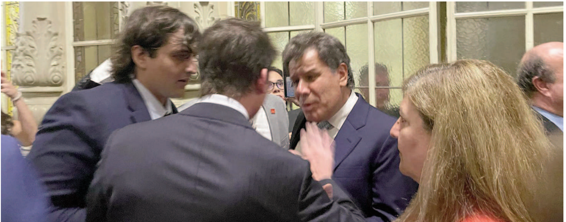
Facundo Manes denunció a Santiago Caputo por haberlo increpado en el Congreso.