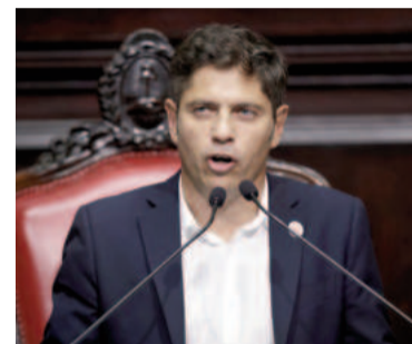
El gobernador Axel Kicillof en la apertura de sesiones ordinarias de la Legislatura.

“No festejen un crédito del FMI para el mercado cambiario, porque más deuda