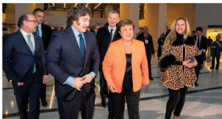
Kristalina Georgieva, la titular del FMI, de buen diálogo con Milei.

Fondo Monetario Internacional (FMI) podría otorgarle a Argentina un préstamo de hasta US$ 20.000 millones bajo un nuevo programa de financiamiento. De este monto, US$ 8000 millones serían fondos frescos, mientras que el resto se destinaría a cubrir pagos de capital e intereses hasta 2028.