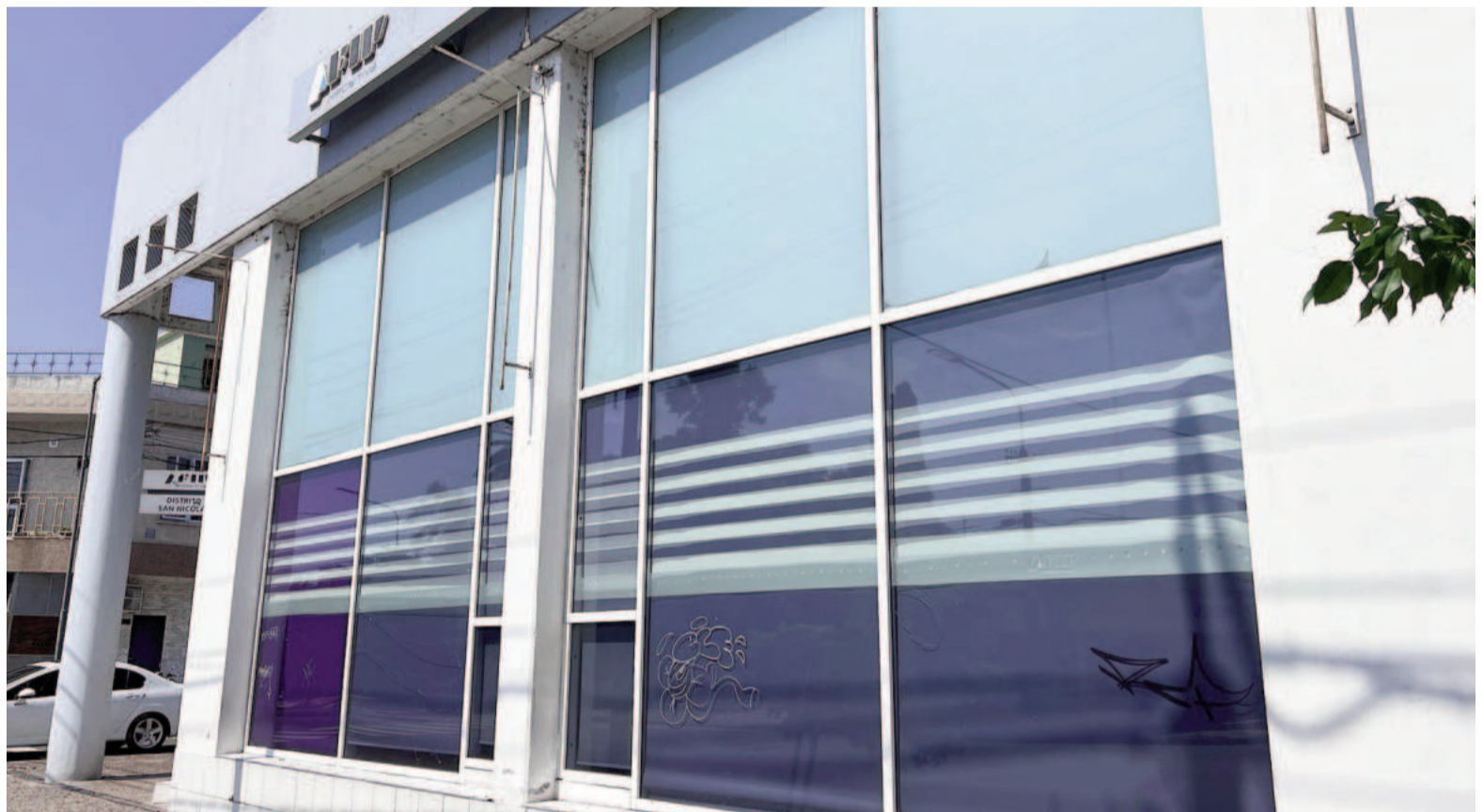
La medida implica la eliminación de varios distritos, entre ellos San Nicolás, San Pedro, Chivilcoy y Bragado.

de varios distritos, entre ellos San Nicolás, San Pedro, Chivilcoy y Bragado, que estaban bajo la jurisdicción de la regional Mercedes. "A las doce de la noche en el Boletín Oficial salió una disposición interna donde definen el organigrama y el distrito San Nicolás desaparece", comentaron desde el gremio AEFIP (Asociación