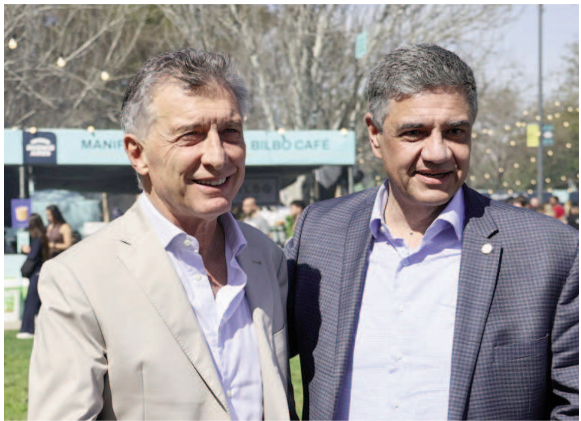
Mauricio Macri y su primo, Jorge Macri, jefe de Gobierno porteño.

"Estamos para hacer un último esfuerzo con usted (Bullrich) desde la voluntad y la verdad, superando nuestras diferencias, pero con el interés general por sobre el interés