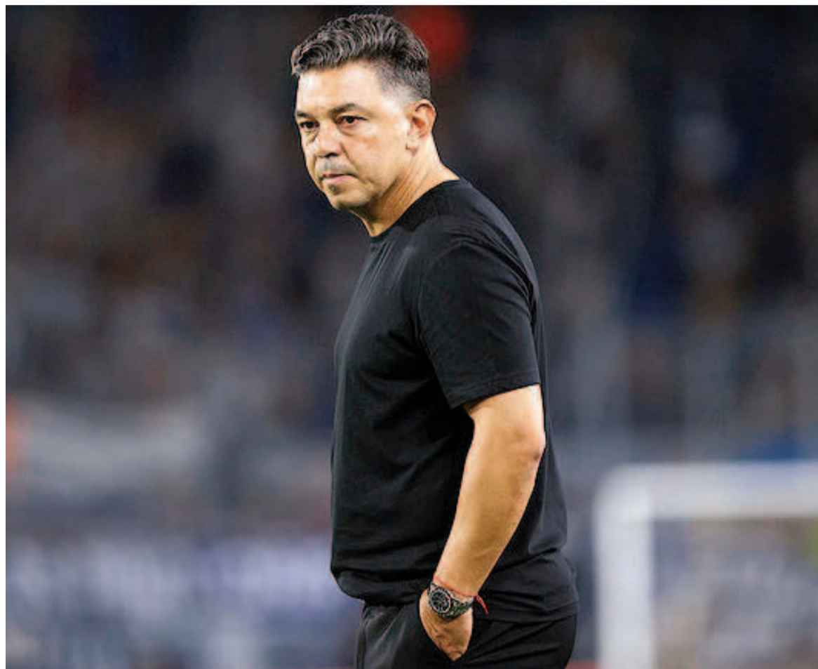
El equipo dirigido por Gallardo busca recuperarse ante el Decano. WEB

El clima no es el mejor en el equipo millonario, que este año no encuentra funcionamiento y viene de perder la Supercopa ante Talleres. El partido comenzará a las 19.15.