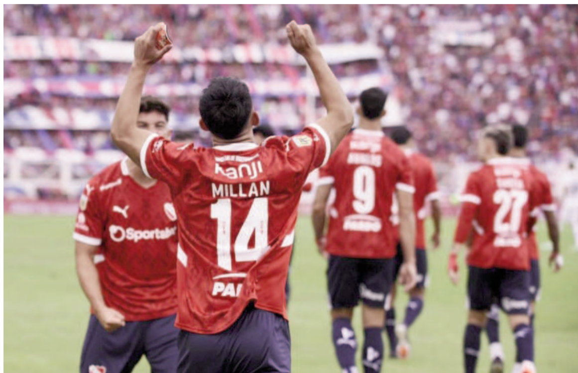
El Rojo ganó con un gol en offside en el Nuevo Gasómetro.