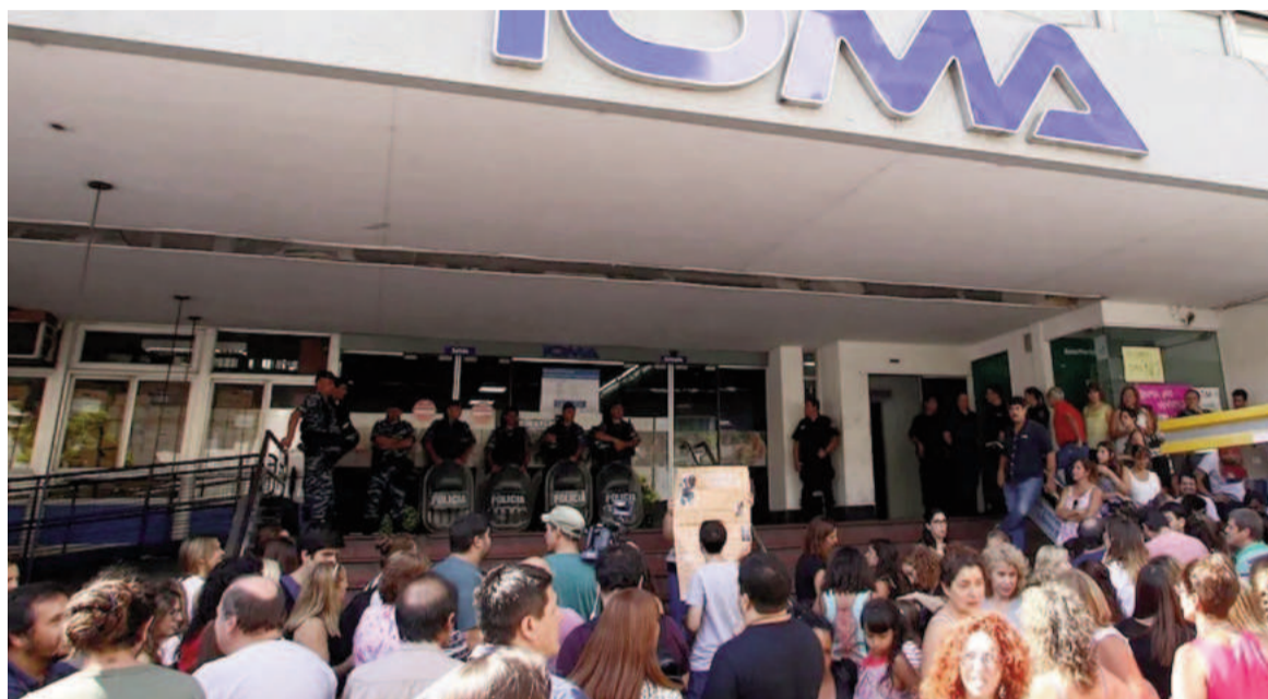
La Coalición Cívica pide explicaciones sobre la grave situación de la obra social.

Los diputados manifestaron, además, su preocupación por la omisión