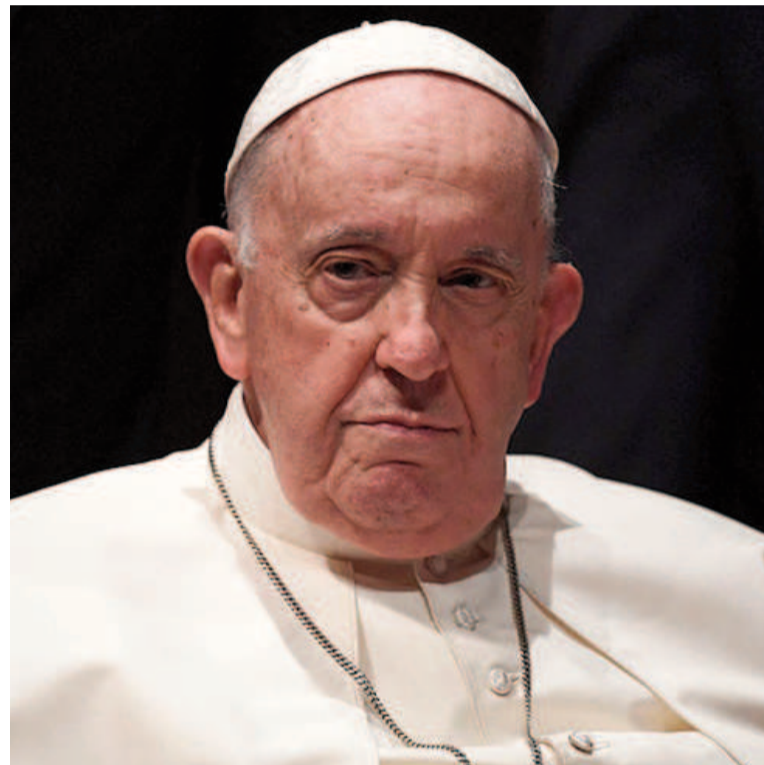
El papa Francisco presentó una lenta recuperación.

que tienen las mujeres para ayudar a los demás, Francisco hizo referencia al aborto, que siempre ha negado y calificado a veces como un crimen, aunque es un derecho que reivindican las mujeres de muchos países del mundo.