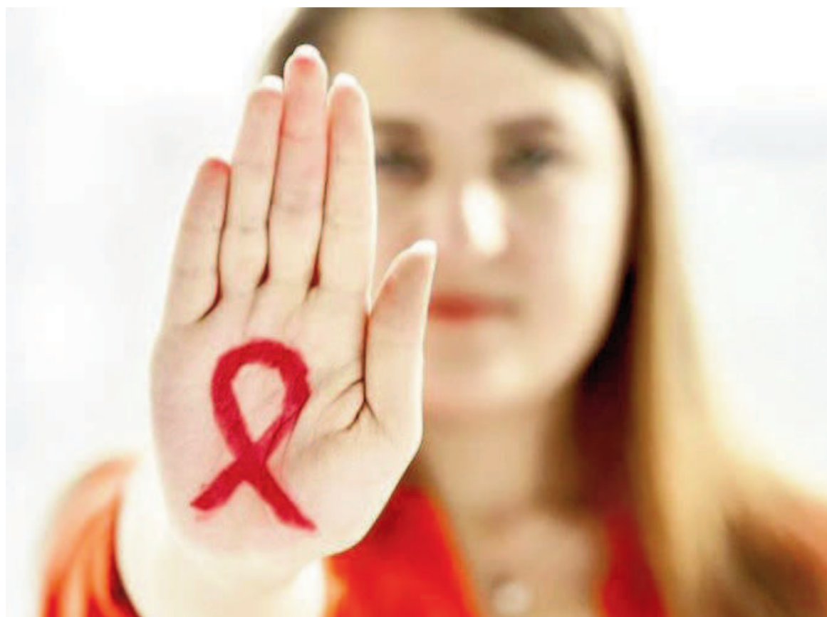
Cada semana 4000 adolescentes y mujeres jóvenes contraen VIH en el mundo, situación profundizada por desigualdad de género y violencia.

La desigualdad económica y la falta de acceso a productos básicos,