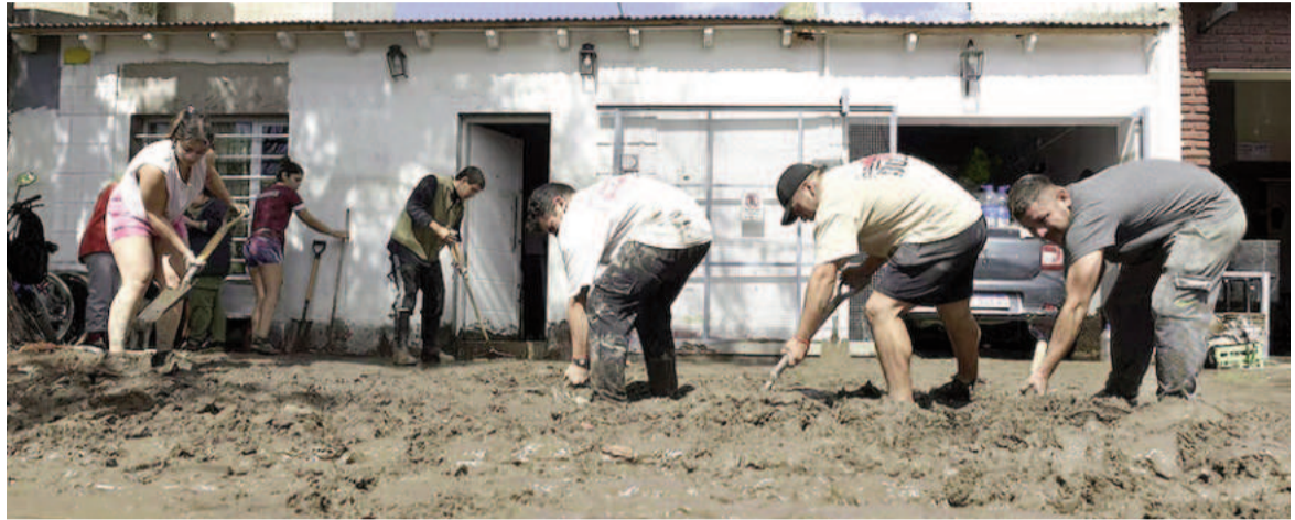
Bajó el agua, quedó el barro.

Al día siguiente, la asistencia aumentó con una mayor cantidad de