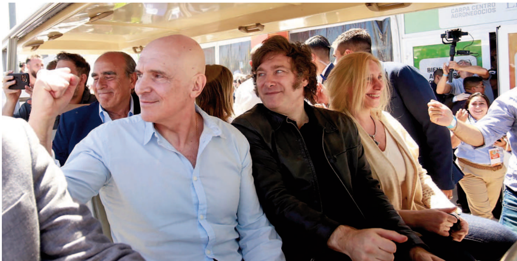
En la edición 2024 de Expoagro, Milei había visitado el Predio Ferial San Nicolás durante la primera jornada de la muestra, el 5 de marzo.

EL PRESIDENTE DE LA NACIÓN LLEGARÁ POR SEGUNDA VEZ A LA MEGAMUESTRA QUE TIENE LUGAR EN SAN NICOLÁS