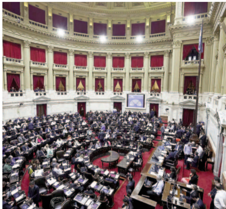
Diputados buscará consensuar un nuevo Régimen Penal Juvenil.