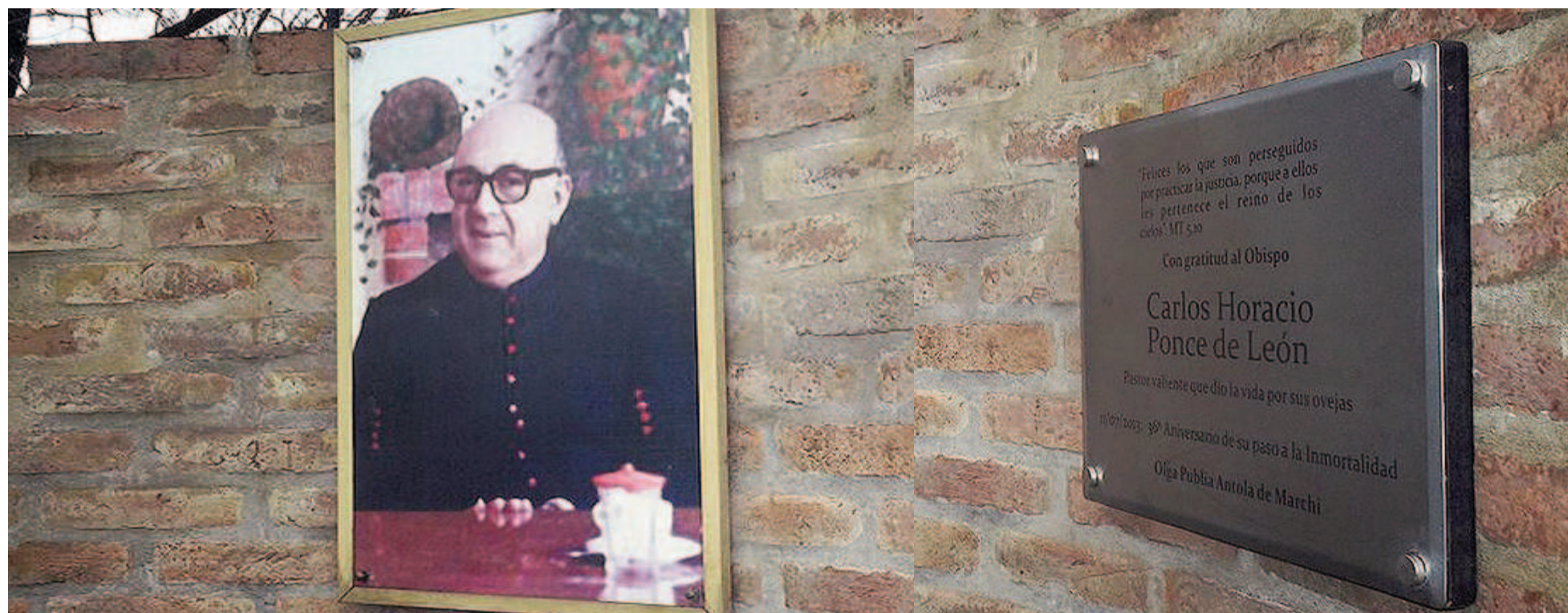
La Fiscalía Federal de San Nicolás cuestionó la dilación en el proceso que investiga el asesinato del obispo Ponce de León.

El fiscal a cargo de la instrucción cuestionó “la inacción” del juez en la causa que investiga el posible asesinato del obispo de San Nicolás, ocurrida en 1977. En febrero pasado presentó un recurso legal ante la falta de avances. La denuncia se enmarca en la demora en el proceso tras la solicitud de indagatoria a tres exmilitares y dos civiles imputados.