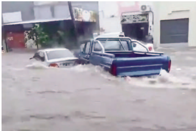
El viernes Bahía Blanca, el sábado Tucumán.

Se registró que en el Canal Sur, aunque el cauce transportaba una gran cantidad de agua,