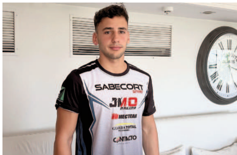
El nicoleño viajará a Norteamérica la próxima semana.