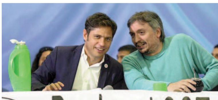
Axel Kicillof y Máximo Kirchner.

En el Instituto Patria, no piensan en hacer un apoyo explícito a la idea de quitar las primarias, pero saben que como "ya se suspendió en todos lados no hay margen para otra cosa".