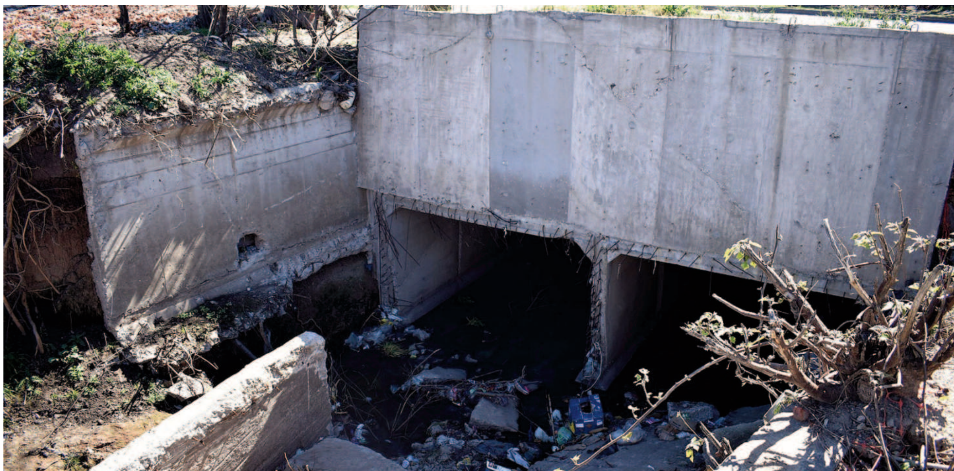
Los avances que se habían alcanzado no se concluyeron y los materiales se deterioran cuando solo resta el 10% de la obra.

LOS TRABAJOS SE INICIARON DURANTE LA GESTIÓN DE VIDAL, PERO PERMANECEN PARADOS DESDE LA ASUNCIÓN DE KICILLOF EN 2019