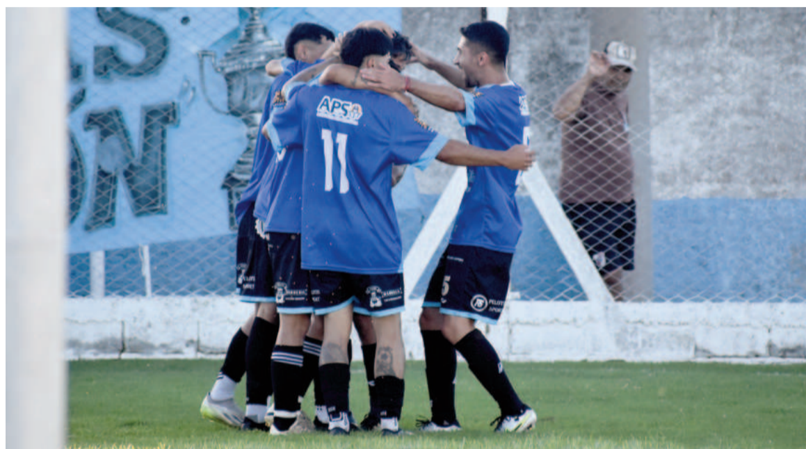
Paraná goleó a Conesa y es único escolta de Gral. Rojo. EL NORTE

El Chacarero derrotó a San Martín de Pérez Millán y es único puntero, pudiendo ser alcanzado por Regatas si derrota hoy a La Emilia. Paraná es su inmediato escolta luego de vencer por 4 a 2 a Conesa.