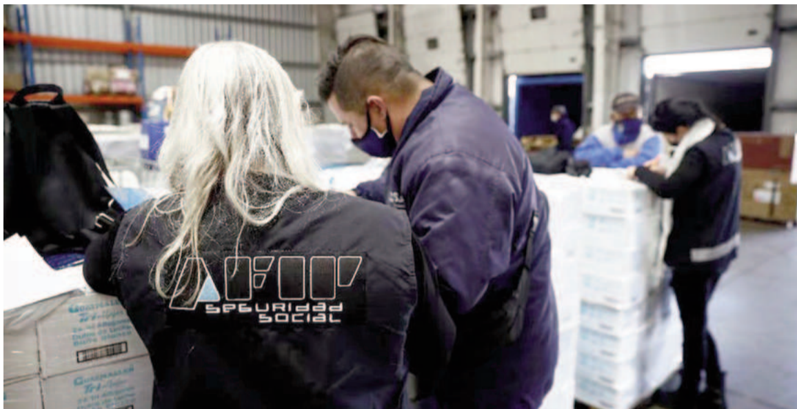
Creció la informalidad laboral.

Ese movimiento, a su vez, se manifestó en reducción en casi 178.000 en el tramo de los trabajadores asalariados (161.000 en los formalizados y 17.000 en los que no aportan al