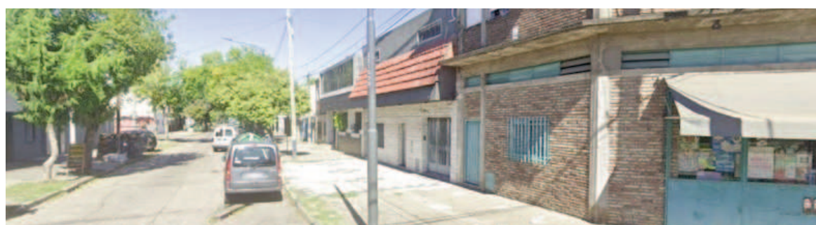
El crimen ocurrió en España al 3200, en la zona sur de Rosario.

Un hombre de 48 años fue asesinado a tiros este sábado por la tarde en España al 3200, barrio España y Hospitales, en la zona sur de Rosario. Fuentes policiales indicaron que, pasadas las 17.00, recibieron llamados de vecinos que alertaban de haber escuchado varios disparos en la vía pública y que un hombre había quedado tendido en el suelo con heridas de bala.