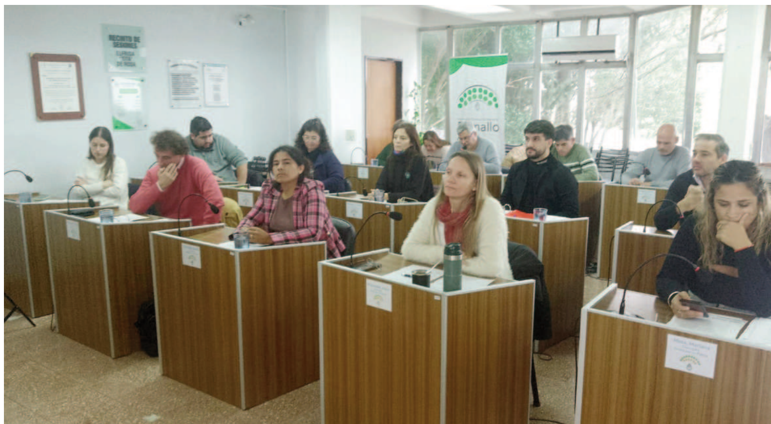
Los ediles comienzan a analizar las cuentas municipales.