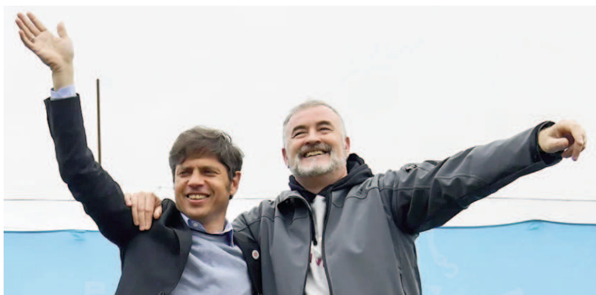
Axel Kicillof junto a Mauro Poletti.

"Desde nuestra perspectiva, la mejor solución consiste en desdoblar las elecciones provinciales y municipales de las nacionales. Esta decisión no solo permitirá ordenar el proceso electoral, sino que también garantizará que los bonaerenses puedan debatir con la profundidad necesaria los temas que definirán el destino de la provincia", expresó Poletti, en sintonía