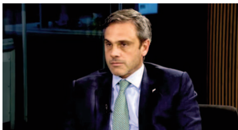
El ex director de Aduanas, Guillermo Michel.

"Podemos confirmar que la Directora Gerente tuvo una llamada