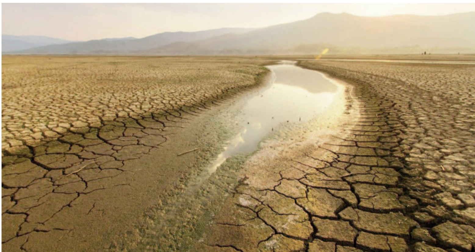
Los hallazgos indican que entre 2003 y 2016 se perdieron 1009 gigatoneladas adicionales de humedad del suelo.

Los hallazgos indican que entre 2003 y 2016 se perdieron 1009 gigatoneladas adicionales de humedad del suelo, sin signos de recuperación hasta 2021. Los científicos advierten