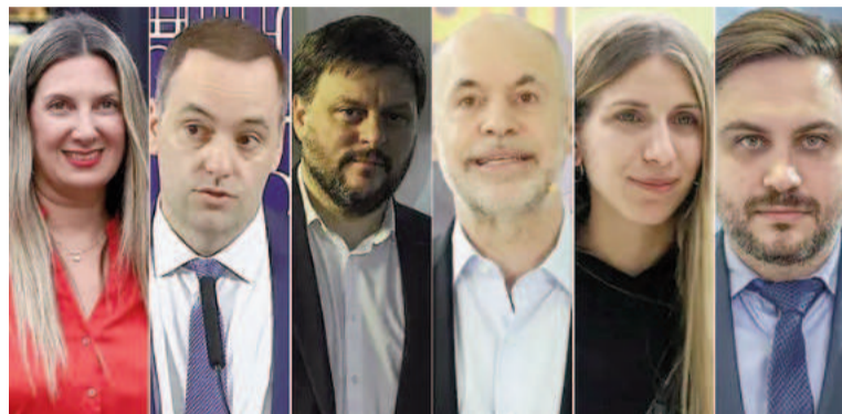
Los cabezas de listas.

A tono con la importancia de una elección que tendrá efectos colaterales, los libertarios saldrán a la cancha con una de sus principales figuras. El jueves