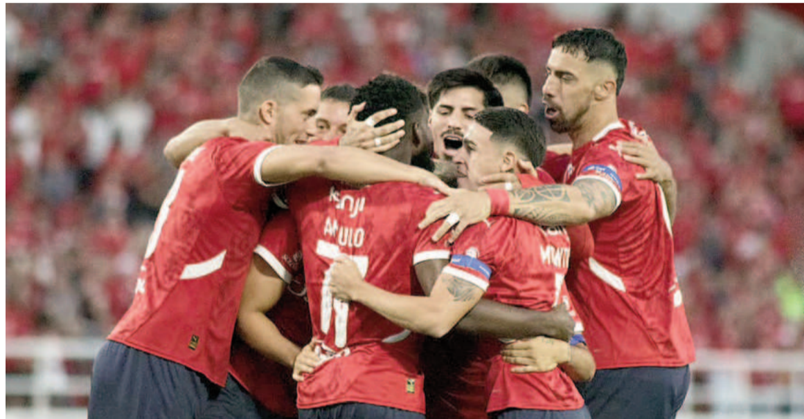
El Rojo fue una máquina y es líder de su grupo. NA

El conjunto de Avellaneda se impuso por 4 a 0 como local y quedó como único líder de la Zona B. Un doblete de Loyola, Arce y Ávalos convirtieron los goles, todos en el primer tiempo.