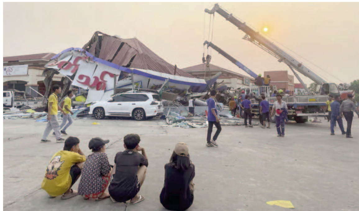
El sismo afectó a toda clase de infraestructura.

Las autoridades reportaron al menos 1600 muertos y 3400 heridos, y continúan las tareas de búsqueda y rescate. Los suministros de Londres -alimentos, agua y medicinas en su mayoría- permitirán seguir con los operativos y asistir a las víctimas.